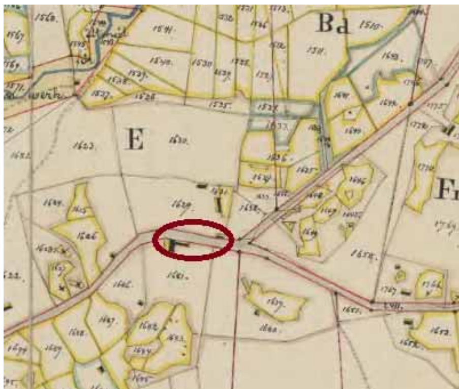
Figur 4. Kartutdrag ur Laga skifte över byn Änga från år 1880 med bebyggelselämningen Majas (V8-46:6).

Inom undersökningsområdet har tidigare ingen arkeologisk undersökning skett. I Riksantikvarieämbetets fornminnesregister FMIS uppges att platsen är 70x40 meter stor, bestående av en husgrund, en källare samt en brunn. Lämningen är registrerad som Majas och ligger på båda sidor av väg 623.