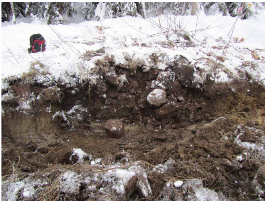
Figur 8. Spisröset inom bebyggelse lämning Majas på södra sidan av väg 623. Foto från norr.

Vid övervakningstillfället granskades även schaktningsarbetet vid två andra bebyggelse lämningar i närområdet som berördes. Bollnäs socken RAÄ 378 utgörs av två husgrunder, röjningsrösen och röjda ytor (se figur 2). Bebyggelse lämningarna kallas Hellenes eller Hell-Olles . Inget kulturlager, synliga lämningar eller fynd framkom vid schaktningsarbetet. Inga profilsnitt eller planritningar upprättades.