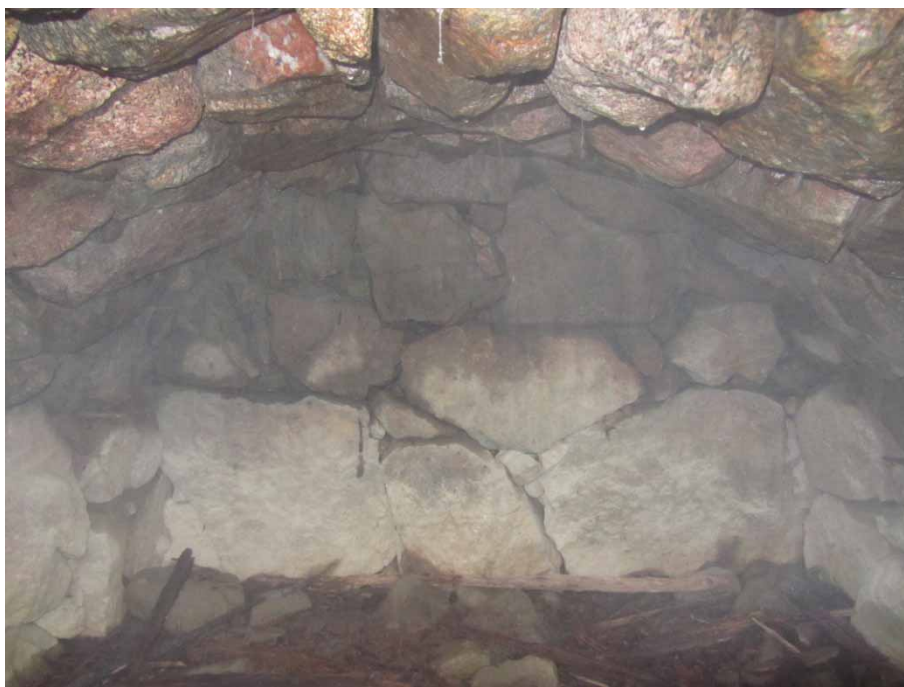
Figur 7. Jordkällarens bakre, nordöstra vägg. Foto från söder.

Jordkällarens placering förefaller ligga något längre mot väster jämfört med markeringen norr om vägen på laga skifteskartan från år 1880. Den byggnad som finns markerad söder om vägen överensstämmer med läget för det påträffade spisröset.