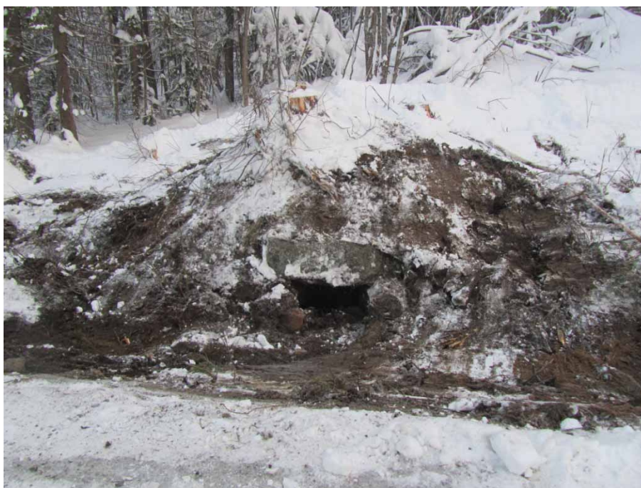
Figur 5. Jordkällaren inom bebyggelselämningen Majas vid schaktningsarbetet. Foto från söder.