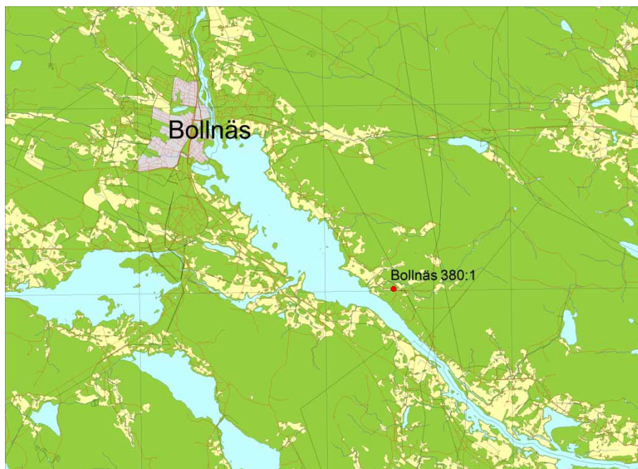
Figur 1. Utdrag ur fastighetskartan över Bollnäs kommun med platsen för schaktkontrollen markerad.