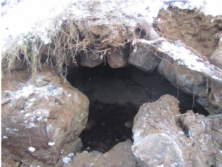
Figur 6. Jordkällarens öppning i sydväst mot väg 623. Foto från söder.