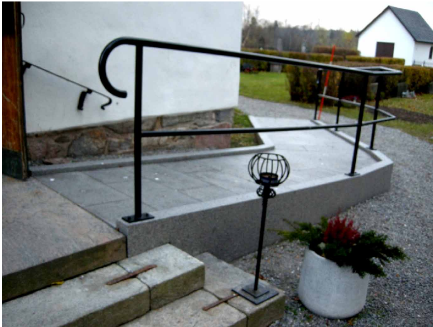
Ill. 9. Den nya rampen från nordväst. 2008-12-17.