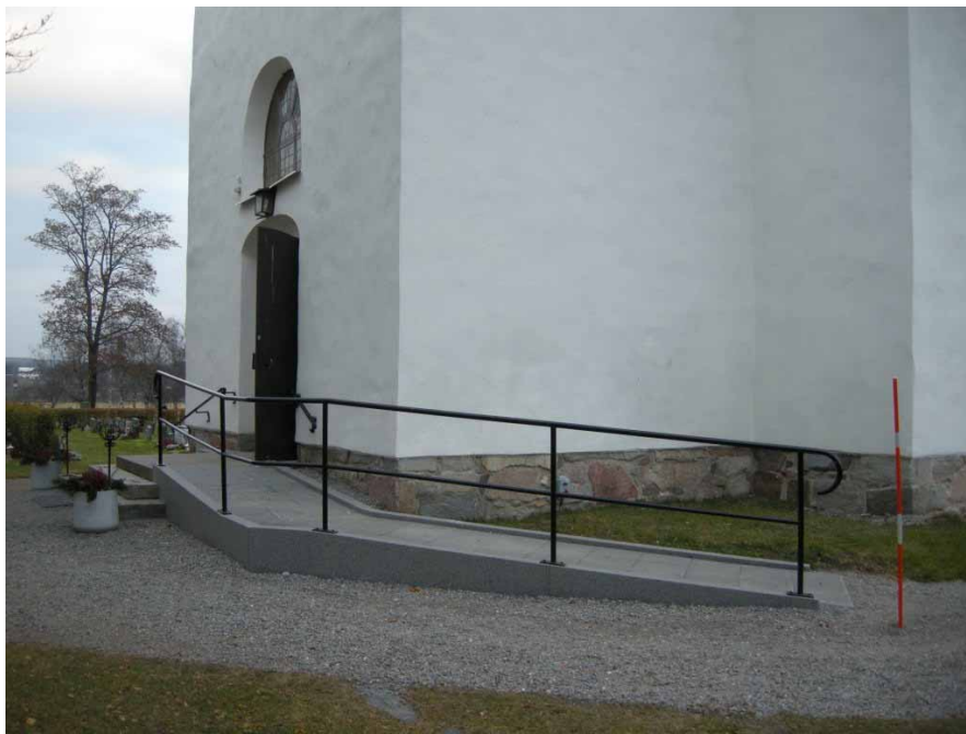
Ill. 7. Rampen från sydväst efter att räcket hade satts upp. 2009-11-03.