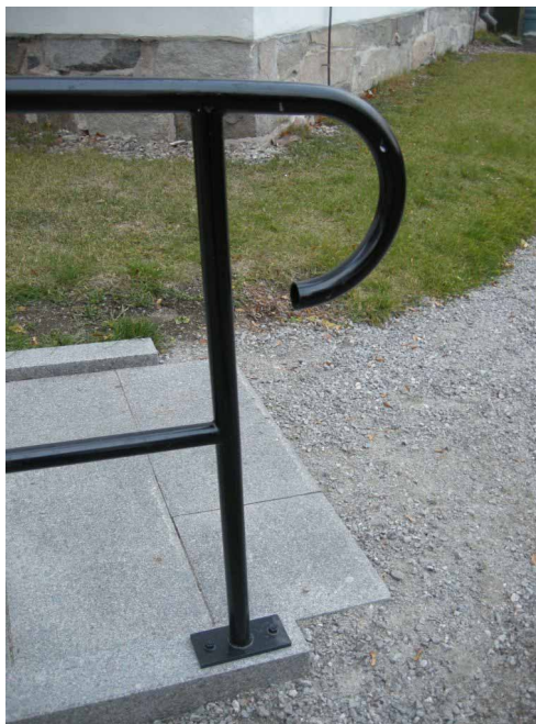
Ill. 8. Detalj av räcket avslutning.

Vid slutbesiktningen beslöts att handledarna som sitter uppsatta på var sida huvudentrén på kyrktornets västra fasad tills vidare ska få sitta kvar, trots att de sedan stentrappan flyttades ut respektive ersattes av ramp, inte har någon funktion längre. Ett borttagande skulle innebära att hålen på väggen måste lagas och då ansåg församlingen att handledarna skulle få sitta kvar, vilket Läns museet inte hade något att invända emot.