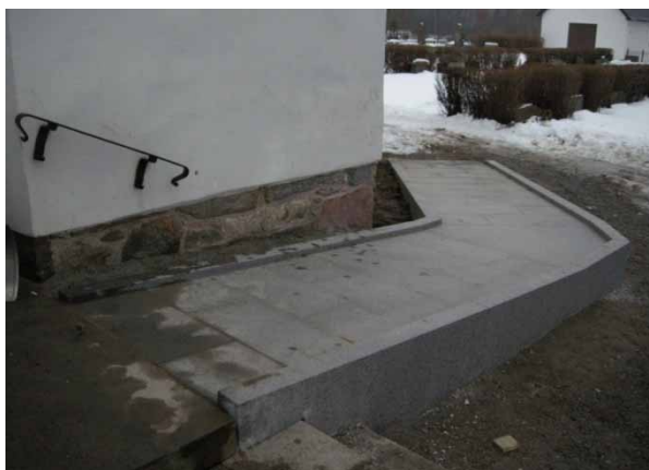
Ill. 6. Rampen från nordväst innan räcket sattes upp.

Markisolering Ecoprim, till en tjocklek av 70 mm, lades sedan ned där rampen skulle anläggas och på denna göts betongsulor under rampens blivande sidor. På betongsulorna har nytillverkade sågade granitblock av 120 mm bredd och flammad yta på utsidan placerats. Blocken sattes fast med stålstag. Mellan dessa granitsidor har fyllningsmaterial av bergkross packats väl och på detta en gjutning med betong, sättbruk och slutligen gångbanchällar av samma slags granit som rampens sidor. Dessa sidor skjuter upp en aning över rampens gångytor för att skapa ett avåkningsskydd. På rampens utsida har under 2009 ett järnräcke av rundstång av järn satts upp. Räcket avslutas med en rund nedåtböjd form. Räcket har avfärgats i helt svart kulör. Se mer om räcket under antikvariska ställningstaganden nedan.