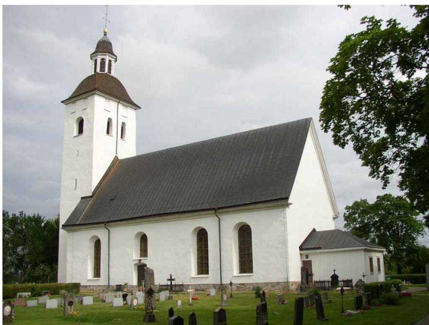
Ill. 2. Hälsingtuna kyrka från sydost. 2007-07-06.