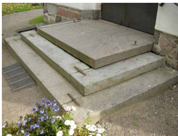
Ill. 4. Detalj av stentrappan från sydväst före ombyggnaden.

Vissa stenplattor i gången mot kyrkogårdens västra entré var vittrade. Gången har därför fått läggas om vid ett flertal tillfällen, vilket fått till följd att gången inte längre når ända fram till trappan, vilket den ursprungligen gjorde.