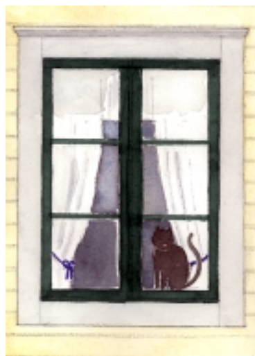
Under 1800-talet utökades färgskalan med gråvitt, rosa och grönt. Fönstren målades ofta mahognybruna eller mörkgröna.

Reservdelar till gamla hus, Centrum för Byggnadsvård 1999