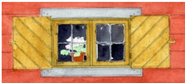
Under 1700-talet användes inte så många olika sorters pigment. Kimrök och ochragult var vanligt, och efterhand rödfärgades fasaderna.

Plastfärg förenas inte med underlaget. Den bildar istället en hinna ovanpå, som måste tas bort innan man kan måla med linoljefärg. Det bästa är att försöka handskrapa bort färgen med vass skrapa. Går inte det, och plastfärgen är målad ovanpå äldre linoljefärgslager, kan man använda infravärme. Den underliggande oljefärgen mjuknar av värmen och plastfärgen kan skrapas bort. Arbetet med infravärme är dock förenat med viss brandrisk, så var noga med att följa instruktionerna. Det finns också kemiska medel som tar bort plastfärg, men dessa bör undvikas eftersom risken är stor att medlet även skadar träet.