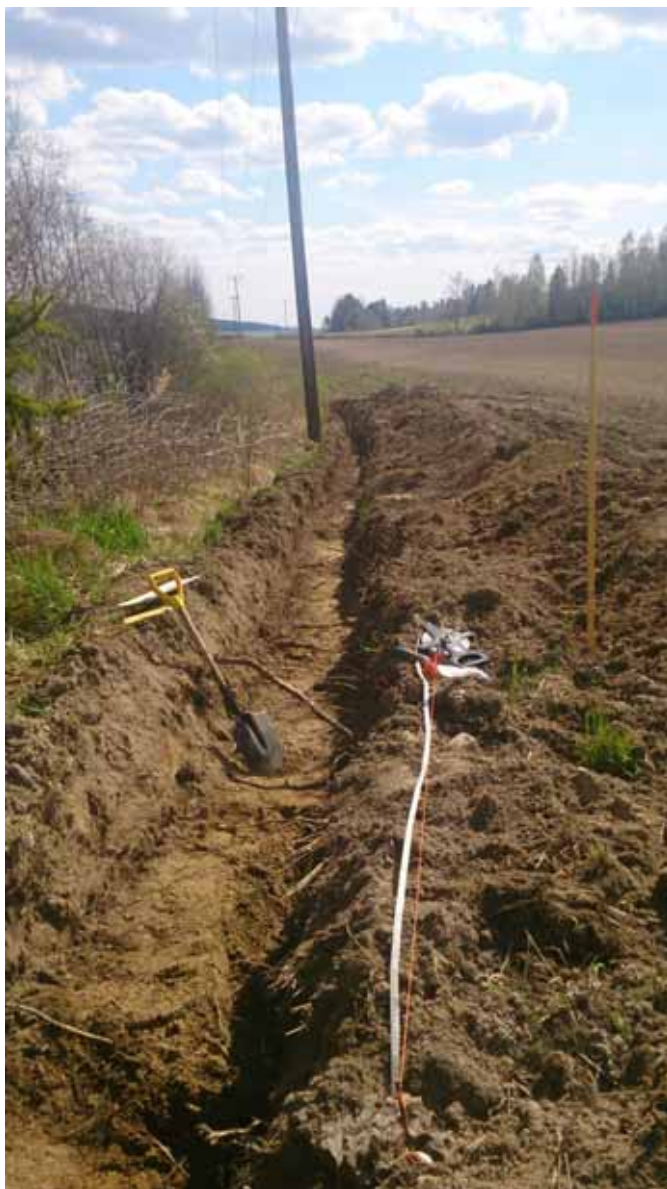
Figur 7. Södra delen av schaktet. Bilden är tagen från norr.