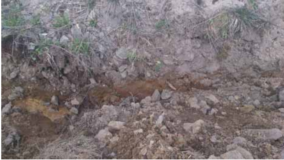
Figur 5. Sektion från norra delen av schaktet. Bilden är tagen från söder.