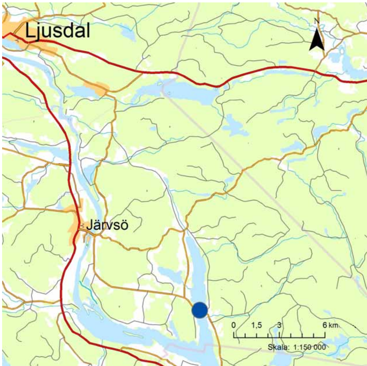
Figur 1. Utdrag från digitala översiktskartan. Undersökningsområdet är markerat med blått.