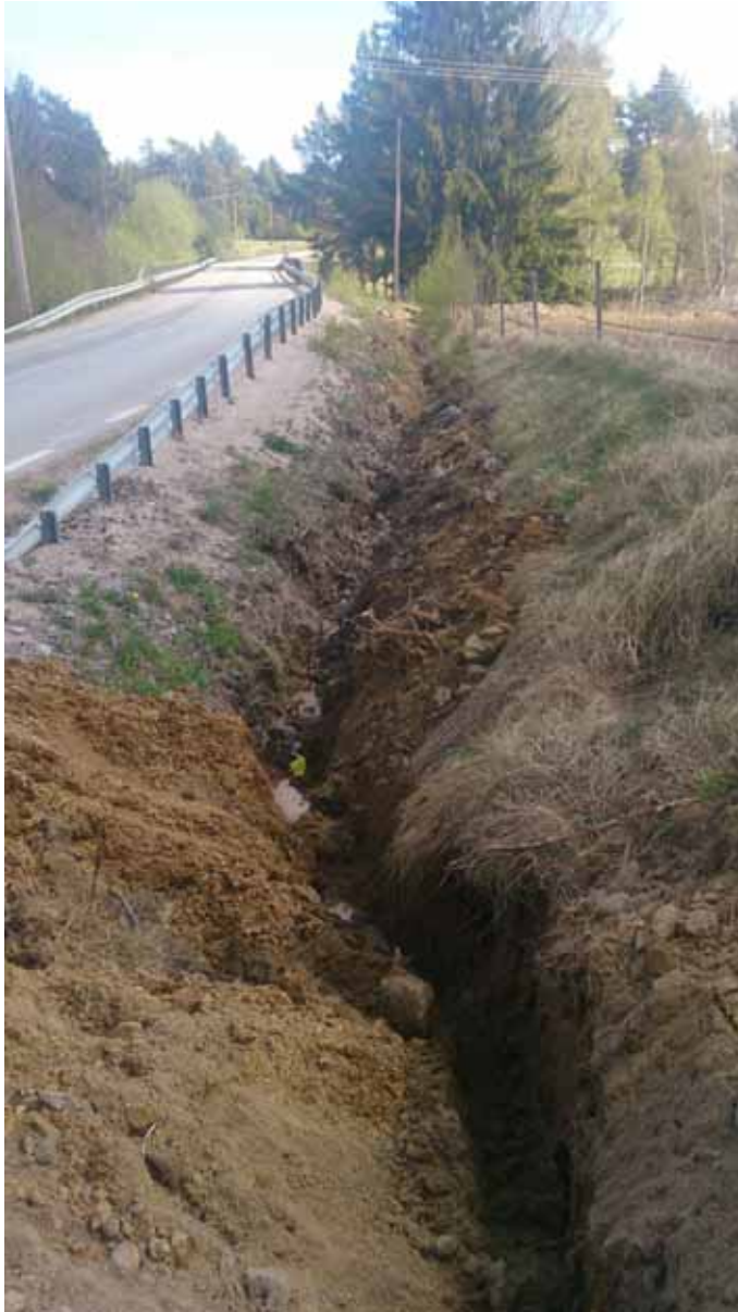
Figur 4. Norra delen av schaktet parallellt med vägen. Bilden är tagen från väster.

kabeldragning. Schaktets övre del bestod av 0,50–0,60 meter tjock brun matjord som övergick i gråbrun fin mo/mjäla. I det övre lagret med matjord framkom slagg och recent tegel. Slaggen låg spridd i åkerns och schaktets ploglager och kunde därför inte knytas till någon anläggning eller kulturlager. Denna del av schaktet låg inte inom den registrerade ytan för järnframställningsplatsen RAÄ 292:1. I schaktet framkom inga anläggningar, kulturlager eller övriga fynd.