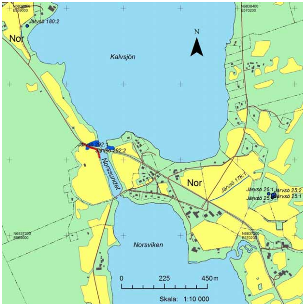
Figur 2. Undersökningsområdet är markerat med rött, omkringliggande forn- och kulturlämningar med blått.