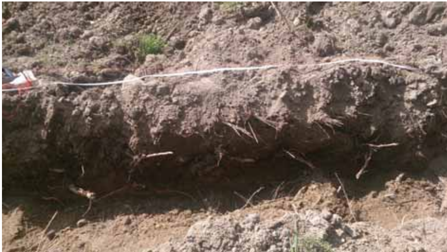
Figur 6. Foto av den del av sektionen som dokumenterades genom ritning. Södra delen av schaktet. Bilden är tagen från öster.