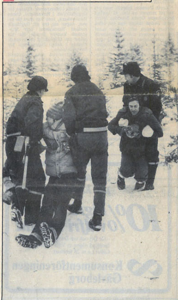
Länspolischefen var nöjd över att aktionen kunde genomföras utan intermezzo, men hade helst sett att demonstranterna flyttat på sig själva och inte behövt komma under lagens arm.