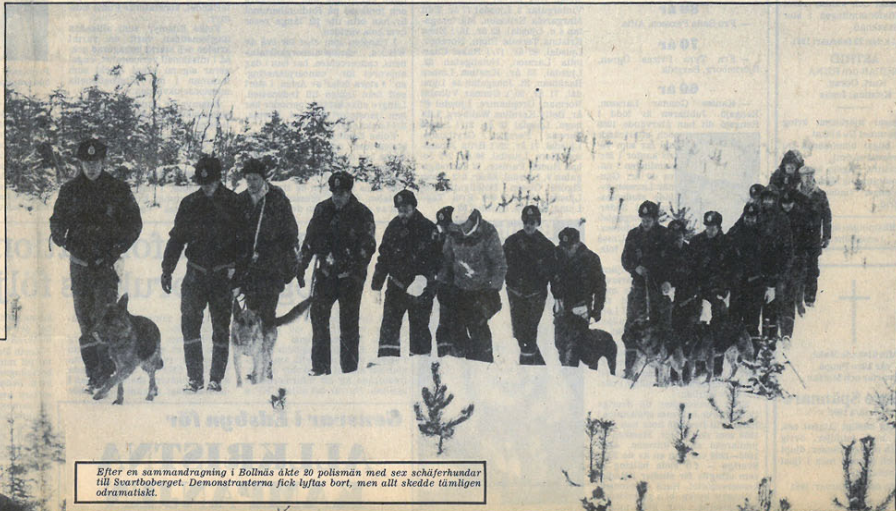
Efter en sammandragning i Bolnäs åkte 20 polismän med sex schäferhundar till Svartboberget. Demonstranterna fick luftas bort, men allt skedde tåmligen odramatiskt.

Passivt motstånd och kamp-sånger på Svartboberget