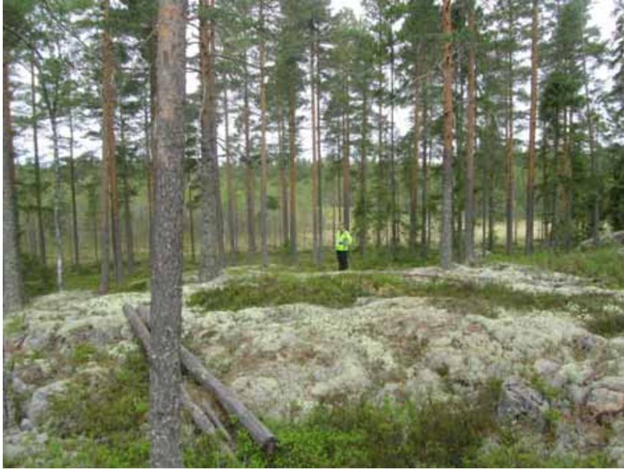
Bild 3. Fältbesiktning vid Lappkojberget, Torsåker.