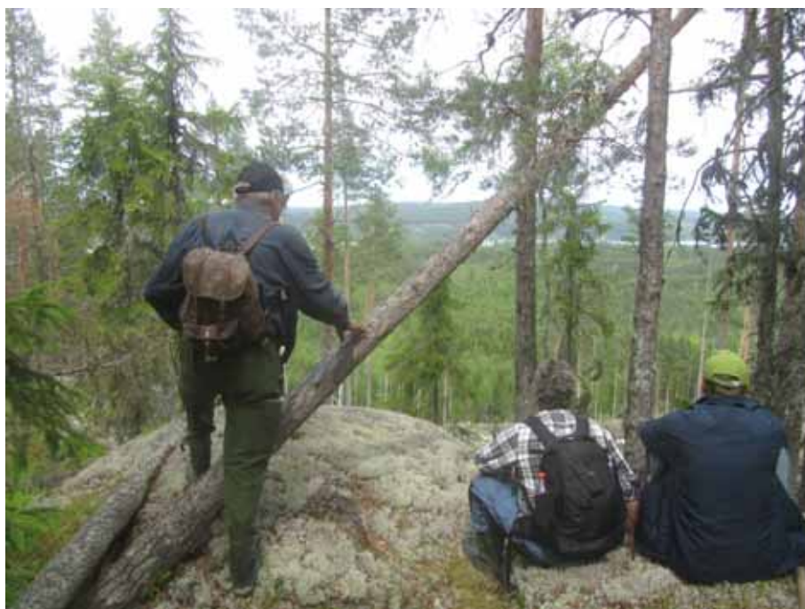
Bild 14. Rast vid besiktning av tips om renbetesplats i Arbrå.

Arbetet med Ohtsedidh innebär att den nu påbörjade kartläggningen kan fortsätta och att Läns museet vidare kan bearbeta de tips som inkommit under projektperioden.