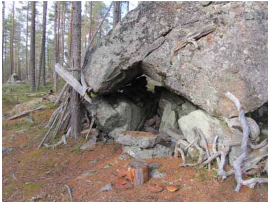
Bild 11. Den s.k. Lappkyrkan i Strömbacka. Ett av skyltobjekten.

Hohällan. Ovan sjö socken, Sandvikens kommun. Traditionsnedteckningar om samisk bosättning. Naturreservat.