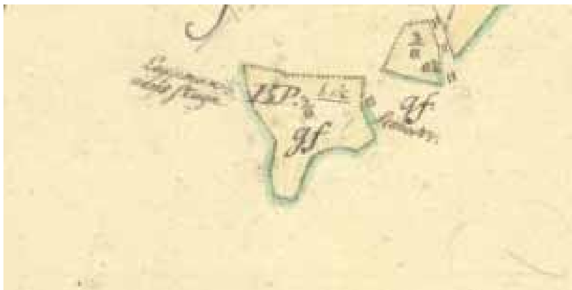
Den aktuella bebyggelsen redovisad på en karta över nybruk i Stene by år 1806.

Den samiska befolkningen i Hälsingland har ingen egen skriven historia, och inte heller finns några äldre etnologiska beskrivningar över deras levnadssätt. När sockenlappar och andra samer förekommer i hembygdsskildringar osv är det alltid i förbigående, och ur ett utifrånperspektiv. Detta projekt är ett försök att med arkeologins hjälp fylla några av kunskapsluckorna. Tanken är att undersöka i vad mån de fysiska spåren i landskapet kan komplettera skriftligt arkivmaterial, för att på så sätt få mer kunskap om en förgången minoritetsgrupp.