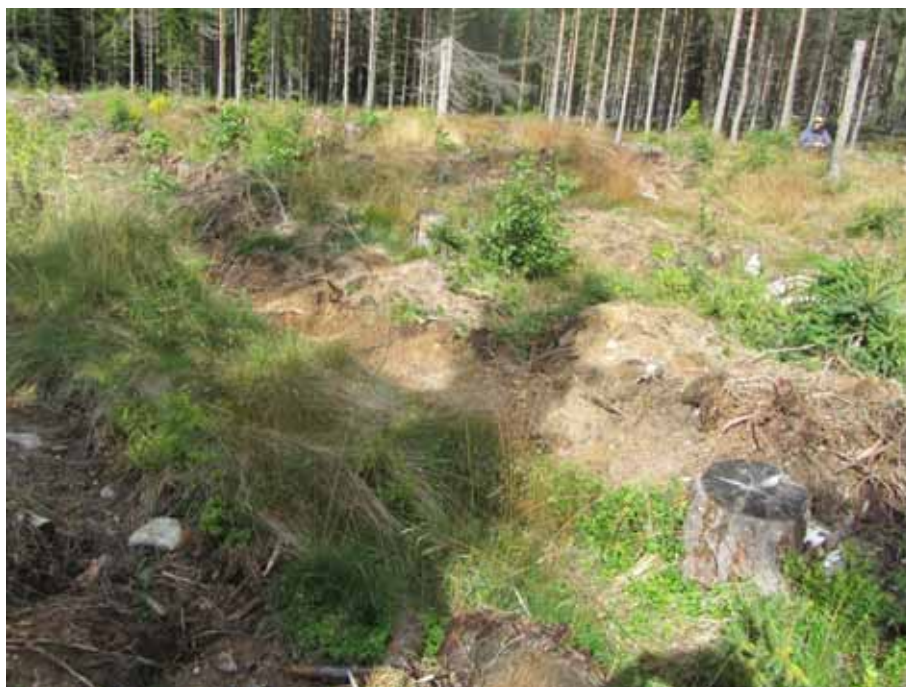
Bild 10. Djupa markberedningsspår vid Lappstugan, ett sockenlappsboställe i Undersvik (lämning 15).

Bland de lämningar som granskats i fält men som inte resulterat i registreringar är också flera platser där vi ansett att traditionen är för svag eller att lämningen uppenbart inte är vad den utgetts för att vara. Det gäller t.ex. några platser med utpekade ”seitar” och ”boställen”.