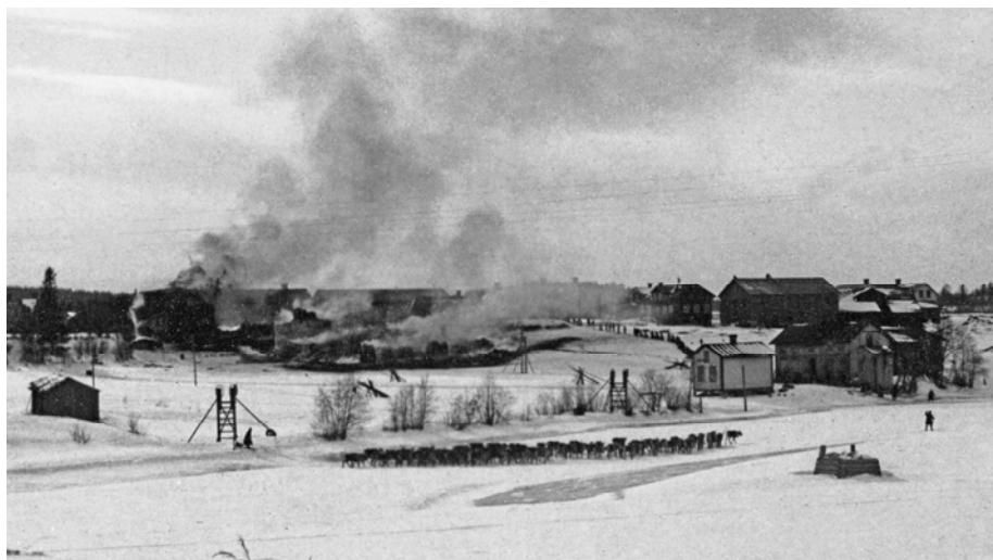
Bild 2. Den samiska historien skildras ofta i förbigående. Här har en storbrand i Bergsjö fotograferats i början av 1900-talet, samtidigt passerar en renhjörd.

Mot bakgrund av detta måste det finnas en stor mängd samiska forn- och kulturminnen i landskapet. Samiska bosättningar och näringar har inte avsatt samma manifesta spår i landskapet som t.ex. de efter bondesamhället. Likväl finns spåren där, och risken är stor att lämningar skadas och förstörs i samband med skogsbruk och exploateringar av den enkla anledningen att vi inte känner till dem.