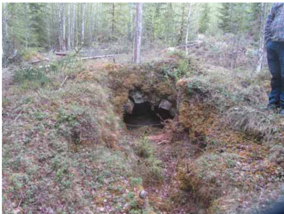
Bild 13. Källare vid sockenlappsostället i Järvsö.

En undersökningsplan har upprättats (se bilaga 3). Den arkeologiska undersökningen planeras till juni 2017