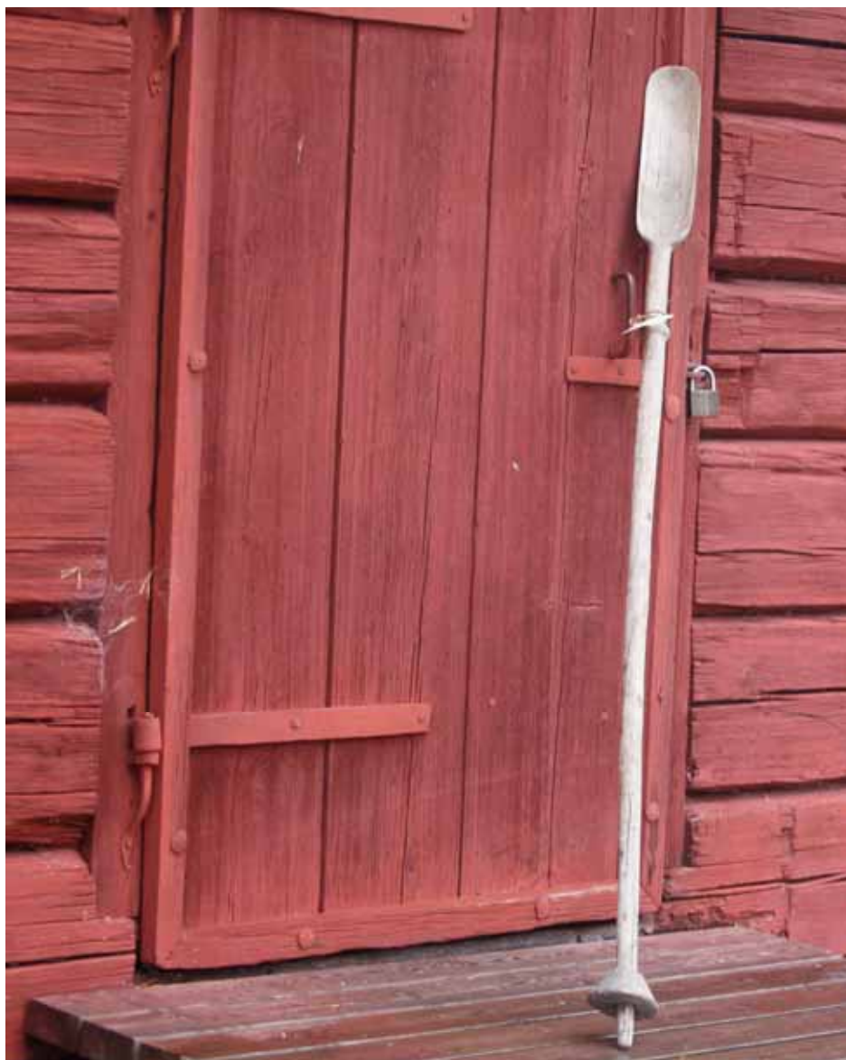
Bild 5. Ett av de tips som inkommit är denna stav som förvaras på Ockelbo hembygdsförening. Enligt märkning en "Lappstav från Lappmyrn?". På hembygdsgården finns också ett renhorn.