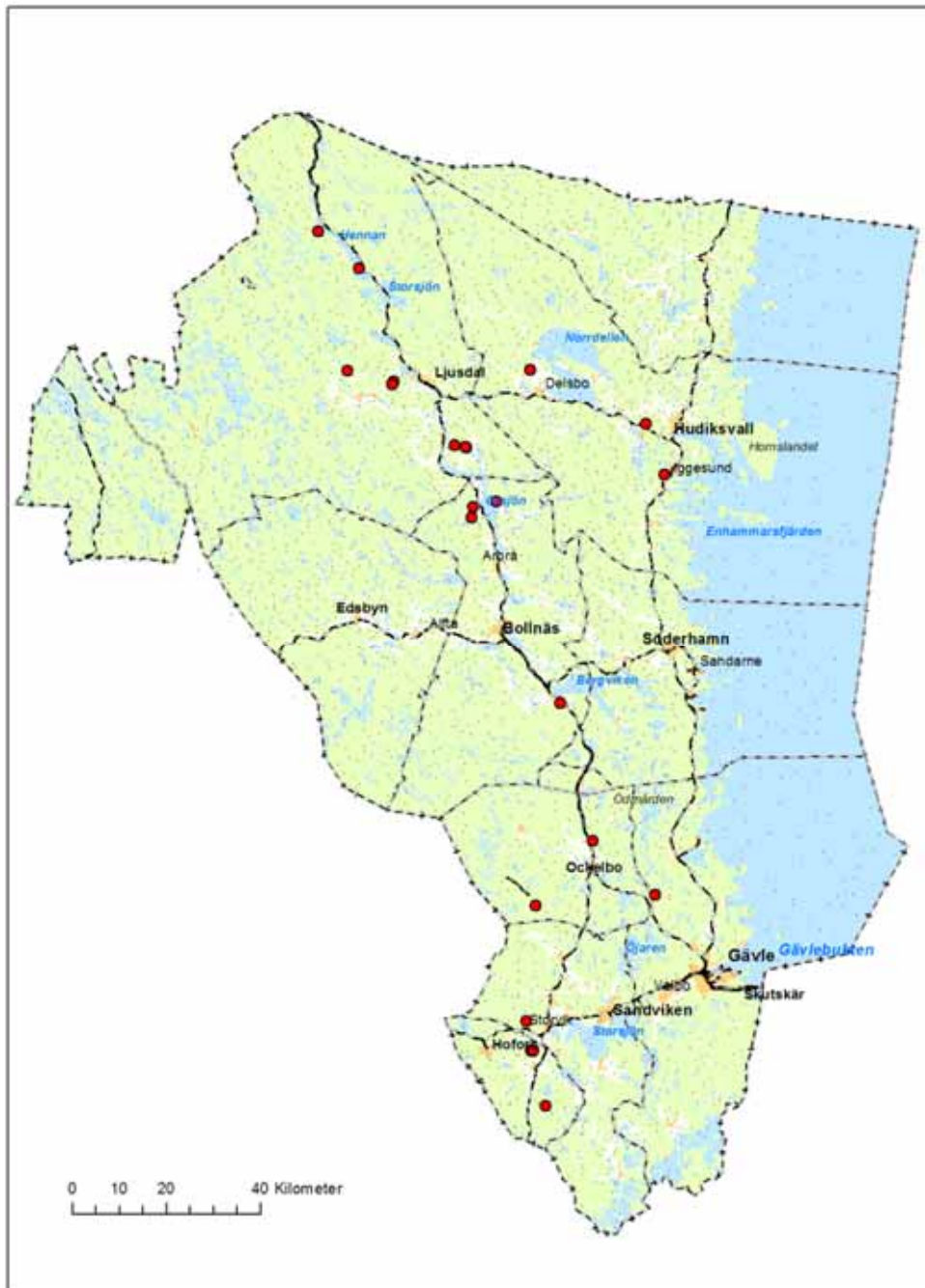
Bild 1. Länskartan med platser registrerade inom projektet. Efter digitala översiktskartan. Lantmäteriet.