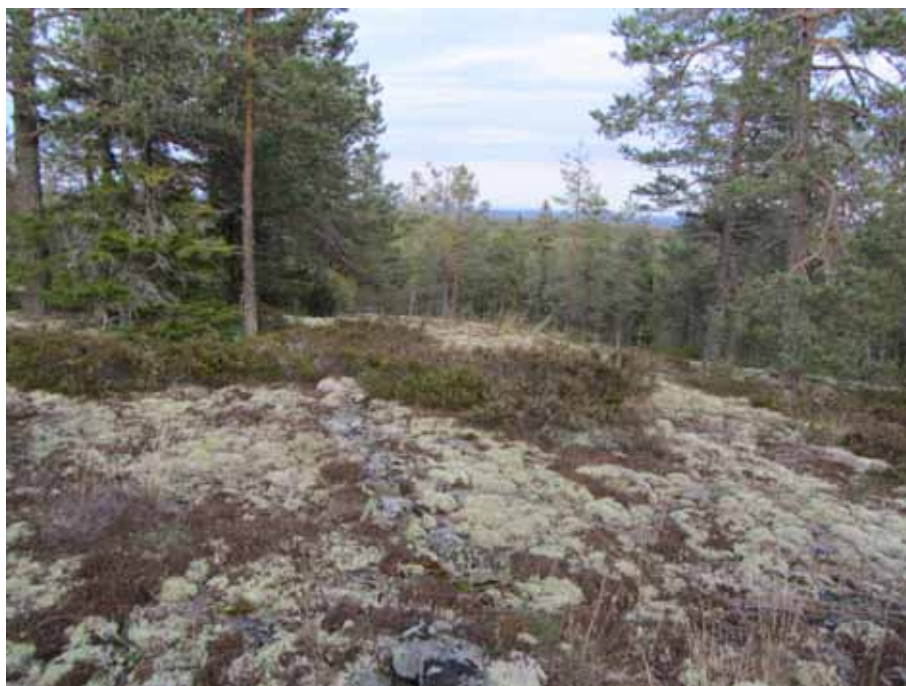
Bild 12. Stenraderna på Hällberget i Ilsbo skall enligt traditionen byggts av samer och använts för fågelfångst.