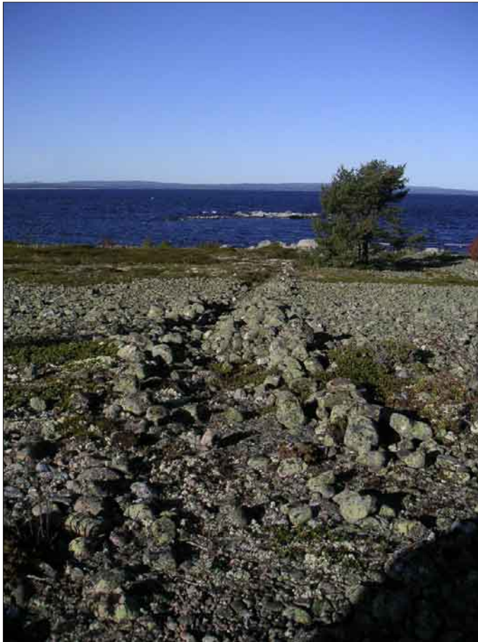
Bild 5. Skåre som består av gömsle, krypgång och sälsten. Sälstenen syns vid strandlinjen till höger om krypgången. Lämning nummer 2.