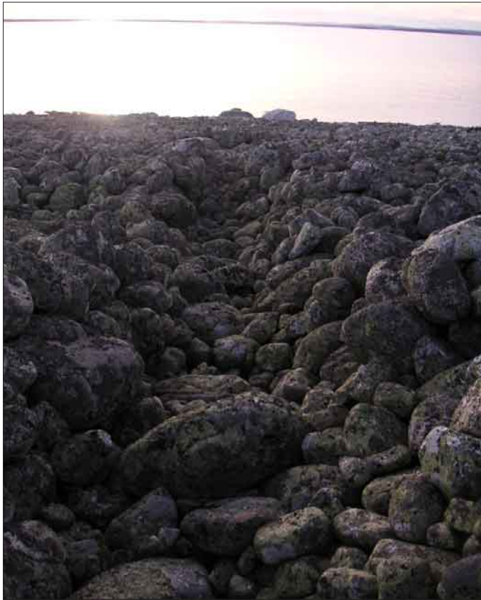
Bild 12. Skåre som består av gömsle, krypgång och sälsten. Sälstenen syns vid strandlinjen till höger om krypgången. Lämning nummer 16.