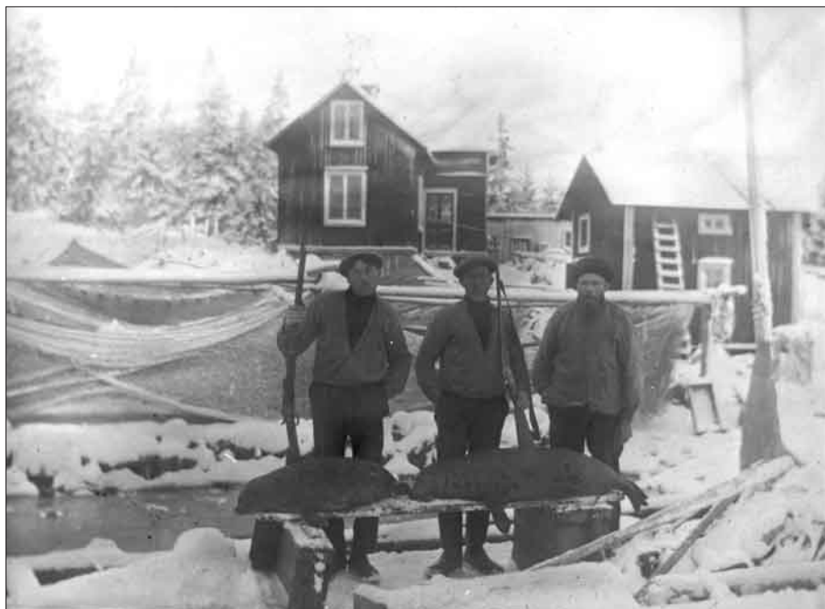
Bild 3. En lyckad säljakt i Saltvik, Idenors socken i Hälsingland omkring 1910.

att komma så nära djuret på sälstenen som möjligt och att stöta spetsen hårt i sälens kropp. Djuret klubbades sedan till döds (Broman 1945:561f). Det var också vanligt med vaktskytte från land där sälens viloplats fanns inom skott-håll. Den här typen av jakt skedde när havet var isfritt och då främst på hösten. Vid vissa viloplats förekom säljakten i stor skala och den var även tidvis skattlagd. Tidvis inträffade så kallade själslag då man klubbade stora mängder gråsäl. Gråsäl håller ihop i stora flockar och det hände att de inte nådde öppet vatten utan blev infrusna på isflak som drev mot land. De kom då att utgöra ett lätt byte för kustbefolkningen (Ekman 1983:250). I början av 1700-talet började man fånga säl med hjälp av nät vilket underlättade mycket för jägarna (Broman 1945:566).