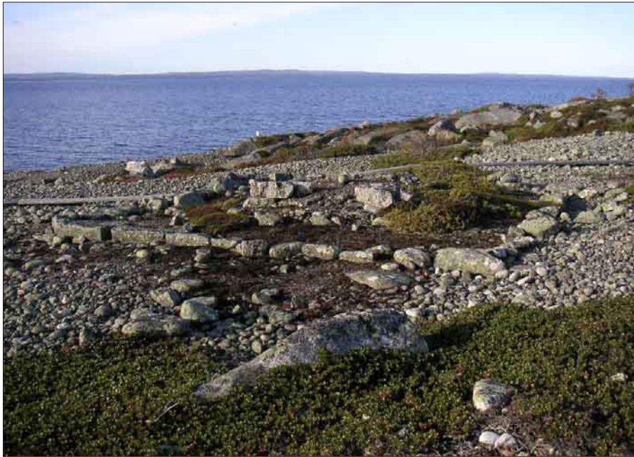
Bild 9. Husgrund. Lämning nummer 9.