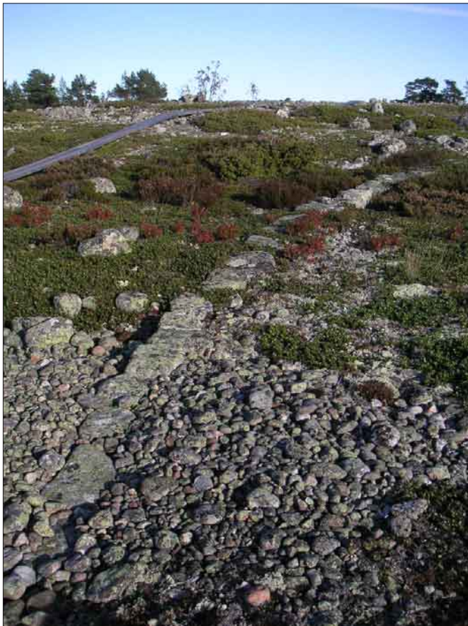
Bild 7. Cirkel av lagda stenar med okänd funktion. Lämning nummer 7.