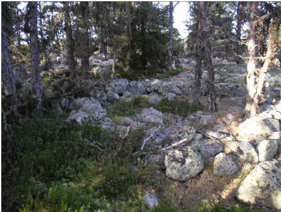
Bild 10. Tomtning i klappersten. Lämning nummer 14.