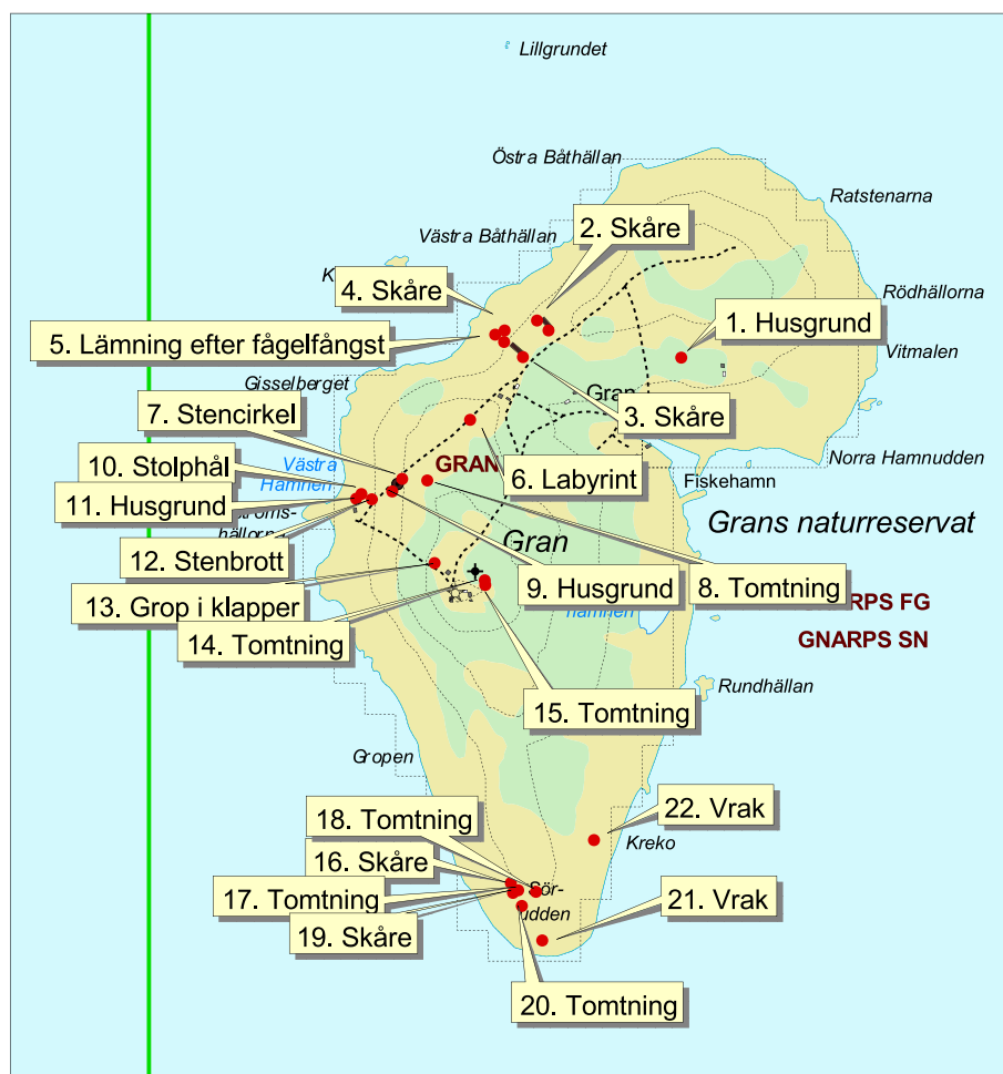
Bild 4. Registrerade lämningar på Gran.