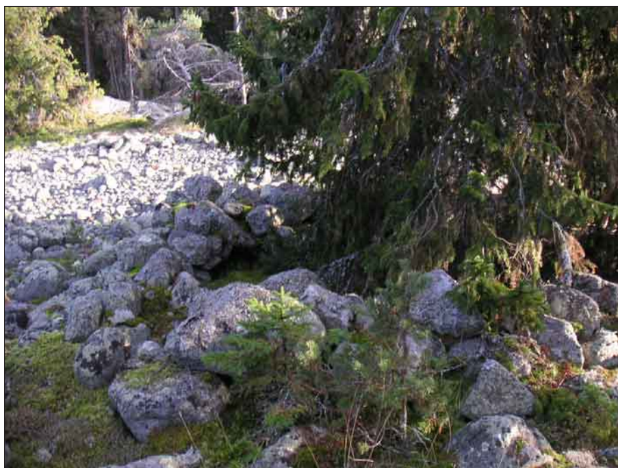
Bild 11. Tomtning i klappersten. Lämning nummer 15.