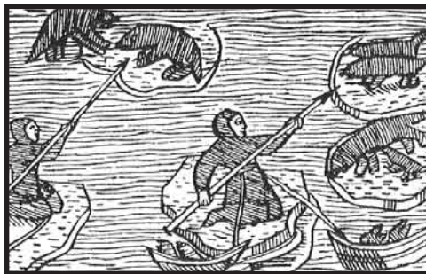
Bild 2. Säljakt i Bottenhavet. Efter Olaus Magnus, Historia om de nordiska folken , 1555, 20:4.