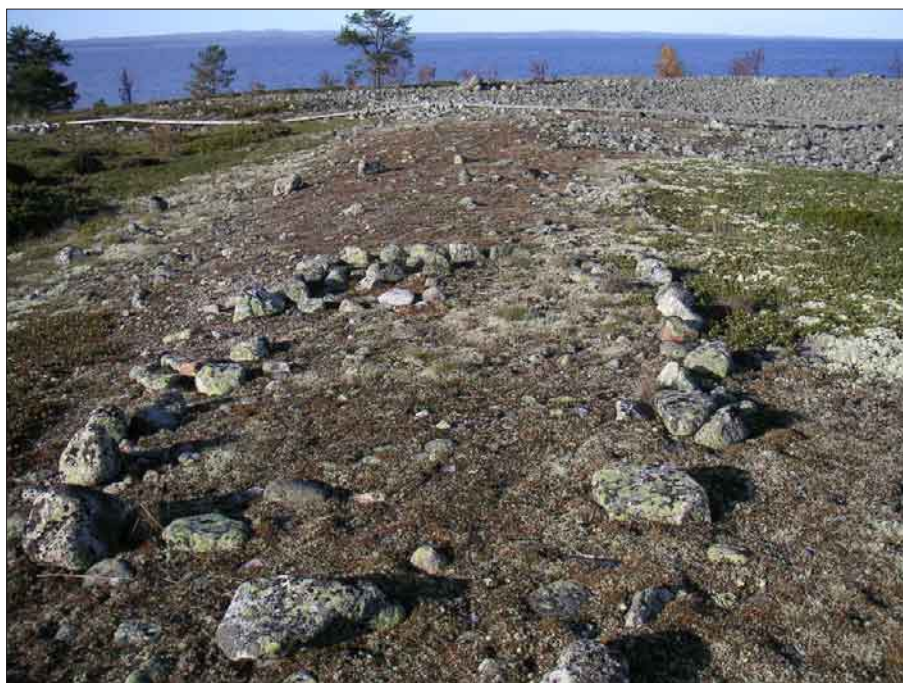
Bild 8. Tomtning i klappersten. Lämning nummer 8.