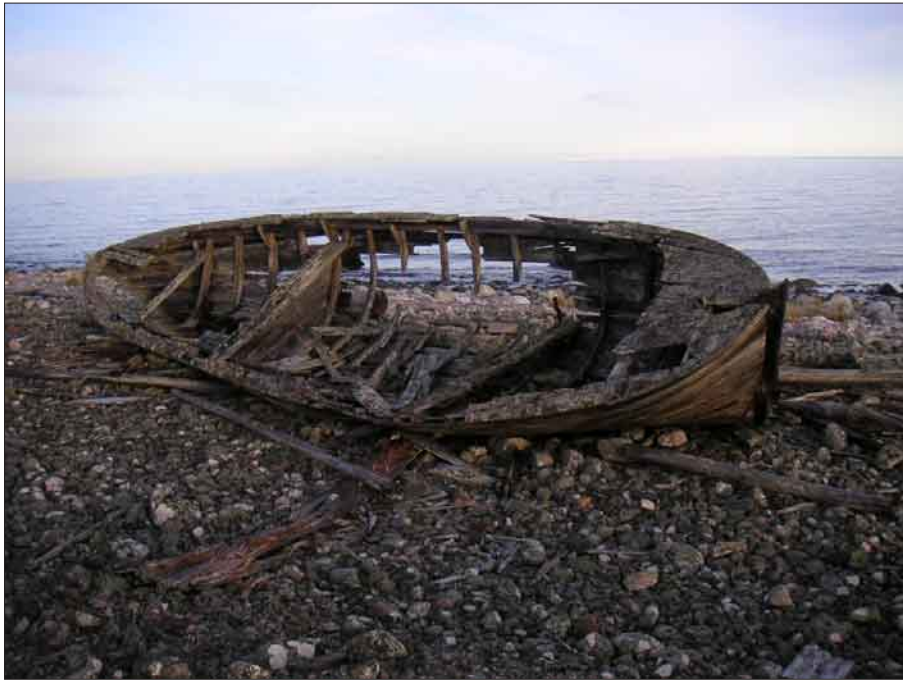
Bild 13. Båtlämning efter en trålaren Resö. Lämning nummer 21.