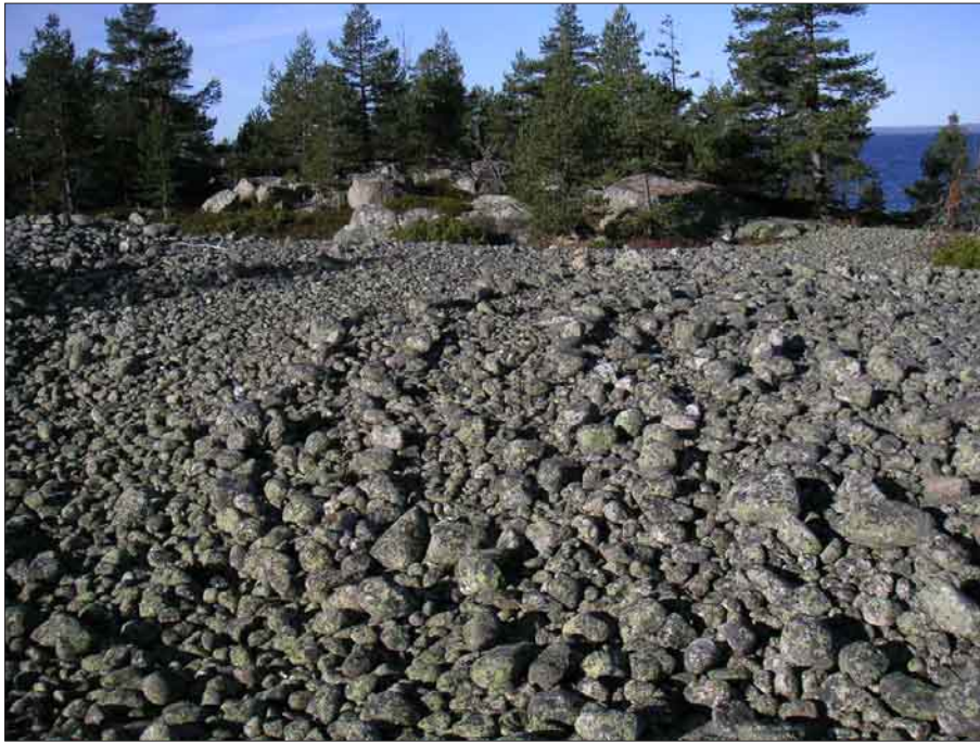
Bild 6. Labyrinten ligger i klappersten och är till stor del raserad. På bilden syns den sydvästra delen. Lämning nummer 6.