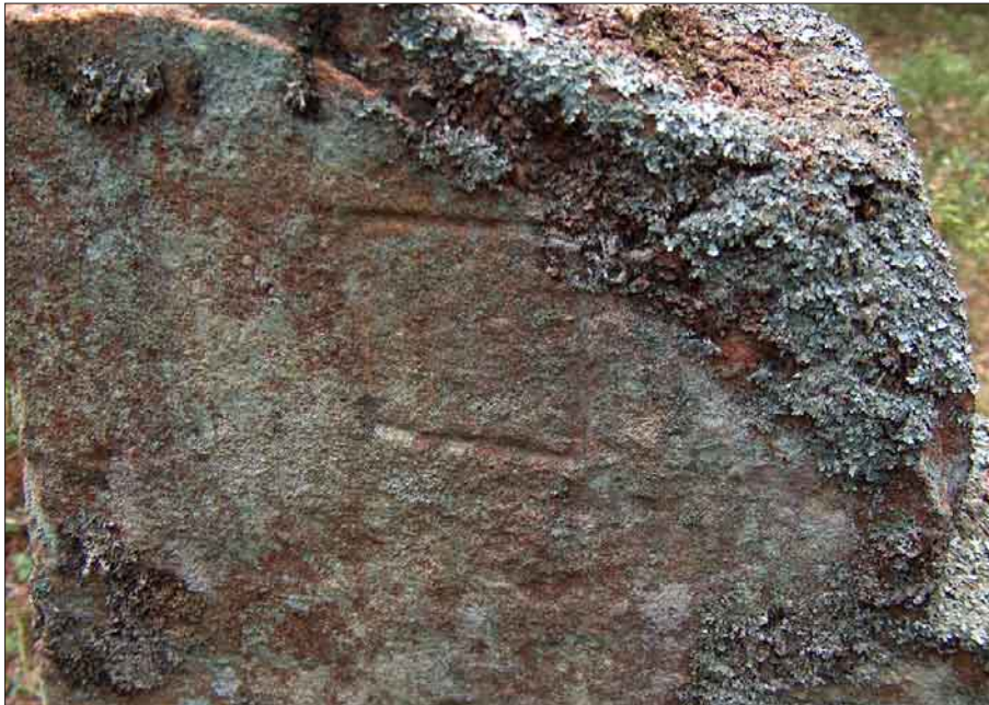
Bild 3. Objekt 10. Det inristade bomärket på visarstenen. Samma bomärke finns på gränsröset intill Klintbergska rönningen.