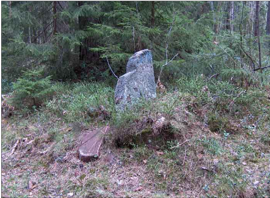
Bild 2. Gränsröset (Objekt 5). Visarstenen markerar den södra gränsen av den fastighet där Klintbergiska rönningen är belägen.