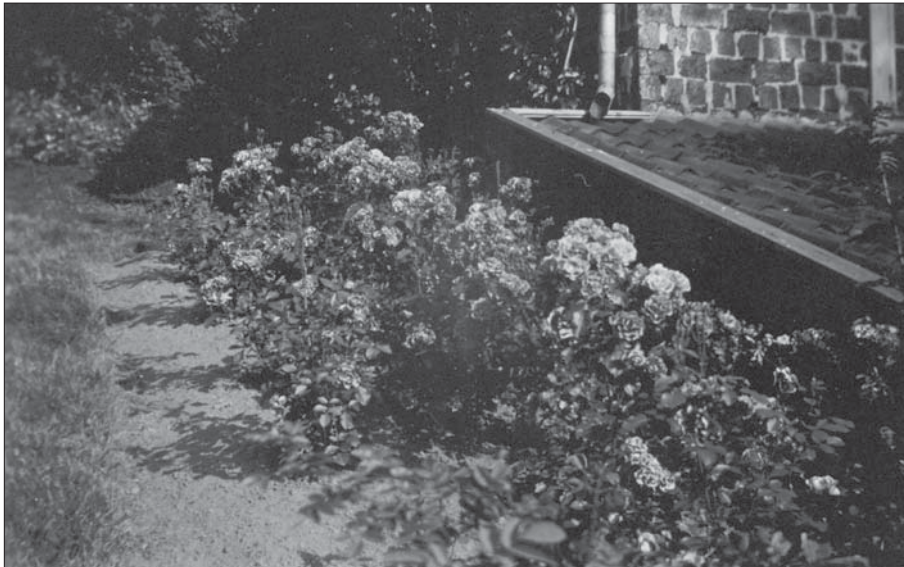
Rabatt och grusgång på den sydöstra sidan om stora uthuset. I rabatten växer troligen flox.