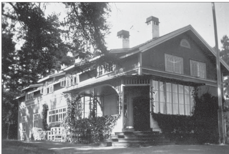
Huvudbyggnadens entré med humle som växer runt verandan och vid sydfasaden.