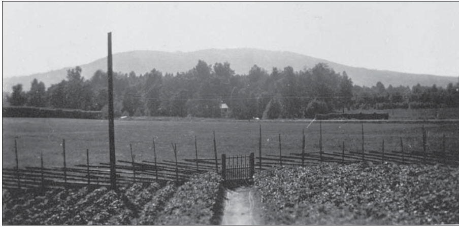
Potatisland och eventuellt köksträdgård mot sydost. Gärdesgård och grind som avgränsning mot åkermarken.