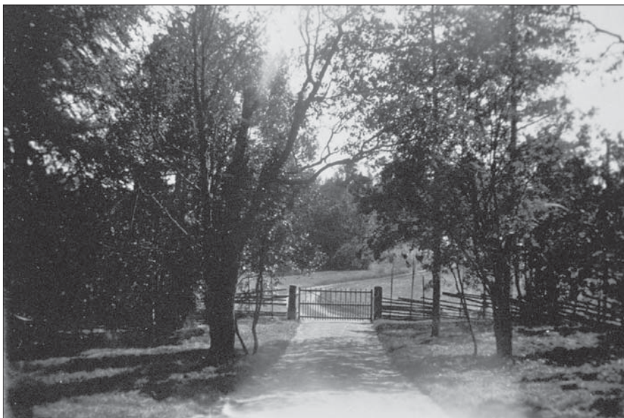
Vägen upp mot huvudbyggnaden. Tomten avgränsas av en gärdesgård och en grind.