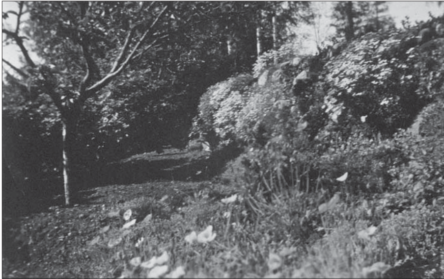
Den östra backen, nedanför stenvallen ,sibirisk vallmo och andra stenpartiväxter.