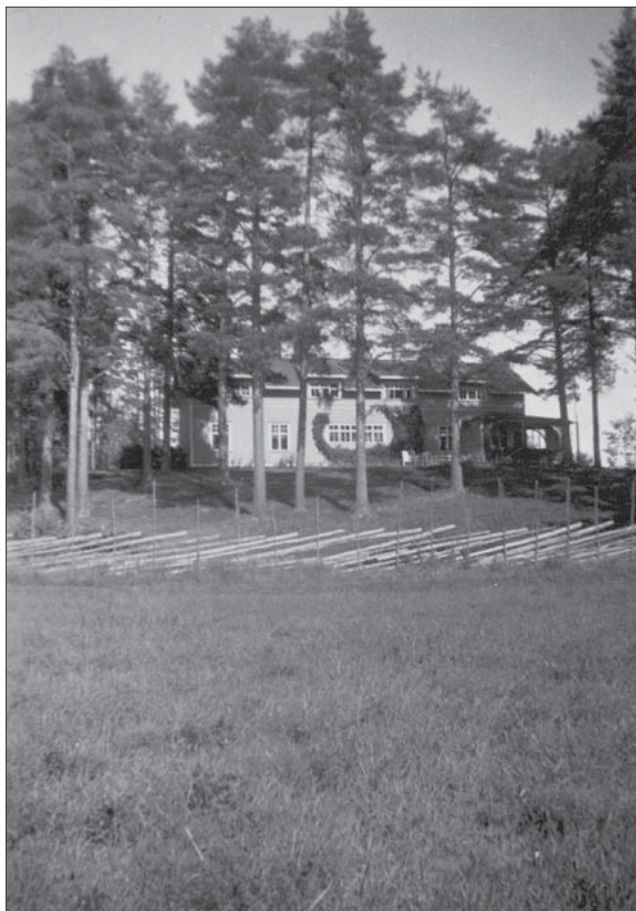
Tallbo, med huvudbyggnaden bland tallarna, från söder.