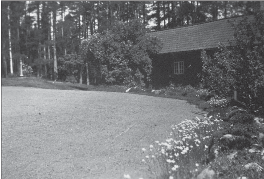
Grusplanen mellan huvudbyggnaden och det stora uthuset. Till höger ser man muren planterad med stenpartiväxter.