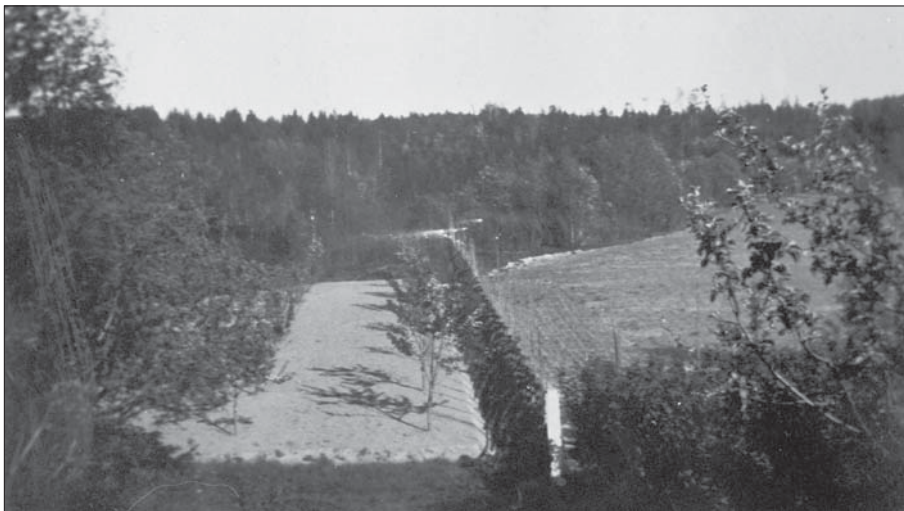
Utsikt från huvudbyggnaden mot fruktträdgården , lägg märke till den smalt klippta häcken som avgränsar trädgården mot åkermarken.