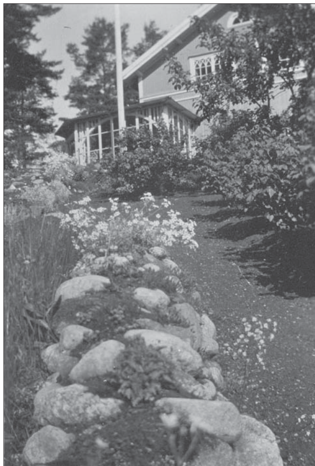
Stenmuren mellan uthuset och backen i öster.