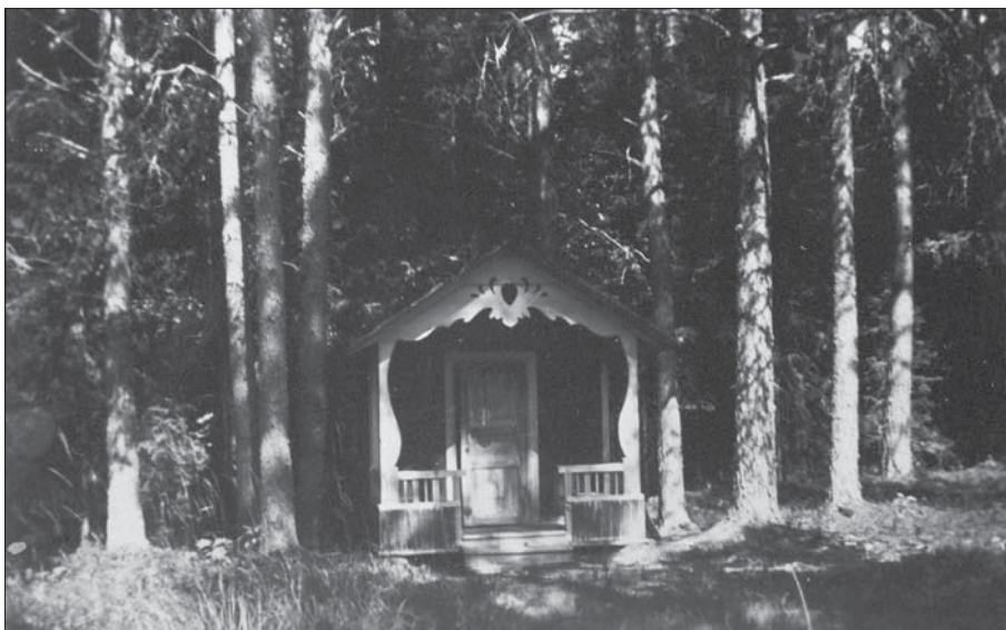
Lekstugan på sin ursprungliga plats i tallskogen väster om huvudbyggnaden.