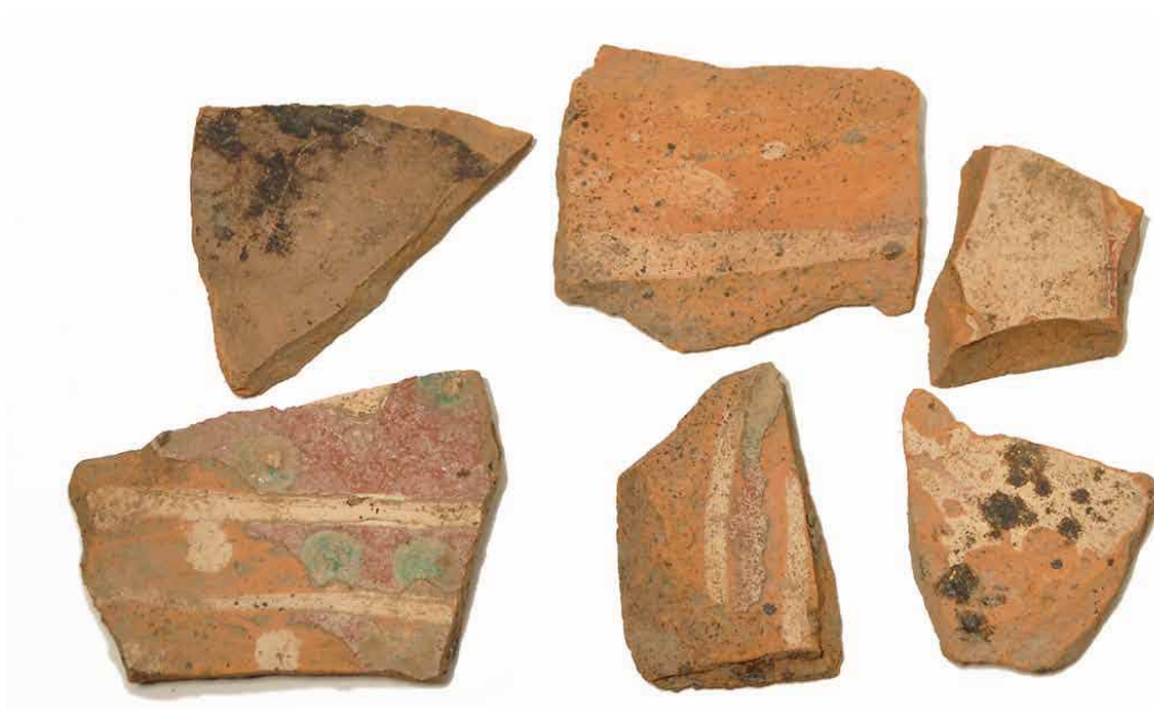
Bild 11. Skärvor av hushållskärl i rödgods som slängts i en avfallshög utanför ingången till huset i nivå 2. Keramiken härrör från tiden före branden år 1769. Skala 1:1.