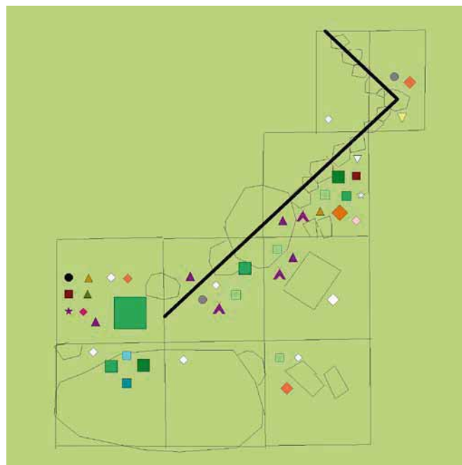
Bild 14. Fyndspridningen i nivå 2. Fyndmaterialet är i stort sett detsamma som i nivå 1, men mindre omfattande. I lagret förekom också spår av smide och järnframställning. Det kunde inte fastställas vilken historisk kontext dessa hörde till. Skala 1:50.