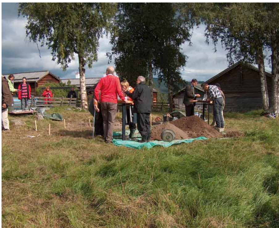
Bild 15. Under Arkeologidagen, vilken äger rum sista söndagen i augusti varje år, kom ett drygt sjuttioital besökare. Läns museet fick många tillfällen att berätta om fynden och bakgrunden till grävningen.

Information om evenemang under Arkeologidagen på Riksantikvarieämbetets hemsida.