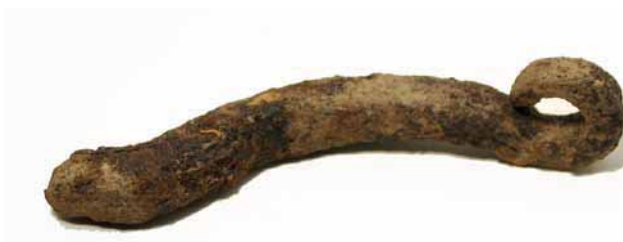
Bild 12. Del av hasp i järn. Haspen hittades ett litet stycke söder om ingången till huset i nivå 1. Haspen har gått sönder och slängts på gårdstunet. Skala 1:1.