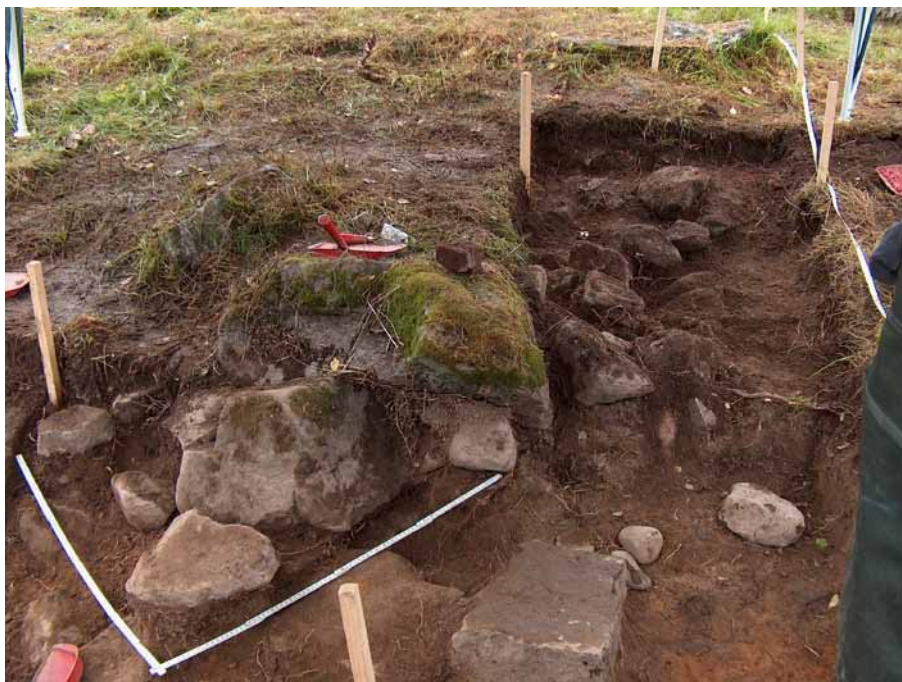
Bild 8. Schaktet från söder. Den borte änden av schaktet är nedgrävd till nivå 1, den främre till nivå 2. På bilden syns den stenrad i nordöst-sydvästlig riktning som tolkades som en enklare syll till en byggnad. Längst ned i bild syns trappstenen till samma byggnad.

lämningarna vilka ingick i den kringbyggda konstruktionen, orienterad i öst-väst. Denna nivå var cirka 0,2 m djup. Under grässvålen och matjorden vidtog ett fyndförande lager innehållande vitt, brunt och blått flaskglas, porslin, fajans, yngre rödgods, obrända djurben, fragment av dörrbeslag i järn, spik, slagg från järnframställning och smide samt stora volymer fragmenterat tegel och ljusgrönt fönsterglas. Detta lager daterades utifrån fynden till sent 1700-tal samt tidigt 1800-tal. Det påträffades även ganska stora mängder mycket hårt bränt tegel.