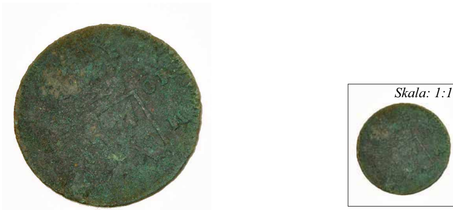
Bild 9. Myntet från Fredrik I:s regeringsperiod som hittades vid trappstenen i anläggningslagret till den gård som uppfördes efter år 1769. Myntet ärpräglat omkring år 1750 vid Avesta Kopparbruk.