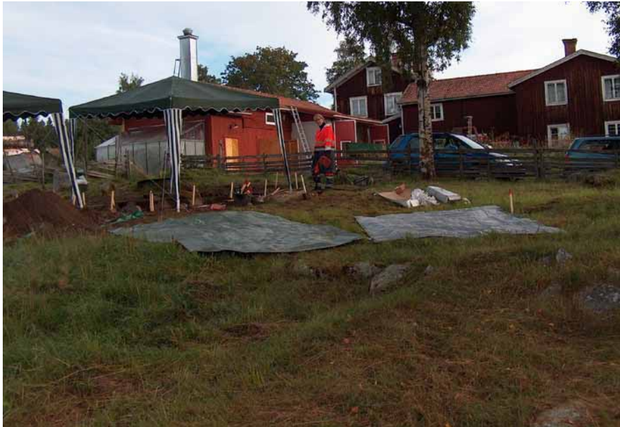
Bild 3. Fårhagen med norra delen av lämningen från sydsydost.