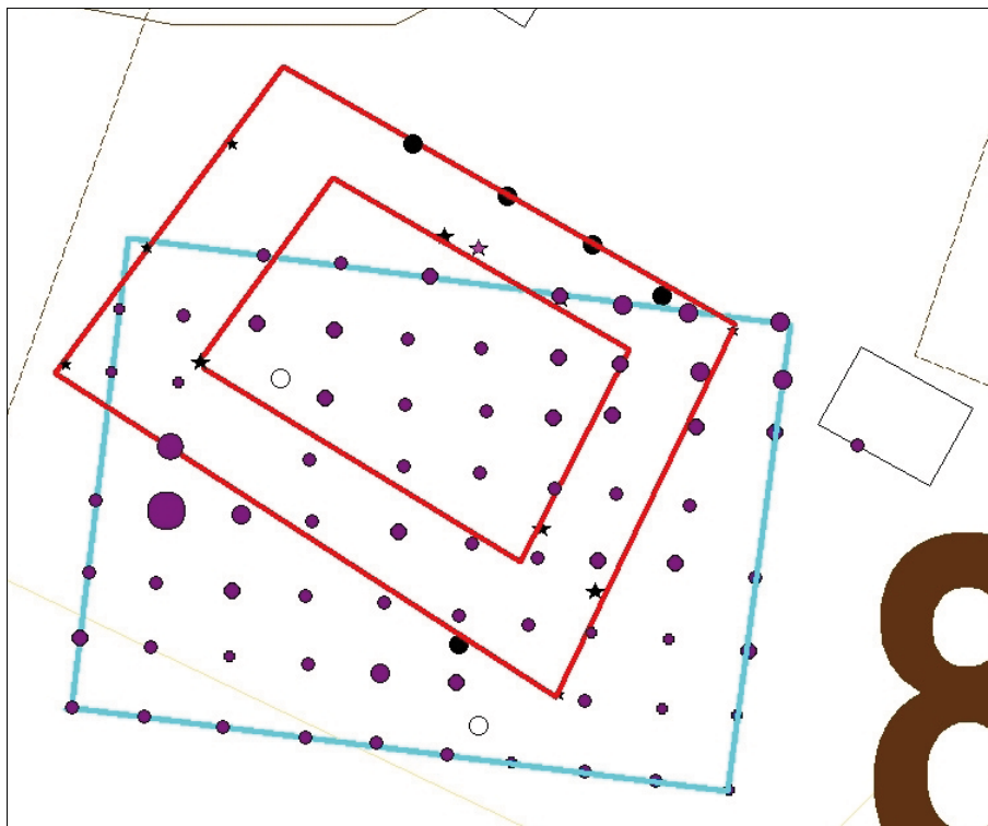
Bild 6. Läget för lämningen i fårhagen samt det rutnät som fosfatproverna togs i. Lämningen är markerad med röd färg och fosfatrutnätet med turkos färg. De lila punkterna visar halten hos fosfatproverna fördelade över lämningen. Skala 1:500.