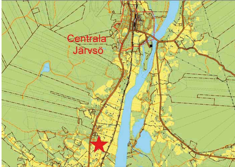
Bild 1. Karta över Järvsö med grävplatsens belägenhet markerad. Skala 1:80 000.