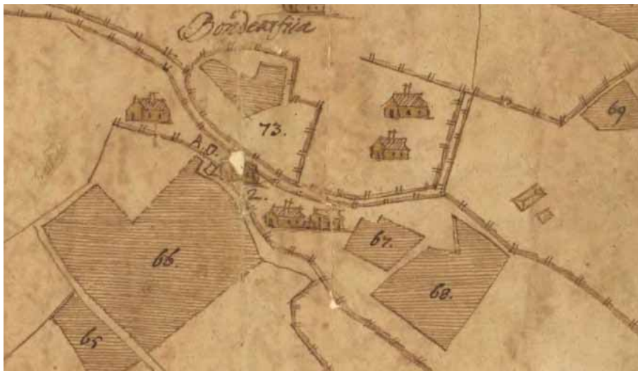
Bild 4. Detalj av karta över Bondarv av år 1704, publicerad i Hanzéns Järvsögårdarnas folk från år 1943. Anders-Ols och granngården Gudmunds ligger tätt ihop längst ned i bilden.

Under tiden undersökningen pågick fick vi med by- och sockeninvånarnas hjälp kännedom om ett antal skriftliga källor som vi inte kände till tidigare. Det mest informativa dokumentet var ett brandstodsprotokoll av år 1769 vilket berättade att Anders-Ols (no 1) brunnit ned den 2 maj samma år tillsammans med granngården Gudmunds (no 2). Protokollet lämnade en fullständig redogörelse för branden och dess förlopp. Texten har renskrivits av hembygdsvetaren Nisse Olofsson. Det anges att husen på båda gårdarna var nybyggda, 10–12 år tidigare.