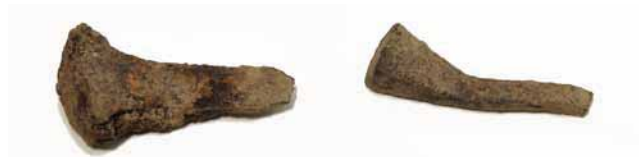
Bild 10. Del av fönsterhake samt en hästkosöm, hittade vid väggen till det hus som föregick den gård som uppfördes efter år 1769. Fönsterhaken är av en ålderdomlig typ som är svår att återfinna i stående hus. Skala 1:1.