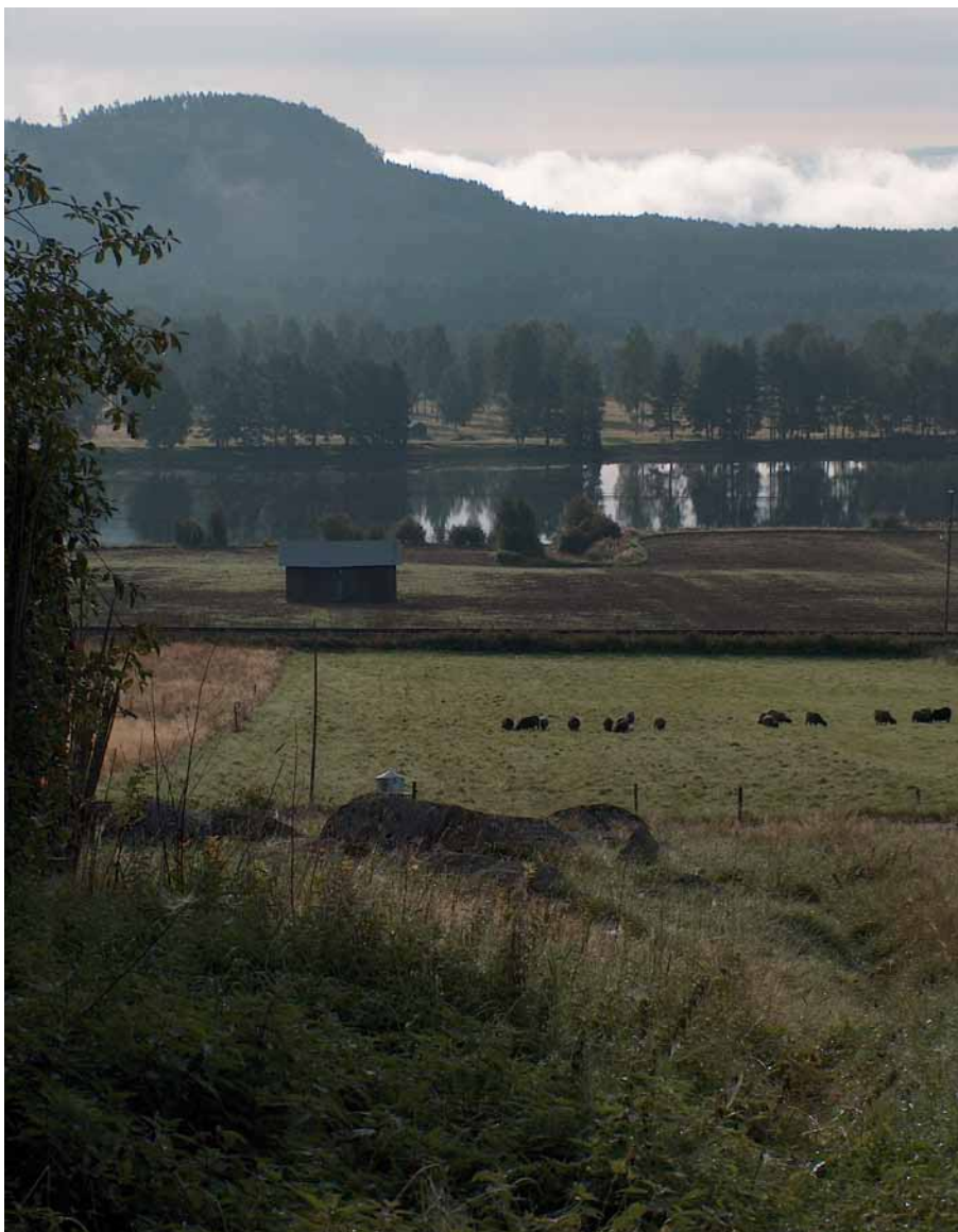
Bild 2. Vy från fårhagen med lämningen i Bondarv ned mot älven. Mellan älven och grävplatsen har legat ett järnåldersgravfält, vilket nu är borta.

ha hämtat även enskilda element från borgarkitekturen, exempelvis murade och putsade spisar längs långväggen (Mogren 1998). Även Erik Lundberg ansåg att gårdstypen hade sina rötter i feodaltidens borgar, och hävdade att den firsidiga gårdsbildningen kommit till vårt land som en kulturimpuls från England under 900–1000-talet (Lundberg 1940:58). Praktiska orsaker har också ibland förts fram, som att konstruktionen skulle skydda mot väder, vind, inkräktare och rovdjur. Detta är tänkbart, men bondgårdarna är trots allt relativt lätta att ta sig in i för en potentiell fiende. Med tanke på hur snabbt en brand sprids i en timrad kringbyggd gård är också konstruktionen inte helt igenom praktisk.