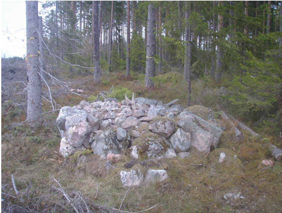
Bild 2 Gränsröset. Foto från söder.