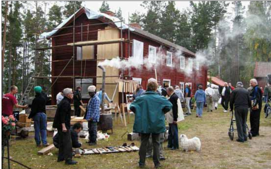
Kulturarvsdagen på Hille hembygdsgård 12 september 2010.