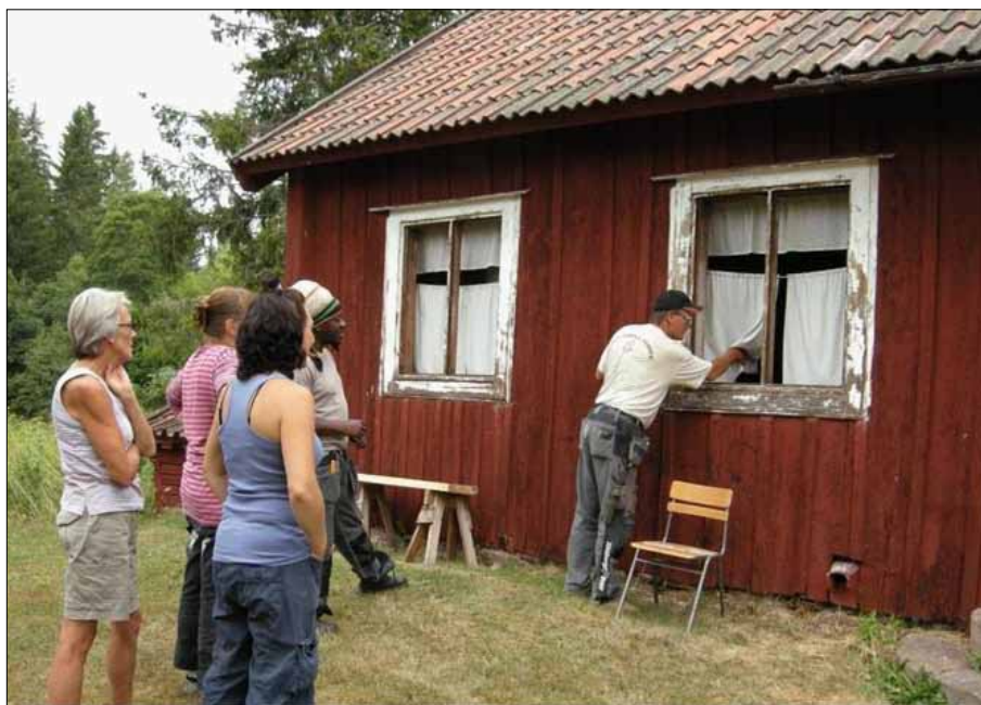
Fönsterrestaurering på Ovansjö hembygdsgård.

Grundkursen leddes av en handledande hantverkare tillika utbildningskoordinator som anlätades på konsultbasis. Specialiserade hantverkare har lett enskilda moment inom måleri, timring och lerklining. År 2010 fungerade projektledaren även som byggnadsvårdspedagog och antikvarisk medverkande, samtidigt med rollen som ekonomisk administratör och informatör. Utmaningen blev att medverka ute i fält samtidigt med ett omfattande administrativt arbete. År 2011 anställdes därför en extra person som byggnadsvårdspedagog och antikvarisk medverkande.