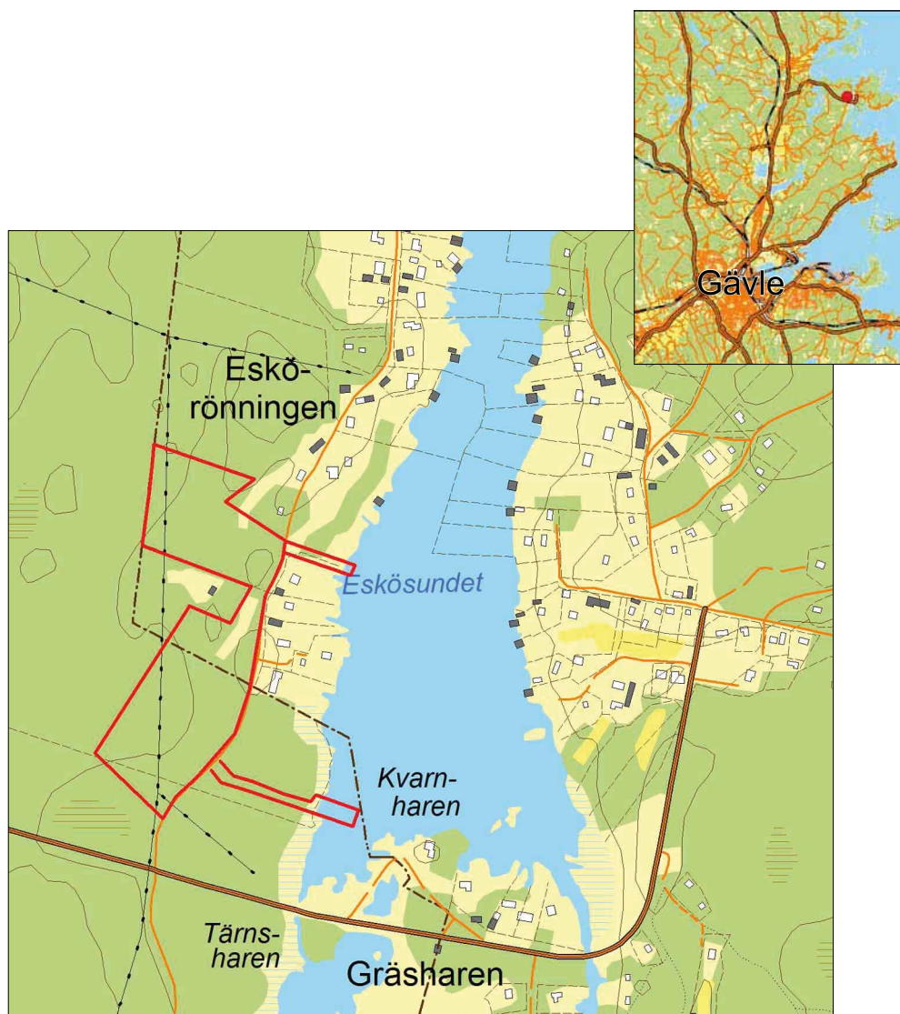
Bild 1. Utdrag ur den digitala fastighetskartan. Utredningsområdet ungefärliga sträckning markerat i rött.