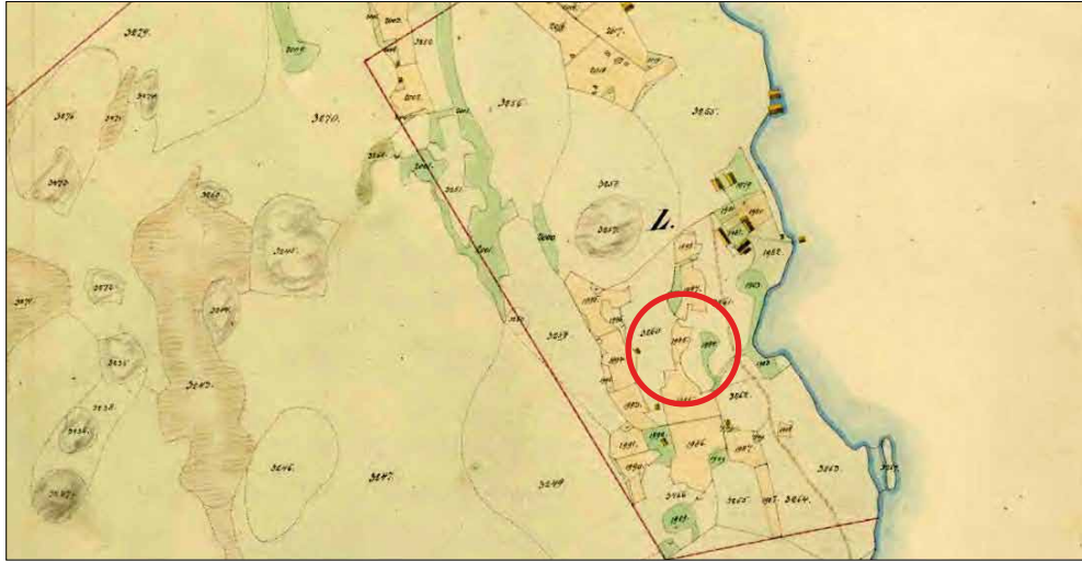
Laga skifteskarta 1846, V20-2:6.