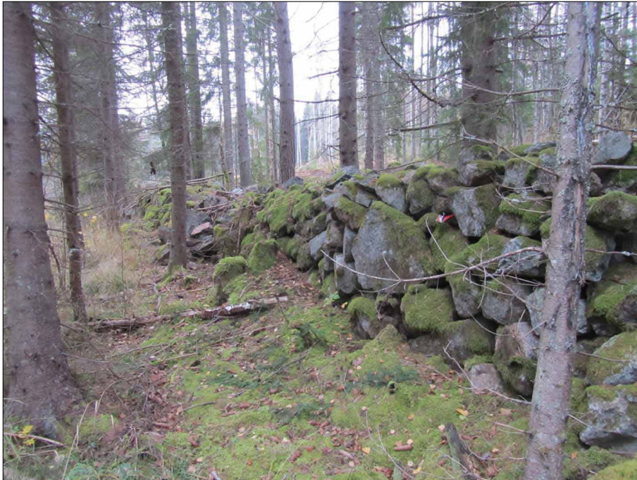
Bild 2. Stenmur i övergiven åkermark i norra delen av utredningsområdet.