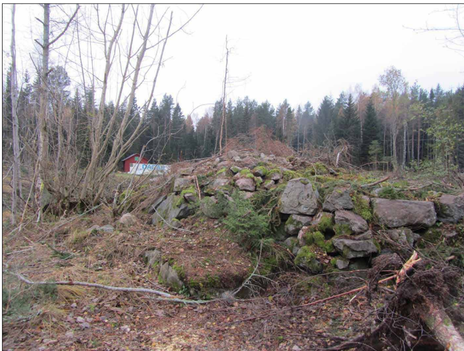
Bild 3. Odlingsröse och del av stenmur centralt på området.