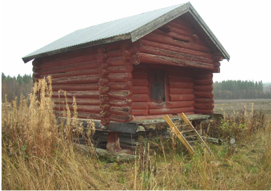
Ill. 1. Härbret från nordväst vid skadeinventeringen 2004.