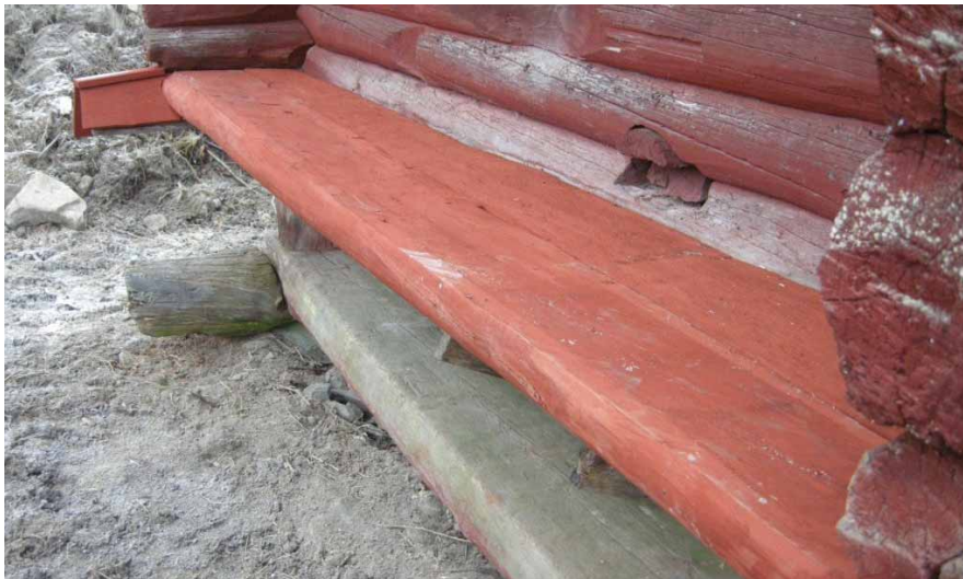
Ill. 9. Svalens golv efter byte av den yttersta golvplankan. Den inre golvplankan har enbart rödfärgats.