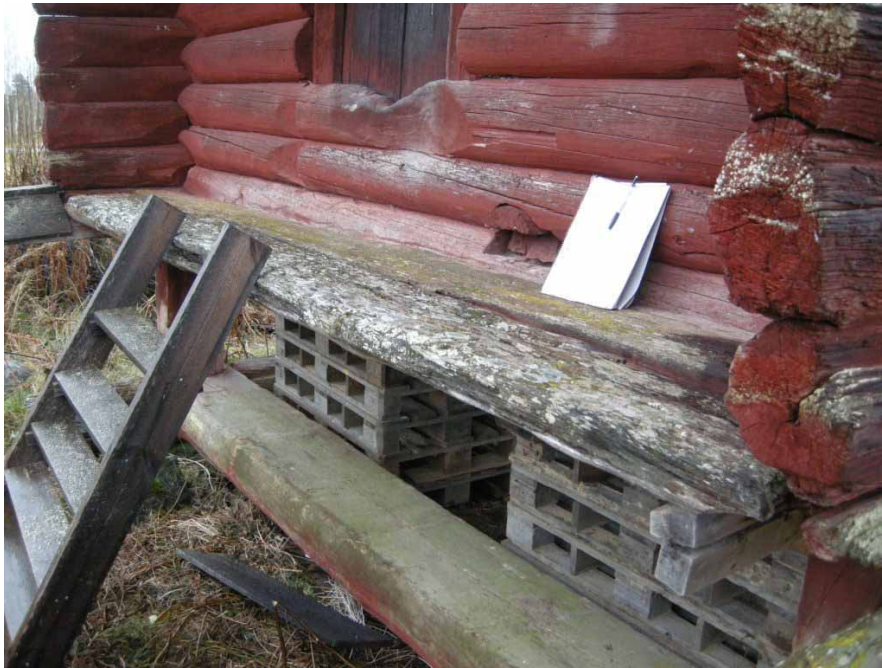
Ill. 7. Detalj från nordväst av svalens golv med den rötskadade yttersta golvbrädan.