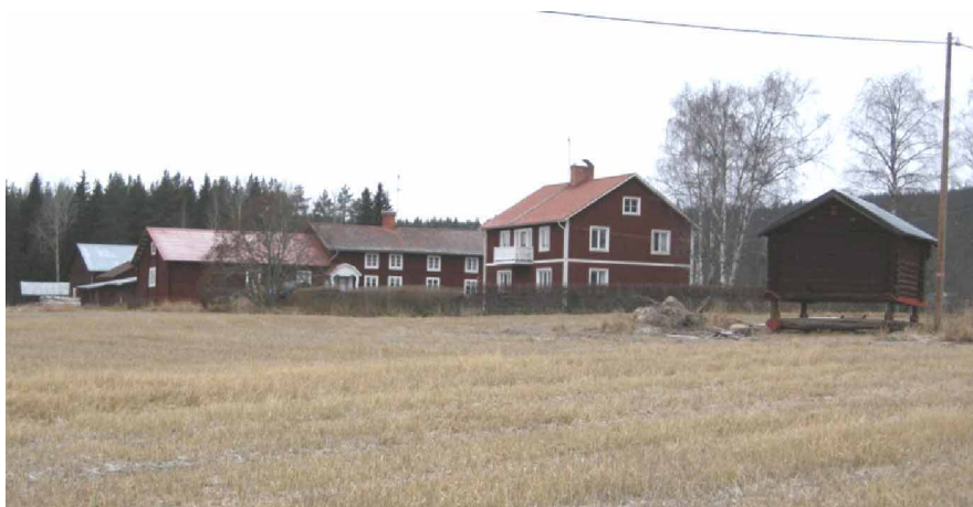
Ill. 3. Gården Bjus i Ygsbo med härbret längst till höger i bild.