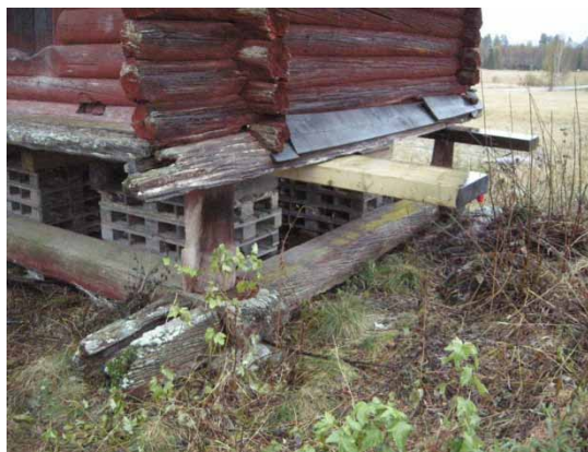
Ill. 6. Den västra delen av syllramen och mushyllan på samma sida sedda från nordväst.

Då syllramen på flera ställen legat emot jorden hade detta lett till rötskador, huvudsakligen på undersidan av den östra och den västra stocken i syllramen. Den västra stocken var även delvis ihålig och i den norra delen hade merparten av kärnan ruttnat bort.