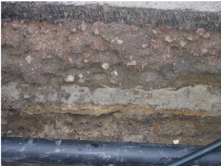
Bild 5. Varvig stratigrafi med "moderna" fyllnadslager.