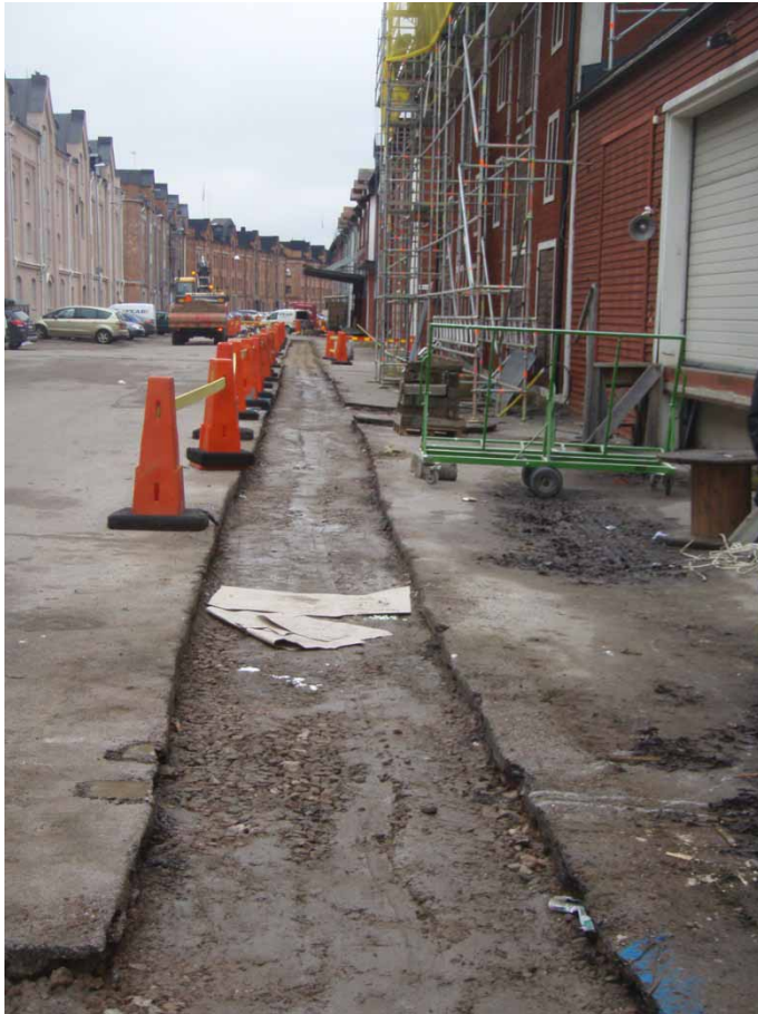
Bild 4. Schaktsträckningen innan påbörjad grävning. Foto från öster.