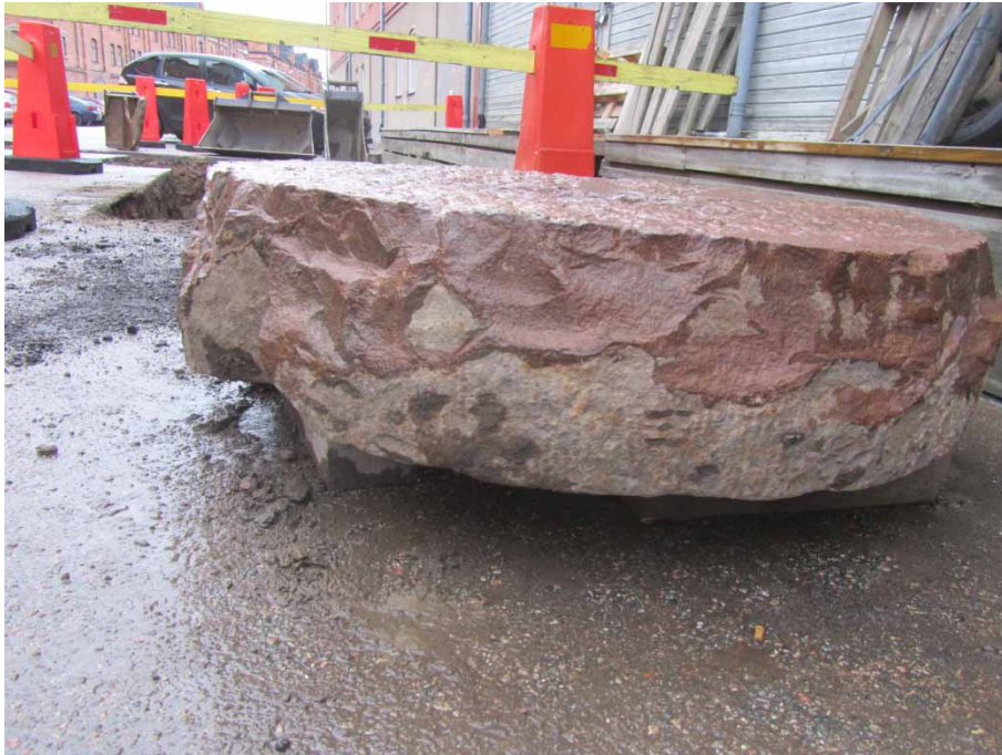
Bild 7. Kvarnstenen från sidan. I nedre halvan syns rester efter den ursprungliga "räfflade" kanten, medan den övre delen uppvisar ett påbörjat försök till omhuggning.