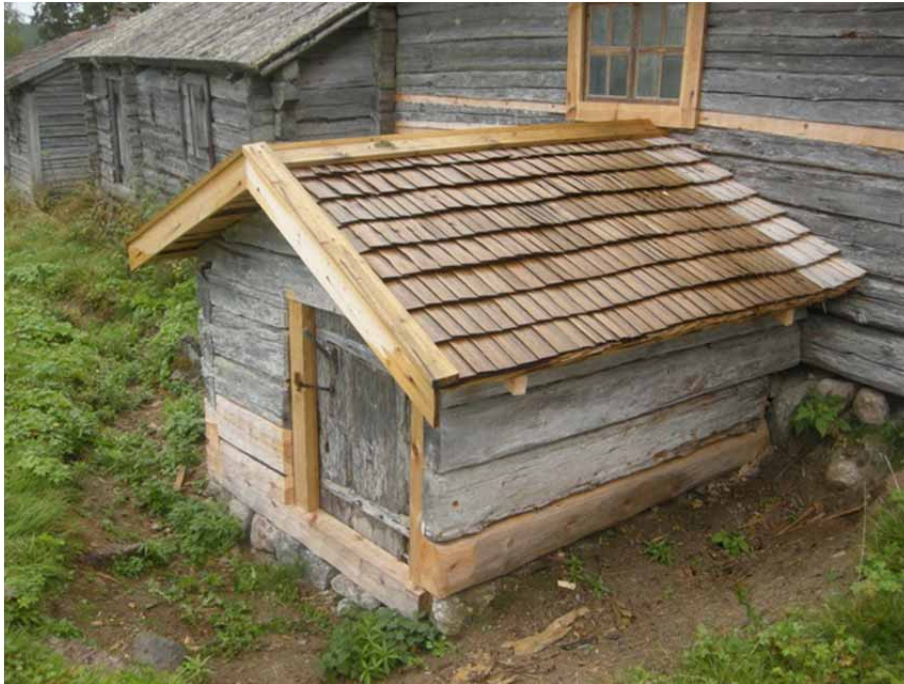
Figur 11. Källarsvalen efter återuppförandet.