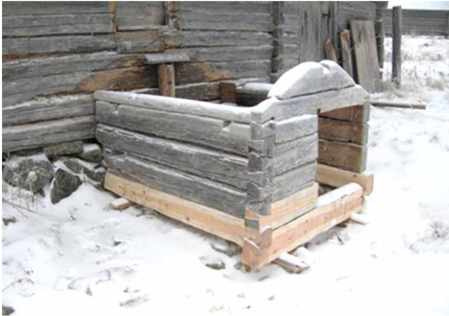
Figur 8. Källarsvalen under återuppförande.