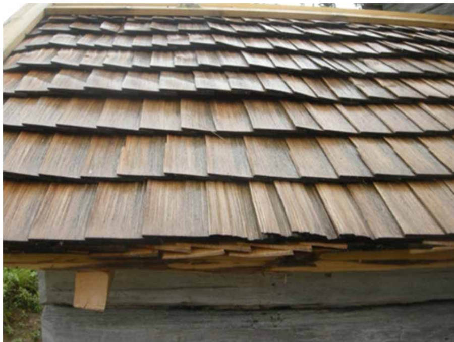
Figur 10. Detalj av källarsvalens takfall mot nordväst med nya takspån.

Bodens vattbrädor ochnockbrädor byttes mot nya. Istället för den tidigare för korta hänggrännan mot nordost sattes en ny hängränna av samma dimension upp, men nu längs hela byggnadens takfot.