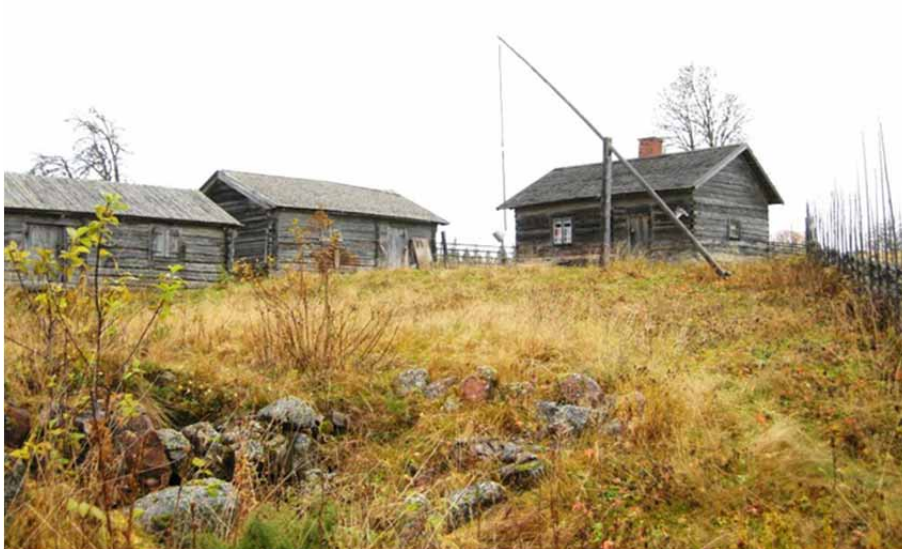
Figur 2. Oppigårds bod (i mitten av bilden) och vallstugan (till höger i bild).