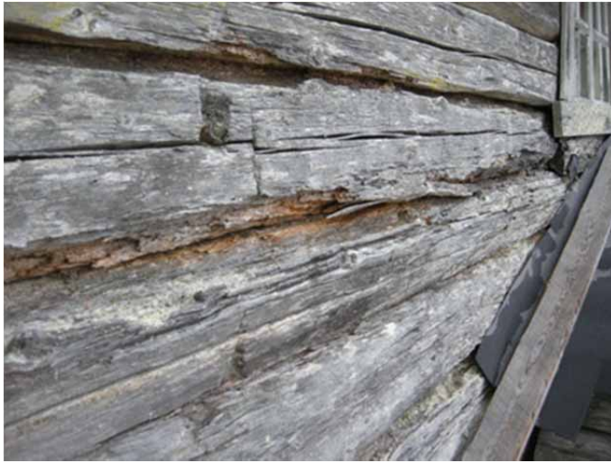
Figur 5. Rötffickor och rötskador i bodens nordöstra timmervägg.