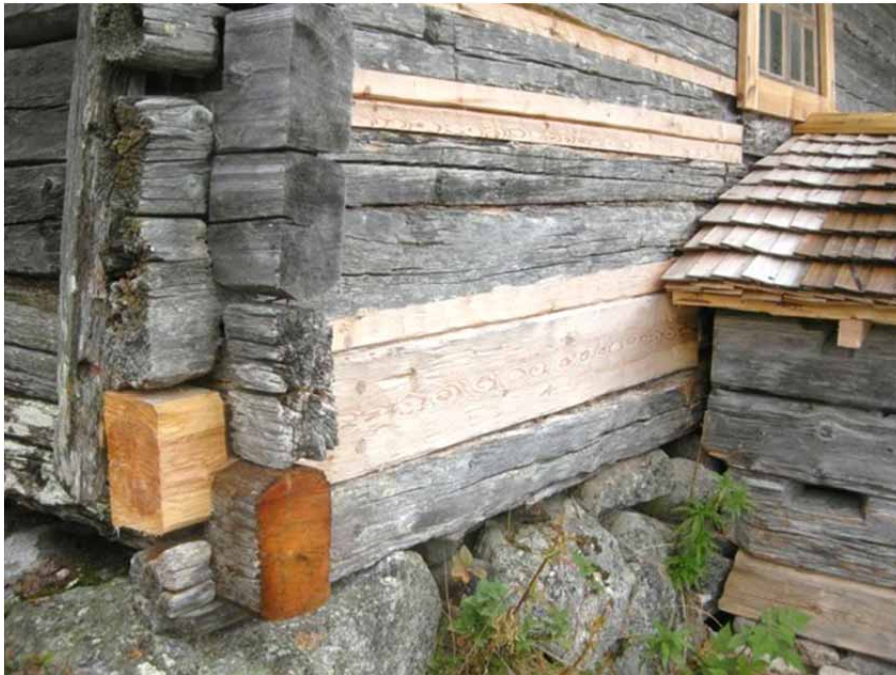
Figur 9. Detalj av timmerlagningar i bodens nordöstra vägg

Följande timmerstockar i källarsvalen åtgärdades. Fasaderna här benämnda A-D medsols med ingångssidan som sida A: