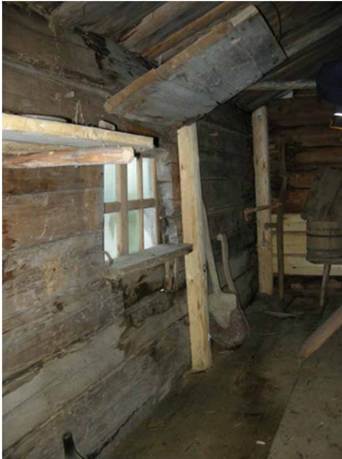
Figur 4. Interiör från bodens inre rum med luckan innanför fönstret i uppfällt läge.