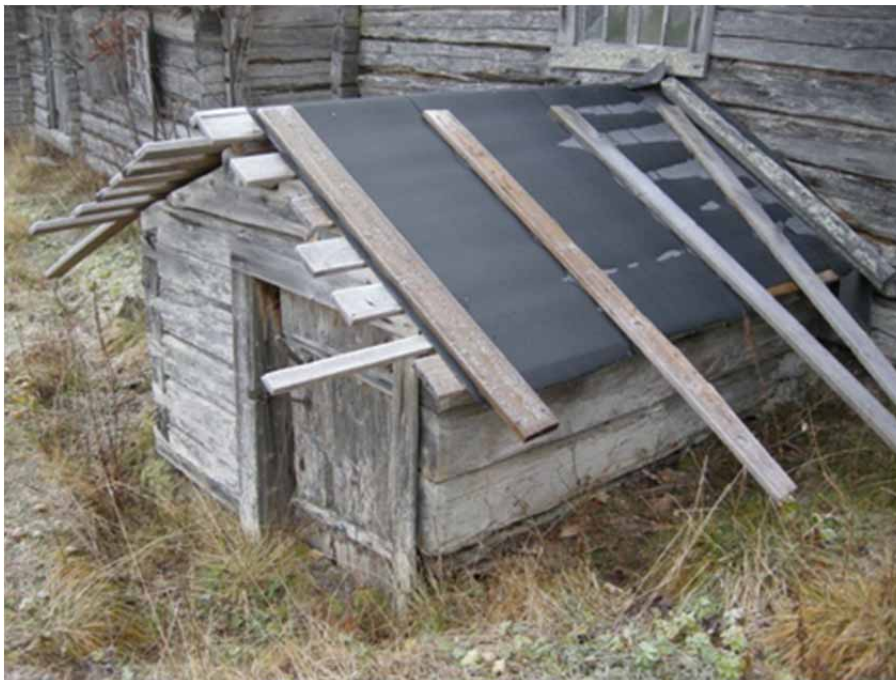
Figur 6. Källarsvalen före renoveringen med provisorisk täckning med takpapp.