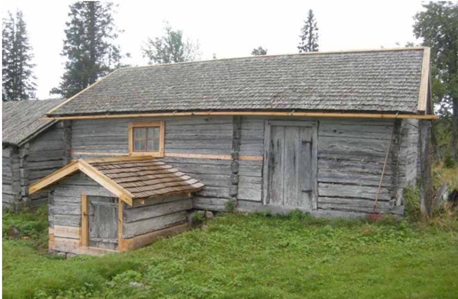
Figur 12. Boden efter avslutad renovering.