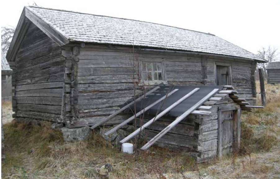
Figur 3. Boden före renoveringen.