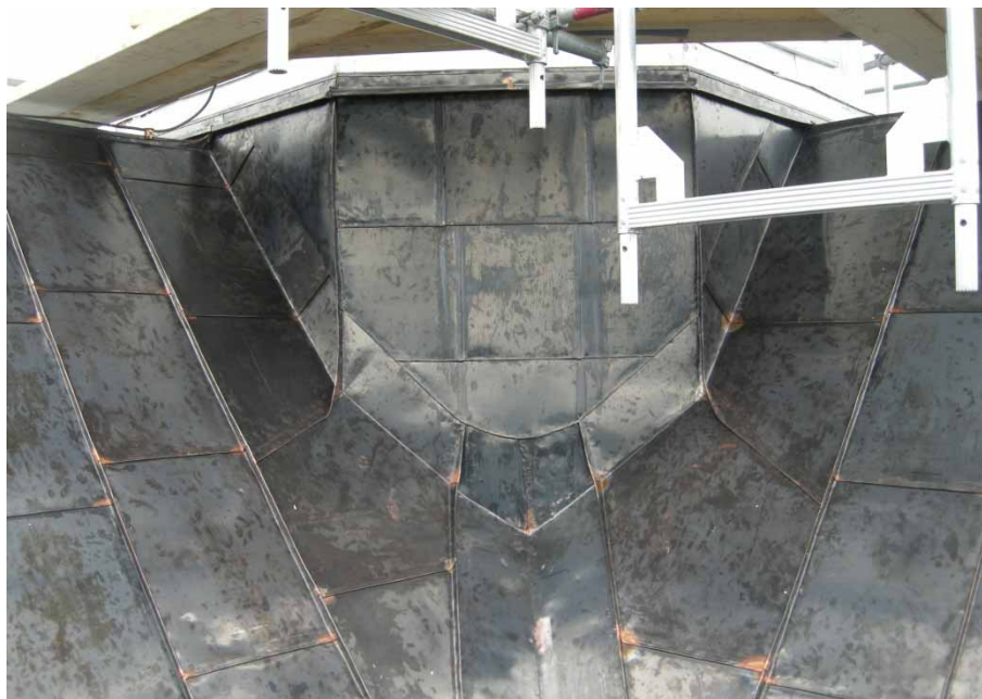
Figur 8. Detalj av torntaket efter omläggning med kopparplåt i mindre skivformat.