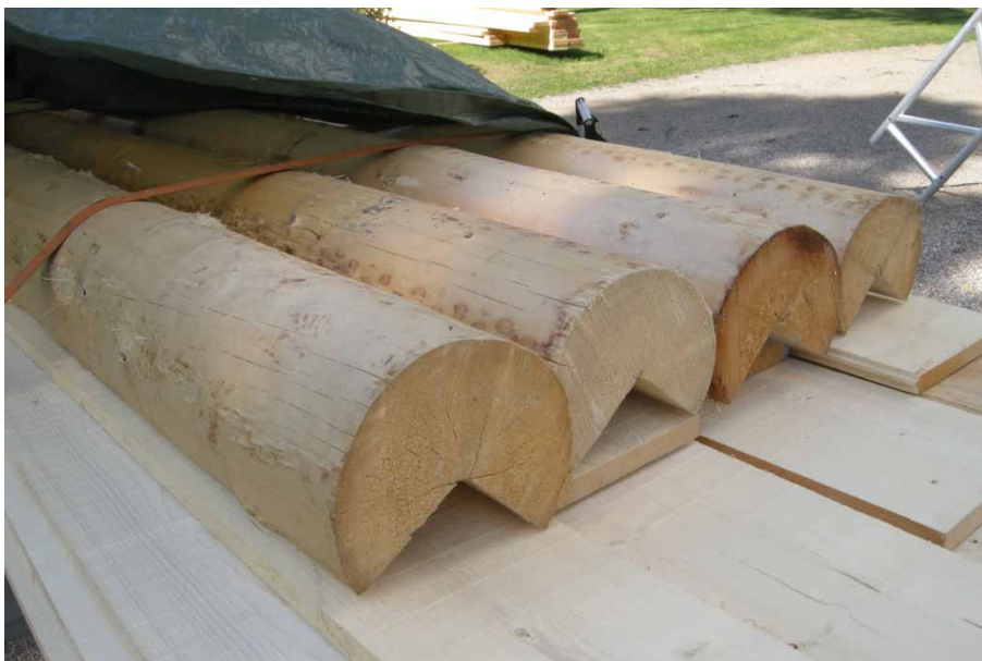
Figur 5. Detalj av nytillverkade åsar till tornhuvens hörn. En av dessa kom inte att användas då den ursprungliga åsen ej behövde bytas ut.