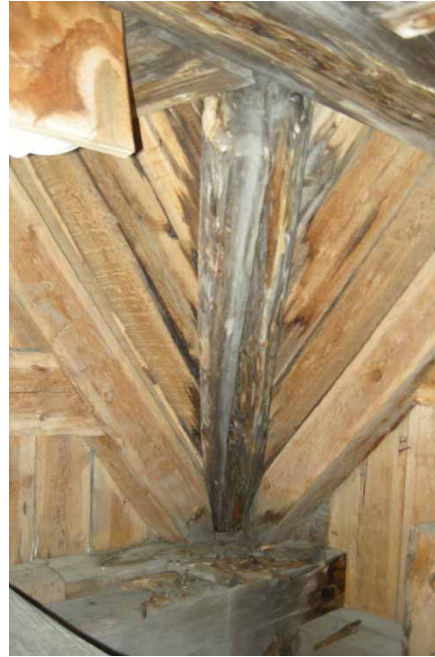
Figur 4. Detalj av rötskadad bärande ås i ett av de fyra hörnen inuti tornhuven.