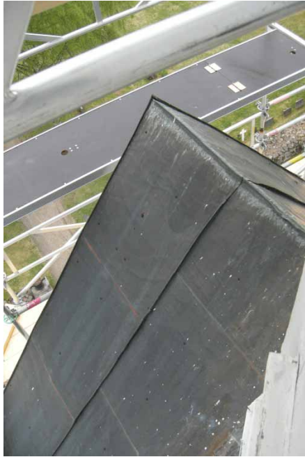
Figur 3. Detalj av plåttaket på tornhuven med stora skivformat.