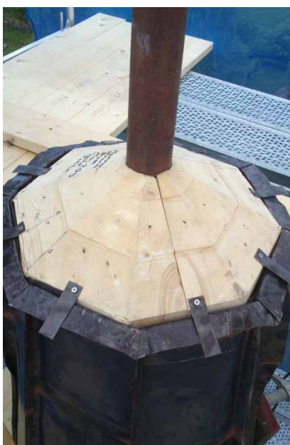
Figur 9. Detalj av spirans infästning.