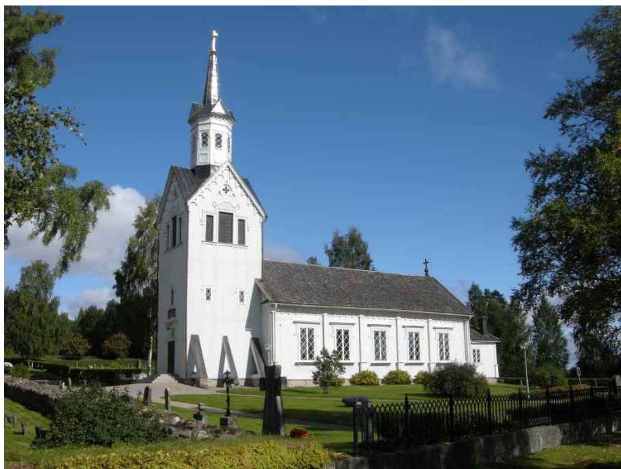
Figur 12. Los kyrka från sydväst efter avslutad tornrenovering.

Inga särskilda avvikelser har skett från Länsstyrelsens tillståndsbeslut.