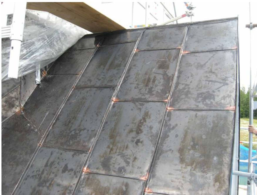
Figur 7. Detalj av kopparplåt av nya mindre skivformat på ett av tornhuvens takfall.

Tornspiran satt före reoveringen fast i ett stålrör som var fastsatt i tornets träkonstruktion. För att göra denna konstruktion stabilare byggdes en krans av trä under plåten i vilken spirans stålrör har satts fast.