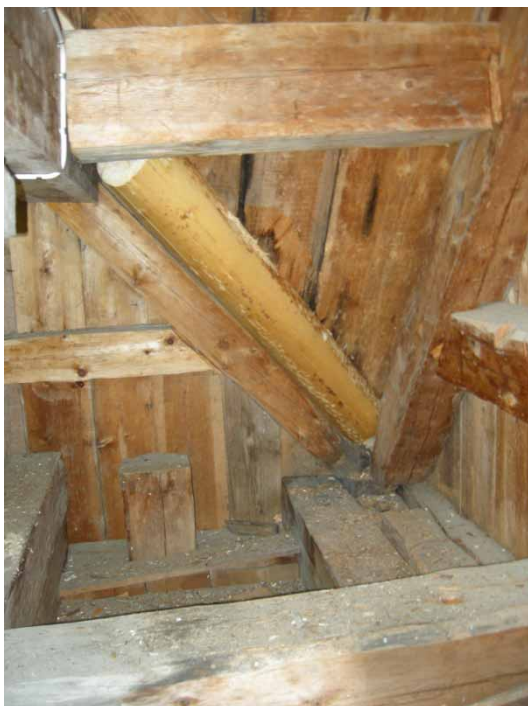
Figur 6. Detalj av utbytt takås som bär upp ett av torntakets fyra hörn.