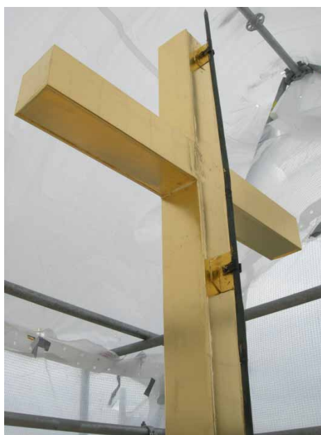
Figur 10. Detalj av korset efter omförgyllning.