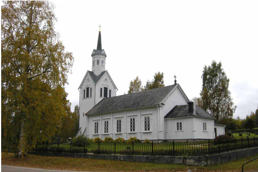
Figur 2. Los kyrka från sydost före tornrenoveringen.