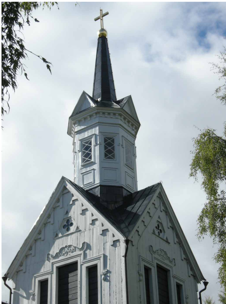
Figur 11. Detalj av kyrktornets övre del från nordost efter avslutad renovering.