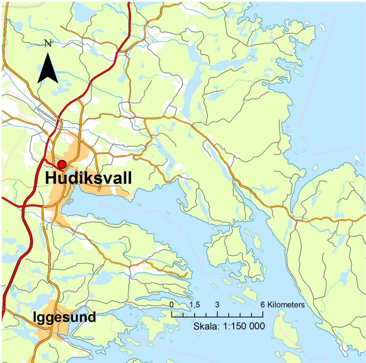
Figur 1. Utdrag ur digitala översiktskartan. Undersökningsområdet är markerat med rött.