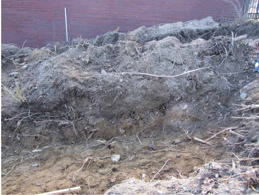
Figur 4. Schakt 2, östra sidan.