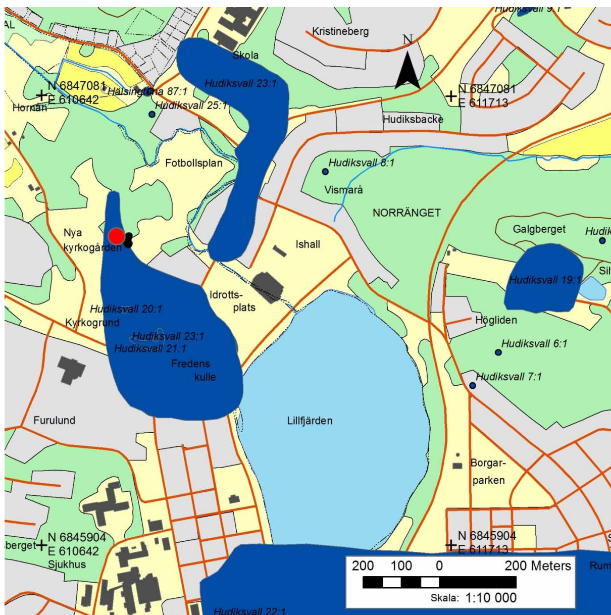
Figur 2. Utredningsområdet markerat med rött. Omkringliggande forn- och kulturlämningar markerade med blått.

Undersökningsområdet var cirka 10 × 7 meter stort och inom ytan grävdes två undersökningsschakt. Schakten dokumenterades, mättes in med GPS och fotograferades. I ett av schakten framkom tegel, taktegel, buteljglas, porslin och obrända ben. Inga anläggningar, kulturlager eller fynd framkom och några ytterligare arkeologiska åtgärder är inte nödvändiga.