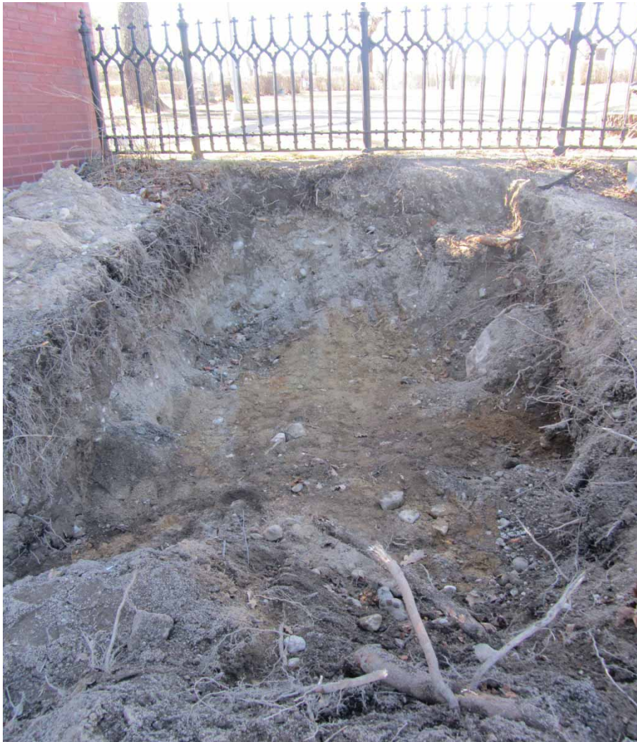
Figur 5. Sydvästra delen av schakt 1.