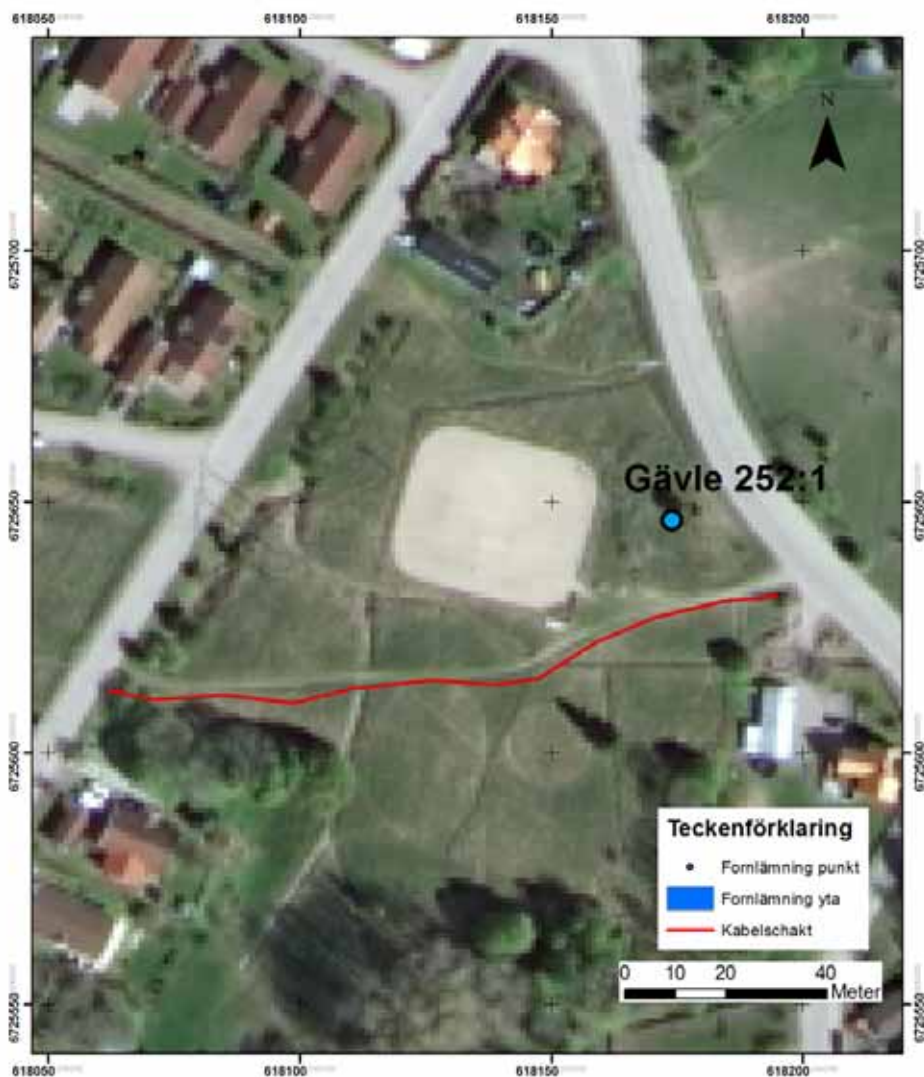
Bild 4. Det GPS inmätta schaktets sträckning på ortofotot.