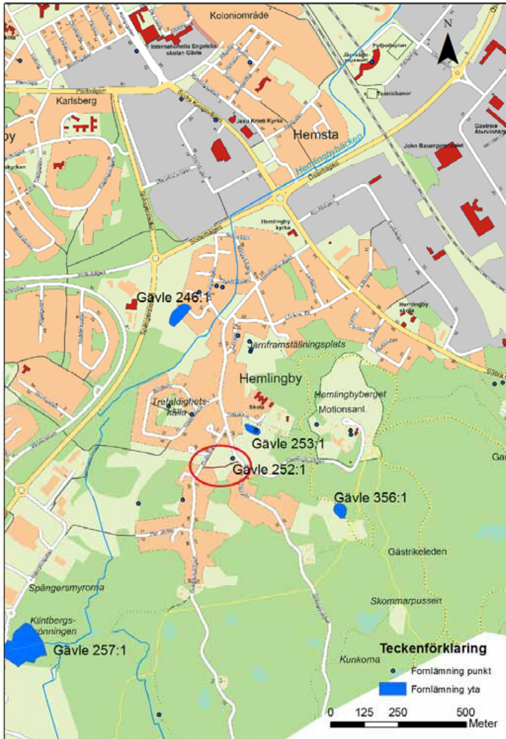
Bild 1. Översiktskarta med undersökningsområdet markerat. Identiteten redovisas på ett urval av fornlämningarna i närområdet. Efter digitala stadskartan, Lantmäteriet.