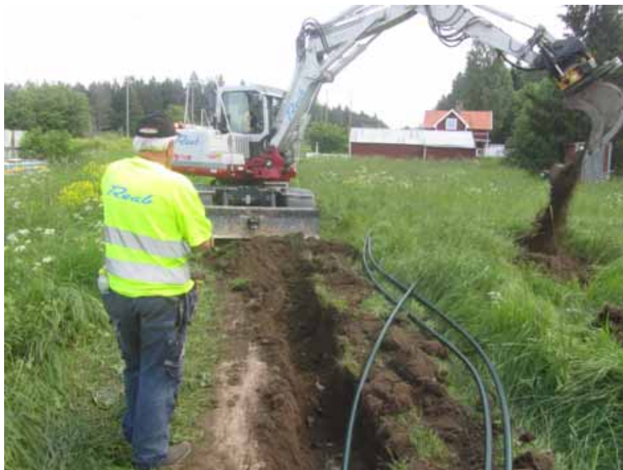
Bild 2. Pågående schaktgrävning och kabelnedläggning.

Innan grävning avsåktes sträckningen med metalldetektor. Schaktet grävdes med grävmaskin och kabeln lades ned fortlöpande. Längs hela den aktuella sträckan övervakades grävningen av en arkeolog. Schaktet mättes in med GPS och dokumenterades i sektionsritning och med foto.