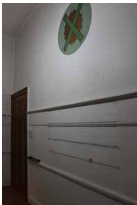
Figur 2. Passagen före påbörjade arbeten. Väggedekorationen i form av ett Andreaskors, hade sparats ut i vävtapeten. Den gröna kulören kring korset var den ursprungliga kulören, tillkommen omkring 1915. I övrigt var utrymmets väggar och listverk vitmålade.