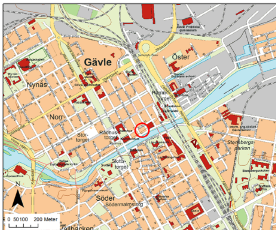
Figur 1. Digitala stadskartan från Lantmäteriet. Frimurarhuset, Norr 43:1, är inringat.