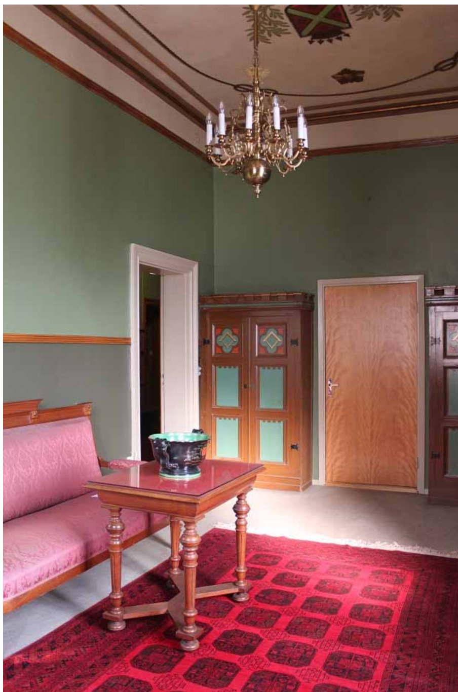
Figur 11. Ämbetsmannarummet efter avslutade arbeten. De tidigare vävtapetserade väggarna har bredspacklats och målats med linoljefärg i kulörer likvärdiga de från 1915, då rummet gjordes om från att tidigare ha ingått som rum i logevaktmästarens lägenhet. Listverk är laserade i brunt.