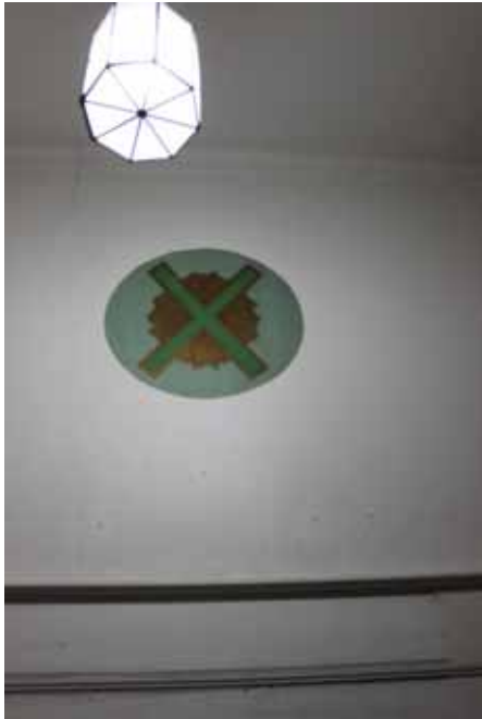
Figur 4. Passagens Andreaskors före påbörjade arbeten. Den ursprungliga putsade ytan var utspard i 1970-talets vävtapet.