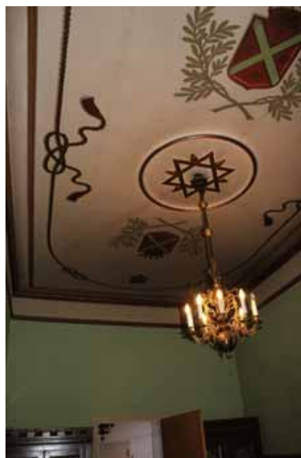
Figur 8. Taket innan rengöring, lagning och retuschering.