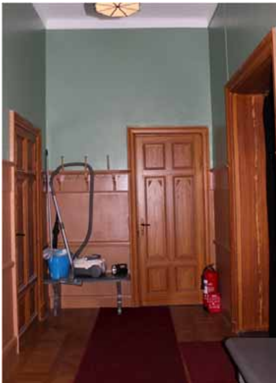
Figur 6. Passagen efter avslutade arbeten. Dörren till vänster leder in till ämbetsmannarummet. 2017-03-06.