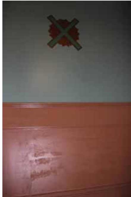
Figur 5. Väggen i passagen efter avslutade arbeten.