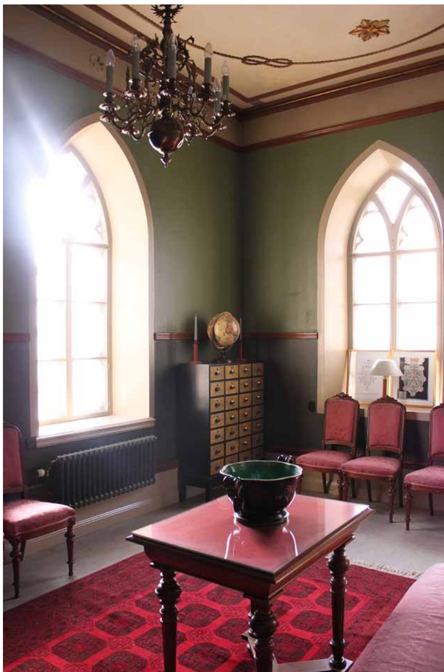
Figur 12. Ämbetsmannarummet efter avslutade arbeten. De tidigare vävtapetserade väggarna har bredspacklats och målats med linoljefärg i kulörer likvärdiga de från 1915, då rummet gjordes om från att tidigare ha ingått som rum i logevaktmästarens lägenhet. Fönsterbågar och fönsternischer är målade i en gulgrå kulör. I hörnet av taket skymtar en sparad referensyta, liksom en tidigare hårt flagad yta.