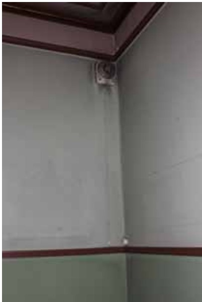
Figur 9. Ämbetsmannarummet före påbörjade arbeten. I en tidigare ventilationsöppning hade under sen tid en fläkt monterats.