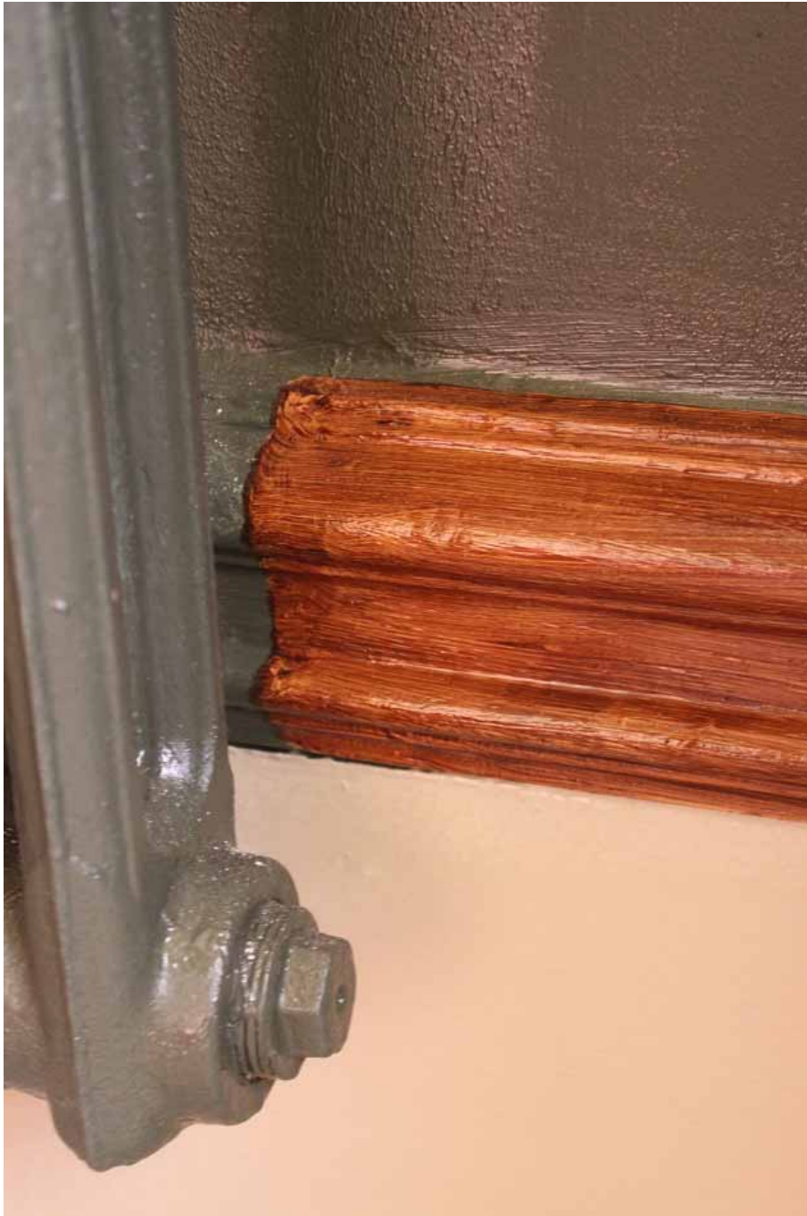
Figur 13. Laserad list i ämbetsmannarummet.