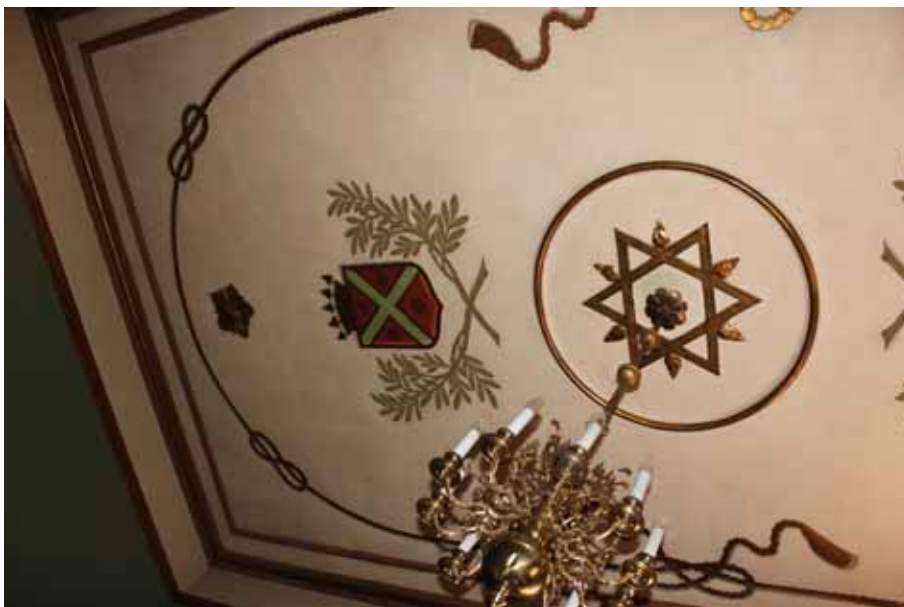
Figur 14. Det putsade och målade taket efter avslutade arbeten. Sprickor har lagts igen med gips, ytorna har rengjorts och flagade delar har bättrats.