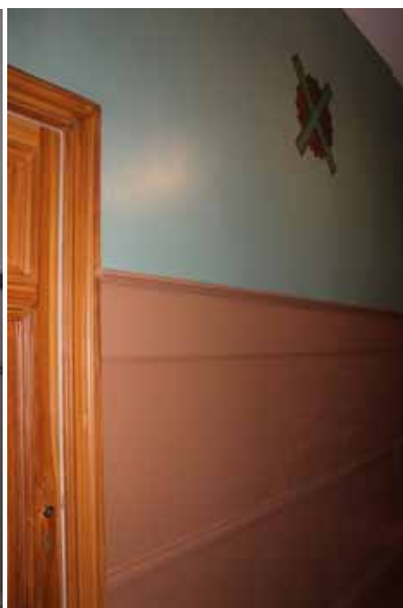
Figur 3. Passagen efter avslutade arbeten. Färgsättningen som tillkom kring 1915 har återskapats. Den övre väggytans vävtapet har bredspacklats. Ytan kring Andreaskorset är nu integrerad med övrig väggyta.