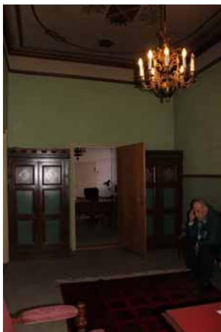
Figur 7. Ämbetsmannarummet före påbörjade arbeten. Väggarna var tapetserade med vävtapet och både väggar och tak var hårt smutsade.