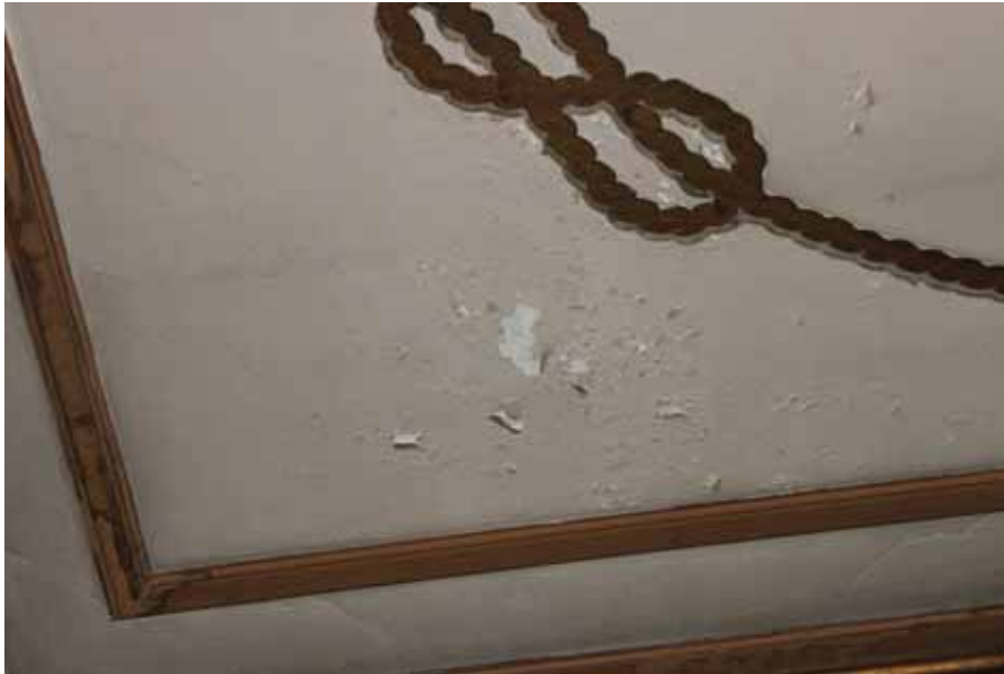
Figur 8. Taket före påbörjade arbeten. I det sydvästra hörnet var linoljefärgen kraftigt flagad.