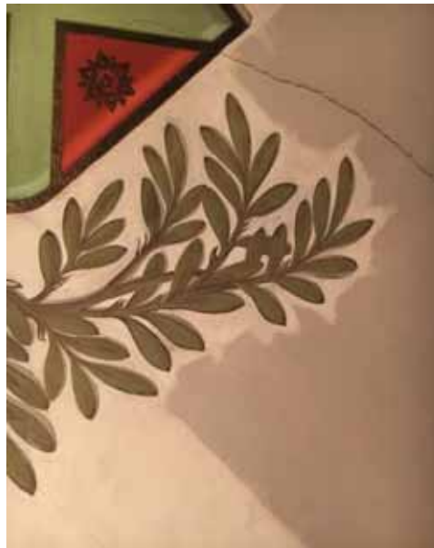
Figur 10. Taket i ämbetsmannarummet under pågående rengöring.