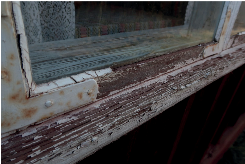
Figur 2. Exempel på fönster och omfattningars skick innan påbörjade arbeten.

Den senaste fönsterrenoveringen utfördes för omkring 25 år sedan, enligt Källbergs Byggnadsvård. Påstrykning av vitpigmenterad olja utfördes 2006. Fönstren var innan påbörjade arbeten i stort behov av underhåll. Kitt hade lossnat och färgen flagat/urlakats.