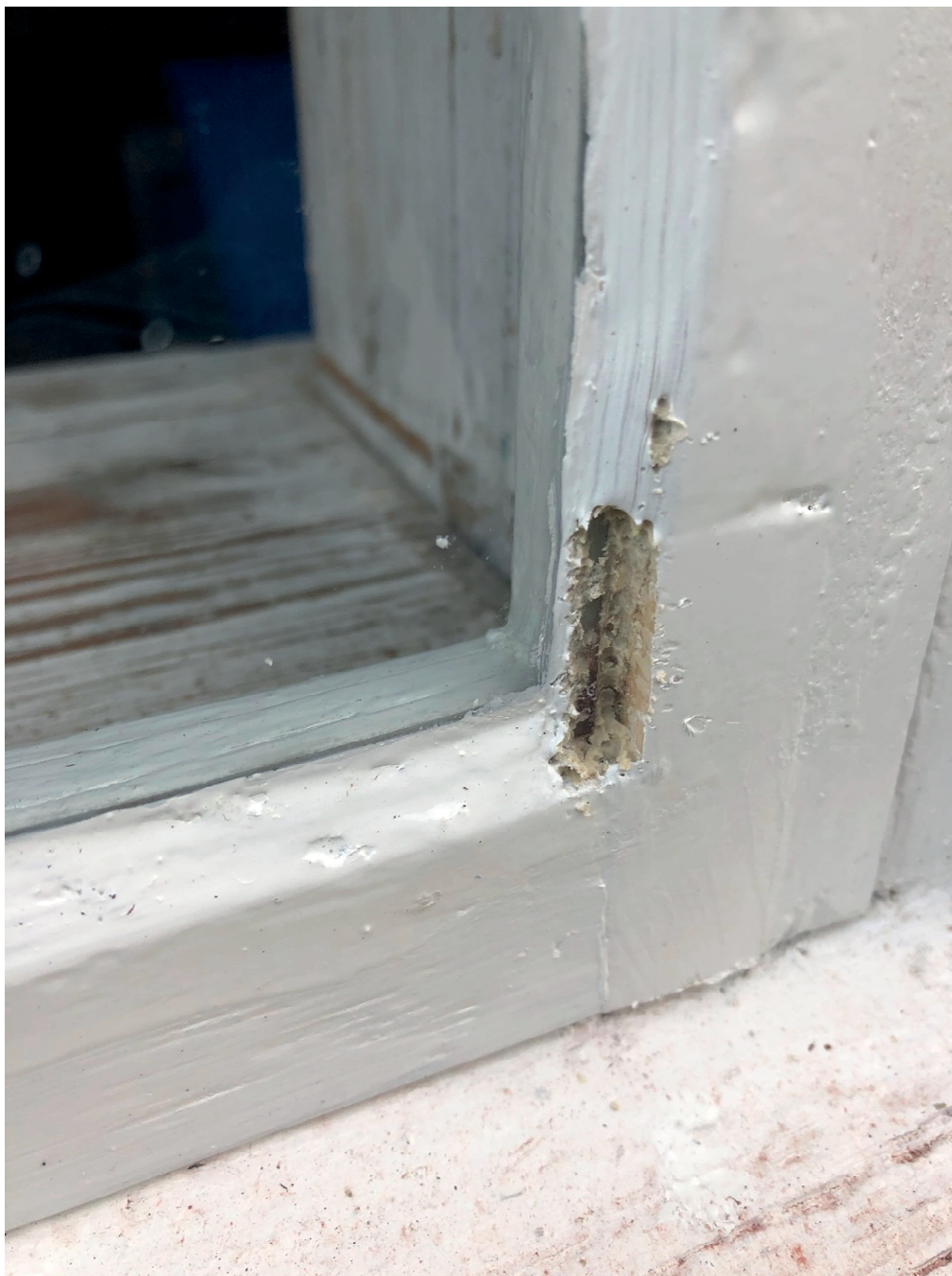
Figur 8. Exempel på skada på kittet orsakat av fåglar.