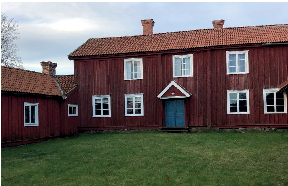
Figur 7. Bostadsdelen in mot gården efter avslutade arbeten.