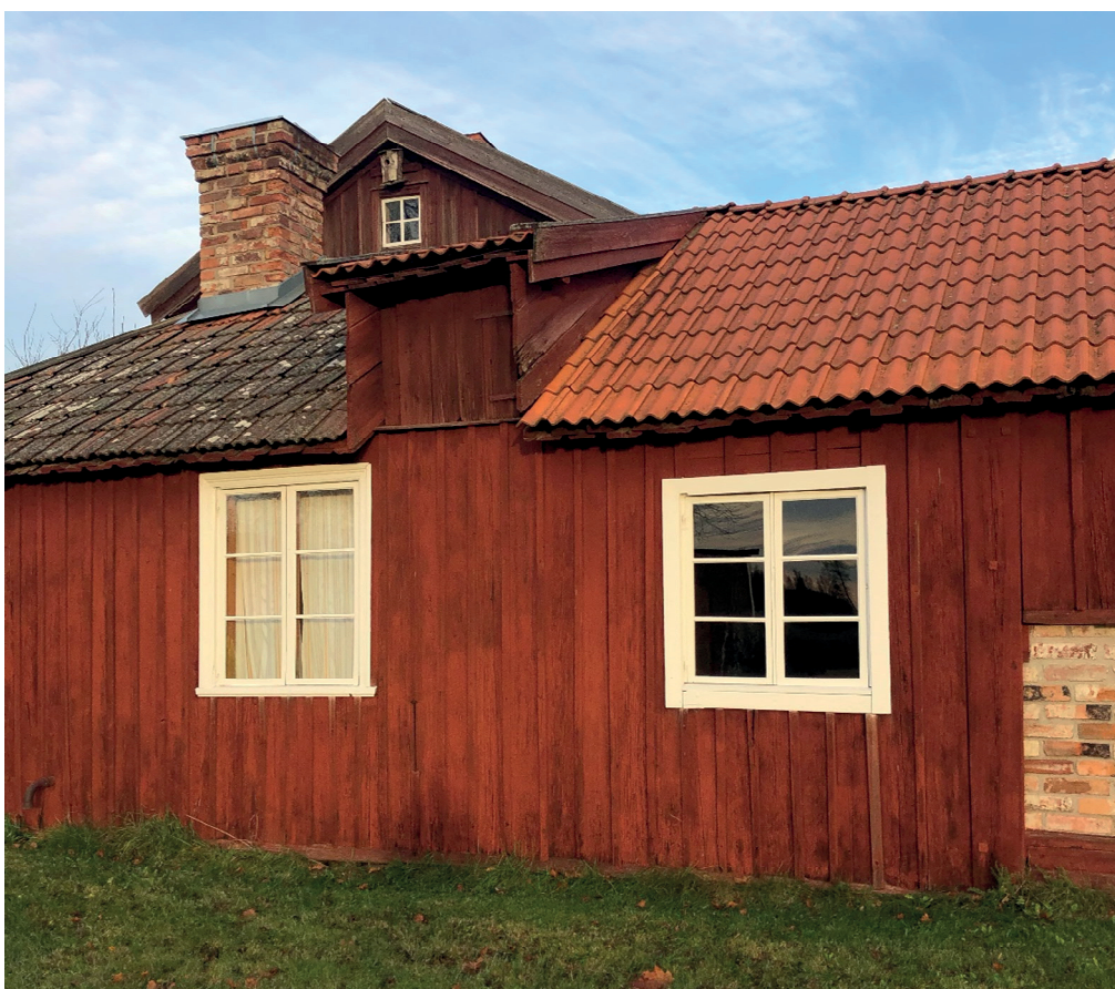
Figur 4. Fönster mot söder efter avslutade arbeten.