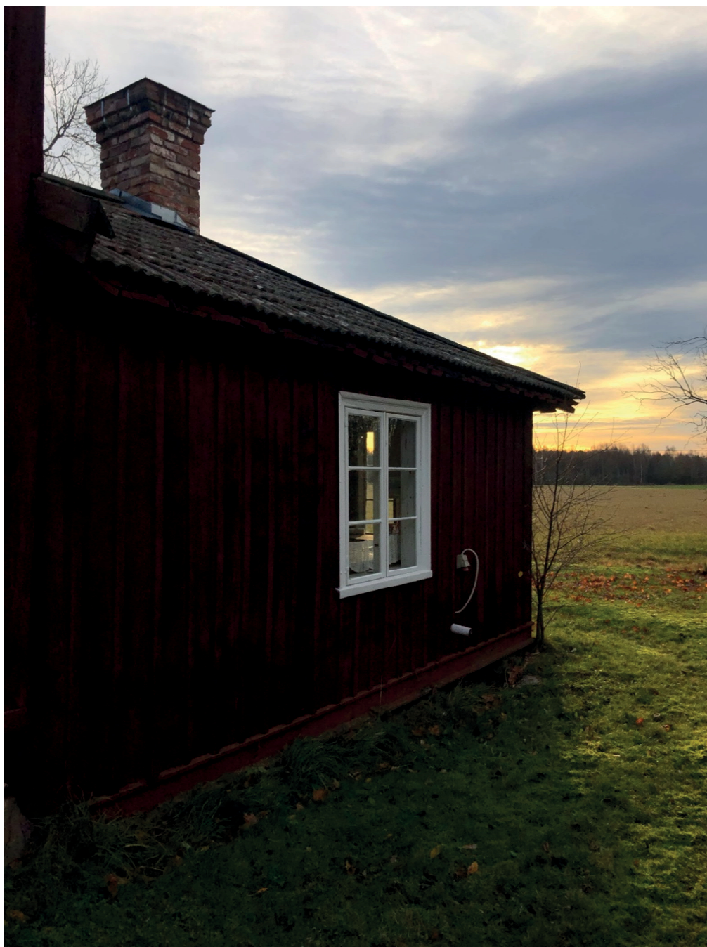
Figur 5. Fönster in mot köket på den västra sidan.