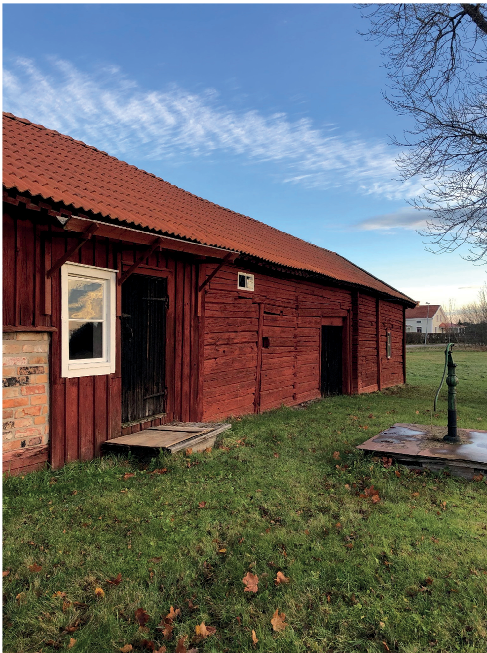
Figur 6. Fönster mot söder efter avslutade arbeten.