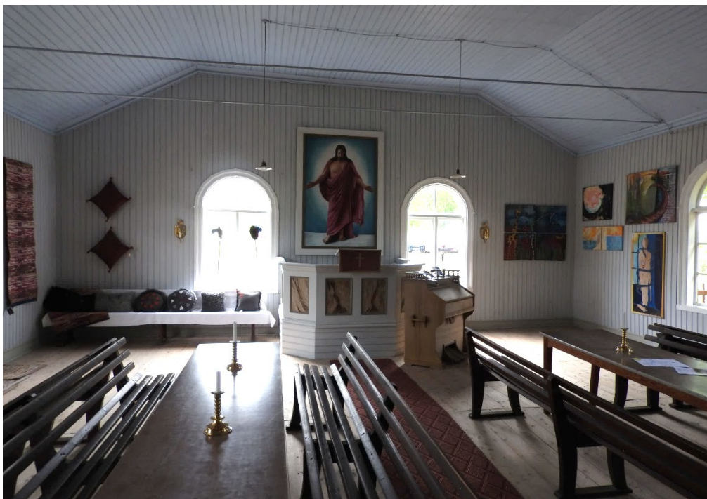
Figur 28. Stora salen i Älvsbacka missionshus har panelklädda väggar och tak, samt ett obehandlat brädgolv, i likhet med stora salen i Kungsbergs bönhus.

Härnäs missionshus i Östergötland hör också till en av missionsrörelsens tidiga byggnader. Också denna byggnad saknar exteriöra tecken på dess religiösa innehåll, medan salens utformning i högre grad närmar sig ett traditionellt kyrkorum med sin ådringsmålade inredning i podium, predikstol och bänkar. Därtill har de två dörrar som flankerar podiet välarbetade snickeridetaljer i de spröjsade fönsterpartierna.