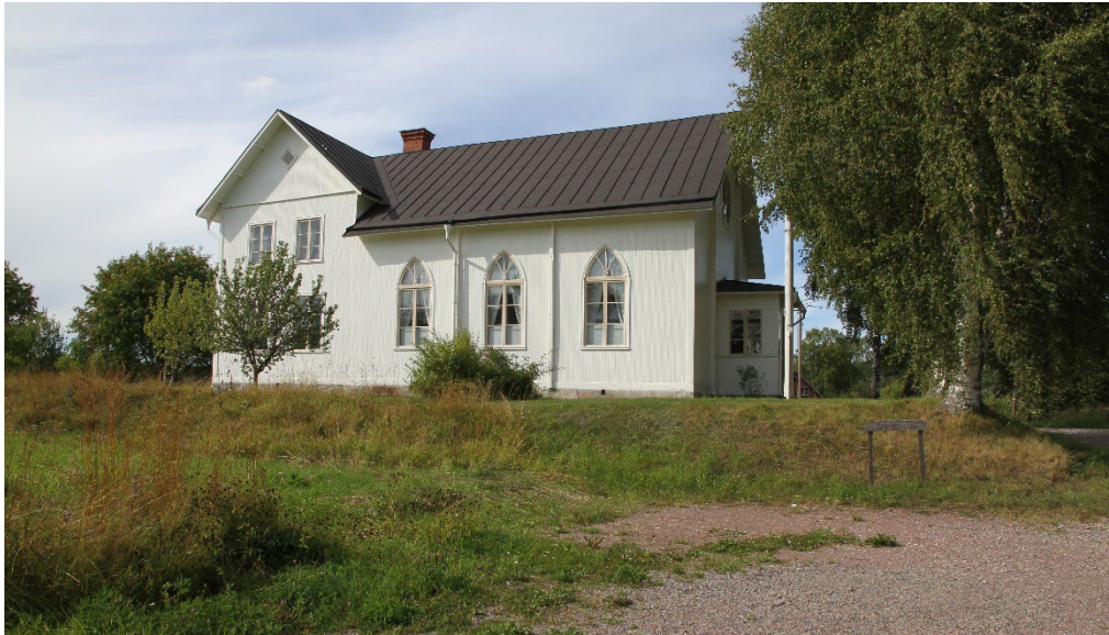
Figur 27. Kungsbergs bönhus sett från söder. Byvägen löper förbi den östra sidan. Här växer höga björkar. I övrigt finns endast några låga buskar och ett fruktträd på tomten. Flaggstången skymtar framför farstun.

Bönhusets omgivande trädgård består till största del av en klippt gräsyta utan egentlig avgränsning mot omkringliggande jordbruksytor. Mot öster gränsar tomtytan mot byvägen. I tomtgränsen mot öster växer en rad höga björkar. Mellan björkarna och bönhusets sydöstra del står en flaggstång. Mindre träd finns på tomtens södra sida. På tomtens västra del finns snår av träd och sly. På den norra delen av tomten brukar bilar köra in, men där finns ingen egentlig infart.