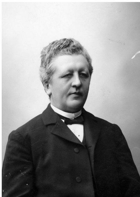
Figur 3. Paul Peter Waldenström.

Vid samma tid arbetade prästen Paul Peter Waldenström som lektor vid läroverket, dagens Vasaskolan. Waldenström var sedan slutet av 1850-talet ansluten till den nyevangeliska riktningen och som redaktör för Pietisten hade han möjlighet att utöva stort inflytande inom väckelserörelsen. Genom sina texter i skriften kom Waldenström under 1870-talet i konflikt med Svenska kyrkans lära. Detta, ihop med att han firat enskilt nattvardsfirande i Uppsala, medförde att han avskedades som Evangeliska Fosterlands-Stiftelsens provinsombud. År 1882 avstod han slutligen också sitt prästämbete. 8