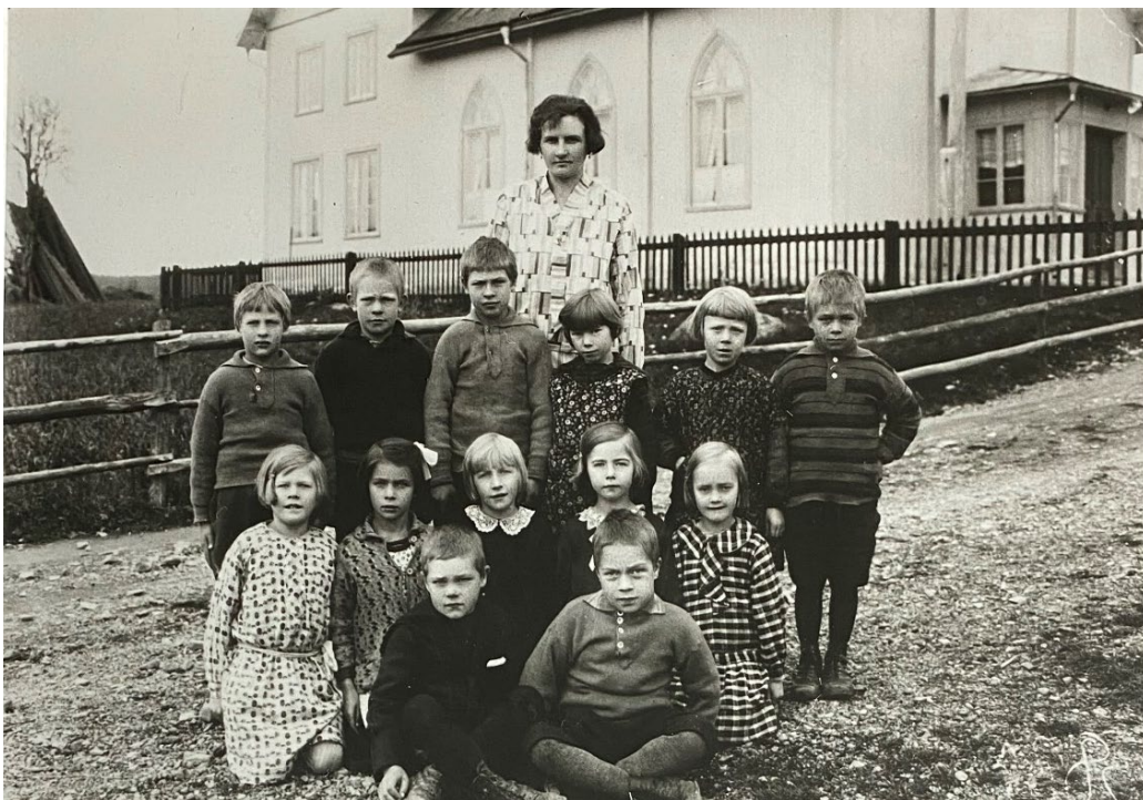
Figur 9. Mellan 1917 och 1936 hölls småskola i bönhusets lilla sal. Fotografiet hänger i lilla salen i bönhuset och är, 2022-11-24.

I mitten av 1900-talet skedde en del förändringar, bland annat 1942 genom ett nytt varmluftssystem samt ett nytt brädgolv i stora salen. 26 Nu skedde uppvärmningen genom en panna i källaren och värmen leddes ut till stora salen genom gallerförsedda öppningar i talarstolens bas. År 1957 renoverades köket och bostadslägenheten en trappa upp. På första våningen tillkom också ett litet utrymme med wc. I samband med renoveringen av köket på bottenplan flyttades den norra entrén till den västra sidan. 27