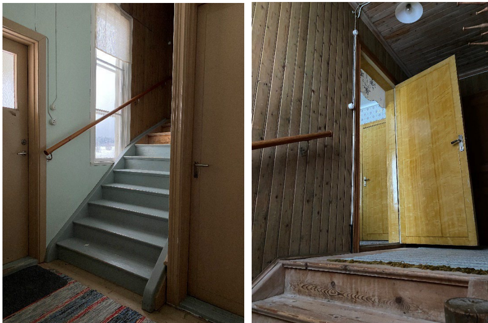
Figur 20 och 21. Farstun och den västra entrén. Högra bilden visar den övre hallen och ingången till köket.