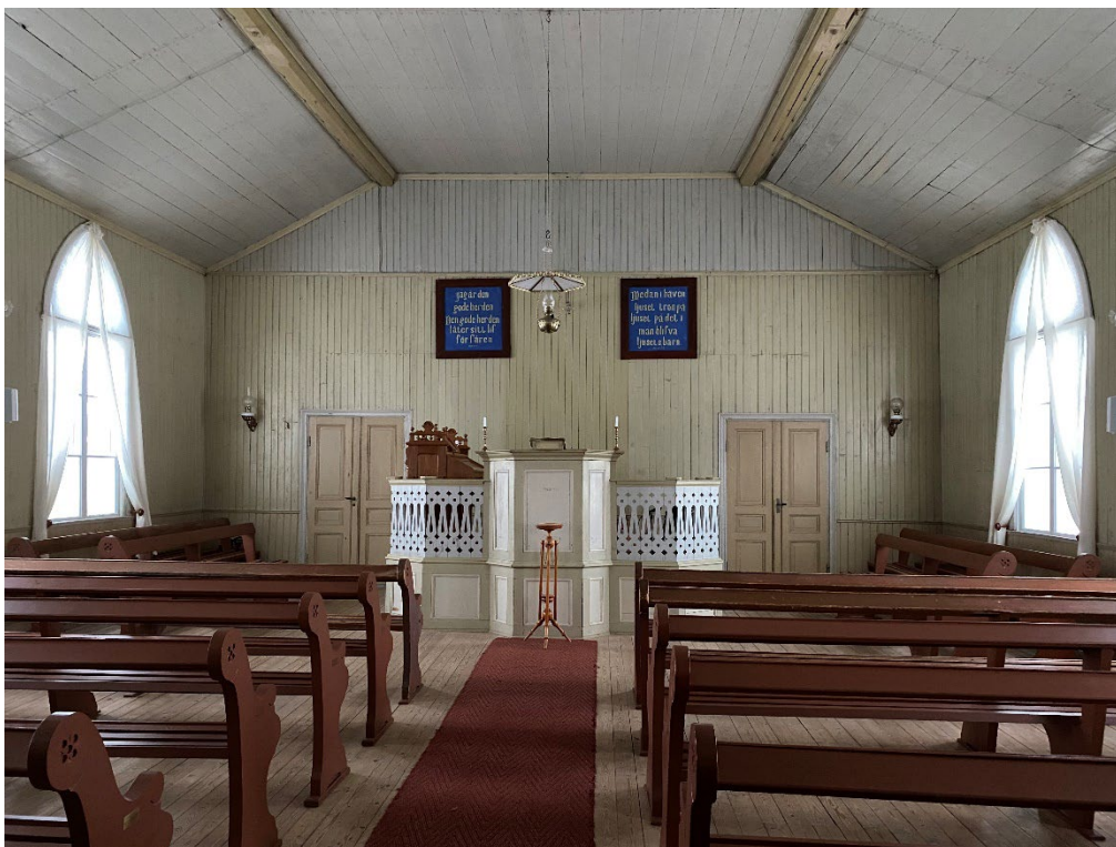
Figur 14. Stora salen sedd mot podiet med predikstol. Dörren till vänster leder in till lilla salen och dörren till höger leder in till köket.