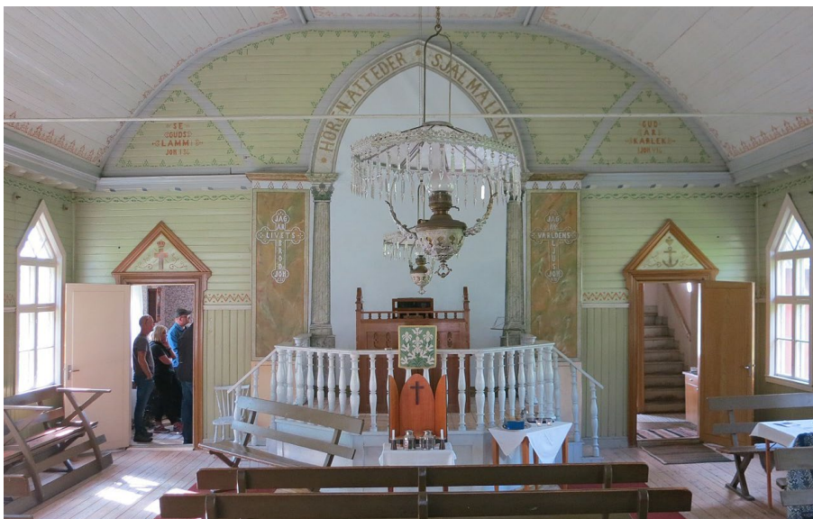
Figur 29. Stora salen i Rydöbruks missionshus har rik utsmyckning.

Älvhytte missionshus i Nora, skiljer sig - förutom sin relativt unga ålder - från Kungsbergs bönhus också på det viset att dess sal är smyckad med en ursprunglig dekormålning av bygdemålaren Fredrik Wiberg. Det interiöra måleriet är påkostat och knyter an till en utsmyckning som står att finna i ett traditionellt kyrkorum.