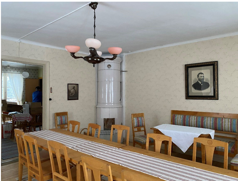
Figur 26. Den övre salen sedd mot köket.