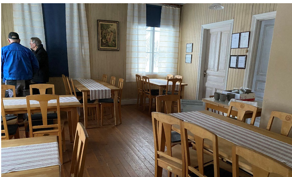
Figur 18. Lilla salen sedd från öppningen mot stora salen. Dörren till vänster leder ut till farstun, den högra dörren leder in till köket.

Lilla salens brädgolv är fernissat, väggarna är klädda med en ljus grågul pärlspontpanel. Lister och foder är ljus grå. Taket består av ljus gråmålad pärlspontpanel. I rummet finns en utskjutande murad del till vilken en plåtdörr leder in. Denna del hör ihop med det tidiga värmesystemet, men används idag mer som en skrub. Från lilla salen leder två spegelindelade dörrar vidare till farstun och till köket.