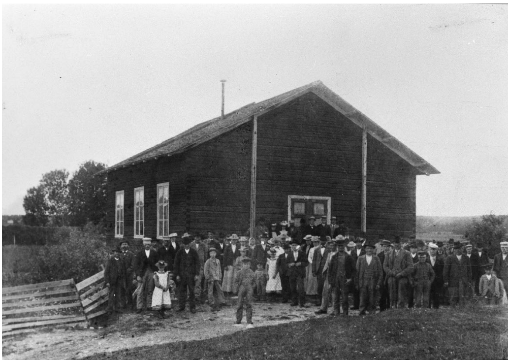
Figur 6. Kungsbergs bönhus, förmodligen i slutet av 1800-talet. Foto ur Läns museet Gävleborgs fotosamling. Beteckning: XLM.A98-437.

Kungsbergs bönhus stod klart 1889. Det sägs att det var Per Skog och Per Persson från Kungsberg som ritade huset, men några ursprungliga ritningar som styrker detta har inte återfunnits. Mest troligt är att de båda byggde huset med hjälp av den hantverkskunskap och erfarenhet som traderades mellan byggnadskunniga personer på dåtidens landsbygd. Några ritningar behövdes inte. De båda herrarnas underskrifter återfinns dock i det ovan nämnda brevet. Huset uppfördes av timmer i en rektangulär form, 11,25 x 9,25 meter. 18 Fasaderna rödfärgades direkt på det synliga timret. Fönstren var sexdelade tvålufts-fönster, en modell som var vanlig i bostadshus vid tiden. Entrén var placerad på gaveln. Byggnadens exteriör saknade i övrigt arkitektoniska utsmyckningar och andra kyrkliga karaktärsdrag. Invändigt bestod byggnaden av en enda sal, som nåddes utan någon egentlig farstu. I denna tidigaste sal saknades bänkinredning; gudstjänstbesökarna satt på plankor utlagda på bockar. Den första större förbättringen av bönhuset skedde år 1896, då fasaderna kläddes med stående pärlspontpanel som målades vit. Fyra år senare, år 1900, tillkom bänkinredningen bestående av fristående bänkar placerade i två kvarter. Några av dessa ursprungliga bänkar finns fortfarande kvar. Vid samma tid målades också interiören. 19 Samma år startades en ungdomsförening upp, vilken kom att verka in på 1920-talet. 20