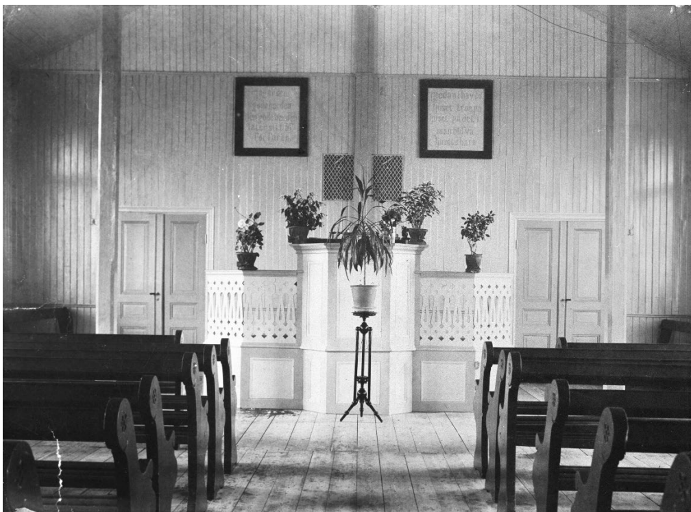
Figur 8. Bönhussalen efter år 1900, då bänkinredningen tillkom. Salen är fortfarande bevarad i intakt skick, förutom att de flesta bänkar har nytillverkats med de ursprungliga som förlagor. Avsaknaden av utsmyckning vittnar om att ordet var det centrala i gudstjänsterna. Notera de två gjutjärnsgallren i väggen bakom podiet. Genom dessa leddes varm luft ut till stora salen från en kamin som var placerad i ett litet utrymme i lilla salen. Läns museet Gävleborgs fotosamling. Beteckning: XLM.A98-438.