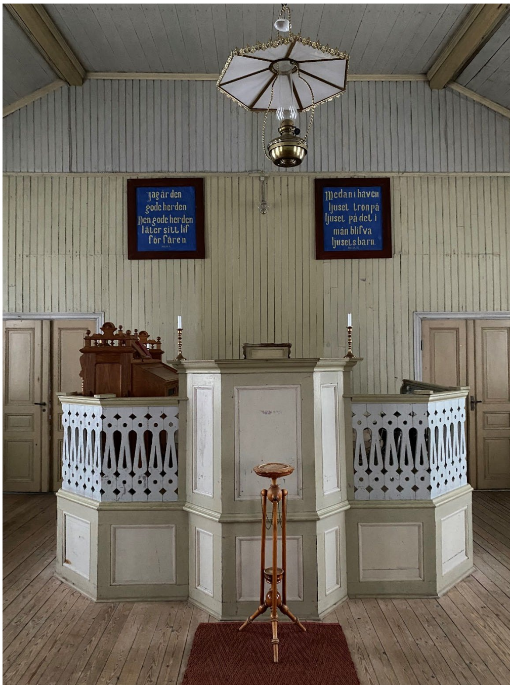
Figur 16. Podiet med predikstol utgör det självklara blickfånget i bönhusalen.