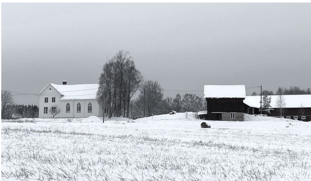
Figur 10. Kungsbergs bönhus sett från Kungsbergsvägen.

Kungsbergs bönhus är beläget på en höjd i ett väl synligt läge i bymiljön. Huset är placerat med den stora salen i öst-västlig riktning. Den östra gaveln vetter mot byvägen. En liten stentrappa leder upp från vägen till marknivån utanför huset. Den västra gaveln avslutas genom den tvärställda tillbyggnaden från 1909.