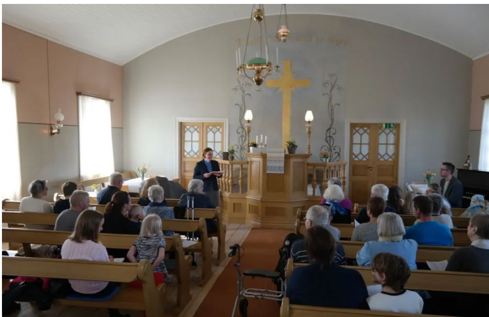
Figur 29. Salen i Härnäs Missionshus har påkostad utformning i det ådringsmålade podiet med predikstol och de båda flankerande dörrarna.

Härnäs missionshus i Östergötland hör också till en av missionsrörelsens tidiga byggnader. Också denna byggnad saknar exteriöra tecken på dess religiösa innehåll, medan salens utformning i högre grad närmar sig ett traditionellt kyrkorum med sin ådringsmålade inredning i podium, predikstol och bänkar. Därtill har de två dörrar som flankerar podiet välarbetade snickeridetaljer i de spröjsade fönsterpartierna.