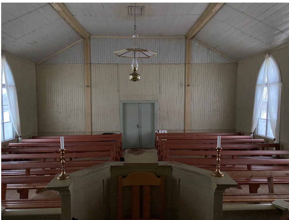
Figur 15. Stora salen sedd från predikstolen mot farstun. Längst fram står bevarade bänkar från år 1900. De bakomvarande är nytillverkade med de gamla som förlaga.