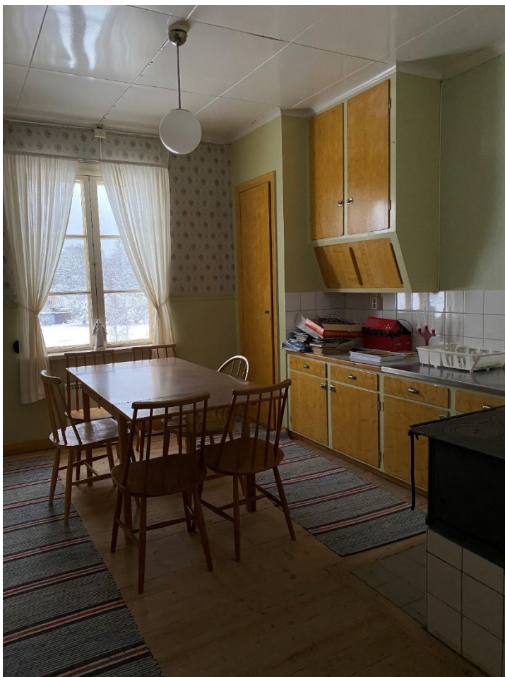
Figur 22. Köket i lägenheten på första våningen.