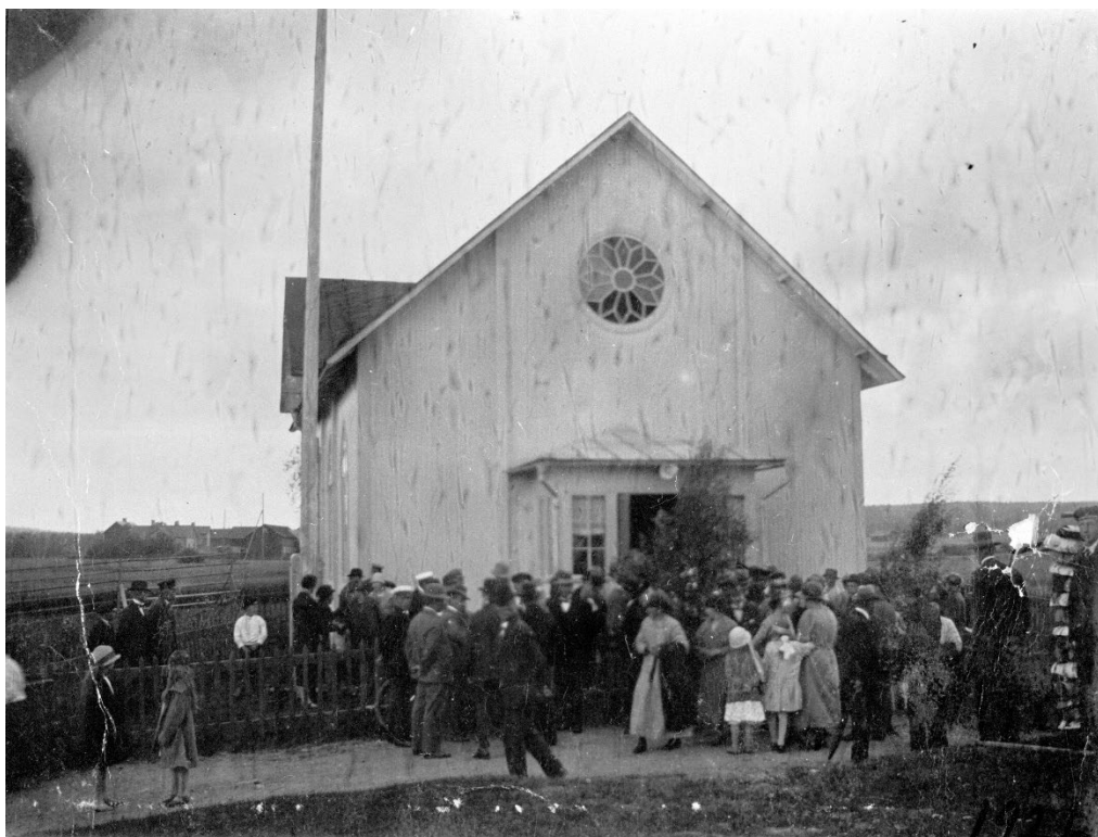
Figur 7. Kungsbergs bönhus 1921. Besökarna trängs utanför bönhuset som då hade fått den form som det fortfarande har. Beteckning: XLM.A98-440.

Vid samma ombyggnad fick den ursprungliga byggnadens tak en brantare resning. De rakt avslutade fönstren byggdes om till spetsbågiga fönster med nygotiska drag. Den östra gaveln försågs med ett rosettfönster. De nya fönstren gav byggnaden en kyrklig karaktär som den tidigare inte haft. Exteriört skedde dessutom vissa praktiska och tekniska förbättringar. Spåntaket ersattes med falsad plåt och vid huvudentrén mot öster byggdes en liten farstu. 24