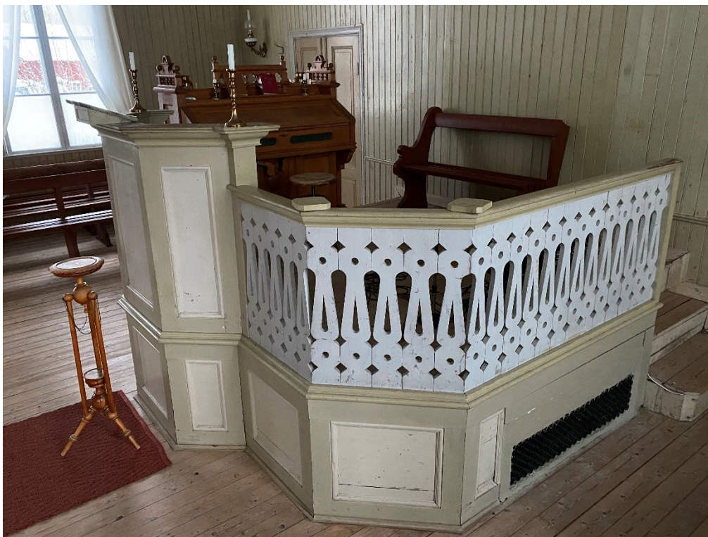
Figur 17. Podiet med predikstol. Notera den gallerförsedda öppningen i basen. Genom denna leddes värmen ut från pannan i källaren.