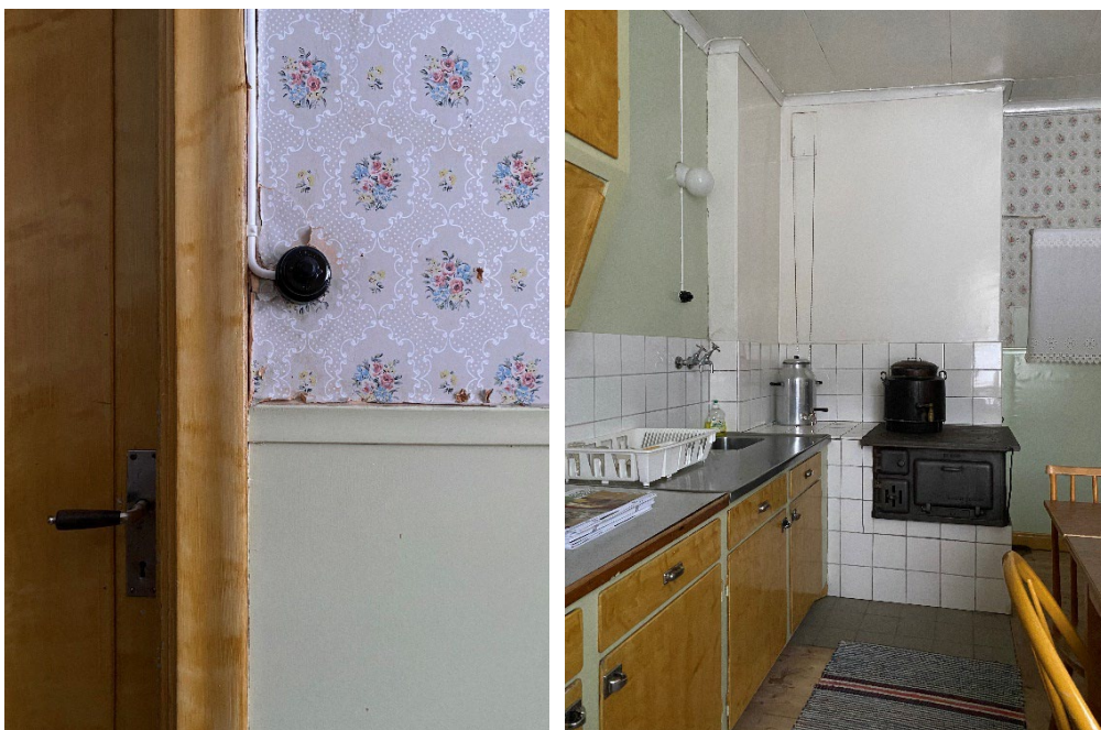
Figur 23 och 24. Detaljer från övre köket.