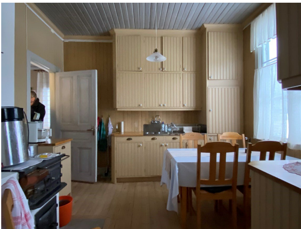
Figur 19. Köket sett från öppningen mot stora salen. Inredningen som tillkom vid en renovering i början av 2000-talet är tillverkad av Asta Snickerier i Söderala, Hälsingland.

Köket på bottenvåningen renoverades i början av 2000-talet om i en äldre stil med en köksinredning med pärlspontklädda fronter och porslinsknoppar. Inredningen är tillverkad av Asta Snickerier i Söderala, Hälsingland. I övrigt är tidigare ytskikt bevarade. Golvet består av obehandlade brädor, väggarna är klädda med en ljus grågul pärlspontpanel, med lister i samma kulör. Dörrfoder är profilerade och målade i en ljus grå kulör. I köket finns en järnspis från Skoglund & Olson.