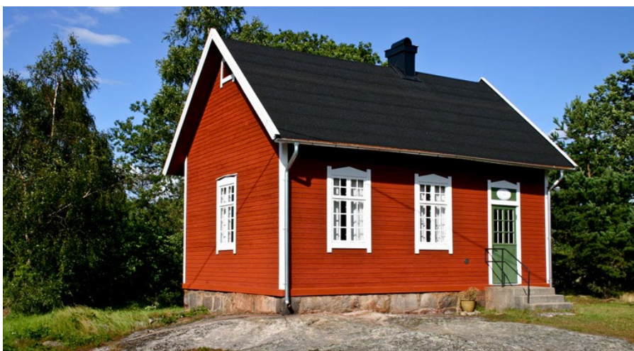
Figur 30. Jordö missionshus är byggt direkt på en klippvall.

Jordö missionshus i Ronneby har rödfärgade fasader och vita snickerier och ett exteriört formspråk som kan liknas vid en traditionell stuga, om än med en något mer högrest form. Missionshuset är beläget i skärgården och uppfört direkt på en klippvall. I och med dess läge uppfördes det redan från början som en samlingslokal för olika församlingar; här samsades Baptister, Evangeliska Fosterlandsstiftelsen, Svenska Missionsförbundet och Pingströrelsen om lokalerna.