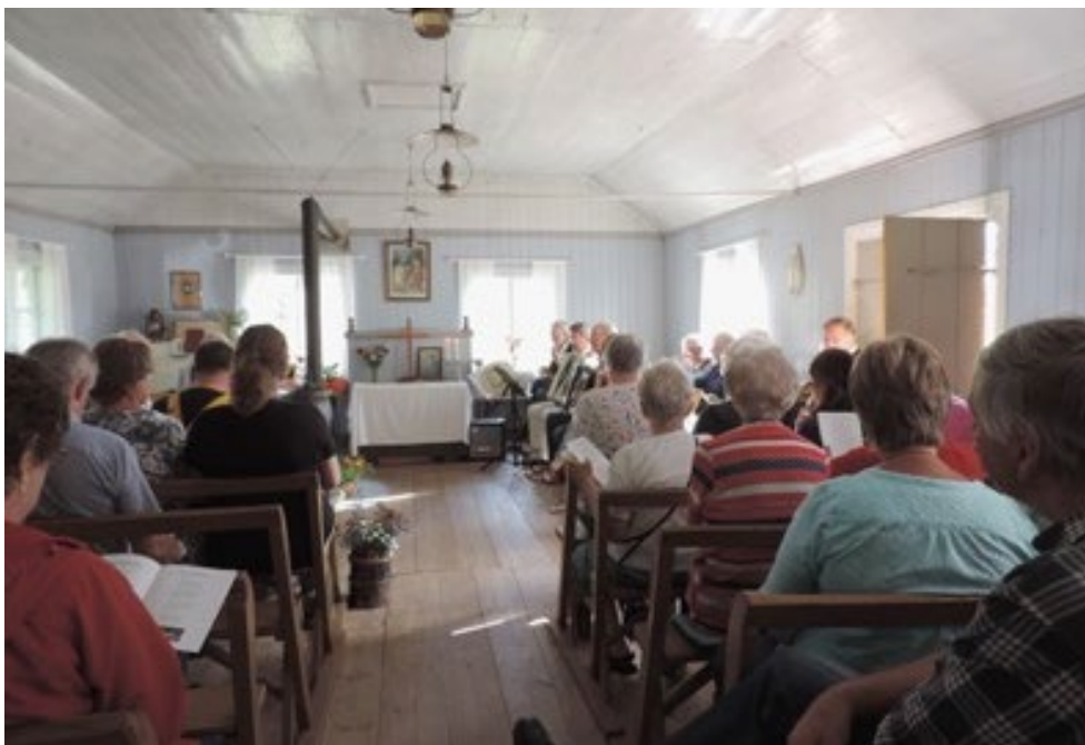
Figur 30. Tivedstorps missionshus, stora salen.

Tivedstorps missionshus i Laxå har en enkel karaktär, i likhet med Kungsbergs bönhus. Men salens religiösa funktion är relativt svårtydd då där inte finns något podium och/eller en predikstol.