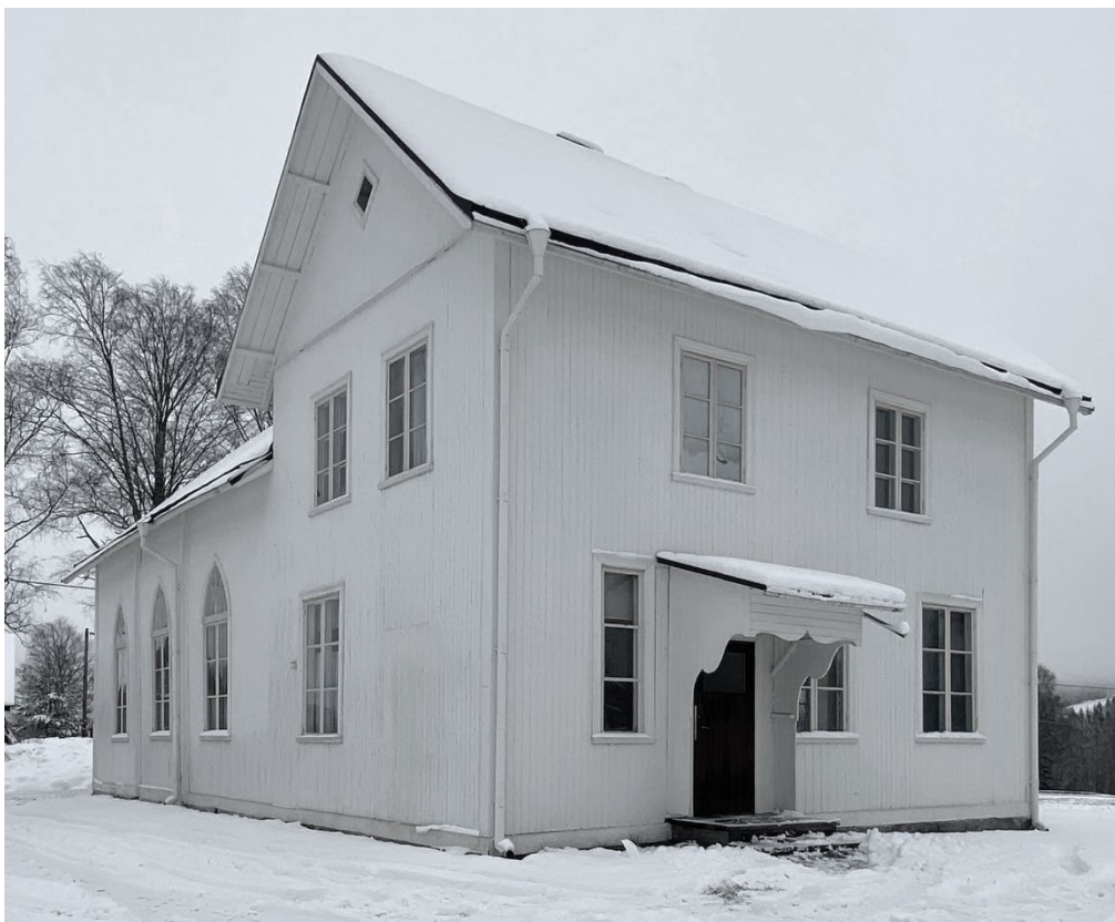
Figur 12. Bönhuset sett från väster. Den tvärställda tillbyggnaden i två våningar uppfördes 1909 och från början låg den sekundära entrén på den norra sidan. Öppningens läge anas i panelen till höger om fönstret. Ingången flyttades till den västra sidan i samband med en renovering 1957.