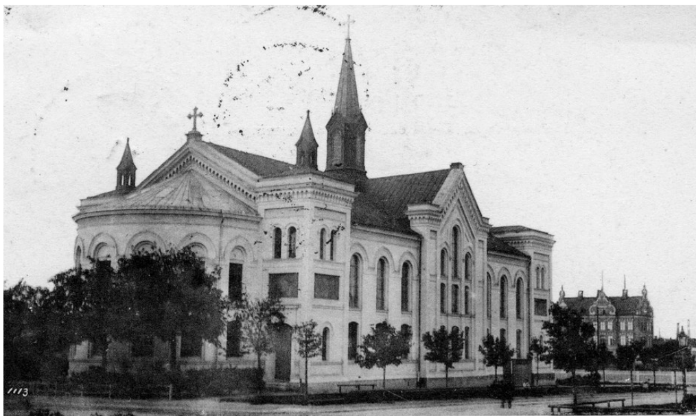
Figur 4. Betlehemskaapellet från sydväst omkring 1903. Fotot är något beskuret. Vykort ur Läns museet Gävleborgs fotosamling. Beteckning på DigitaltMuseum: XLM.Westling36.

mot öster och på taket tronade en 18 meter hög takryttare, ett torn krönt med ett förgyllt kors. Den rymde inga kyrkklockor utan fungerade som ventilationsanläggning. Takryttarens tillkomst var inte helt oproblematis, dess vara eller icke vara diskuterades under bygget. Ingen annan missionskyrka i Sverige hade nämligen ett torn. Betlehemskaapellet blev landets första missionskaPELL med torn. 10 Några år efter att kapellet stod klart dekorerades fasaderna med Sgraffittomålningar föreställande bibliska motiv. Utsmyckningen gjordes av den nationellt kände bildhuggaren C. J. Dyfverman. 11