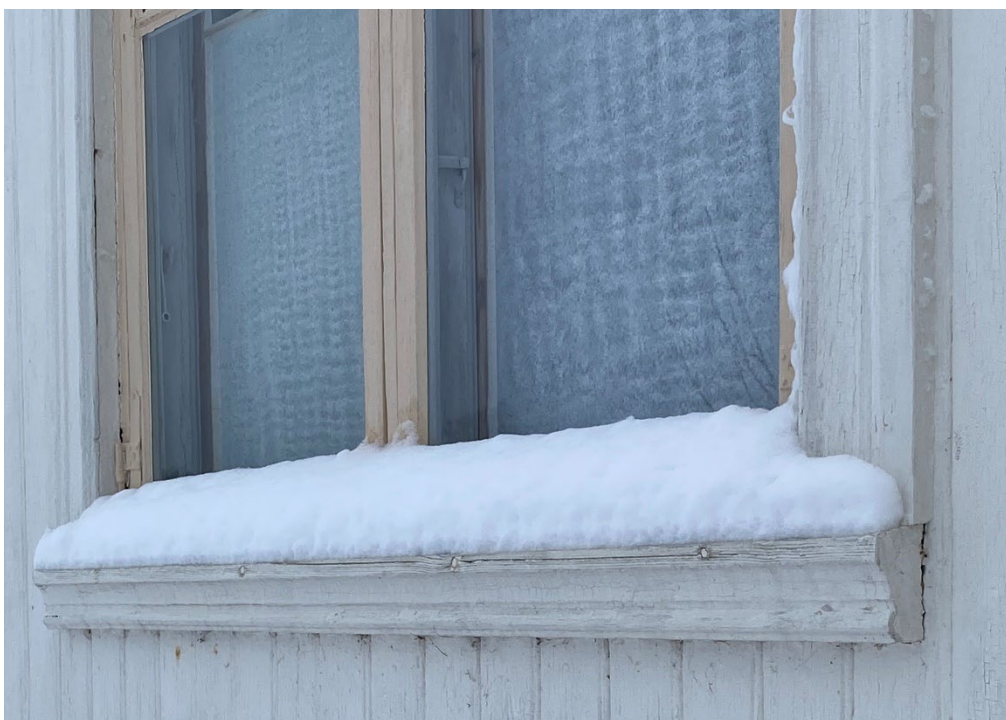
Figur 13. Närbild på panel, fönsterfoder och fönsterbågar.