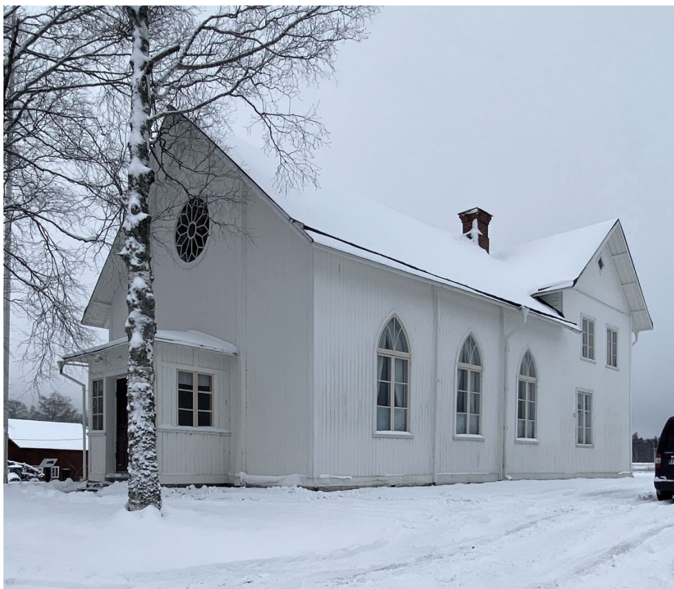
Figur 11. Kungsbergs bönhus sett från nordöst.

Bönhusets sockel består dels av synlig tuktad granit, dels av gjutna delar. Fasaderna är klädda med stående vitmålad pärlspontpanel som nedtill avslutas genom en sockelbräda i samma kulör. Stora salens läge markeras i fasaden genom höga spetsbågiga fönster, tre på vardera långsidan. Fönstren i delen från 1909 består av tvåluftsfönster med bågar om tre rutor. Entrégaveln mot öster pryds av en liten glasad veranda i en våning. Dubbeldörrar med spegelindelning, målade i brunröd kulör, leder in till bönhuset. På den östra gaveln finns ett stort rosettfönster. Samtliga fönsterbågar är i trä och målade i en grågul kulör. Fönsterfoder och övriga lister är profilerade och målade i samma kulör som fasadpanelen, det vill säga vit. En sekundär entré finns från den västra sidan, dörren har karosseripanel och är sannolikt original från 1957. Ett entrétak, uppburet på panelklädda konsoler, skyddar entrén. Sadeltaken är branta och belagda med svartmålad falsad plåt.