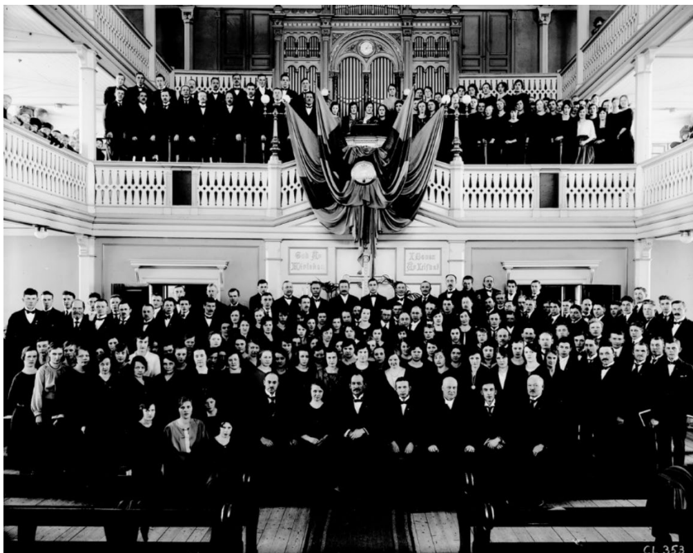
Figur 5 Betlehemskaapellets sångkör 1925. Beteckning på DigitaltMuseum: XLM.CL000353.

Erik Alfred Hedins uppdrag för Svenska Missionsförbundet blev med tiden mycket omfattande. På uppdrag från förbundet upprättade Erik Alfred Hedin, år 1890, förslagsritningar till missionshus i två olika storlekar. Två år senare utkom Hedin med häftet Förslagsritningar till bönhusbyggnader jämte beskrifning och materialförslag på uppdrag av Svenska Missionsförbundets styrelse upprättade af E H, Gefle 1892 . Häftet innehöll ritningar till fyra olika stora bönhus om 300, 500, 700 respektive 900 sittplatser. I häftet fanns även detaljerade arbetsbeskrivningar och materialberäkningar. Uppdragen från Svenska Missionsförbundet förmedlades med största sannolikhet till honom genom P. P. Waldenström, som vid tiden satt i Missionsförbundets Centralkommitté.