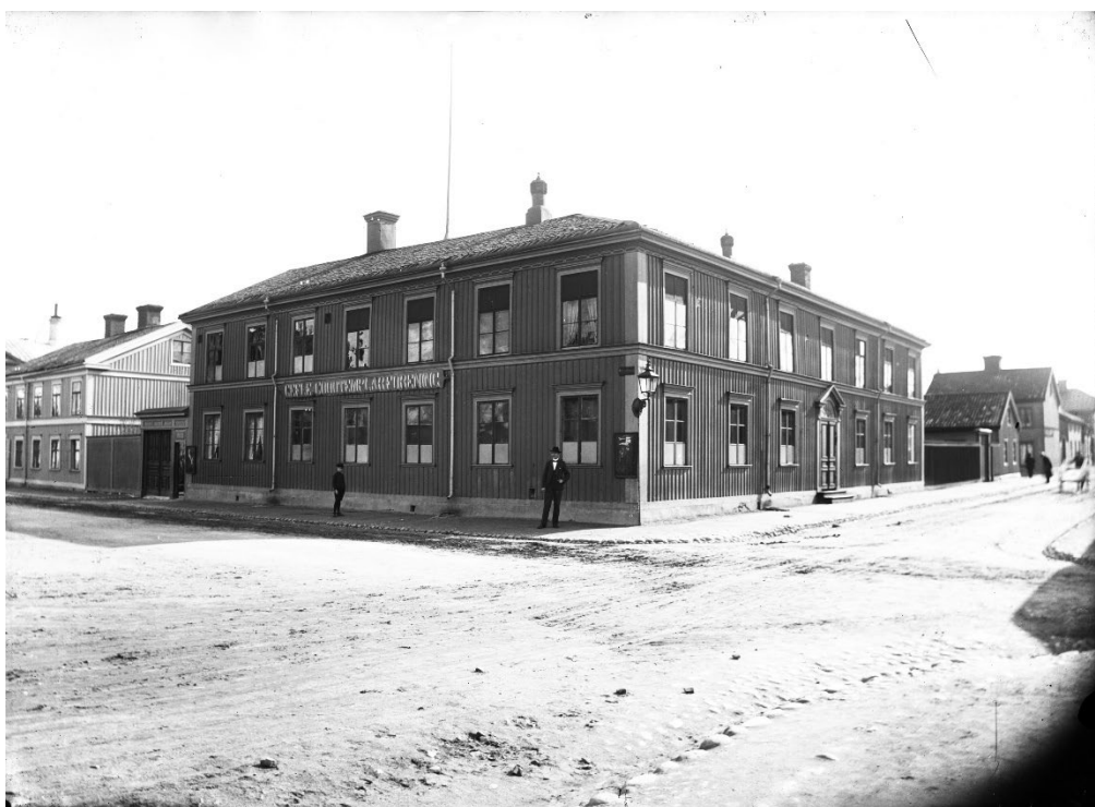
Figur 2. Det äldsta fotografiet som finns på Södra bönehuset i DigitaltMuseum. Fotot antas vara från omkring år 1900 och här hade missionsföreningen redan sålt sitt bönehus vidare till Gefle Godtemplarförening. Den ursprungliga byggnadskroppen är den till höger, som vetter ut mot Brunnsgatan. Tillbyggnaden mot Södra Kansligatan tillkom 1867.