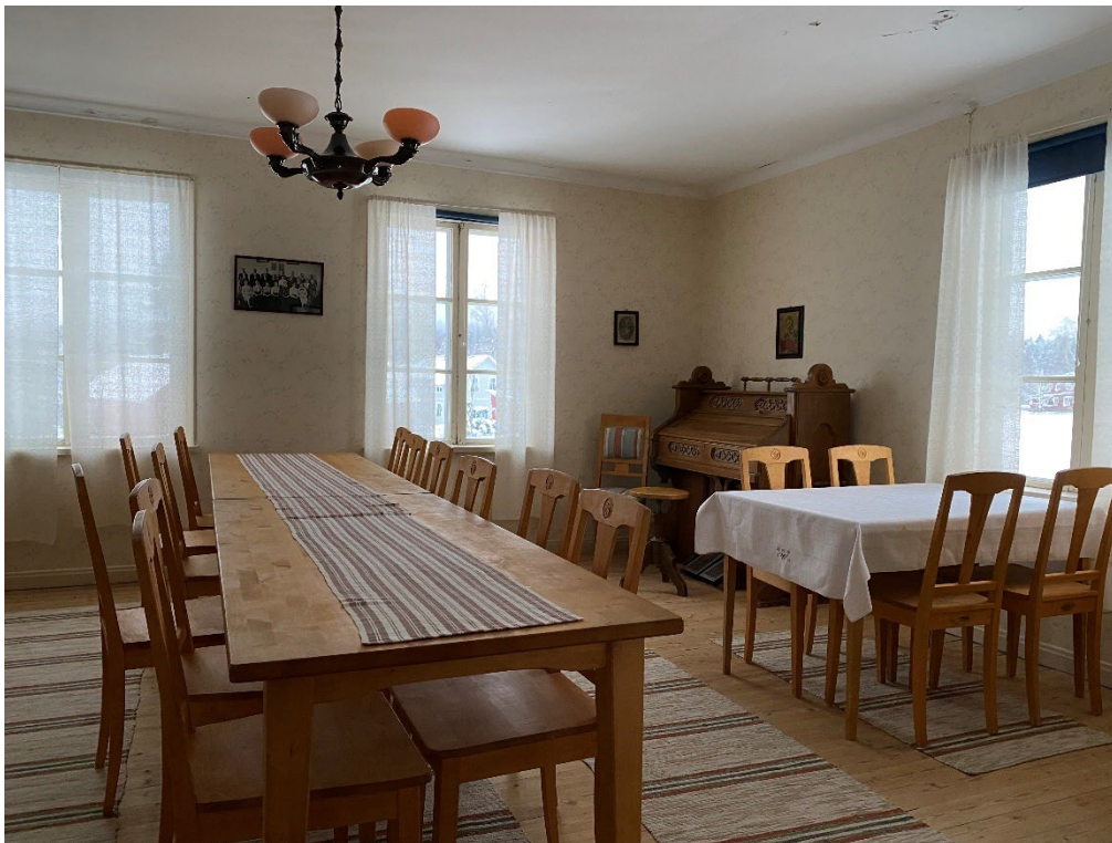
Figur 25. Den övre salen är tidstypiskt uppmöblerad.

Salen har ett obehandlat brädgolv och väggarna är tapetserade med en skirt blommig tapet i pudriga kulörer. Taket är pappspänt och målat vitt. Lister och foder är vitmålade. I hörnet mot hörnet står en rund vitglaserad kakelugn med mjukt rundade listverk.