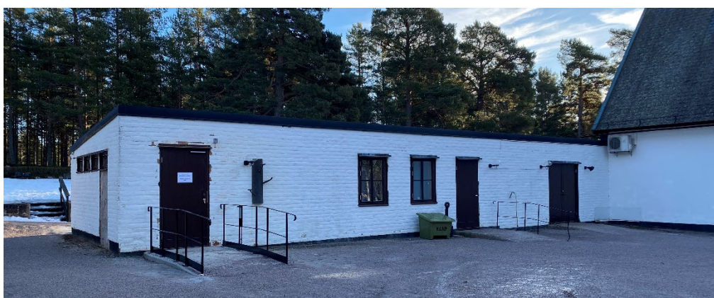
Figur 7. De två högra dörrarna på den västra fasaden är bytta. Den vänstra dörren vid gaveln är nyupptagen och leder in till ett ny RWC.