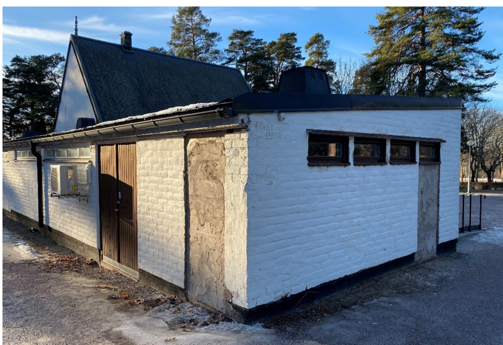
Figur 6. Efter avslutade arbeten. Foto från nordöst. De två dörröppningarna som tidigare ledde in till de två små toalettutrymmena, har satts igen.

De två andra entréerna på den västra långsidan har också försetts med nya dörrar. Båda dessa dörrar är utformade på samma vis som dörren till RWC'n. Dock öppnas dessa dörrar manuellt genom traditionella dörrtrycken.