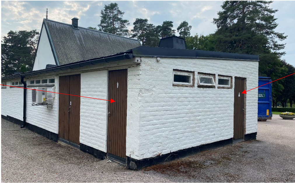
Figur 4. Tillbyggnaden sedd från nordöst, precis i uppstart av arbetena. Pilarna markerar de båda små toalettutrymmena. Vid detta besök hade rivning påbörjats kring de låga gavelfönstren.