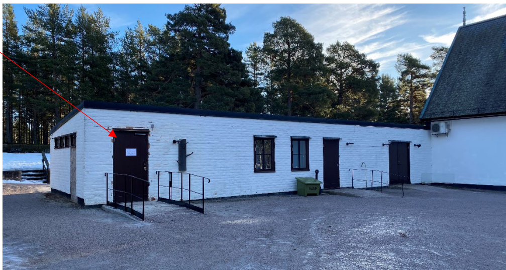
Figur 1. Den låga längan uppfördes 1958 och är hopbyggd med Österheds kapell, uppfört 1925. Den röda pilen markerar dörren in till den nya RWC'n.