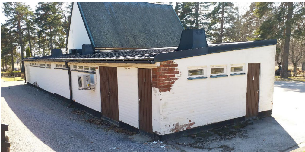
Figur 5. Tillbyggnaden fotad vid ett tidigare rådgivningsbesök, 2018-05-03.