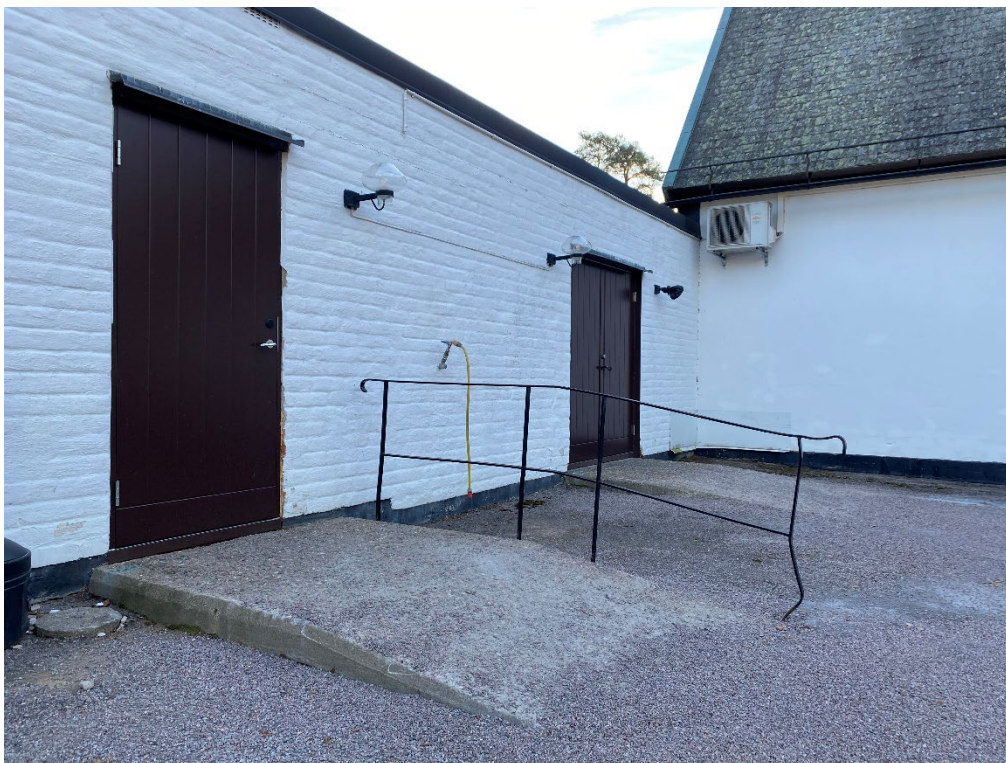
Figur 10. Två befintliga entréer på den västra fasaden har försetts med nya dörrar.