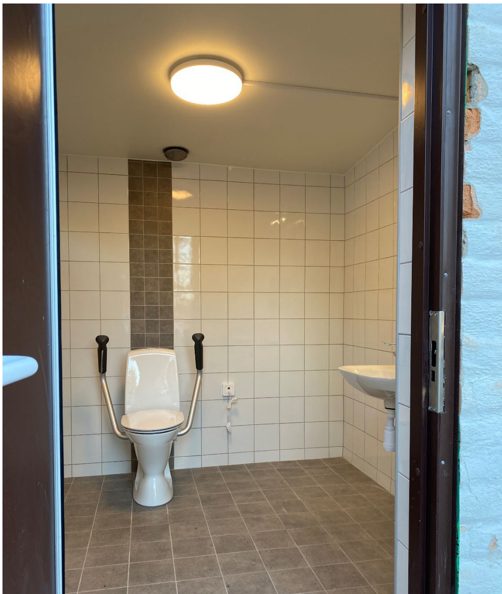
Figur 9. Ny RWC.