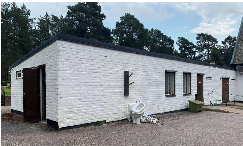
Figur 3. Den låga tillbyggnaden sedd från nordväst precis i uppstart av arbetena. Den öppna dörren på gaveln leder in till ett litet toalettutrymme.

Österheds kyrkogård saknade RWC. De två befintliga toalettutrymmena var i uttjänt skick och dessutom inte tillgängliga för alla.