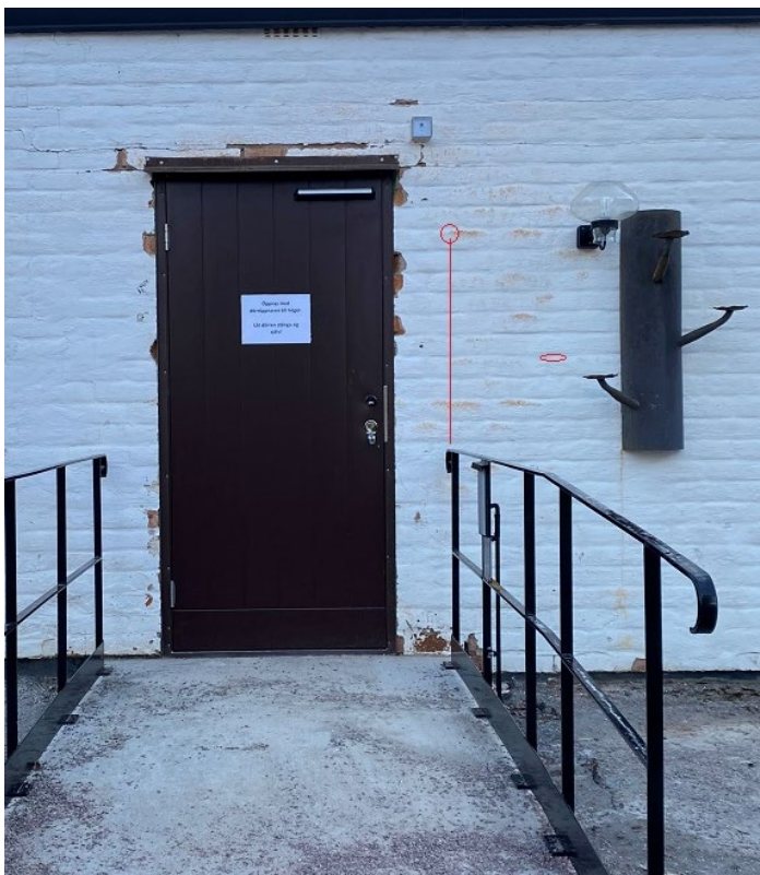
Figur 11. Den vägghängda armaturen ska flyttas närmare dörren och sättas på samma linje som räcket.

De två andra entréerna på västra sidan saknar dörrstopp. En kupa på en av armaturerna har tidigare gått sönder på grund av att ett av dörrbladen hastigt blåste upp på den. Det är positivt om det går att hitta en lösning på dörrstopp.