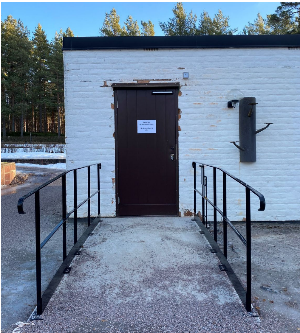
Figur 8. Den nya RWC'n nås via en gjuten ramp. Ledstänger med avåkningskydd har monterats på båda sidor av rampen. Snett till höger ovanför dörren sitter en sensor. Den vägghängda armaturen är nytillkommen.