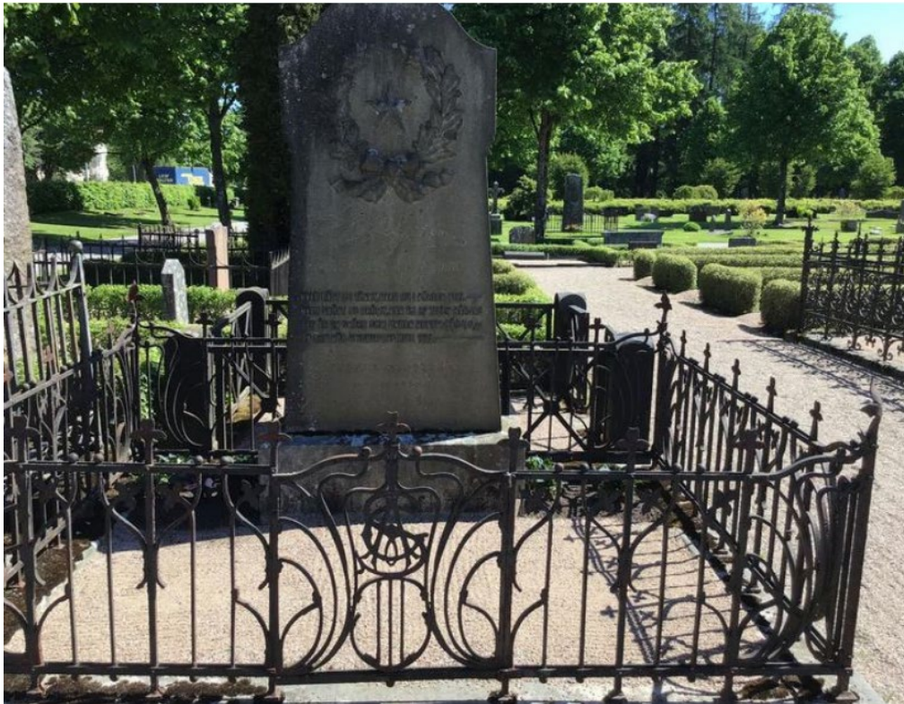
Figur 10. K03 0247 innan påbörjade arbeten. Smidesstaket monterat i stenram. Foto: Kyrkogårdsenheten, Gävle församling, oktober 2020.