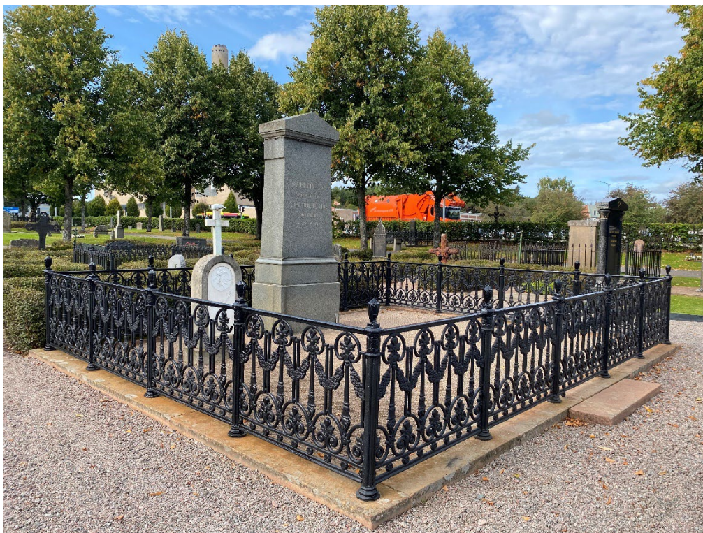
Figur 22. K03 0340 efter avslutade arbeten. Stensockeln har justerats och gjutjärnsstaketet har renoverats.