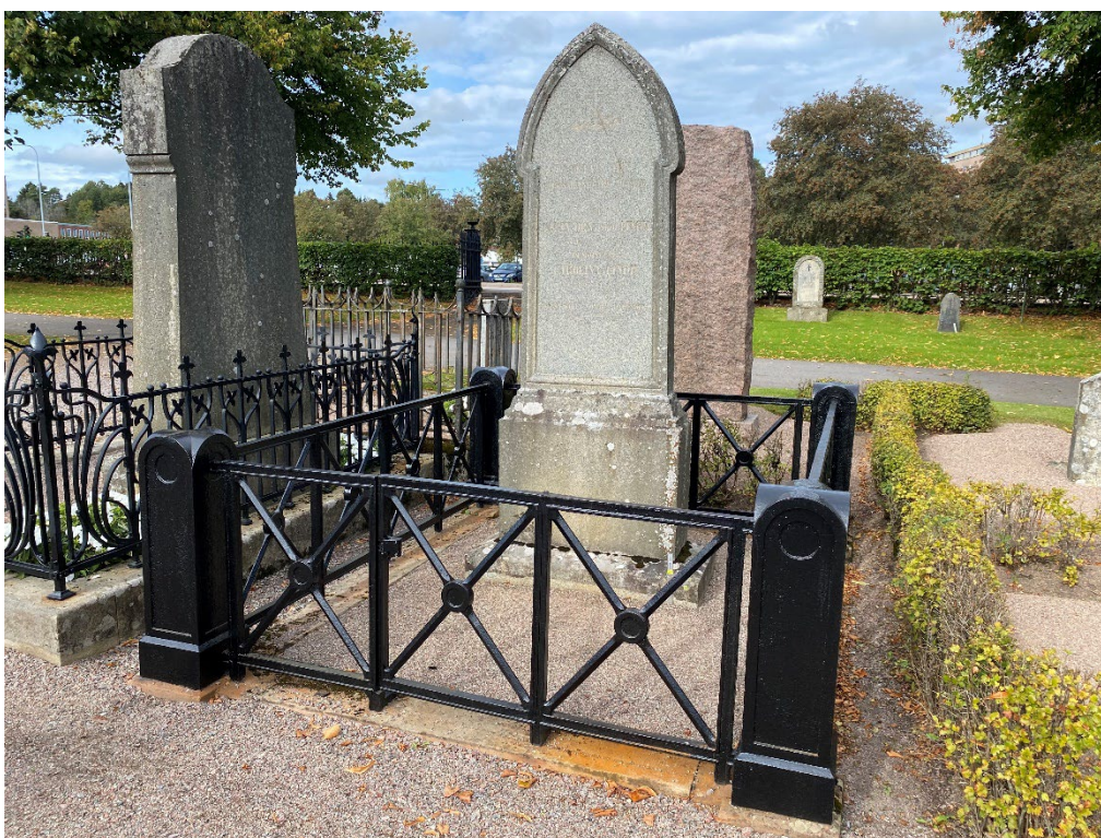
Figur 9. K03 0246 efter avslutade arbeten.