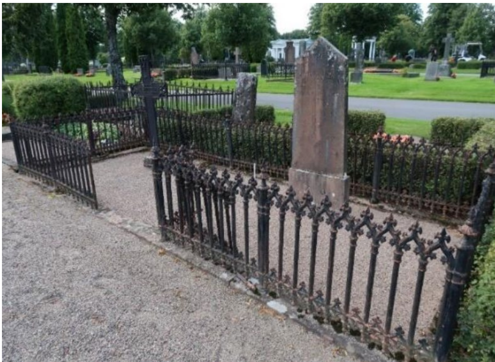
Figur 5. K03 0187 före åtgärd. Gjutjärnsstaket i behov av renovering, sättningar i stenramen. Grinden står löst lutad mot en staketsektion. Foto: Kyrkogårdsenbeten, Gävle församling, oktober 2020.