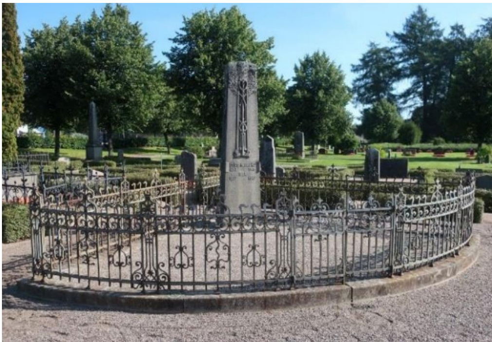
Figur 25. K03 0345 innan påbörjade arbeten. En av två gravplatser med tårbitsform. Denna ligger på den östra sidan av den tidigaste huvudentrén in till kyrkogården från Västra vägen. Foto: Kyrkogårdsenheten, Gävle församling, oktober 2020.