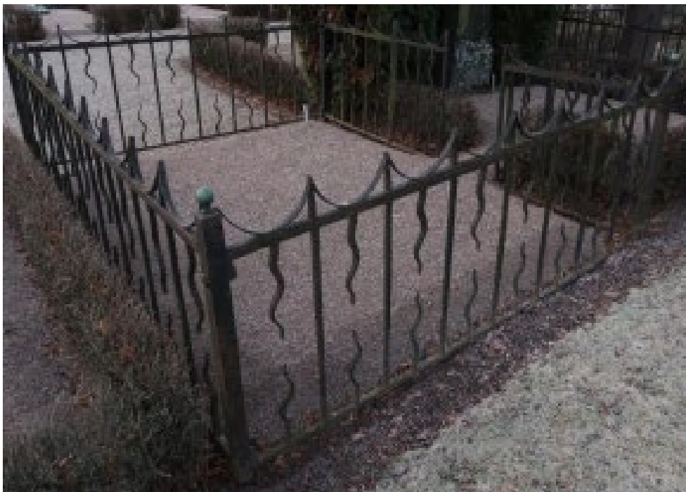
Figur 2. K03 0077 före åtgärd. Smidesstaket i behov av renovering. Staketet är monterat på stenplintar. Graven har inte kvar någon gravsten. Grinden fanns ej på plats. Staketet är monterat i stenklackar. Foto: Kyrkogårdsenheten, Gävle församling, oktober 2020.