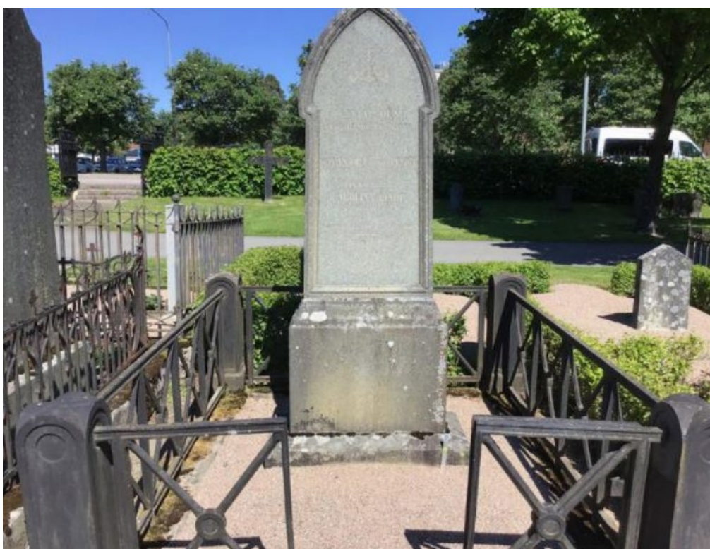
Figur 7. K03 0246 innan påbörjade arbeten. Gjutjärnsstaket med kraftiga hörnstolpar monterade i en stenram. Foto: Kyrkogårdsenheten, Gävle församling, oktober 2020.