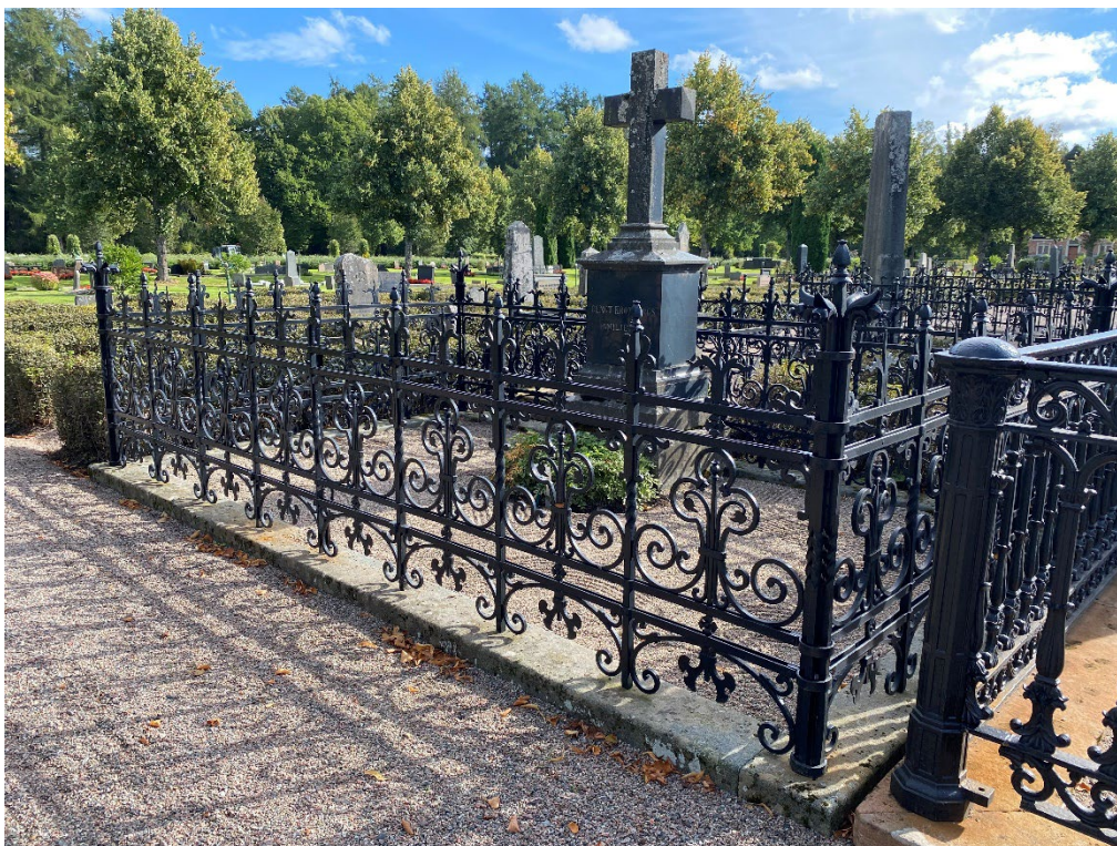
Figur 16. K03 0250 efter avslutade arbeten. Stensockeln är riktad och smidesstaketet renoverat.