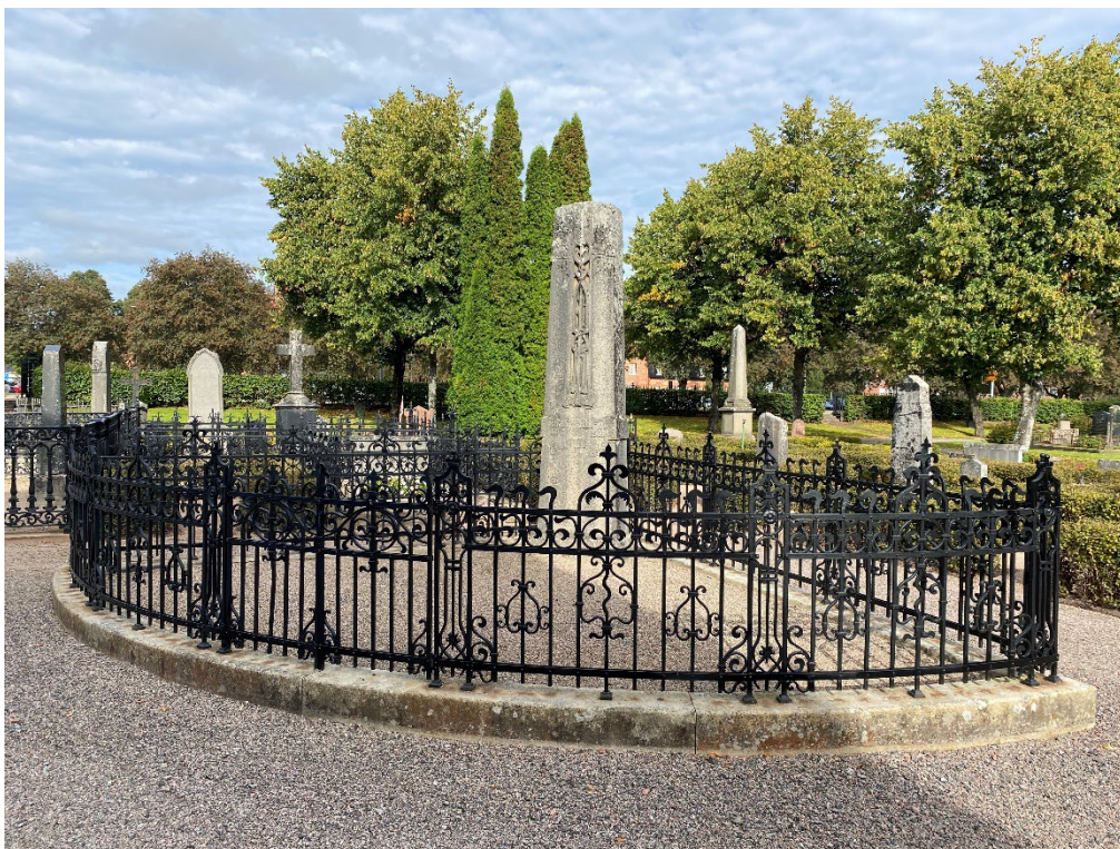
Figur 26. K03 0345 efter avslutade arbeten. Stenramen är justerad och staketet är renoverat. Staketet är målat svart trots framtagna kulörkod.