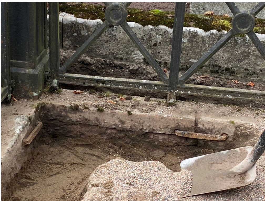
Figur 8. K03 0246 under pågående arbeten med stenramen. Äldre kramlor blev synliga.