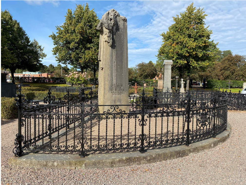
Figur 24. K03 0344 efter avslutade arbeten. Stenramen är justerad och staketet är renoverat. Staketet är målat svart trots framtagen kulörkod.