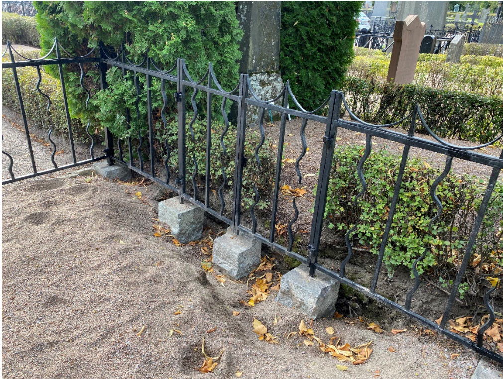
Figur 4. K03 0077 efter åtgärd. Ännu är marken inte uppfylld. Grinden öppnas inåt graven. Stenen som grinden stängs mot har en liten klack för att grinden inte ska kunna glida upp utåt.