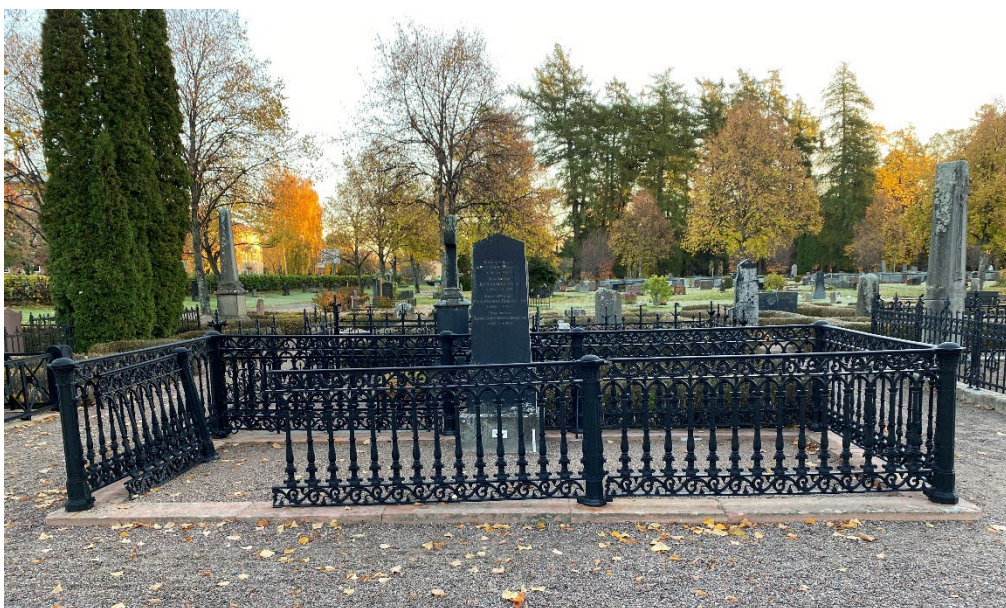
Figur 13. Arbetet med grav K03 0248 var en av orsakerna till att projektet drog ut på tiden. Vid en förväntad slutbesiktning 2022-10-20 såg staketet ut så här. Flera delar var återmonterade i fel läge eller inte återmonterade alls.