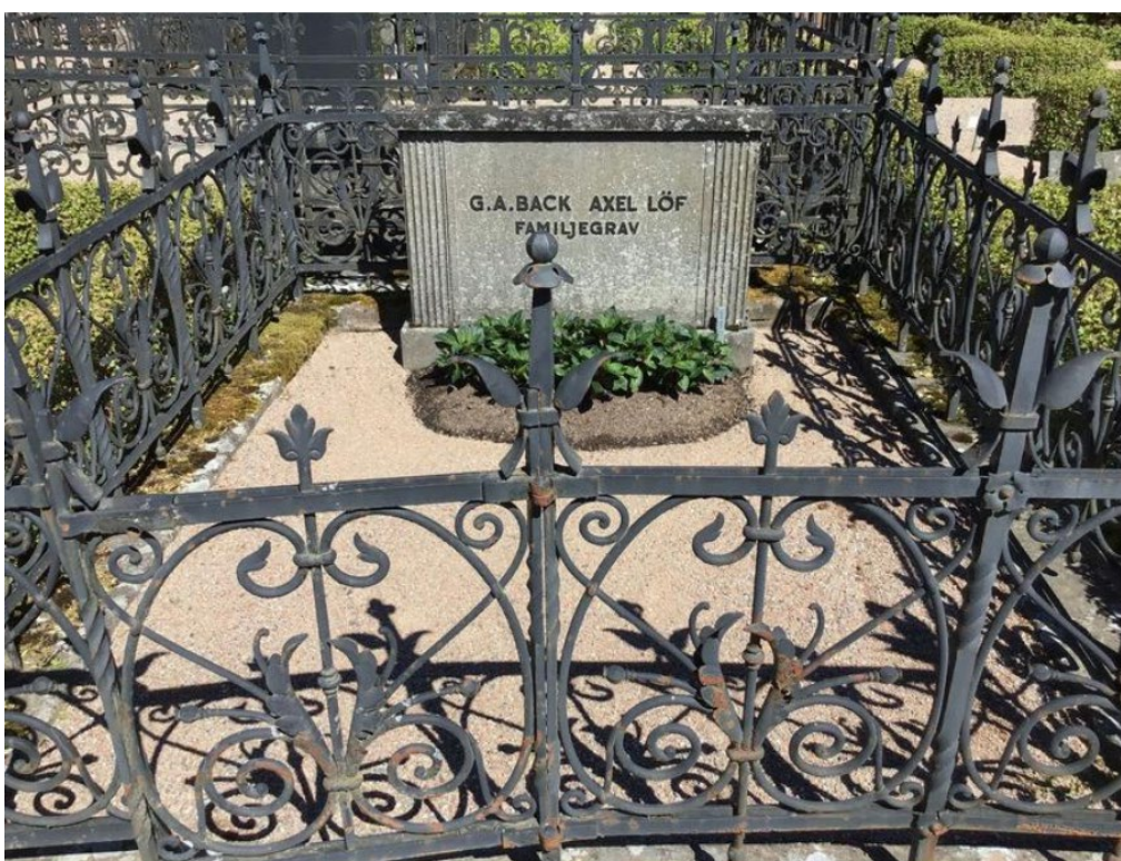
Figur 17. K03 0253 innan påbörjade arbeten. Smidesstaket i behov av renovering, delar har slagit sig på grund av sättningar i stenramen. Grunden går inte att stänga. Foto: Kyrkogårdsenheten, Gävle församling, oktober 2020.