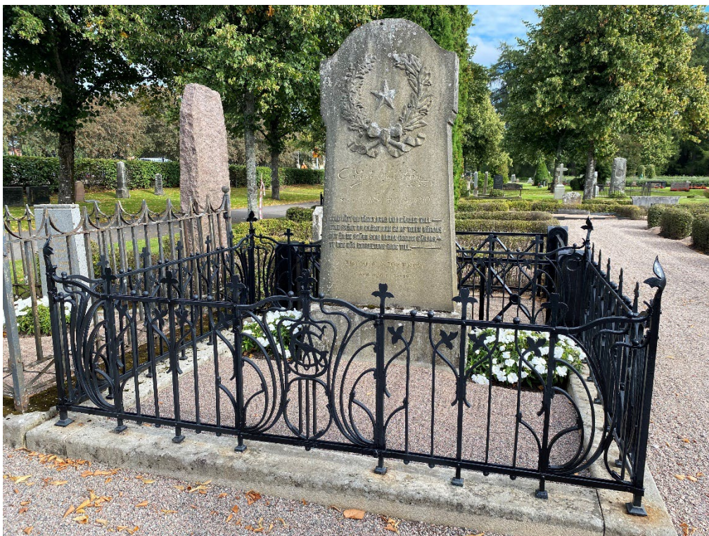
Figur 11. K03 0247 efter avslutade arbeten. Riktad stenram och renoverat smidesstaket.