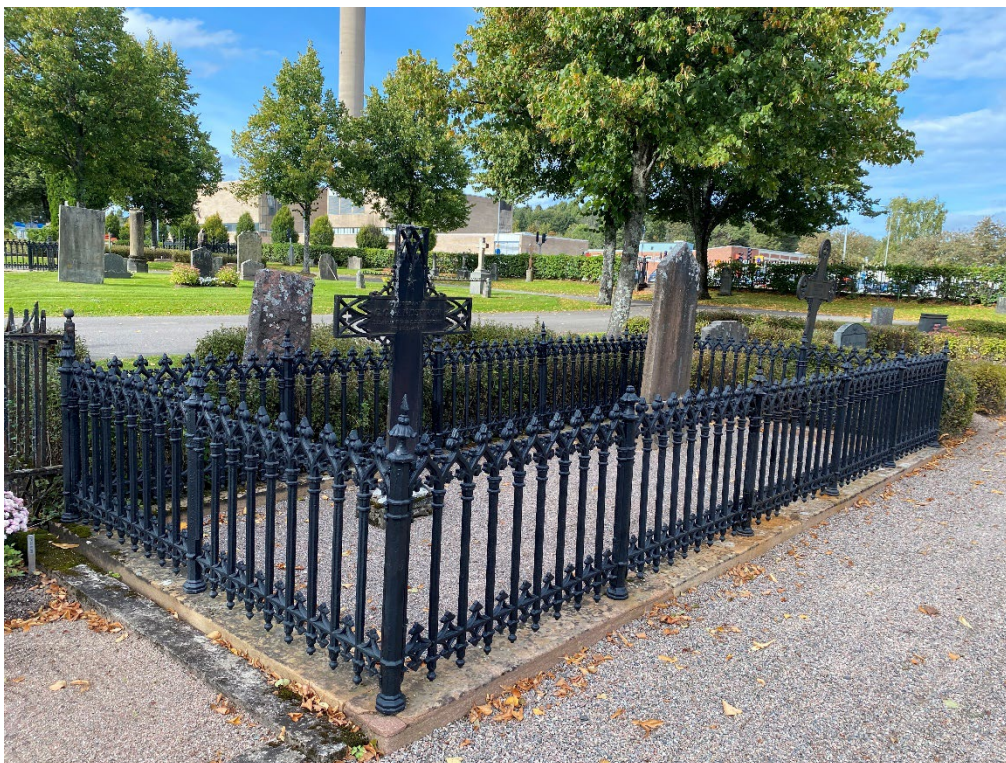
Figur 6. K03 0187 efter avslutade arbeten.