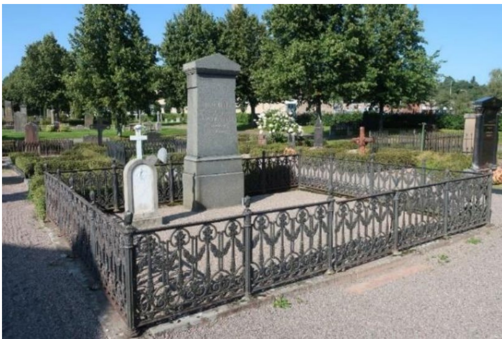
Figur 21. K03 0340 innan påbörjade arbeten. Gjutjärnsstaketet i behov av renovering. Sättningar i stensockeln påverkade även staketet. Grinden går inte att stänga. Foto: Kyrkogårdsenheten, Gävle församling, oktober 2020.