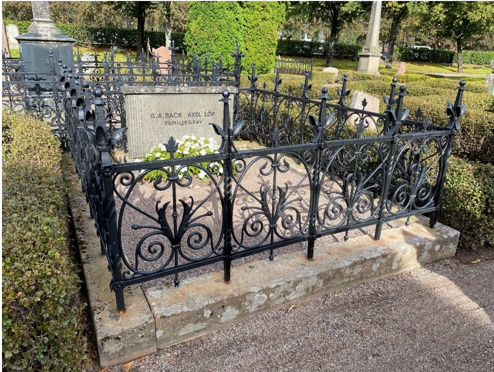
Figur 18. K03 0253 efter avslutade arbeten. Riktad stenram och justerat och renoverat smidesstaket. Stängningsfunktionen på grinden är åtgärdad.