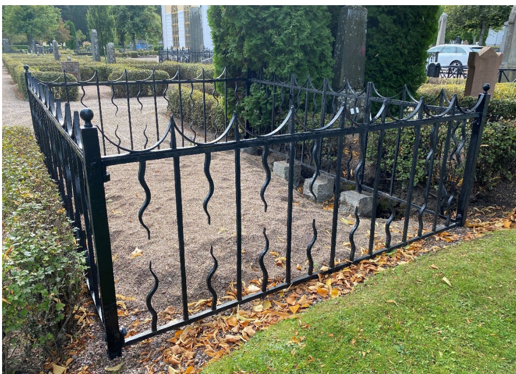
Figur 3. K03 0077 efter åtgärd. Ännu är marken inte uppfylld. Grinden öppnas inåt graven. Stenen som grinden stängs mot har en liten klack för att grinden inte ska kunna glida upp utåt.