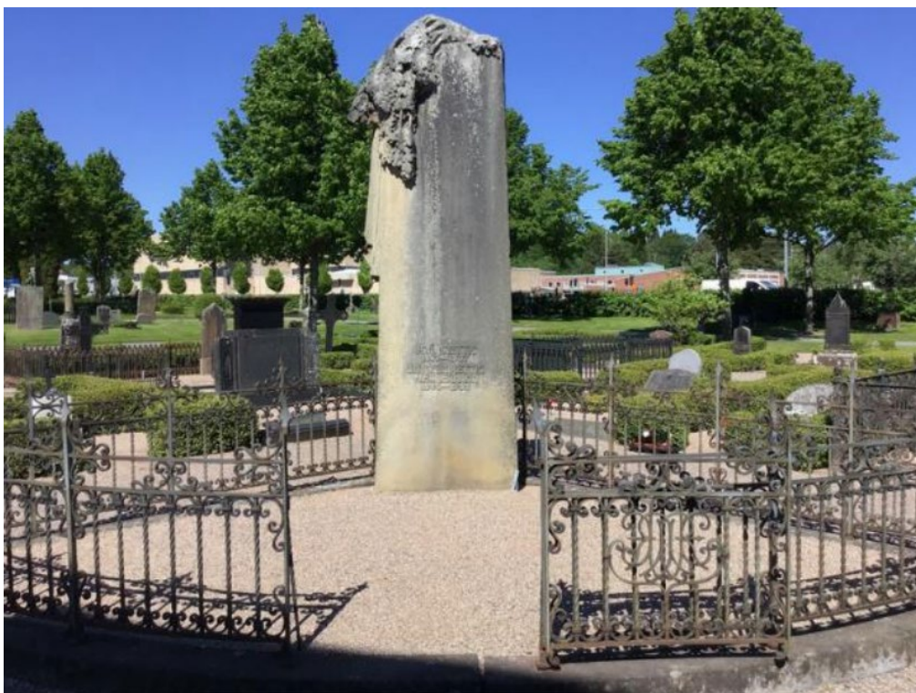
Figur 23. K03 0344 innan påbörjade arbeten. En av två gravplatser med tårbitsform. Denna ligger på den västra sidan den tidigaste huvudentrén in till kyrkogården från Västra vägen. Foto: Kyrkogårdsenheten, Gävle församling, oktober 2020.