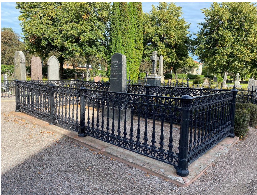
Figur 14. K03 0248 efter avslutade arbeten. Gjutjärnsstaketet är åtgärdat och stenramen riktad. Staketsektionerna är återmonterade i dess rätta lägen.