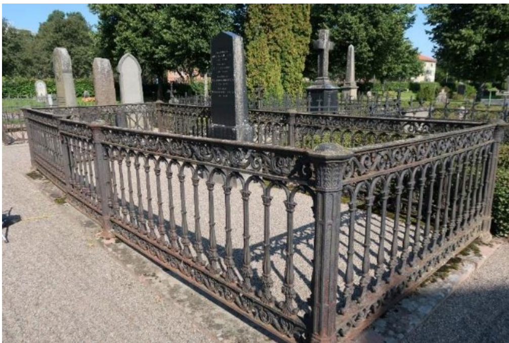
Figur 12. K03 0248 innan påbörjade arbeten. Sättningar i stenram och gjutjärnsstaket. Foto: Kyrkogårdsenheten, Gävle församling, oktober 2020.