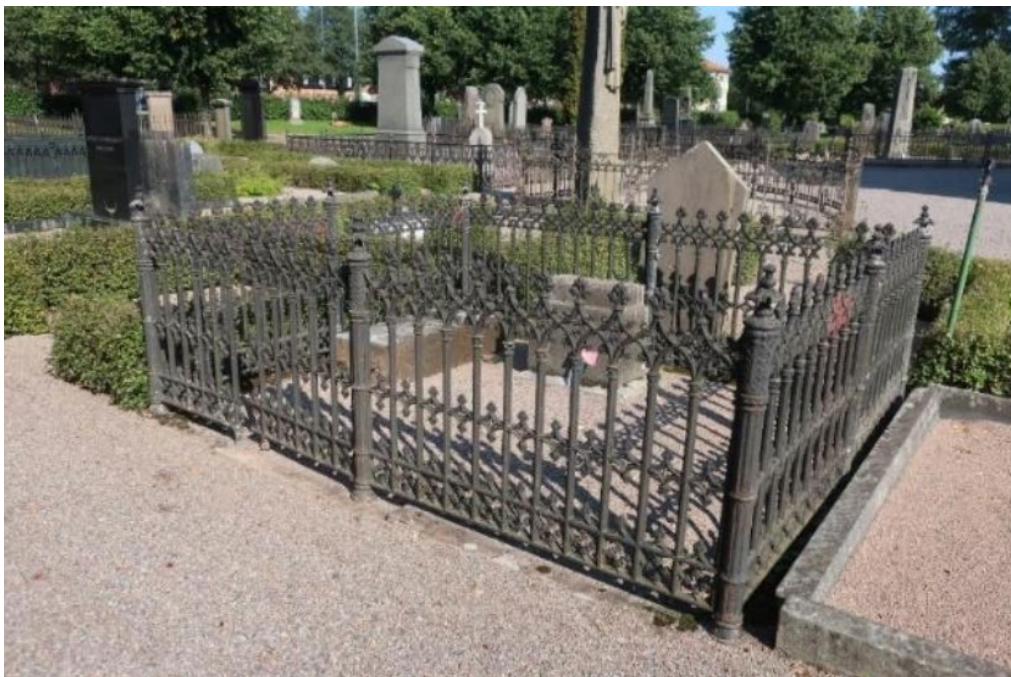
Figur 19. K03 0326 innan påbörjade arbeten. Gjutjärnsstaket i behov av renovering, stenram i behov av justering. Grinden går inte att stänga. Foto: Kyrkogårdsenheten, Gävle församling, oktober 2020.