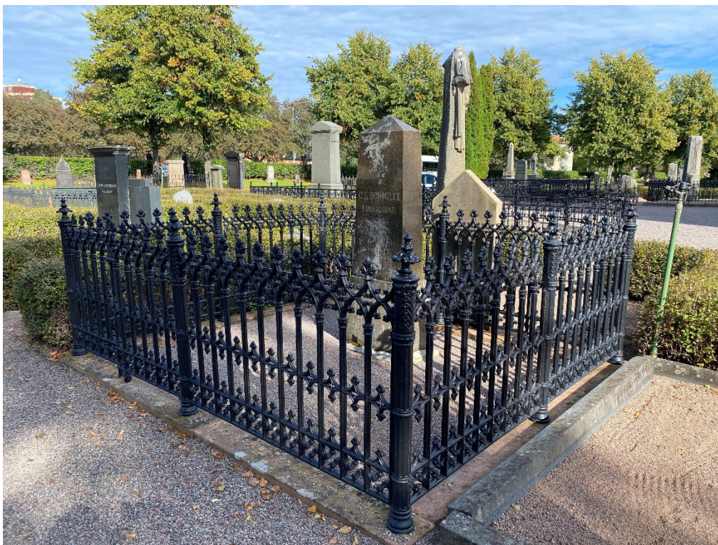
Figur 20. K03 0326 efter avslutade arbeten. Stensockeln har justerats och gjutjärnsstaketet har renoverats. Grinden går att stänga.