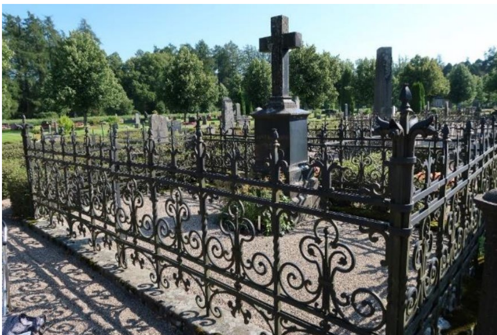
Figur 15. K 03 0250 innan påbörjade arbeten. Smidesstaket i behov av underhåll och stensockel i behov av riktning. Foto: Kyrkogårdsenheten, Gävle församling, oktober 2020.