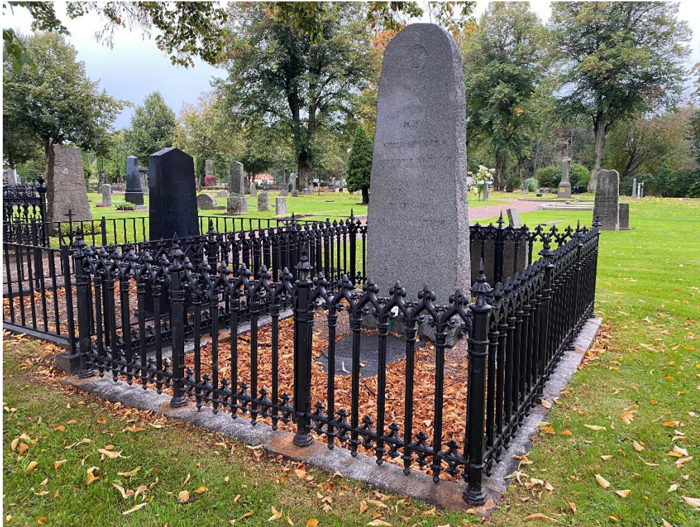
Figur 10. GK06 0303 efter åtgärd. Stensockeln har riktats och gravplatsens ursprungliga marktäckning med grus har återskapats. Gjutjärnsstaketet har lagats och grinden har fullgod stängningsfunktion.