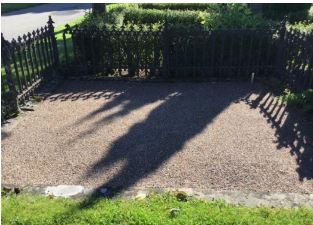
Figur 17. GK05 0135 före åtgärd. Gjutjärnsstaket i behov av renovering. Hela sektioner stod lösa. Det fanns också delar i staketet som saknades. Stensockel i behov av riktning. Foto: Kyrkogårdsenheten, Gävle församling, november 2021.