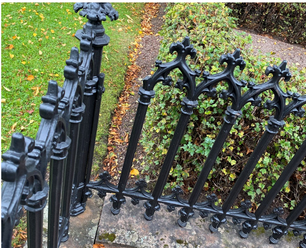
Figur 19. GK05 0135 efter åtgärd. Gjutjärnsstaketets lösa delar har monterats ihop. Fotot visar ett exempel på saknad del som lämnats utan åtgärd.