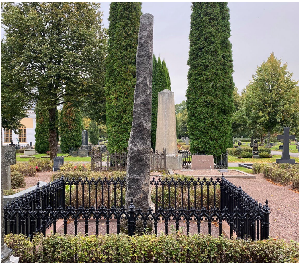
Figur 26. K05 0194 efter åtgärd. Åtgärd av gjutjärnsstaketet krävde mycket svetsarbeten. Stensockeln har riktats. Gravplatsens ursprungliga markbeläggning med grus har återskapats. Från sidan syns tydligt hur gravvården lutar framåt.