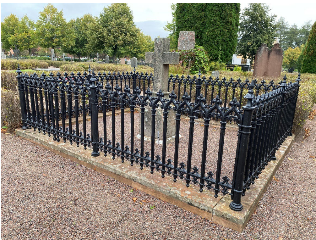
Figur 23. GK05 0283 efter åtgärd. Åtgärd av gjutjärnsstaketet krävde mycket svetsarbeten. Stensockeln har riktats. Gravvården har riktats.