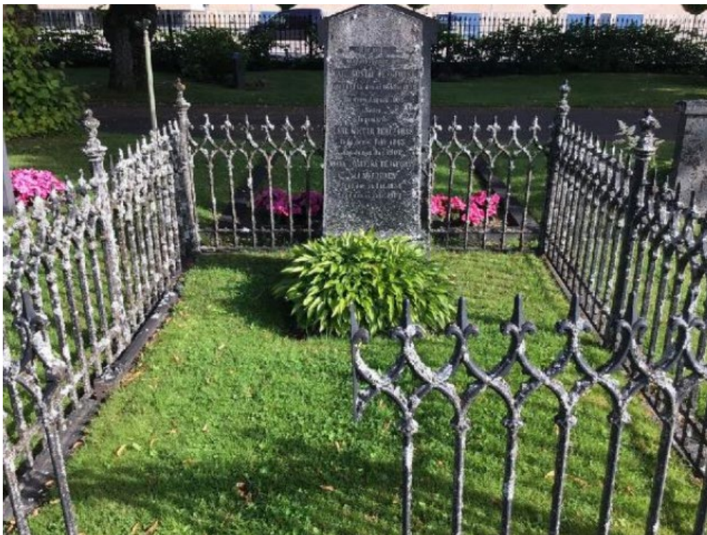
Figur 2. GK06 0150 före åtgärd. Gjutjärnsstaket i behov av renovering. Flera delar hade gått isär och grunden stod lös inne mot staketet. Gravens ursprungliga grusbeläggning har med tiden övergått till gräs. Foto: Kyrkogårdsenheten, Gävle församling, november 2021.