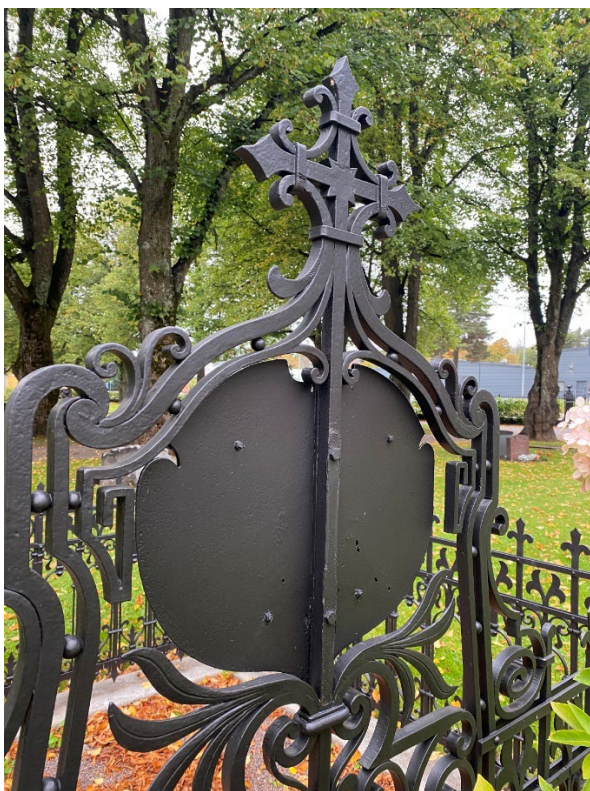
Figur 15. GK06 0450 efter åtgärd. Inskriptionsplattan är skruvad i en järnplåt. Vid renoveringen lossades plattan och plåten renoverades likt smidesstaketet.