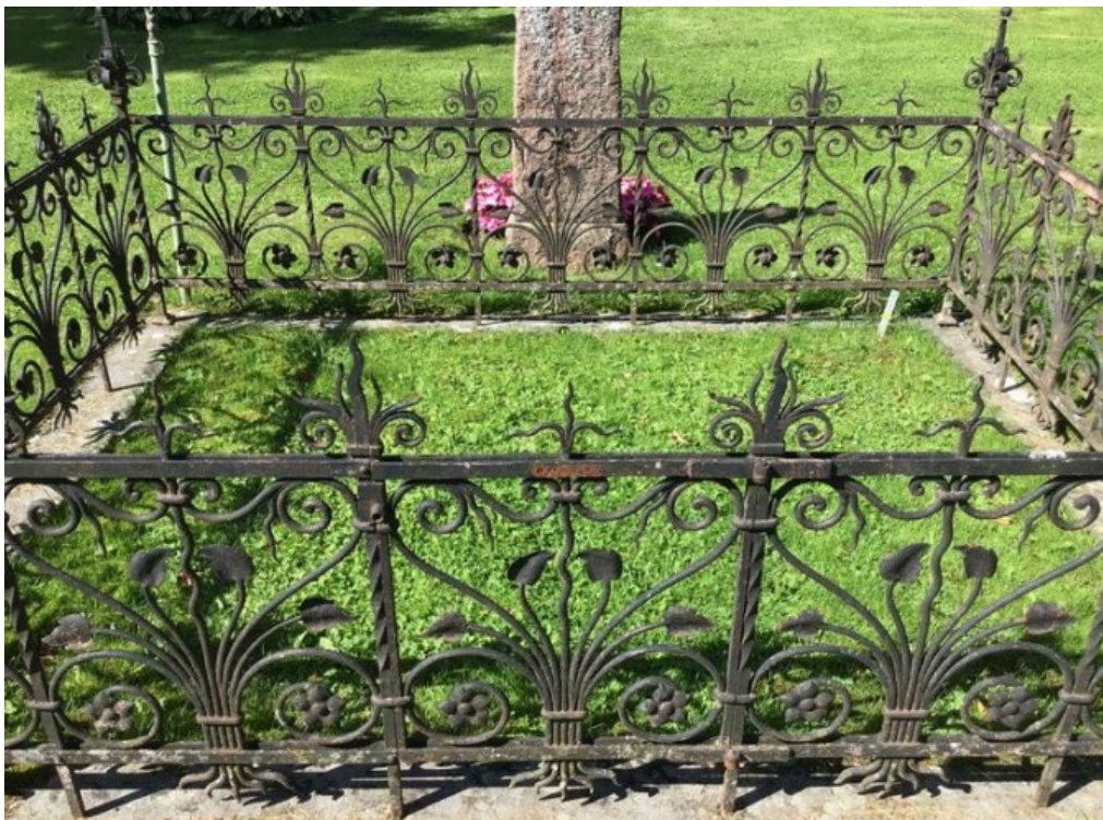
Figur 11. GK06 0390 före åtgärd. Smidesstaketet i behov av renovering. Stensockel i behov av riktning. Foto: Kyrkogårdsenheten, Gävle församling, november 2021.