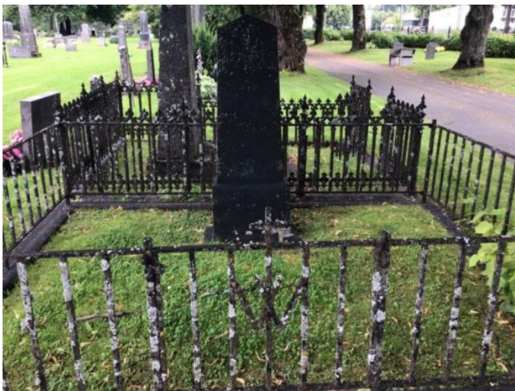
Figur 7. GK06 302 före åtgärd. Smidesstaket delvis ur läge. Ett stort problem med gravplatsen var att den stora lindens på gravens norra sida tryckte på stensockeln. Gravens ursprungliga grusbeläggning har med tiden övergått till gräs. Foto: Kyrkogårdsenheten, Gävle församling, november 2021.