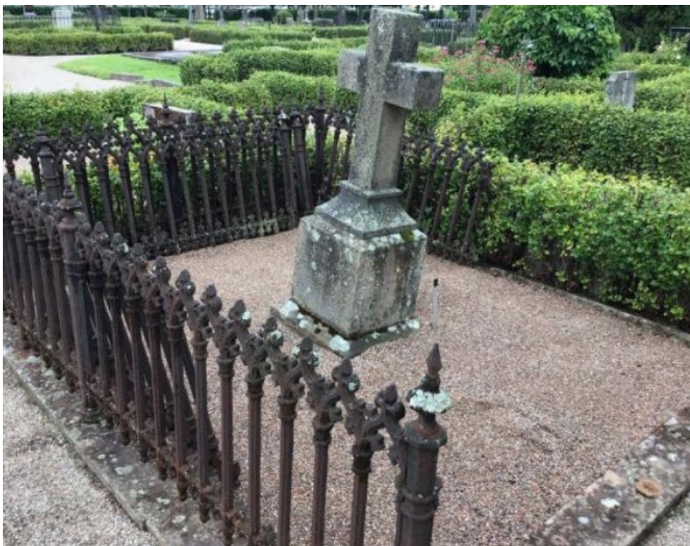
Figur 22. GK05 0283 före åtgärd. Gjutjärnsstaket i behov av renovering. Hela sektioner stod lösa. Stensockel i behov av riktning. Gravvård i behov av riktning. Foto: Kyrkogårdsenheten, Gävle församling, november 2021.