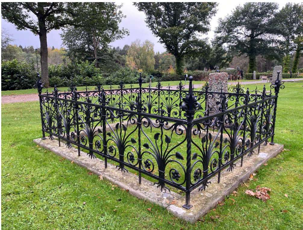
Figur 12. GK06 0390 efter åtgärd. Stensockeln har riktats och smidesstaketet har renoverats.