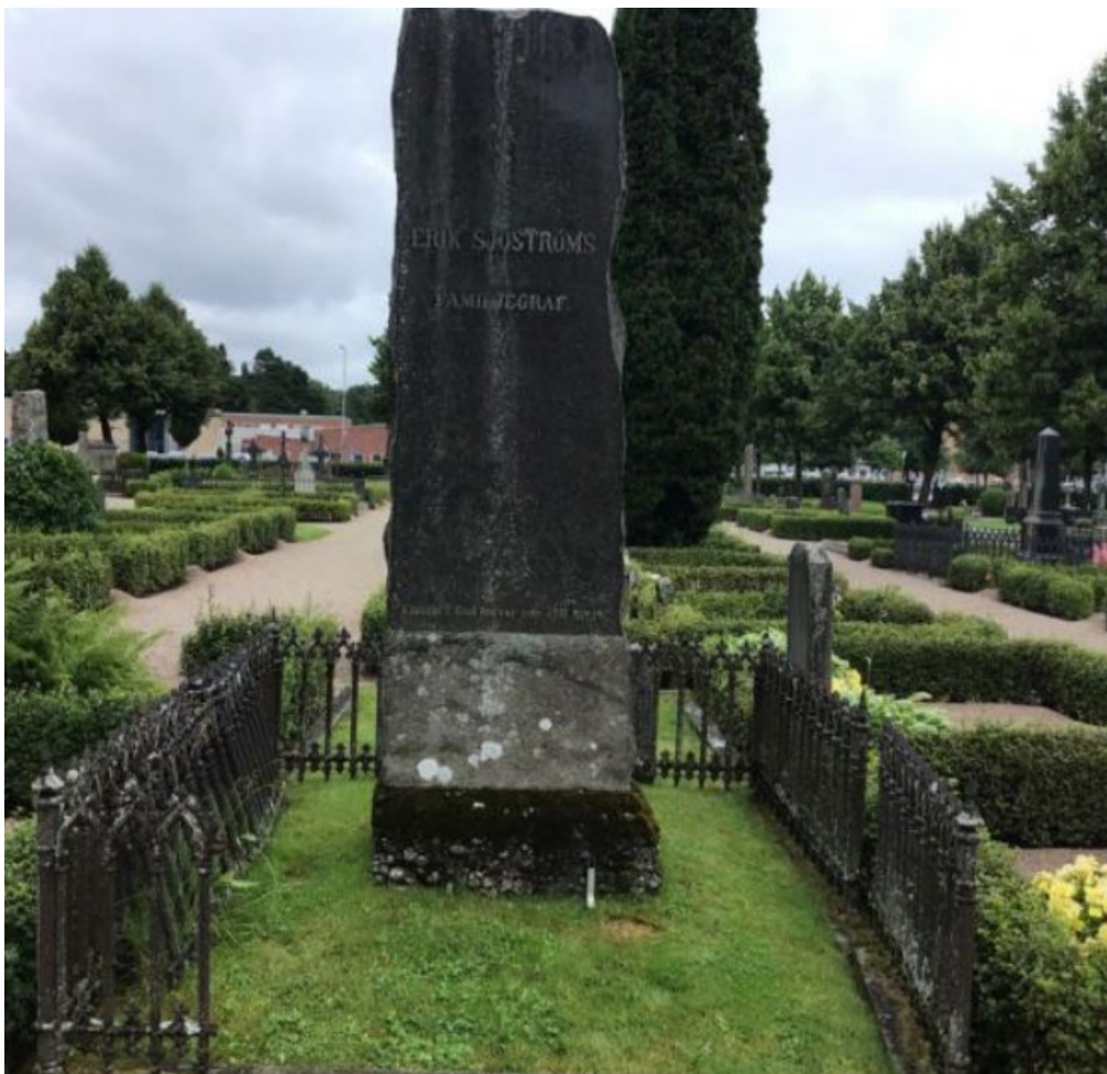
Figur 24. GK05 0194 före åtgärd. Gjutjärnsstaket i behov av renovering. Hela sektioner stod lösa. Delar saknades. Stensockel i behov av riktning. Gravens ursprungliga grusbeläggning har med tiden övergått till gräs. Foto: Kyrkogårdsenheten, Gävle församling, november 2021.