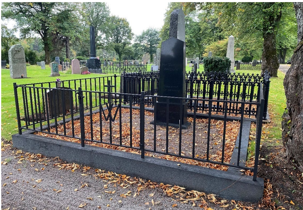
Figur 8. GK06 302 efter åtgärd. Beslut togs om att flytta in just den norra sockelstenen något. Eftersom staketet sitter monterat i västra och östra stensockeln så var denna lösning möjlig att göra. I framtiden när trädet ska tas ner blir det möjligt att flytta ut den norra sockeln igen. Stensockeln har riktats och gravplatsens ursprungliga markbeläggning med grus har återskapats.