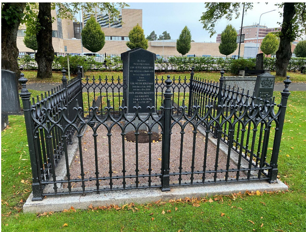
Figur 3. GK06 0150 efter åtgärd. Stensockeln har riktats och gravplatsens ursprungliga markbeläggning med grus har återskapats. Gjutjärnsstaketet har lagats och grunden har återmonterats.