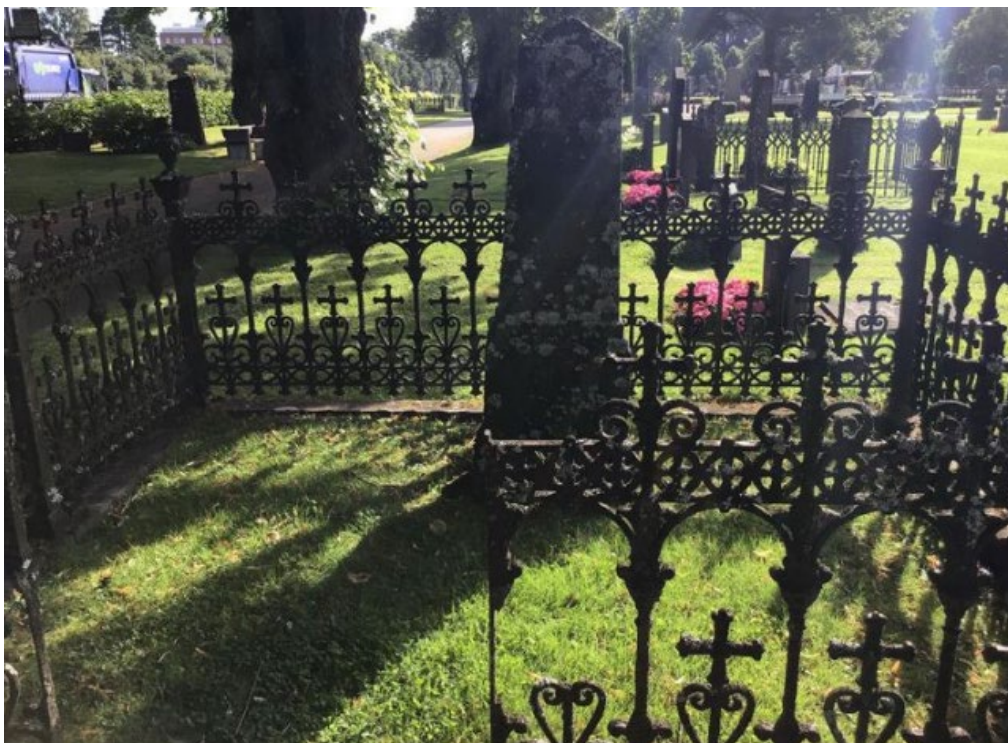
Figur 4. GK06 0089 före åtgärd. Gjutjärnsstaketet var trasigt i många små delar. Grinden saknas. Foto: Kyrkogårdsenheten, Gävle församling, november 2021.