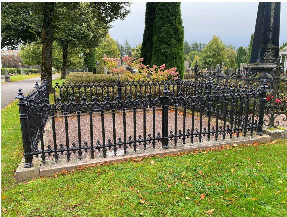
Figur 18. GK05 0135 efter åtgärd. Åtgärd av gjutjärnsstaketet krävde mycket svetsarbeten. Saknade delar har lämnats utan åtgärd. Stensockeln har riktats.