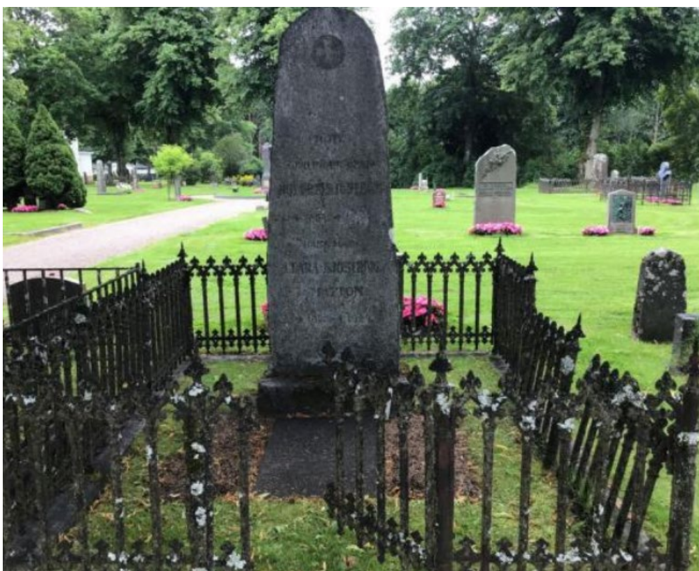
Figur 9. GK06 0303 före åtgärd. Gjutjärnsstaket i behov av renovering. Flera trasiga sektioner och grinden gick inte att stänga. Stensockel i behov av riktning. Gravens ursprungliga grusbeläggning har med tiden övergått till gräs. Foto: Kyrkogårdsenheten, Gävle församling, november 2021.