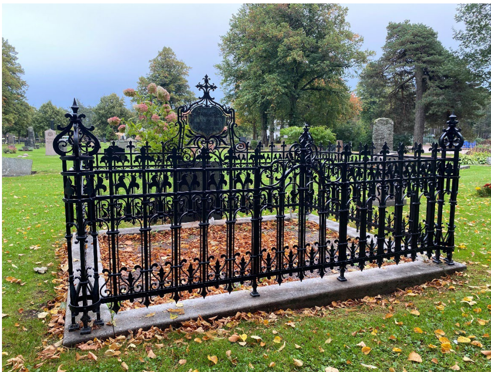
Figur 14. GK06 0450 efter åtgärd. Stensockeln har riktats och smidesstaketet har renoverats. Gravplatsens ursprungliga marktbeläggning med grus har återskapats.