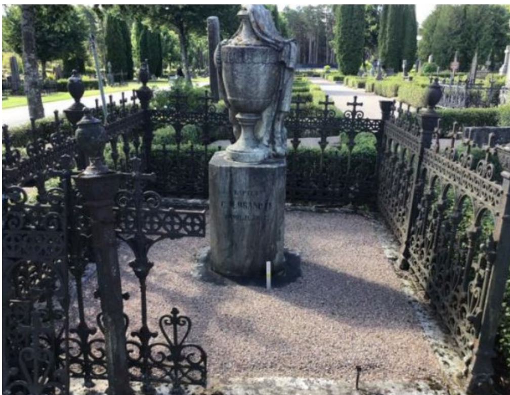
Figur 20. GK05 0017 före åtgärd. Gjutjärnsstaket i behov av renovering. Hela sektioner stod lösa. Stensockel i behov av riktning.