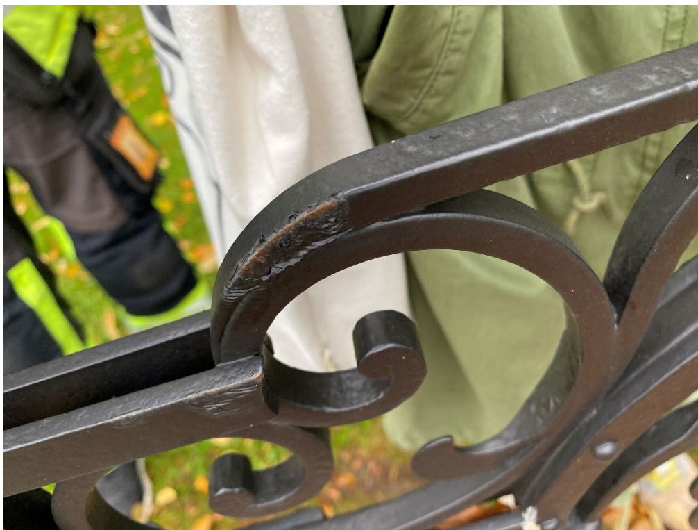
Figur 16. GK06 0450 efter åtgärd. Ett exempel på de skador som uppstår i färgskiktet när staketet transporteras liggande innan färgen helt har härdat. Liknande skador finns på flera staket och kommer att släpas släta och bättras på plats.