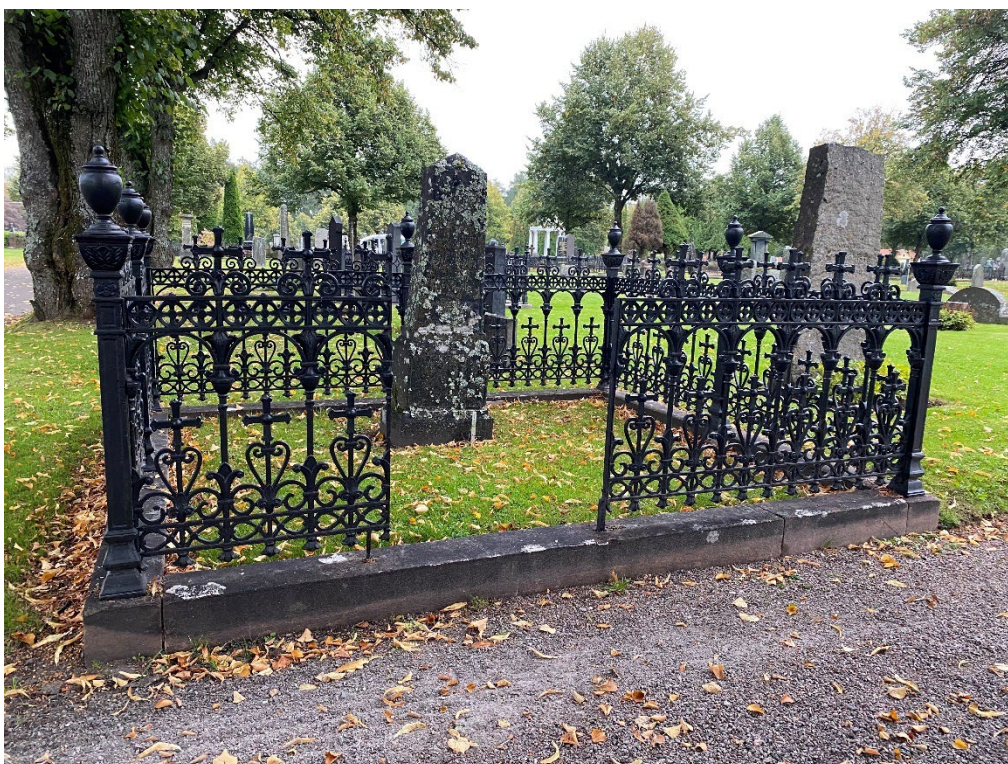
Figur 5. GK06 0089 efter åtgärd. Åtgärd av gjutjärnsstaketet krävde mycket svetsarbeten. Stensockeln var möjlig att åtgärda genom urgrävning precis invid sockeln.