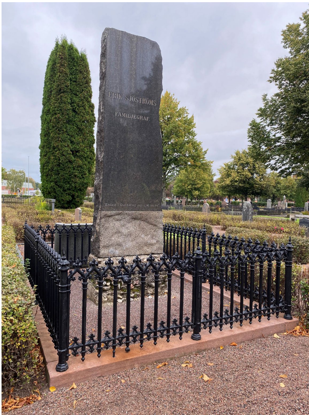
Figur 25. K05 0194 efter åtgärd. Åtgärd av gjutjärnsstaketet krävde mycket svetsarbeten. Stensockeln i sandsten har riktats. Gravplatsens ursprungliga markbeläggning med grus har återskapats.