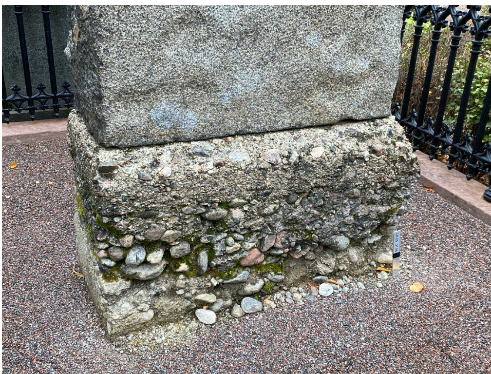
Figur 27. K05 0194 efter åtgärd. Vid slutbesiktningen tittade vi på den gjutna sockeln som gravvården vilar på. En möjlig orsak till att gravvården lutar kan vara att bruket är urlakat.