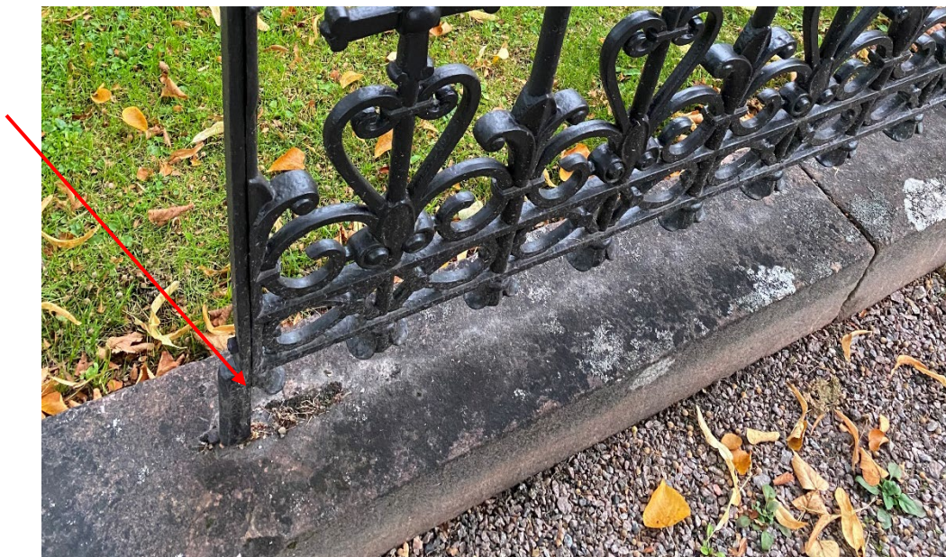
Figur 6. GK06 0089 efter åtgärd. Gjutjärnsstaketet krävde mycket svetsarbeten. Ett diskret stöd har tillkommit vid grindöppningens högra sida.