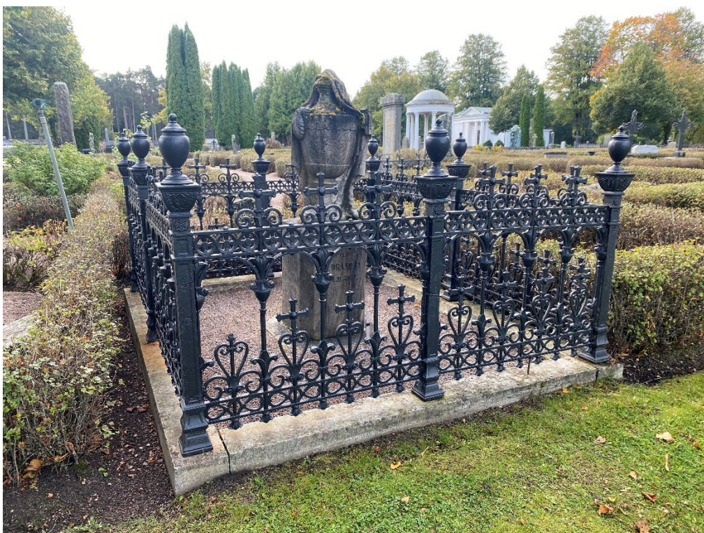
Figur 21. GK05 0017 efter åtgärd. Åtgärd av gjutjärnsstaketet krävde mycket svetsarbeten. Stensockeln har riktats.