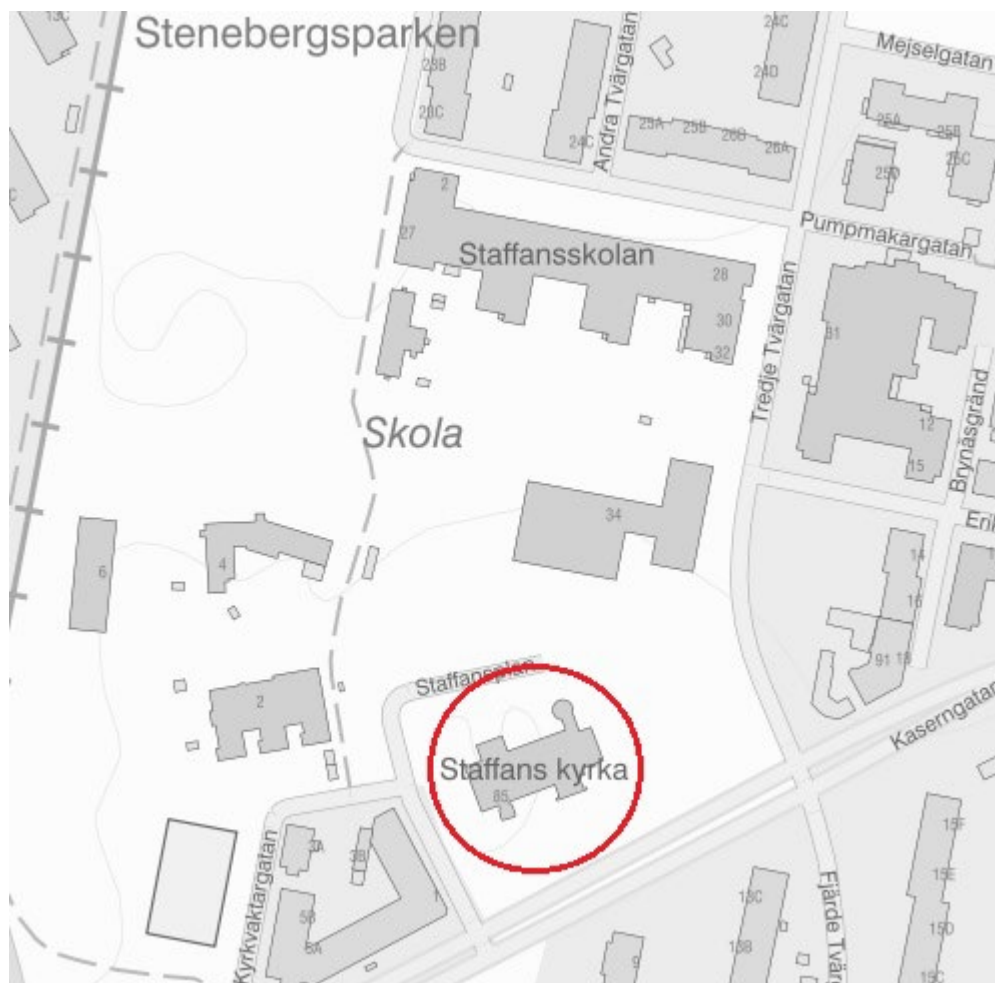
Figur 1. Del av Brynäs med Staffans kyrka inringad i rött.