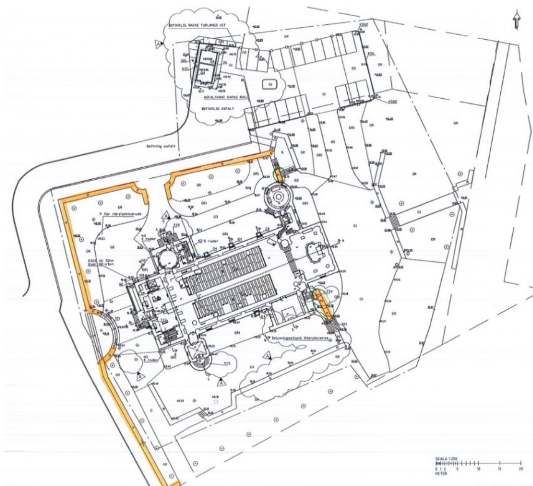
Figur 4. Ritning över kyrkotomten. De murar som har åtgärdats 2023 är markerade i orange. Mot öster finns två kortare sträckor som är inringade i grönt. Dessa murar var sedan tidigare renoverade men saknade ännu hällarna, vilka har kompletterats inom detta projekt. Ritningen är hämtad från iBinder och färglagd 2023-11-29.

Murarna kring kyrkan är uppbyggda av råblock av Gävlesandsten med hällar/lock av kalksten. Murarna är uppmurade med cementbruk i fogar och kärna. De låga murarna kring kyrkan var i stort behov av underhåll. Bruket har med åren lakats ut och sättningar i marken gör att muren glider isär. Stora delar av murarnas insidor har högre marknivå. Det finns också träd i närheten av murarna, vilket bidrar till att murverket hade kalvat ur på flera ställen. Flera av hällarna, som ligger som lock ovanpå murarna, var spräckta, vilket innebar att väta leddes ner i murverket. I 2023-års etapp har murar mot väster och norr åtgärdats, liksom hällar på muren nordöst om sakristian och hällar på den höga muren söder om koret. Murarna mot norr var i sämst skick av de nu åtgärdade.