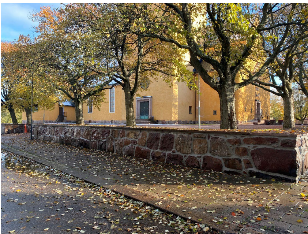
Figur 17. Den norra muren vid slutbesiktningen. Här har muren rätats upp och locken ligger i en rak linje.