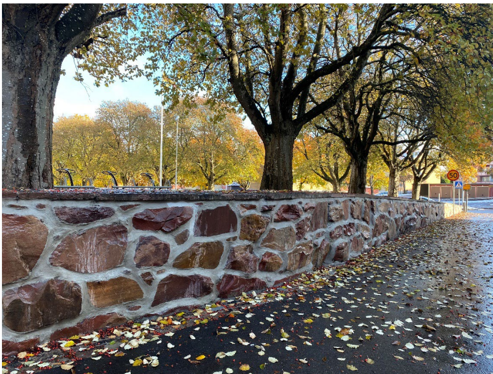
Figur 16. Den västra muren vid slutbesiktningen. Här är fogarna fuktiga efter ett regn och upplevs därför något mörka.