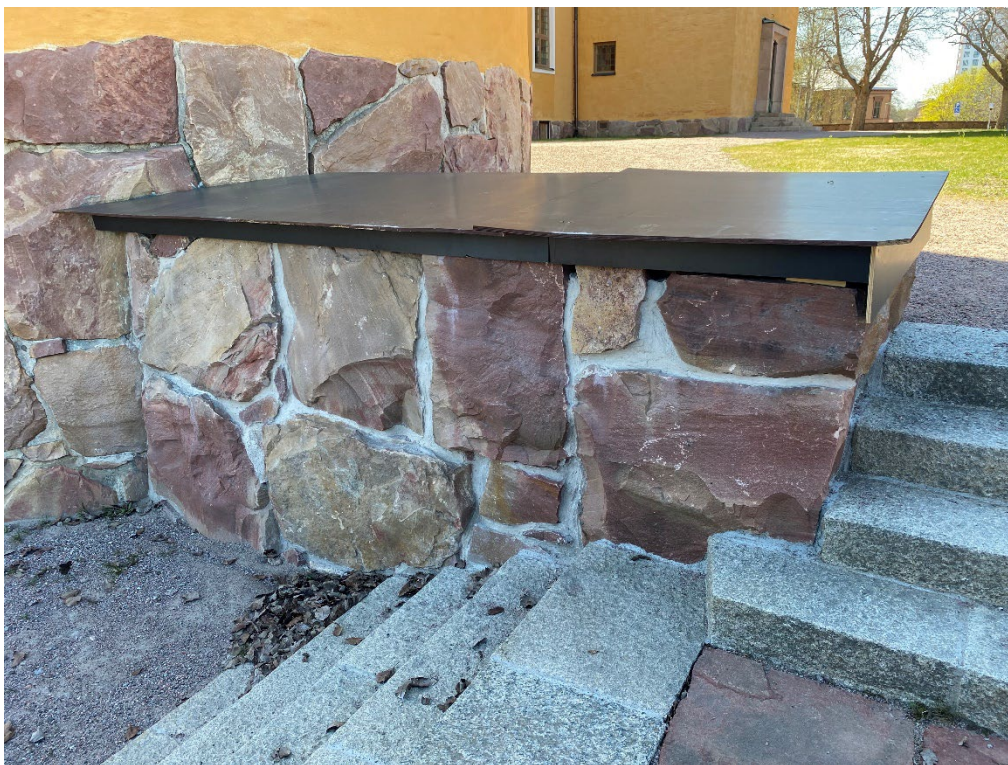
Figur 7. Innan påbörjade arbeten. Några lock på muren nordöst om sakristian saknas. Muren är dock åtgärdad och fogad i samband med det stora renoveringsprojektet, 2019–2022. Fogytorna tjänar som referens.