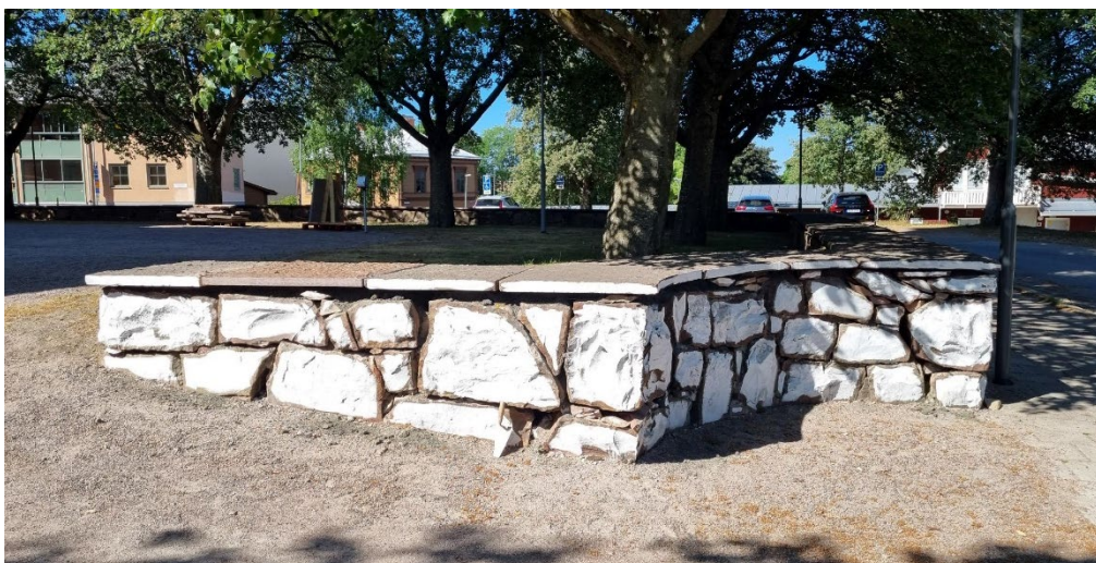
Figur 13. Under pågående arbeten. En liten mursträcka i sydvästra hörnet står inför fogning. Stenarna har strukits med krita för att fogen inte ska fastna på dem. Efter fogningen spolats krittstrykningen bort.