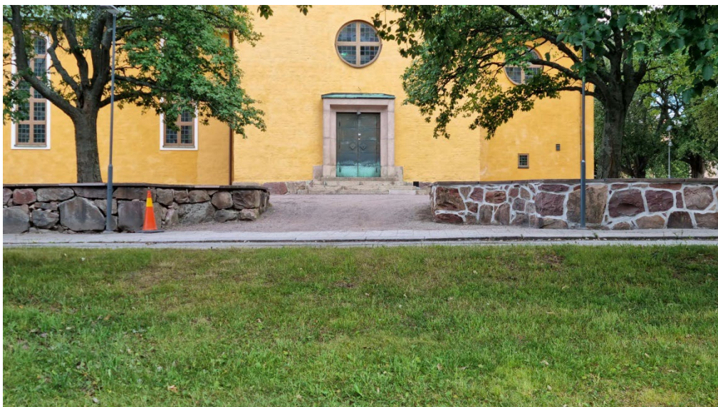
Figur 14. Under pågående arbeten. Foto från norr. Fogningen är färdig på den högra muren. Den vänstra muren är åtgärdad så när som på fogningen.