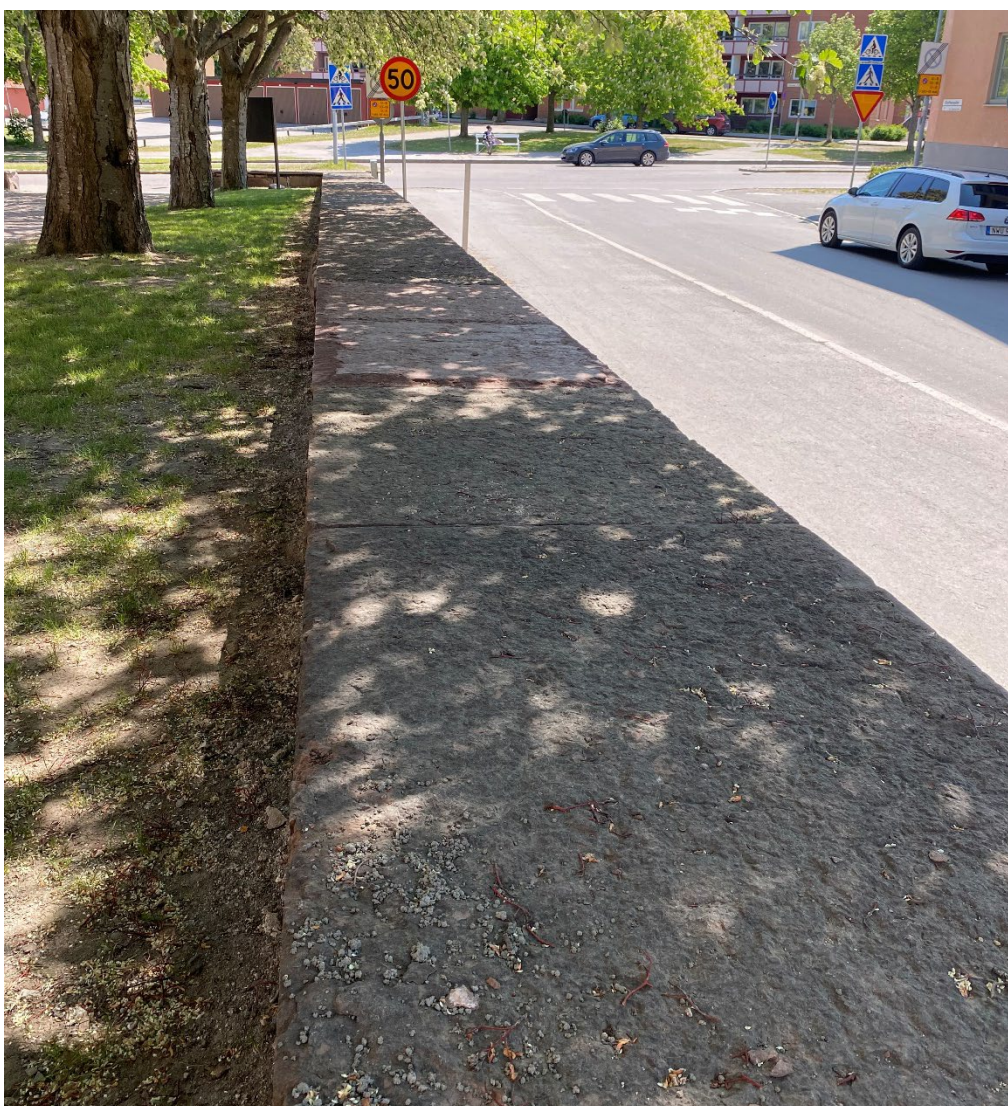
Figur 15. Under pågående arbeten. Åtgärdad mur mot väster. De nya bällarna är lite ljusare/rödare än de gamla. Fogningen är ännu inte utförd här.