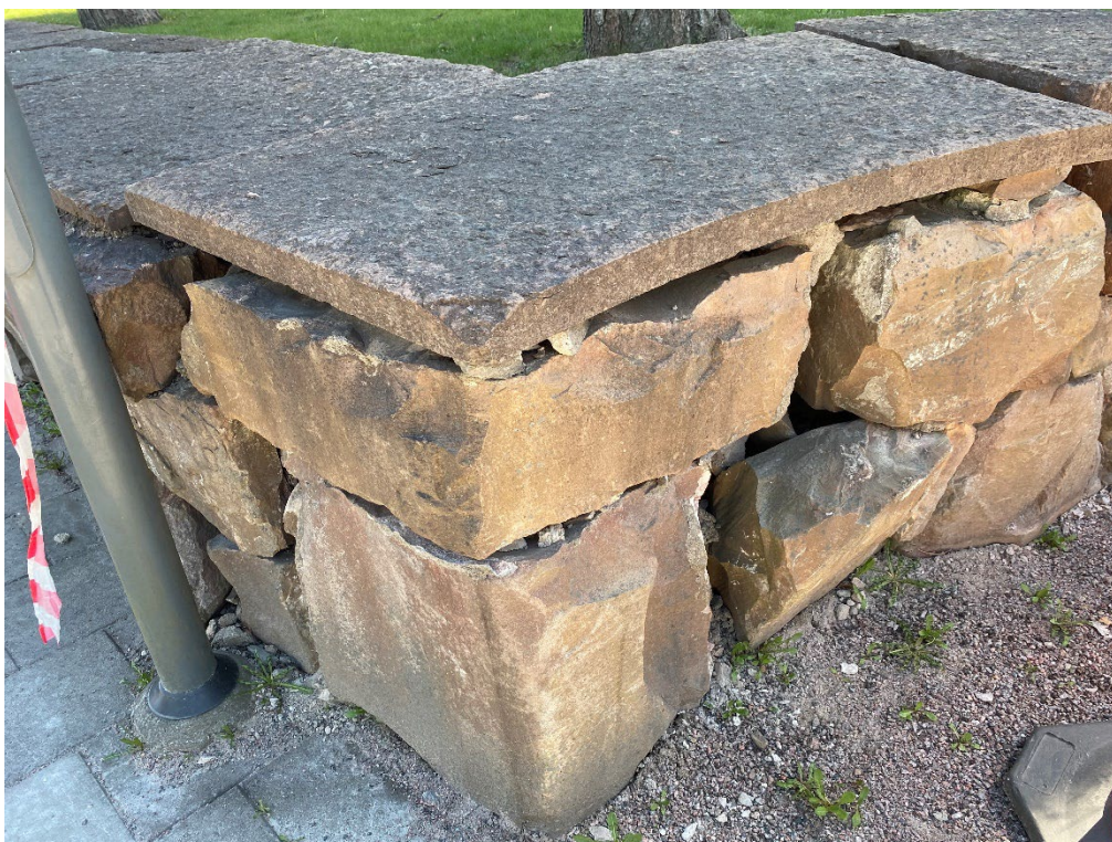
Figur 6. Innan påbörjade arbeten. Urlakad fog, kalvade stenar och avsaknad av skolsten i muröppningen mot norr.