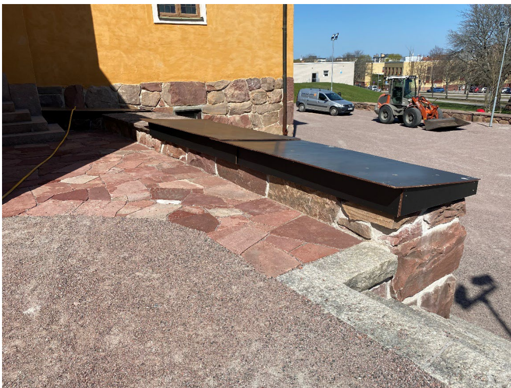
Figur 8. Innan påbörjade arbeten. Lock saknas ännu på den tidigare åtgärdade muren söder om koret.