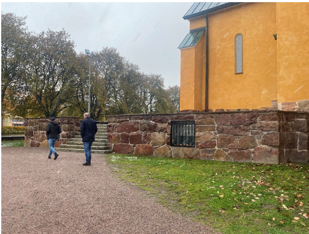
Figur 20. Muren söder om koret. Denna mur var åtgärdad sedan tidigare men saknade ännu några lock. Dessa har åtgärdats inom denna etapp.