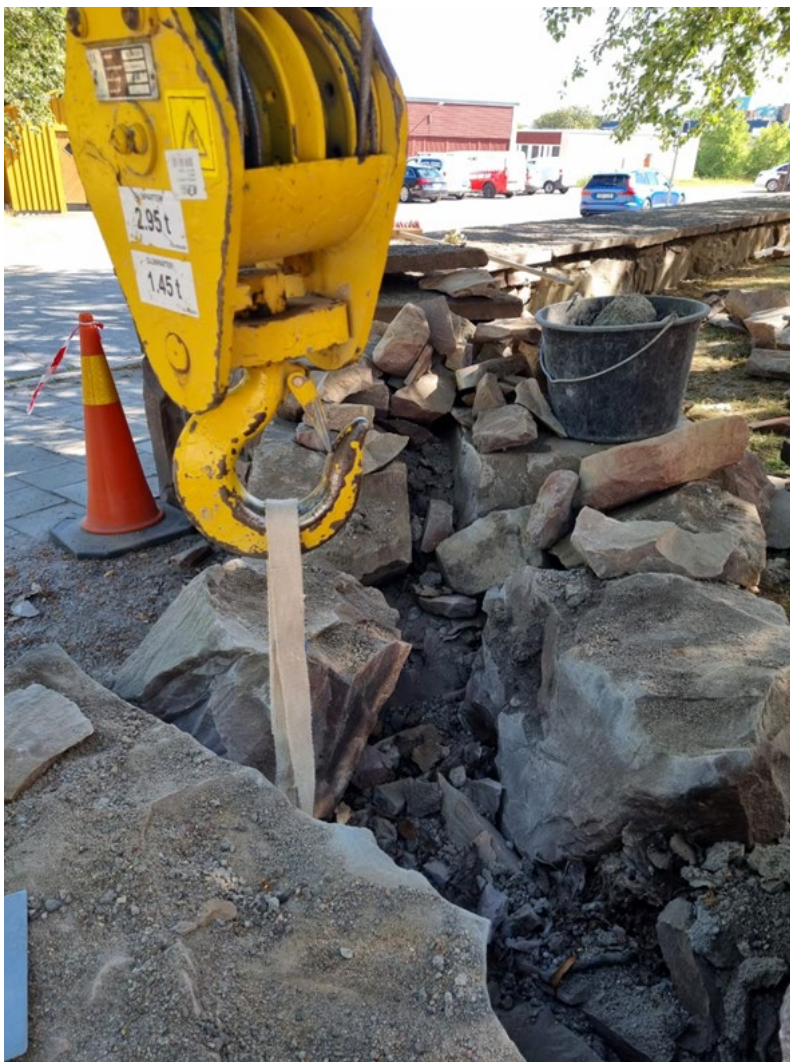
Figur 12. Under pågående arbeten. Muren kring öppningen mot norr var i mycket dåligt skick och har till största del lagts om.