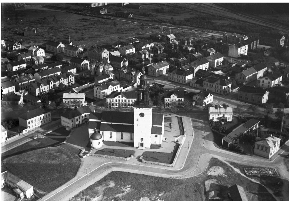
Figur 3. Staffans kyrka, flygfoto från norr 1941. Närmast i bild syns muren mot norr och till höger muren mot väster. Foto ur Läns museet Gävleborgs samling i DigitaltMuseum, bildbeteckning: XLM.FLYG2642.

Knut Nordenskjöld ritade också tomten kring kyrkan. Den är kuperad och nivåskillnaderna närmast kyrkan förbinds med trappor och inramas med murar. Tomtgränsen markeras av en låg och bred mur i Gävlesandsten med lock av kalksten. Mellan åren 2019–2022 utfördes en genomgripande inre renovering och omdaning. I samband med dessa arbeten återställdes marken närmast kyrkan till en tidig utformning med beläggning till största del bestående av grus på den södra sidan. I samma projekt renoverades vissa exteriöra trappor och kortare sträckor av murarna. För närmare beskrivning av dessa arbeten hänvisas till den antikvariska slutrapporten Staffans kyrka, Antikvarisk medverkan vid interiör renovering och omdaning samt vissa exteriöra arbeten , rapport Läns museet Gävleborg 2022:28.