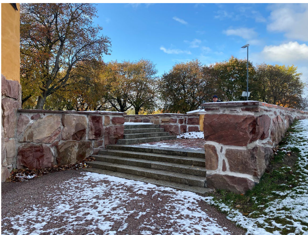
Figur 19. Muren nordöst om sakristian. Denna var fogad sedan tidigare, men saknade lock. Locken har åtgärdats inom denna etapp.