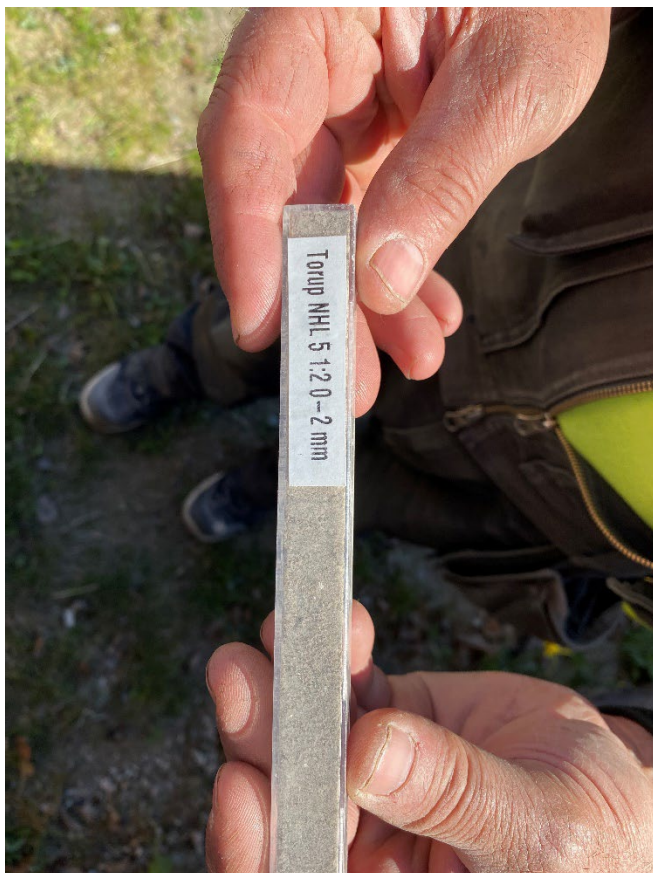
Figur 9. Beslut om fogens kulör. Torup från Målarkalk, NHL-bruk.