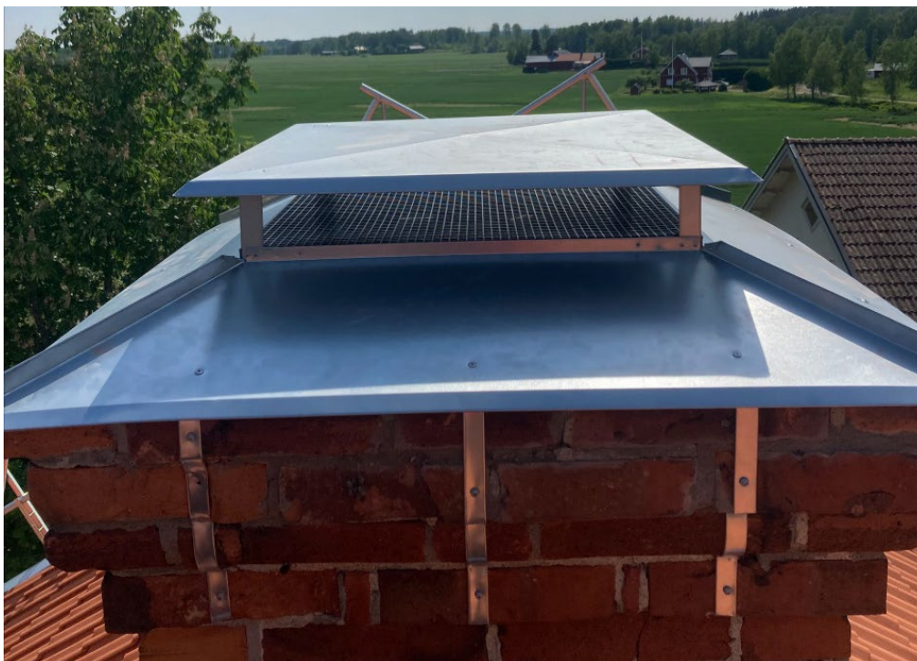
Figur 17. Nya beslag och platta buvar på skorstenarna i zinkmagnesium. Notera kajnätet under buven. Foto: Rodab Plåtslageri, juni 2023.