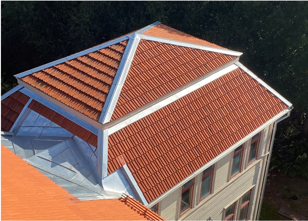
Figur 25. Rengjorda takpannor räckte till alla takfall utom det nedre takfallet på baksidan. Nockplåtar liksom plättäckningen mellan flygeln och huvudbyggnaden är utförda i zinkmagnesium.