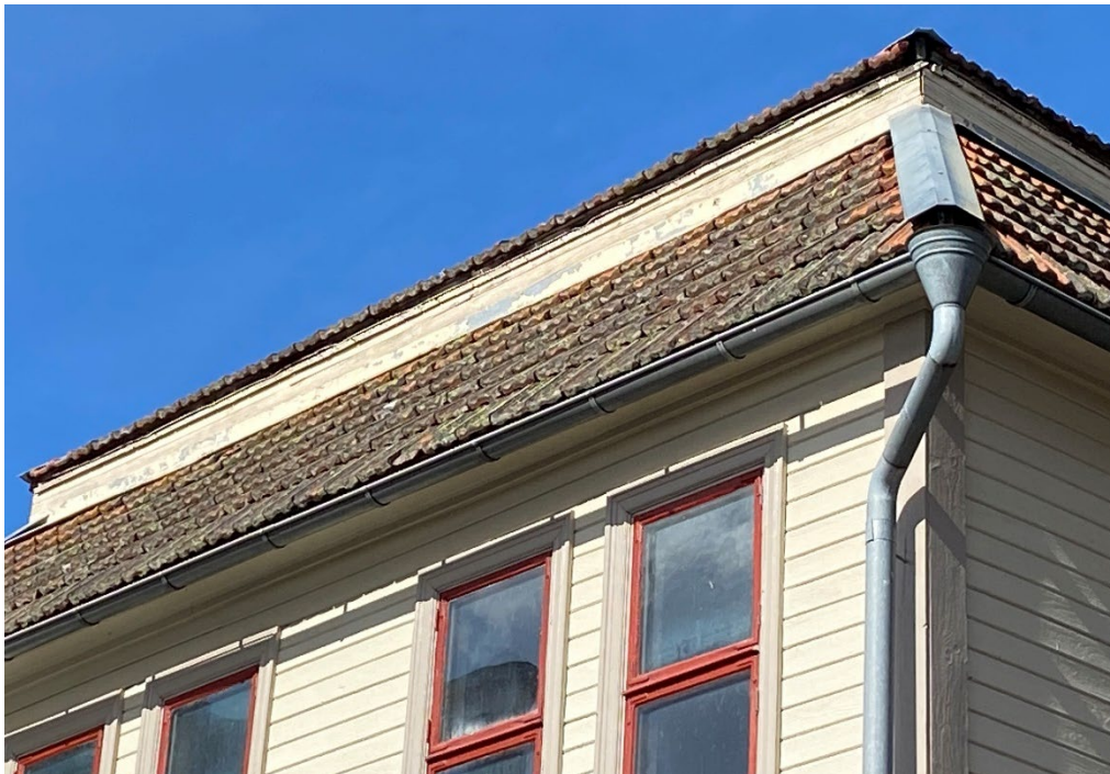
Figur 4. Den nordöstra flygelns tak är klätt med pressat tegel tillverkat på Nyrönningss tegelbruk i Storvik.