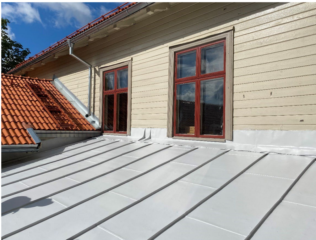
Figur 28. Pulpettaket som binder samman de båda flyglarna. Plåten är målad i kulör zinkgrå.