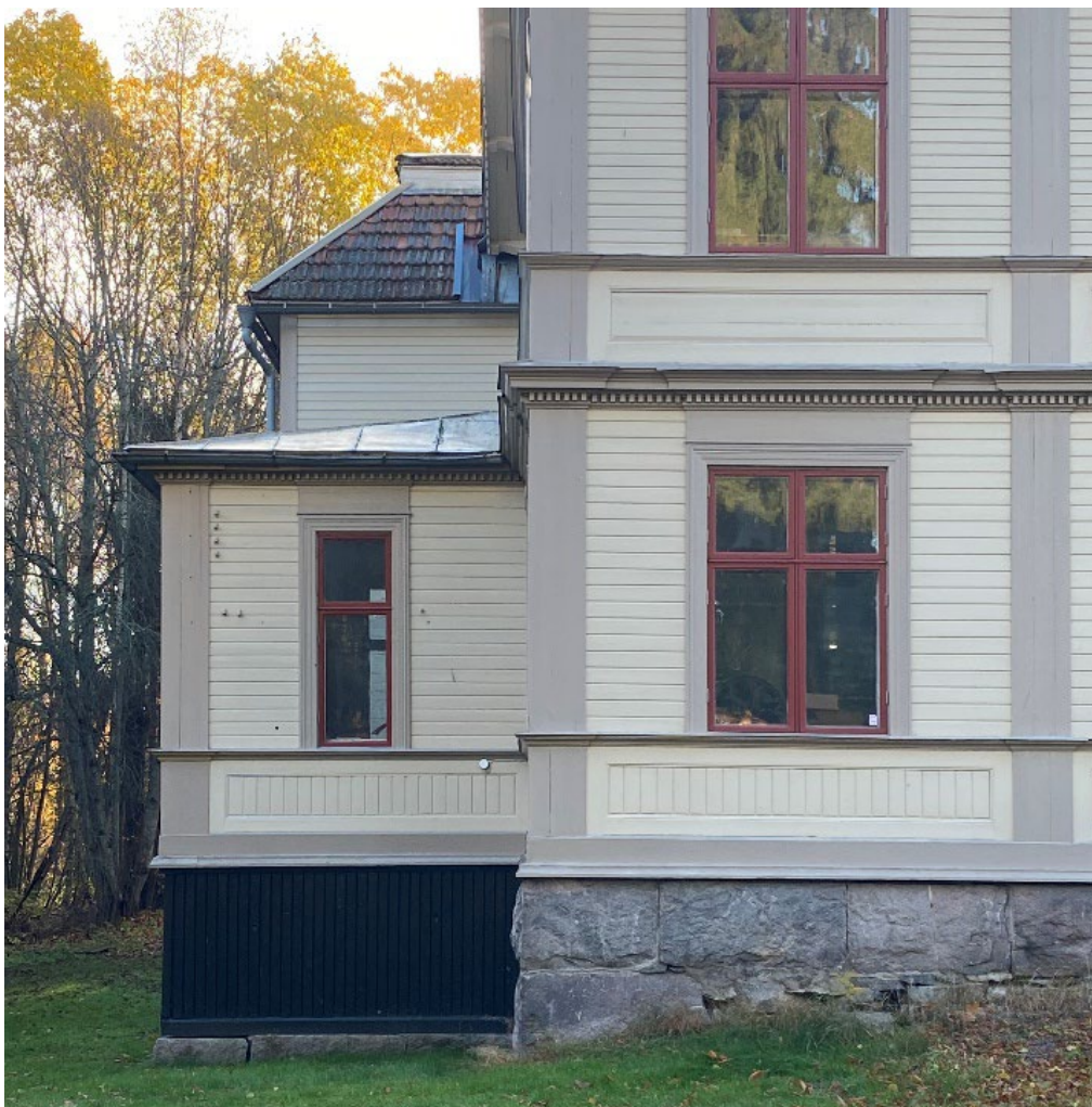
Figur 9. Den låga utbyggnaden på huvudbyggnadens norra gavel innan påbörjade arbeten. Notera även plåtinklädnaden mellan taken på den nordöstra flygeln och huvudbyggnaden.