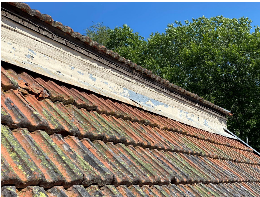
Figur 5. Den nordöstra flygelns takfall med pressat tegel tillverkat på Nyrönninges tegelbruk i Stornik. Ytan som förenar de båda takfallen var panelklädd. Ett plåtbeslag var uppdraget mot panelen.