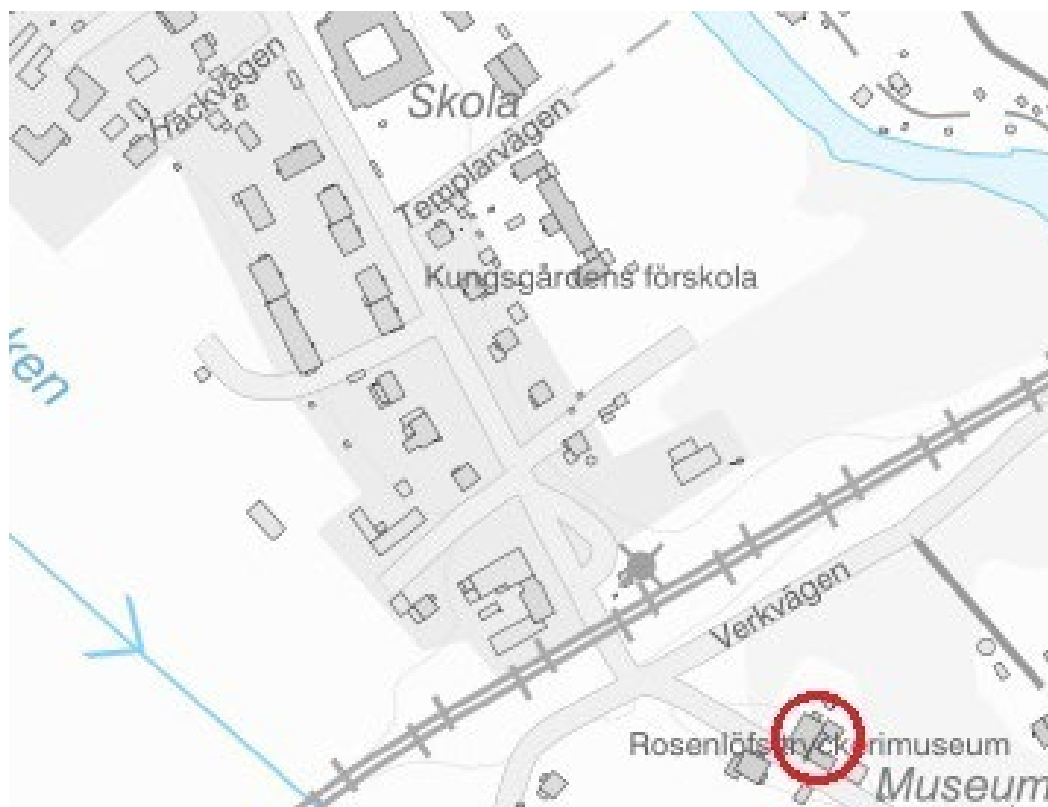
Figur 1. Rosenlöfs tryckerimuseum är inringat. Karta ur Digitala Planarkivet.