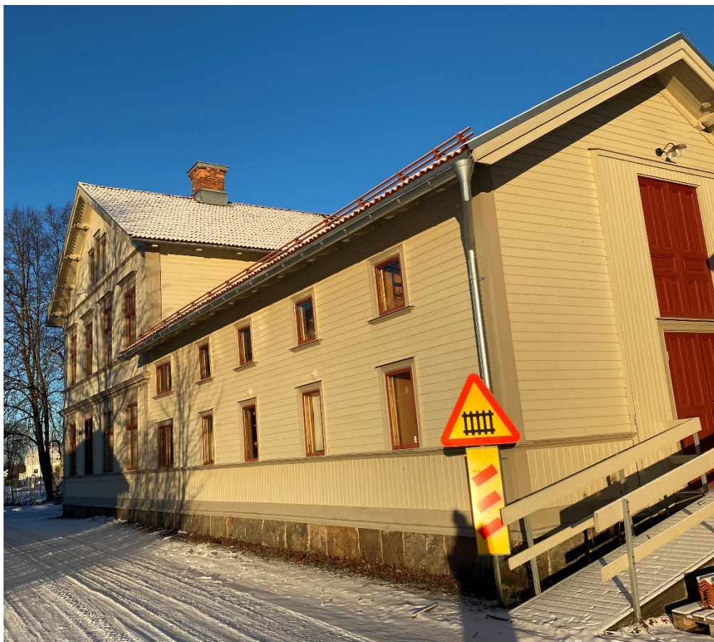
Figur 10. Slutbesiktning av takarbetena på flygeln utmed Korsikavägen. Taket har lagts om med nytt tvåkupigt lertegel från Monier och försetts med nya vindskivebeslag, hängrännor och stuprör i zinkmagnesium. Snörasskydden är återanvända. Foto: 2023-01-03.