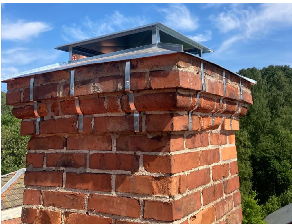
Figur 18. Nya skorstensbeslag och buvar har tillverkats i zinkmagnesiumplåt. Foto: Rodab Plåtslageri, juni 2023.