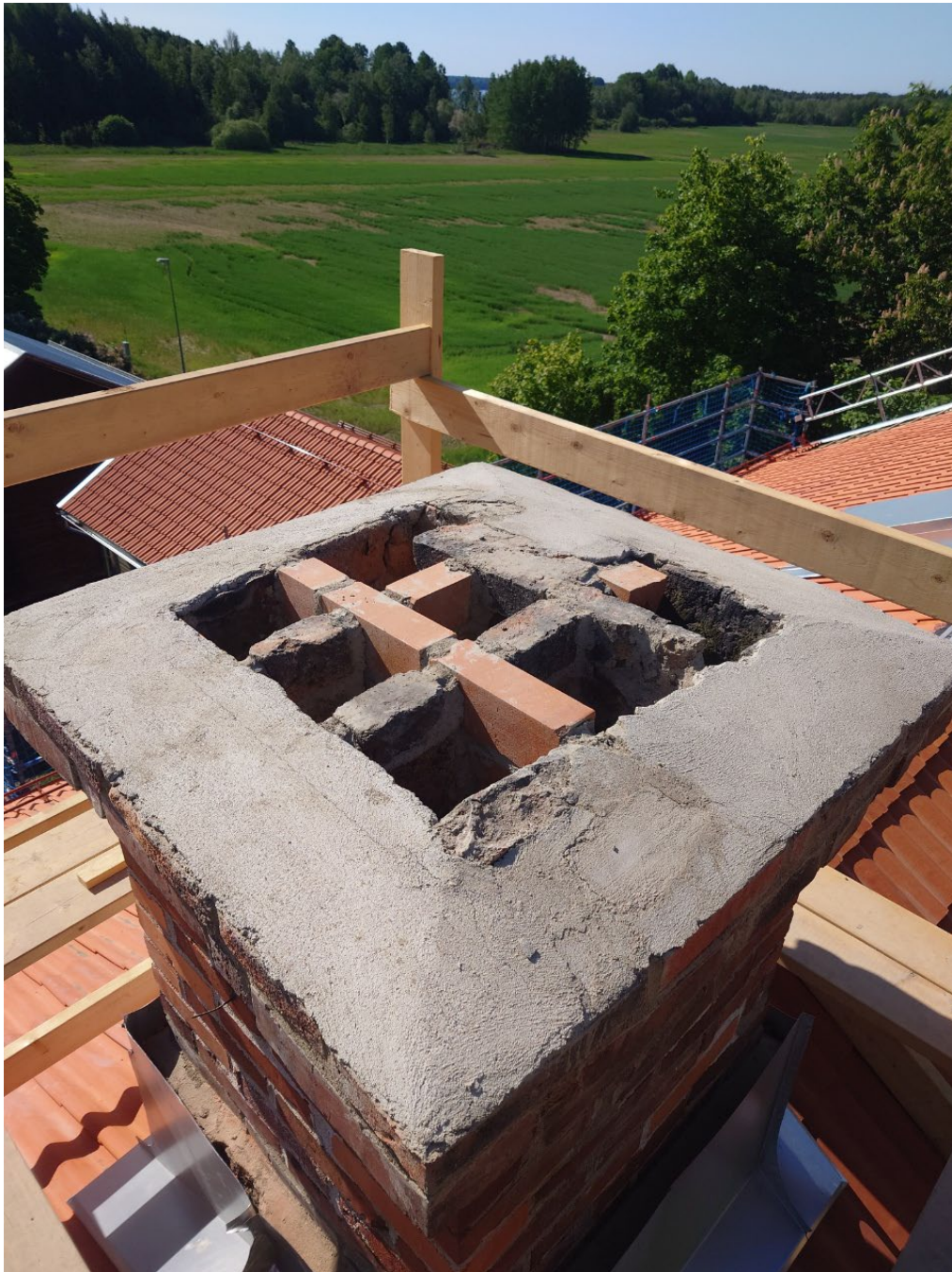
Figur 16. Ommurning av skorstenarnas övre skift, liksom pipor är färdigställt. Foto: Rodab Plåtslageri, juni 2023.