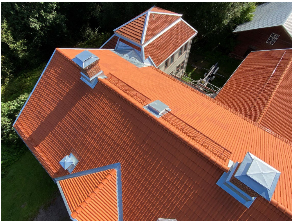
Figur 24. Slutbesiktning av takarbetena från skylift. Närmast i bild syns huvudbyggnadens tak, högst upp i bild den nordöstra flygelns tak och till höger taket på flygeln utmed Korsikanvägen.