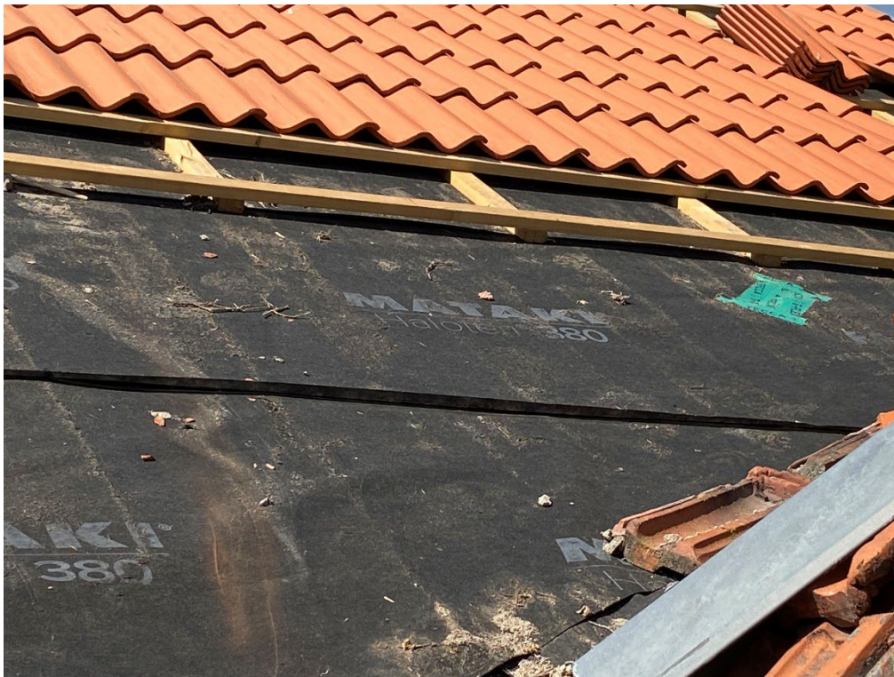
Figur 13. Under pågående takomläggning på huvudbyggnadens tak. Här syns takduken, läkten och det nya tvåkupiga lerteglet från Monier.

I anslutning till takluckan har tillkommit taksäkerhet i form av en 10 meter lång takbrygga i stålplåt i röd kulör som smälter väl in mot det underliggande lerteglet. Båda takfallen har försetts med snörasskydd av typen rör i röd kulör. Till nya vindskivebeslag, hängrännor och stuprör har använts plåt i zinkmagnesium. Stuprören har skarpa vinklar och är anslutna till hängrännorna genom vattkuper.