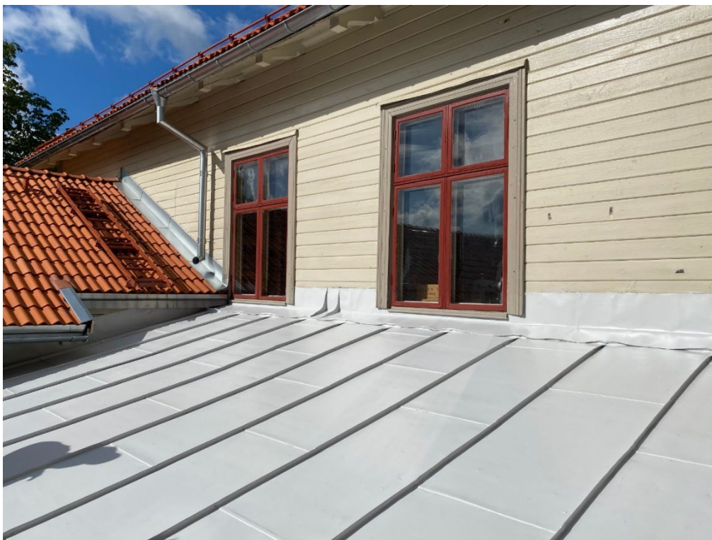
Figur 12. Här syns det norra takfallet på flygeln utmed Korsikavägen. Notera takstegen som leder upp till nockrället.