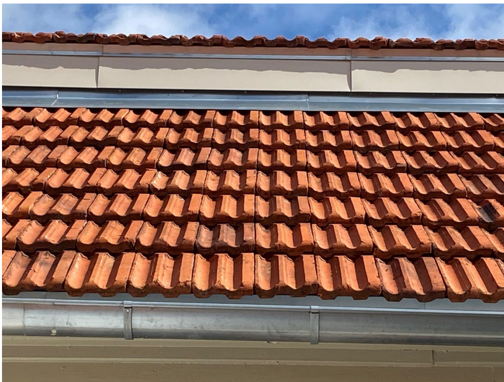
Figur 27. Närbild på rengjort pressat taktegel samt på plåtinklädnaden mellan de båda takfallen.