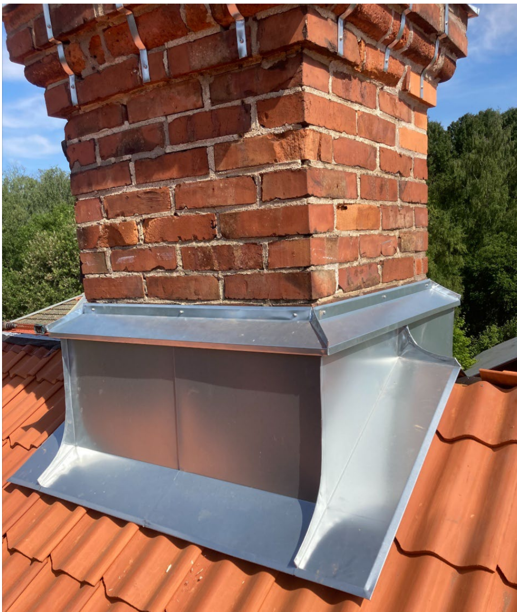
Figur 19. Nytt skorstensbeslag i zinkmagnesium. Foto: Rodab Plåtslageri, juni 2023.