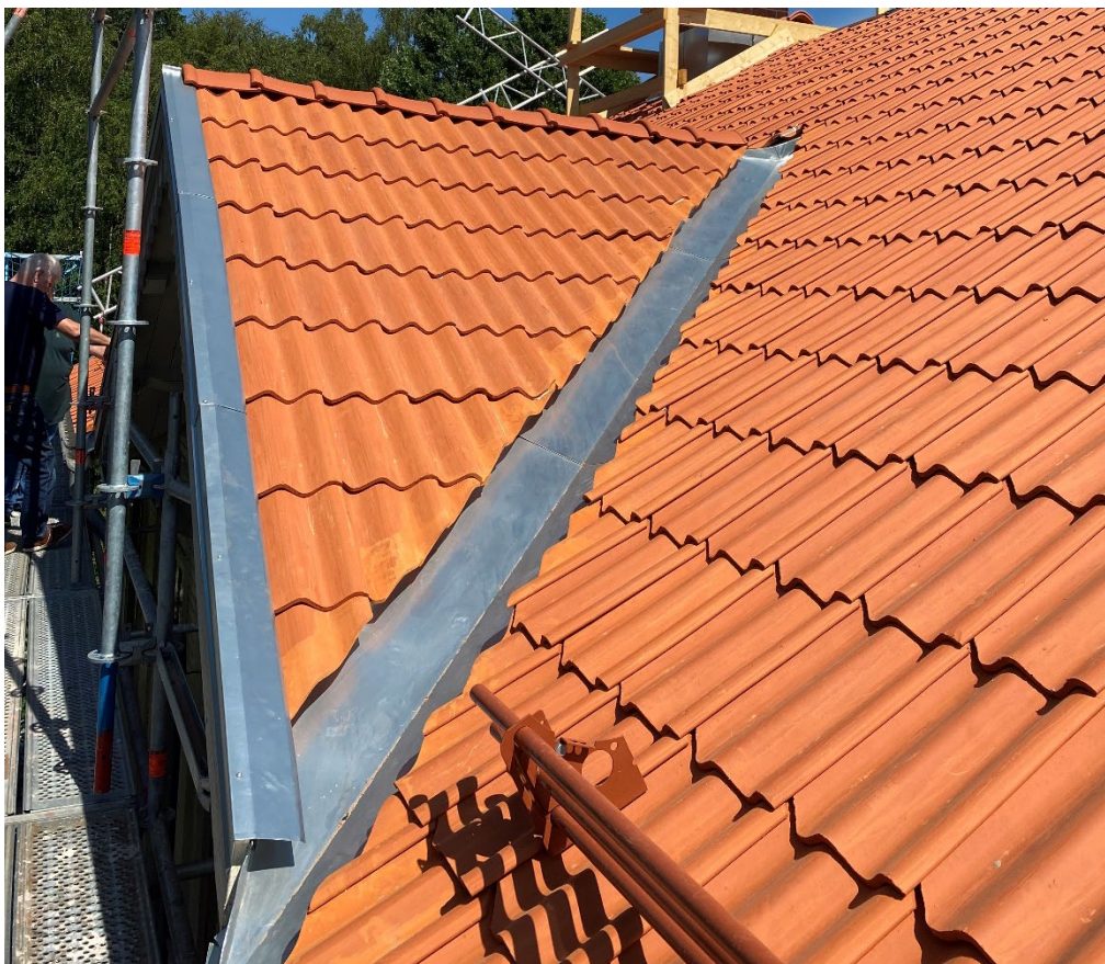
Figur 22. Rännदार och vindskivebeslag är i zinkmagnesium.