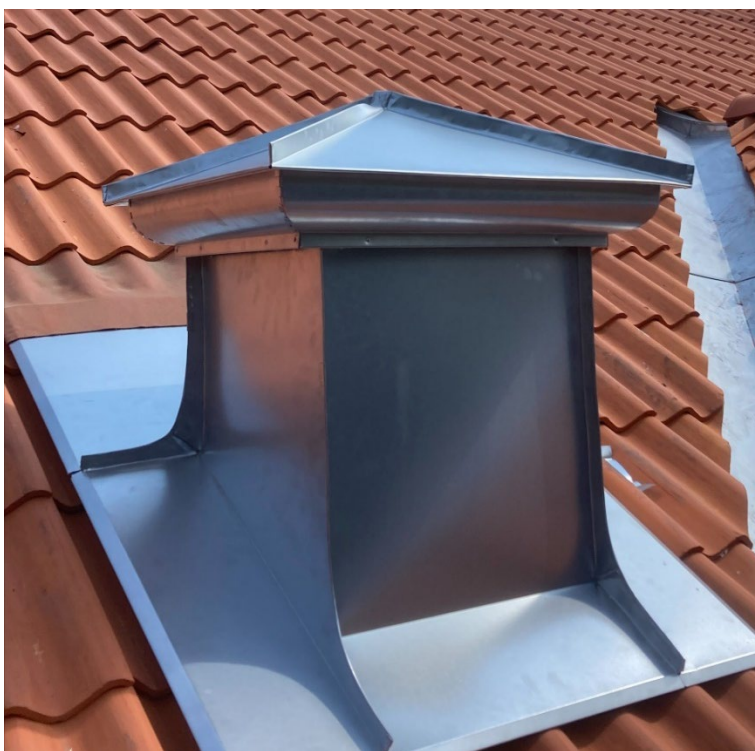
Figur 23. Den nya ventilationsbuben är klädd med falsad plåt i zinkmagnesium. Foto: Rodab Plåtslageri, juni 2023.