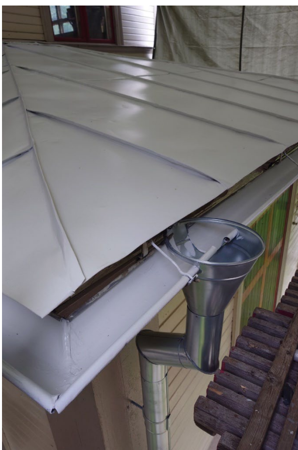
Figur 29. Närbild på taket på den lilla utbyggnaden på huvudbyggnadens norra gavel. Närbild på renoverad plåttäckning. Plåten är målad i kulör zinkgrå. Vattkuper och stuprör är nya i zinkmagnesium.