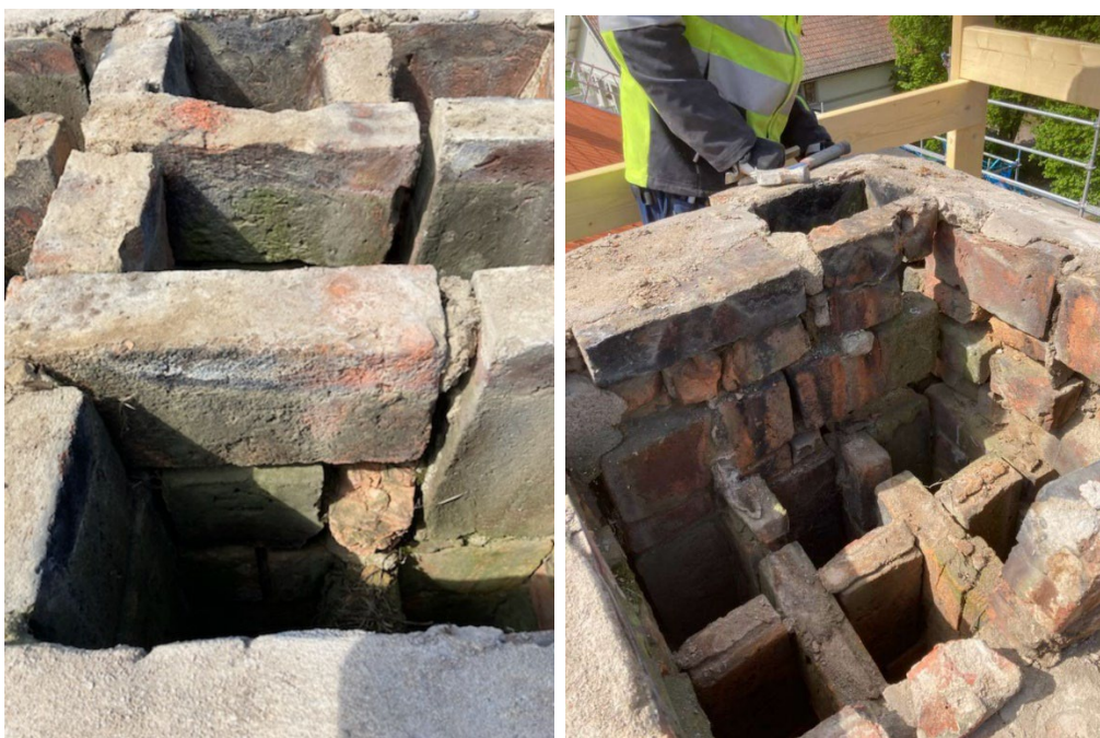
Figur 14 och 15. Murverket i skorstenarnas övre skävt var i dåligt skick och fick därför muras om. Foto: Rodab Plåtslageri, juni 2023.