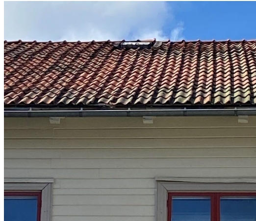
Figur 2 och 3. Stora byggnadskroppens västra takfall 2022-04-12. Teglet hade hamnat ur läge och flera takpannor var söndervittrade. Läckage fanns vid ventilationsbuven och takfönstret.