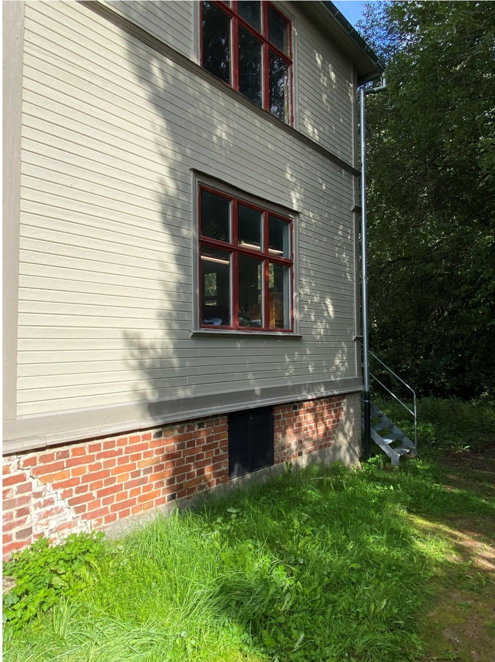
Figur 30. Den östra gaveln på den nordöstra flygeln. Här syns ett av stuprören som är anslutna till markrör.

Markytorna mellan flyglarna var väldigt fuktiga. Utkastare från flera stuprör här förvärrade förhållandena ytterligare då stora mängder regnvatten leddes ner i marken och underminerade vissa av murarna. Samtliga stuprör i mellanutrymmet, vid gavlarna samt på den norra sidan har anslutits till markrör.