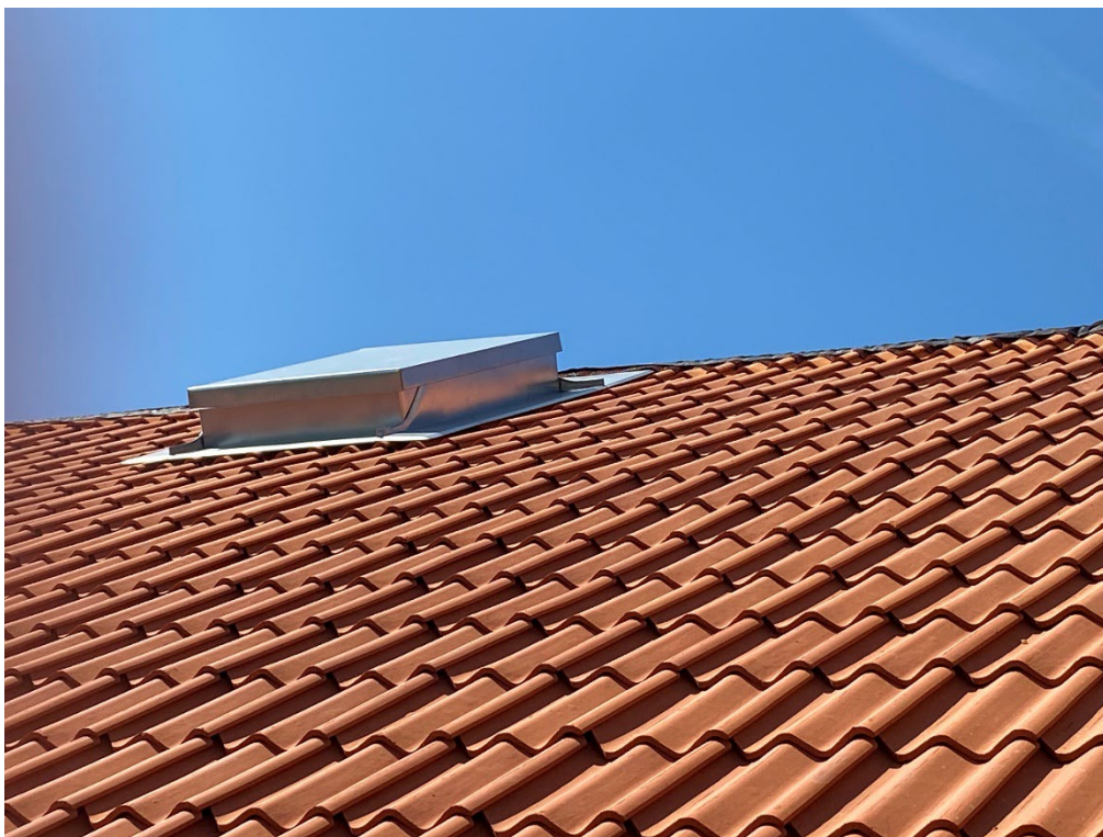
Figur 20. Tidigare fanns på det östra takfallet ett litet takfönster. Detta har nu ersatts med en taklucka i godkända mått. Vid fototillfället har takbryggan ännu inte monterats.