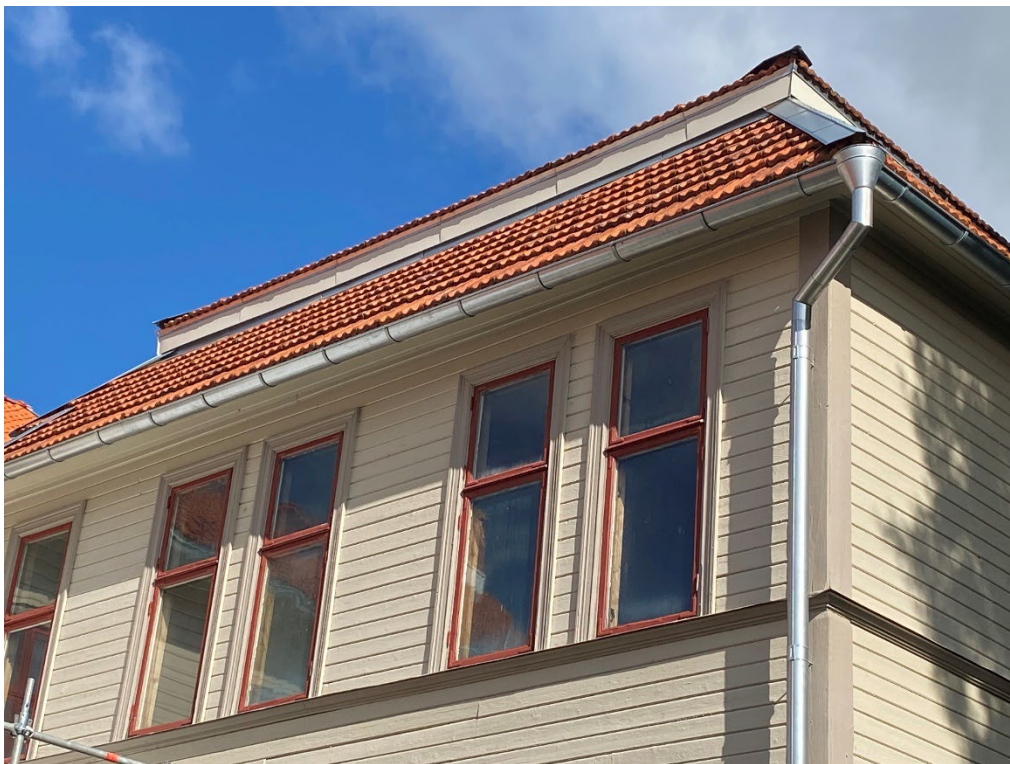
Figur 26. Panelen mellan de båda taken har klätts in med falsad plåt som är målad i samma kulör som panelen tidigare hade.