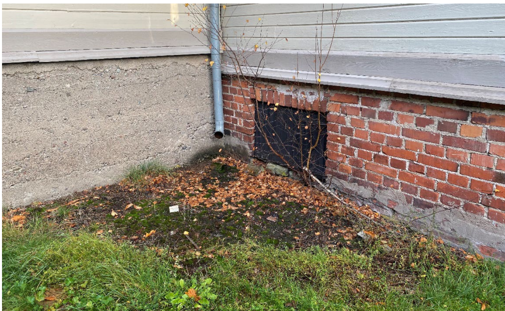
Figur 8. Hörnet mellan den låga sammanbindande delen och den nordöstra flygeln. Markytan mellan flyglarna var fuktig och marken under vissa stuprör hade i det närmaste underminerat murarna.