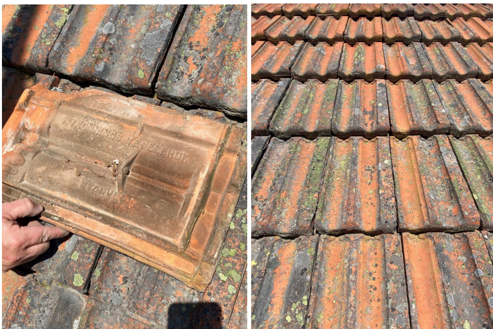
Figur 6 och 7. Närbilder på det pressade takteglet på den nordöstra flygeln.