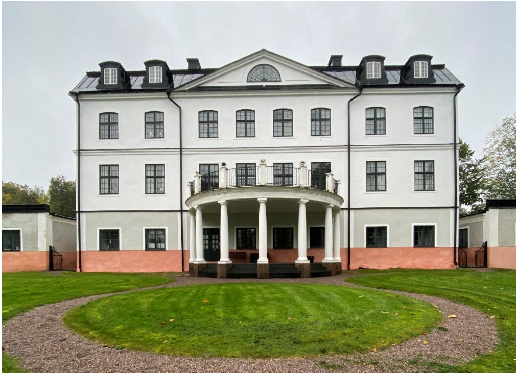
Figur 18. Forsbacka herrgård sedd från norr efter avslutade arbeten.