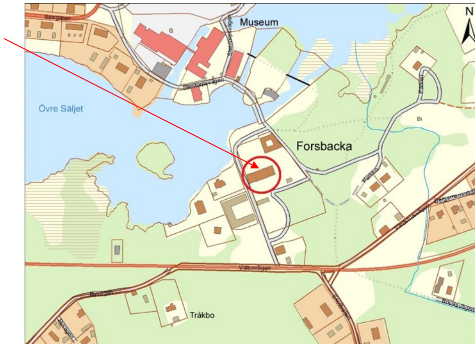
Figur 1. Utdrag ur Lantmäteriets fastighetskarta. Forsbacka herrgård är inringad och den norra fasaden markeras med pilen.