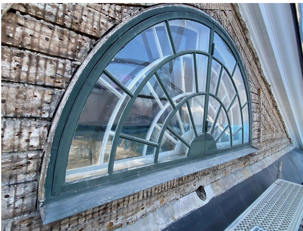
Figur 7. Under pågående arbeten. Lunettfönstret i frontonen. Här syns att den profilerade takfoten kunde renoveras utan att den till fullo behövde knackas ner.