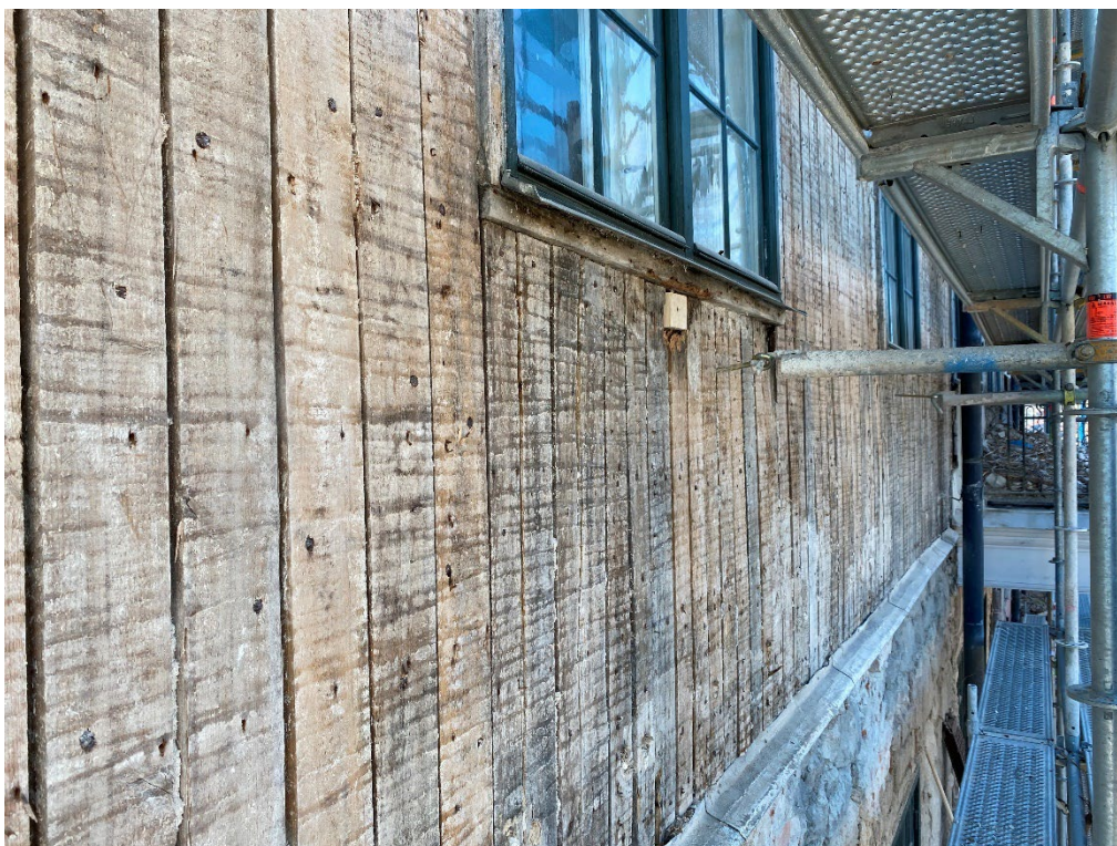
Figur 5. Putsen är nerknackad, en mindre trälagning syns under fönstret. Plåtlisten är ännu inte bytt.

Rötskadade delar i panelen lagades i med nytt virke. Lagningar har bara varit nödvändigt på mindre ytor - panel och underliggande timmerstomme var i det stora hela i gott skick.