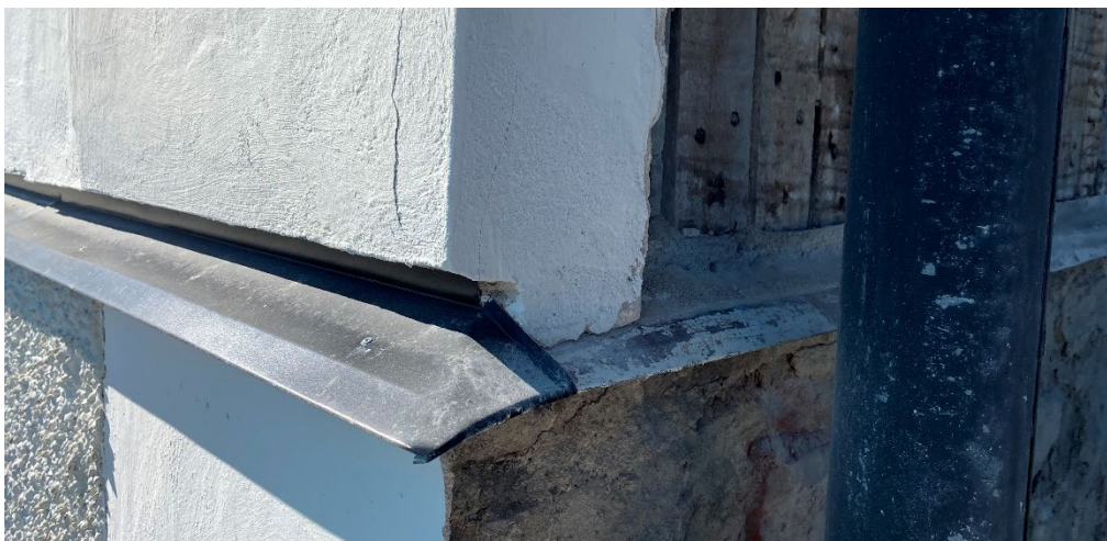
Figur 3. Under pågående arbeten. Här syns det nordöstra hörnet och två olika utföranden på plåtlist över bottenplan. Listen till höger var den som satt på den norra fasaden innan den nu aktuella renoveringen.