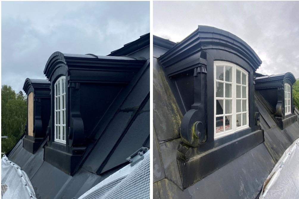
Figur 15 och 16. Under pågående renovering av fönsterbågarna i takkuporna. Tre av fyra fönsterenheter är färdigställda.