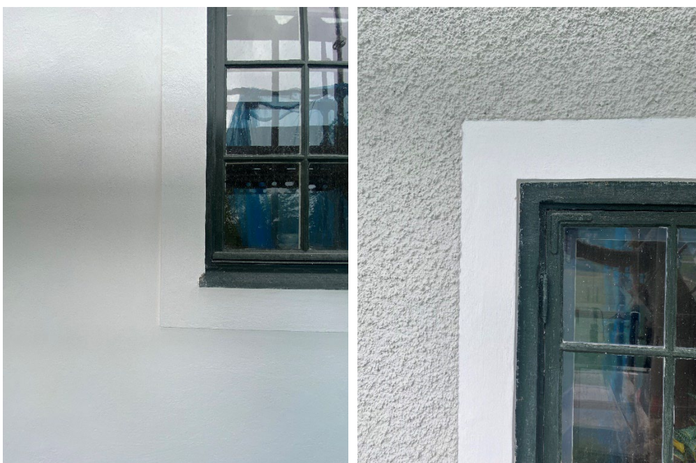
Figur 11 och 12. De nyputsade ytorna vid slutbesiktningen. Alla slätputsade partier är vita medan den spritputsade bottenväningen har en ljus grå kulör.