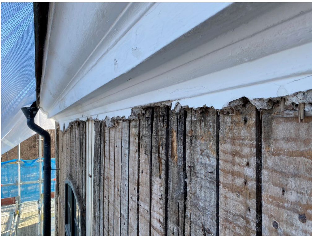
Figur 6. Takfotens puts bedömdes vara i sådant skick att den var möjlig att renovera.