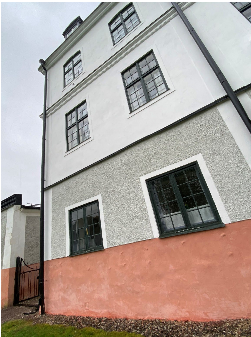
Figur 14. Sockeln är färdigrenoverad.