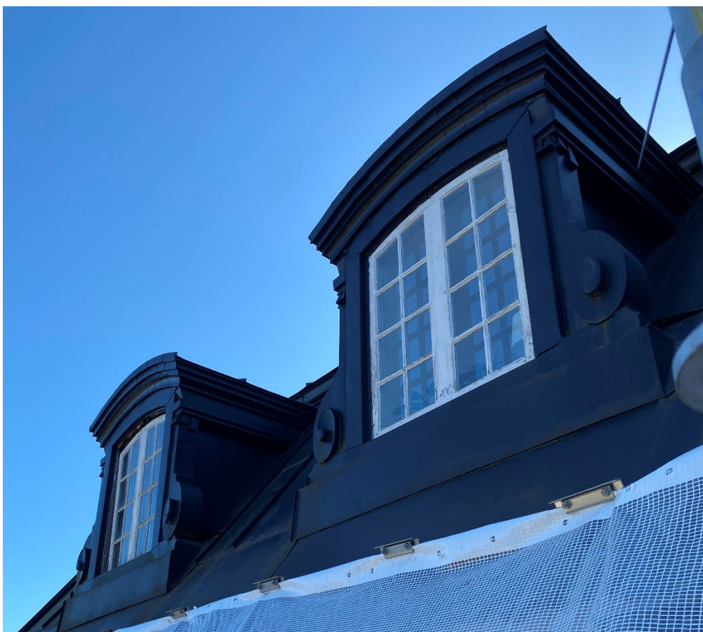
Figur 4. Fönsterbågarna i två av takkuporna innan påbörjad fönsterrenovering.