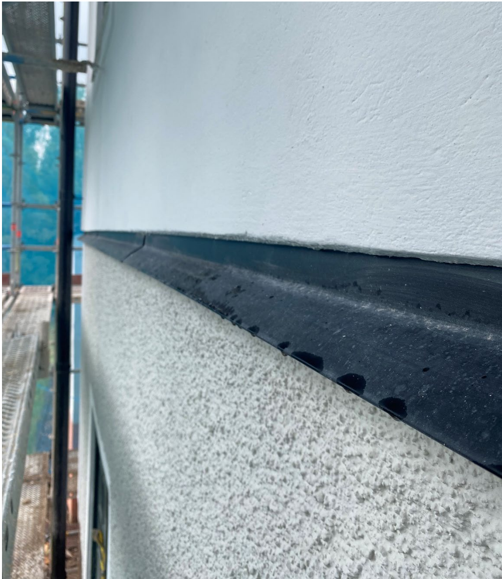
Figur 13. Ny utformning på plåtlisten som löper mellan bottenvåningens spritputs och ovanliggande slätputs. Den nya listen har ett högre uppdrag mot putsen.

När ställningen var nertagen renoverades också sockeln på den norra sidan. Detta arbete låg dock inte med i de ursprungliga handlingarna, men kunde utföras efter avstämning med Länsstyrelsen Gävleborg. Till skillnad mot fasadputsen var sockelns puts möjlig att renovera. Bomputs knackades bort, ytorna tvättades innan skador lagades upp med KC-bruk Weber 122. Avfärgning har utförts med KC-färg Weber 244.