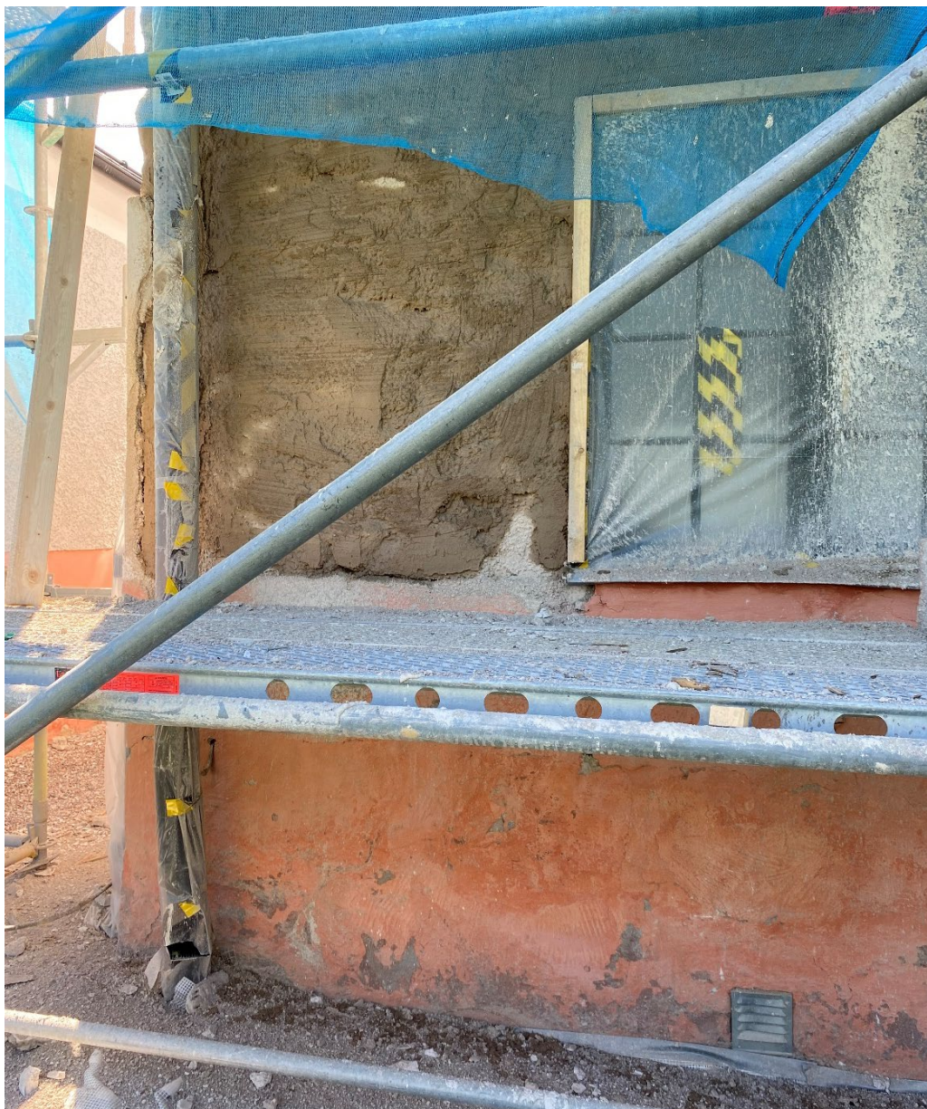
Figur 9. Omputsning pågår. Här syns också den rosafärgade sockeln innan påbörjad renovering.