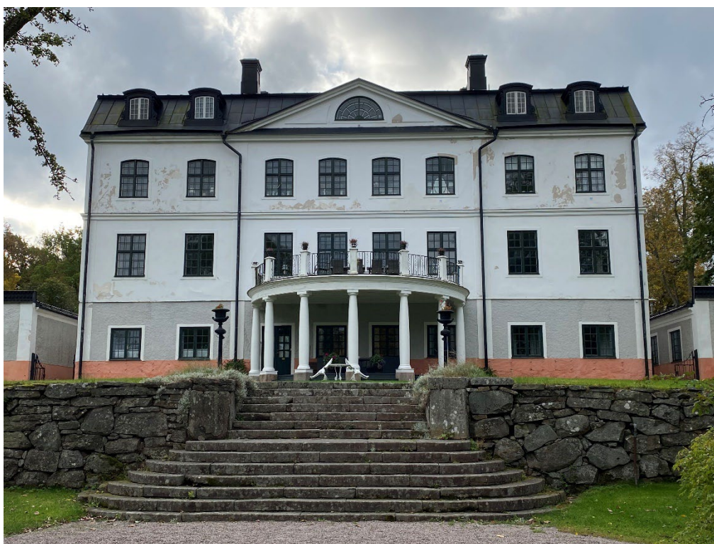
Figur 2. Forsbacka herrgård sedd från norr innan påbörjade arbeten med den norra fasaden.

Fönsterbågarna i de fyra takkuporna var i behov av renovering, liksom det stora lunettfönstret i frontonen.