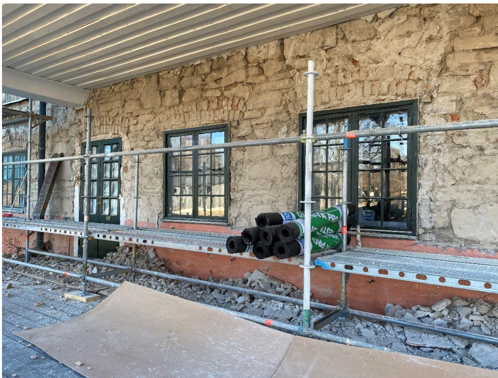
Figur 8. Under pågående arbeten. Bottenvåningens murade stomme är frilagd från spritputsen.

De putsrena träytorna behandlades med Benac 50 för att motverka framtida rötangrepp. Plåtlisten ovanför bottenplan har bytts ut till en ny list med samma utformning som listerna på herrgårdens övriga tre fasader. Det innebär ett uppdrag mot fasaden på omkring 3 cm. På träytorna kläddes en förhydringspapp av fabrikat Vesta pro AC350 och på denna en vassmatta, som underlag för putsen.