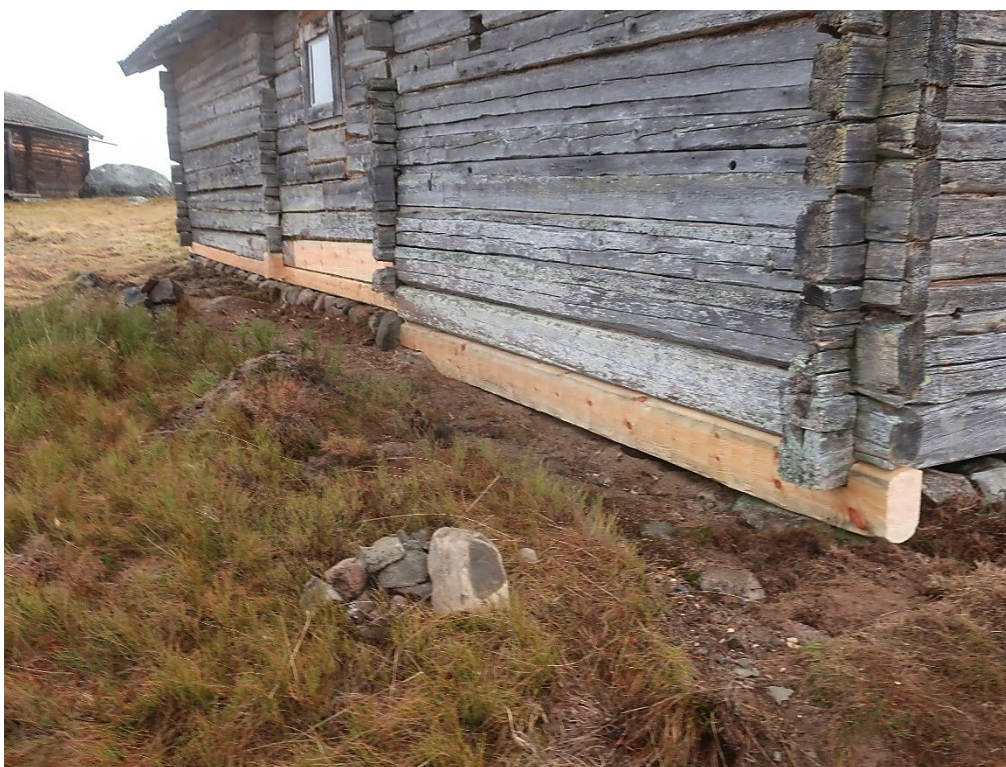
Figur 19. Vallstugans nordöstra fasad efter timmerbyten med den utbytta fyllnadsstocken till höger i bild.

Under arbetets gång visade det sig dock att även syllstocken under mellanväggen mellan farstun och stugan var rötskadad och den byttes därför ut i sin helhet. Även syllstocken mellan farstun och boden hade rötskador nedtill, men då detta var en äldre skada behövde den ej åtgärdas. Då skadorna i tre av stockarna inte var kända när offerten lämnades, men ändå behövde åtgärdas i samband med renoveringen, sökte och tilldelades fastighetsägaren ett tilläggsbidrag för denna del i oktober 2021.