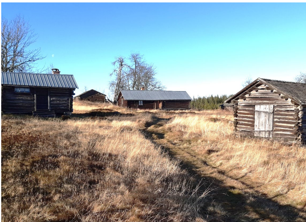
Figur 2. Den östra delen av Degerköls fäbodvall. Foto från sydöst.