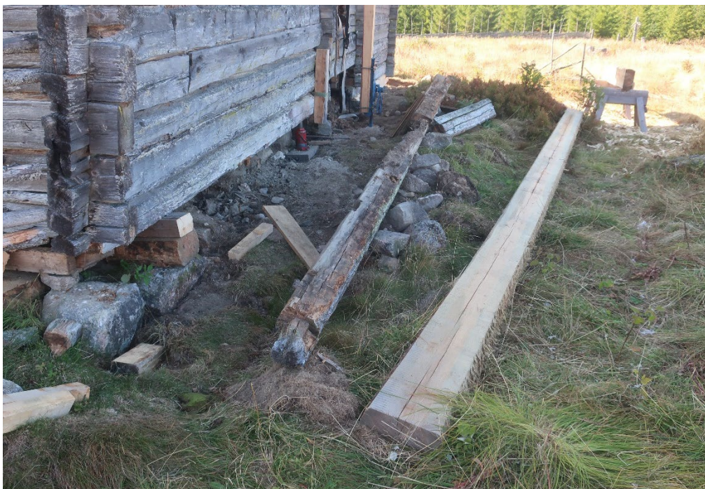
Figur 16. Framtagning av ny syllstock till vallstugans nordvästra vägg (vägg C). Till vänster om denna ligger den rötskadade syllstocken. Foto från öster.