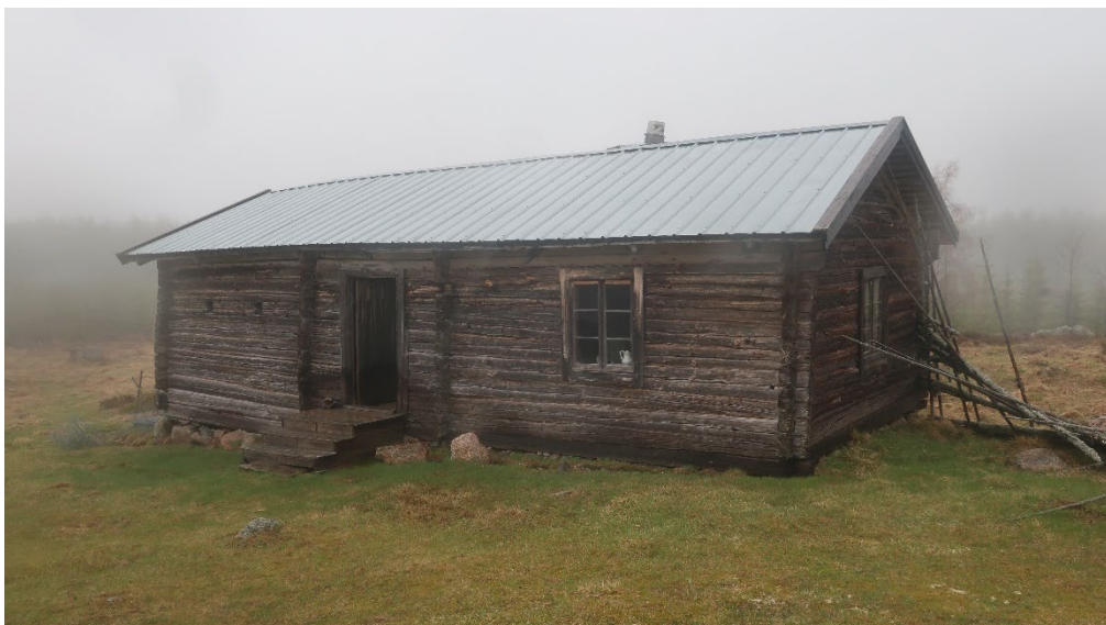
Figur 8. Lassgårds vallstuga från söder innan renoveringen inleddes. Jämför med figur 7. 2021-05-17.