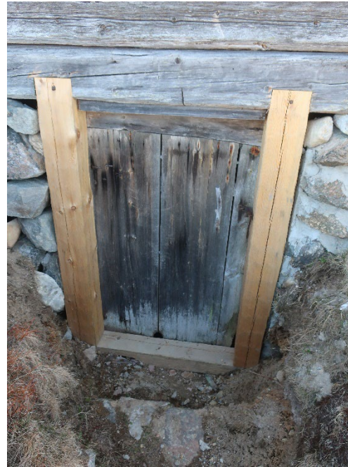
Figur 22. Detalj av källardörren med ny karm och uppresta stenkanter.

Källardörrens karm åtgärdades efter läns museets slutbesiktning i och med att det övriga arbetet blev mer omfattande än beräknat. En ny karm sattes in av samma dimensioner som den tidigare.