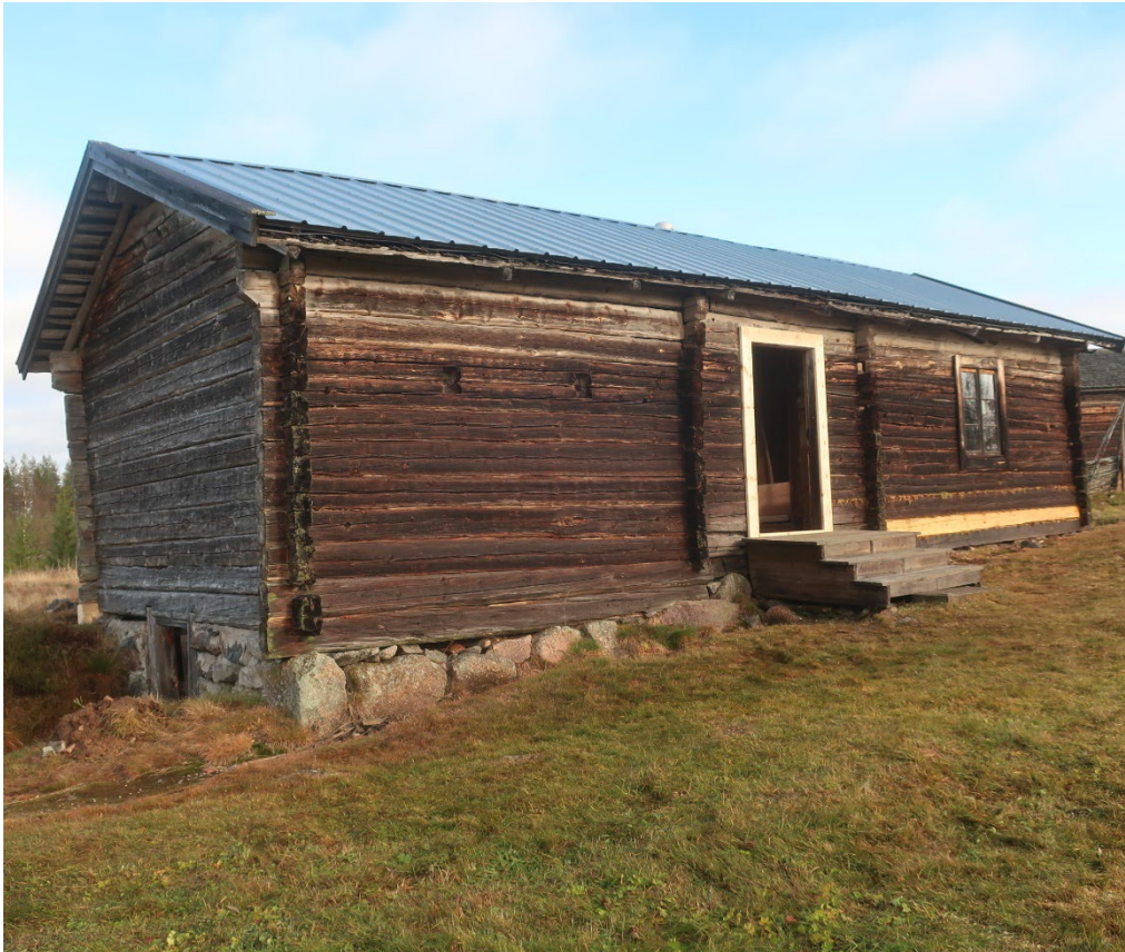
Figur 24. Vallstugan från väster vid slutbesiktningen.