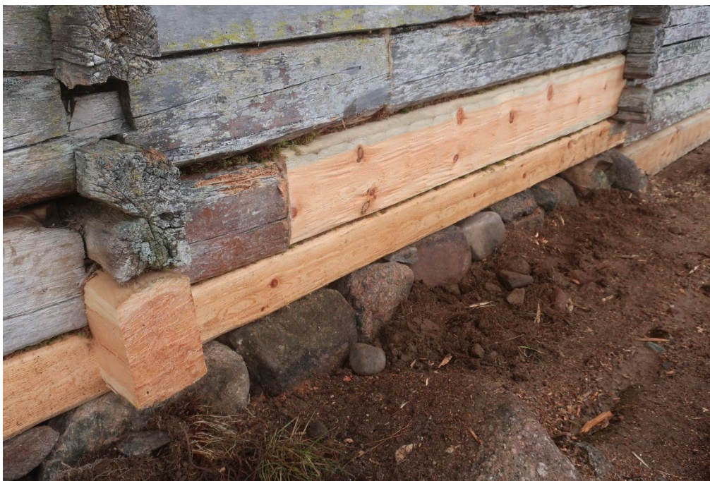
Figur 18. Detalj av mittpartiet på vallstugans nordöstra vägg (vägg C) efter byte av syllstocken och del av stocken ovanför denna.