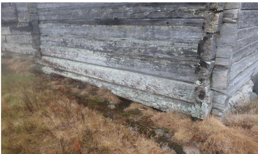
Figur 11. Detalj av den norra delen av vallstugans nordöstra fasad (vägg C) med hög marknivå och rötskadad fyllnadsstock under syllstocken.

Timmerstommen var lite sned och till vissa delar instabil. I byggnadens fasad mot nordöst, vägg C, var syllstocken och en del av stocken ovanför denna rötskadad. En kortare fyllnadsstock som låg under syllstockens norra del hade också motsvarande skador. Under arbetets gång visade det sig även att två stockar i vägg A samt syllstocken under mellanvägg F också var rötskadade, men mer om detta nedan.