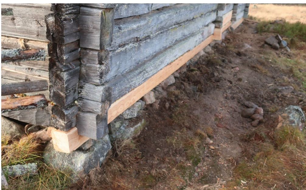
Figur 17. Syllstocken mot nordöst inlagd på rätt plats. Jämför med figur 16 ovan.

Delar av trägolvet i farstun och stugan plockades tillfälligt undan. Stugan lyftes därefter så mycket det gick och efter säkring och pallning togs de rötskadade stockarna bort. I timmerväggen mot sydväst, vägg A, har cirka en meter av syllstocken lagats i med friskt virke och den nya delen har narats fast. Dessutom har cirka fem meter av stock nummer två i samma timmervägg bytts ut. I vägg C har cirka åtta meter av syllstocken bytts ut. I likhet med den tidigare syllstocken är denna stock placerad liggande. I stocken ovanför har cirka tre meter lagats i med friskt virke i väggen mot farstun. Slutligen har en fyra meter lång fyllnadsstock placerats under syllstocken under väggen vid boden.