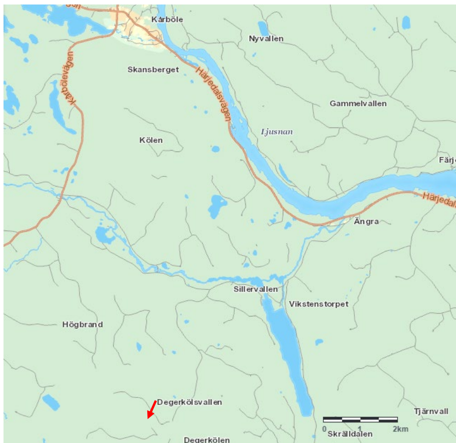
Figur 3. Utdrag ur Cx-kartan över delar av Färila socken och del av Ljusnan i kartans övre högra del. Degerköls fäbodvall är på kartan markerad med en pil.