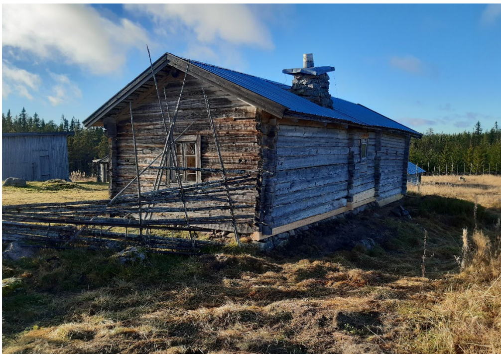
Figur 23. Vallstugan från öster vid slutbesiktningen.

Renoveringsarbetet har följt länsstyrelsens bidragsbeslut. För tillkommande delar se mer under rubrik Antikvariska ställningstaganden nedan.