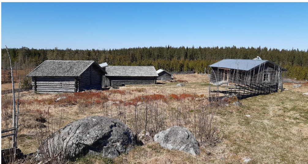
Figur 6. Lassgårds byggnader med från vänster: ladan, störset, fäxet, fårhuset och vallstugan.