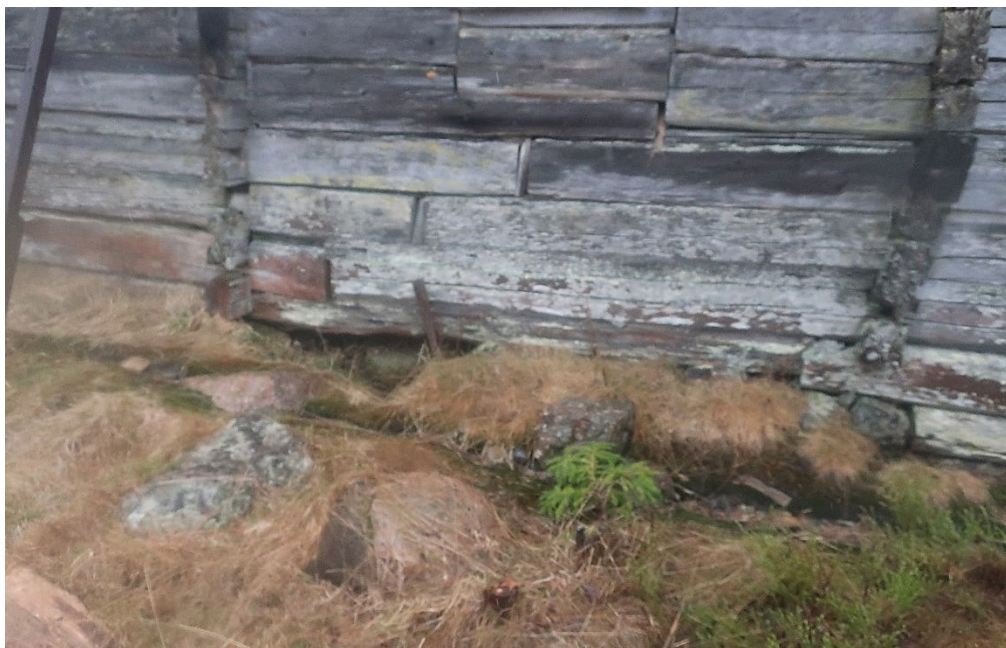
Figur 10. Detalj av den mittersta delen av vallstugans nordöstra vägg (vägg C) med hög marknivå och rötskadade stockar längst ned.