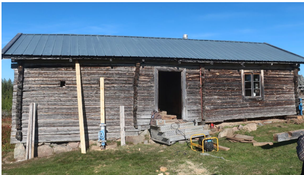
Figur 14. Vallstugan från sydväst under pågående renovering.