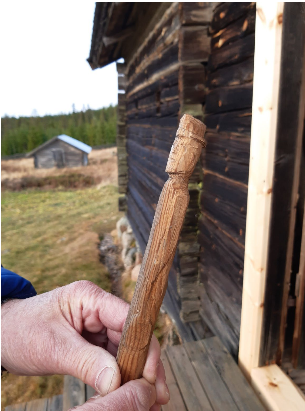
Figur 25. Den täljda trægubbe som påträffades under renoveringen undangömd på ett dolt ställe i vallstugan. Foto från sydöst.