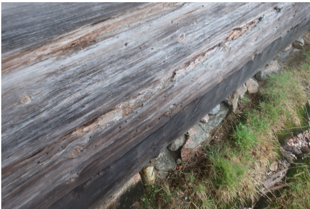
Figur 12. Detalj av vallstugans sydvästra fasad (vägg A) öster om ytterdörren med skador efter insektsangrepp. Foto från väster.