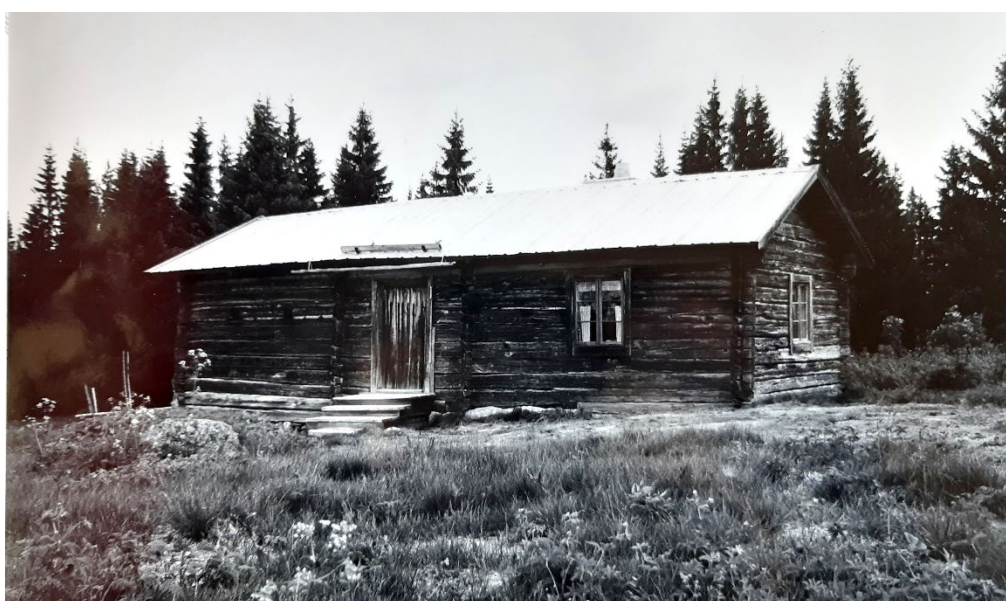
Figur 7. Lassgårds vallstuga från söder 1981. Foto: Sören Karlsson. Bilden, som här är något beskuren, finns hos fastighetsägaren.

mitt på den sydöstra fasaden. Byggnaden har en genomgående farstu med väggar klädda med tidningar och enstaka tapetvåder och här finns en väggfast säng. Nordväst om farstun finns en bod med obehandlade ytskikt, hyllor och krokar. Sydöst om farstun återfinns en stor stuga med en murad öppen spis. Väggarna är sedan 1957 klädda med obehandlad masonit och även trägolvet och innertaket är omålade. I rummet finns en väggfast säng, väggfasta hyllor, bord, äldre trästolar och väggfasta bänkar. Under vallstugans nordvästra del finns en jordkällare som nås via en källardörr mot nordväst. Byggnaden har sadeltak av pannplåt. Skorstenen är murad av natursten med en plåttäckning överst. År 2013 utförde Sven Nilsson från Hovra byte av några syllstockar samt omläggning av vallstugans plåttak. För ytterligare uppgifter om fäbodvallen och den nu Lassgårds vallstuga hänvisas till Ann Renströms byggnadsminnesutredning från 1995. 1