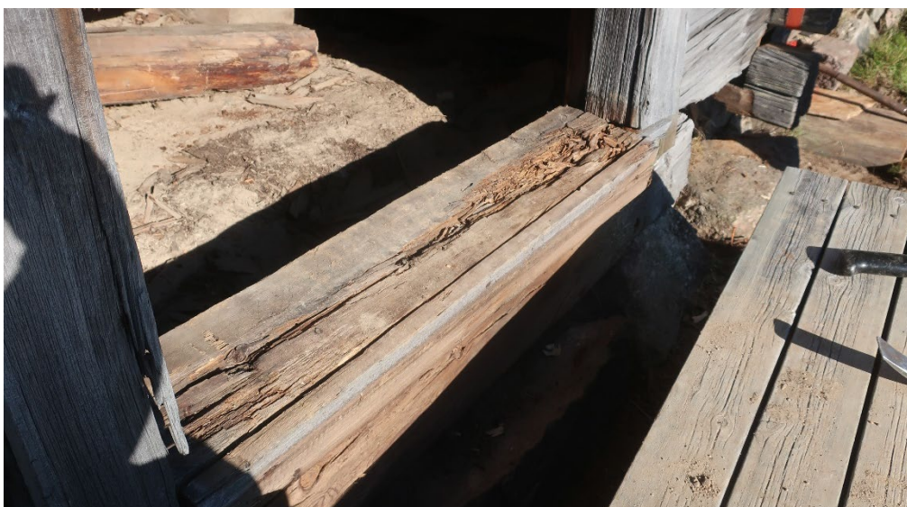
Figur 13. Detalj av rötskada i tröskeln vid vallstugans ytterdörr. Foto från väster.

Då skadorna i vallstugan ökat i omfattning under senare år tog fastighetsägaren kontakt med byggnadsvårdsfirman Gamla Trähus i Färila AB som tog fram ett åtgärdsförslag. Fastighetsägaren ansökte och tilldelades därefter byggnadsvårdsbidrag från länsstyrelsen för renoveringen av de skadade träkonstruktionerna i byggnaden samt justeringar av grunden.