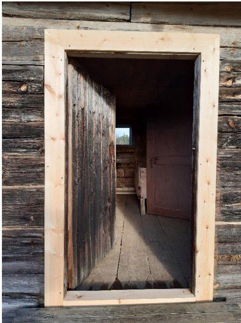
Figur 21. Detalj av vallstugans ytterdörr med ny tröskel och nya dörrfoder.