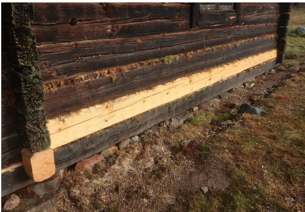
Figur 20. Detalj av den utbytta stocken i vallstugans vägg mot sydväst (vägg A). Till vänster i bild syns den ena änden på den utbytta syllstocken under mellanväggen (vägg F) mellan farstun och stugan.

Utbytta och åtgärdade delar av timmerstommen i samband med denna renoivering är således sammanfattningsvis följande (måttan är ungefärliga):