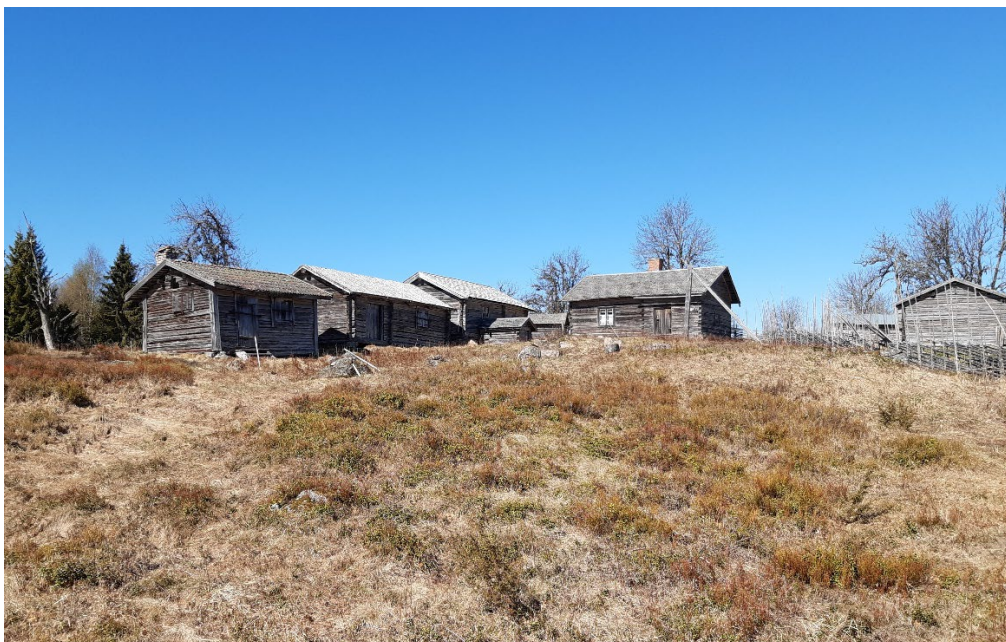
Figur 1. Degerkölsvallens södra del från öster.