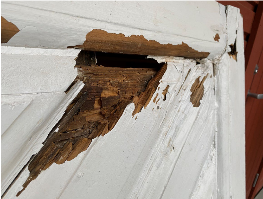
Figur 4. Rötskadorna var mest omfattande i dörrbladets yttre nedre del. På fotot ligger dörren ner.