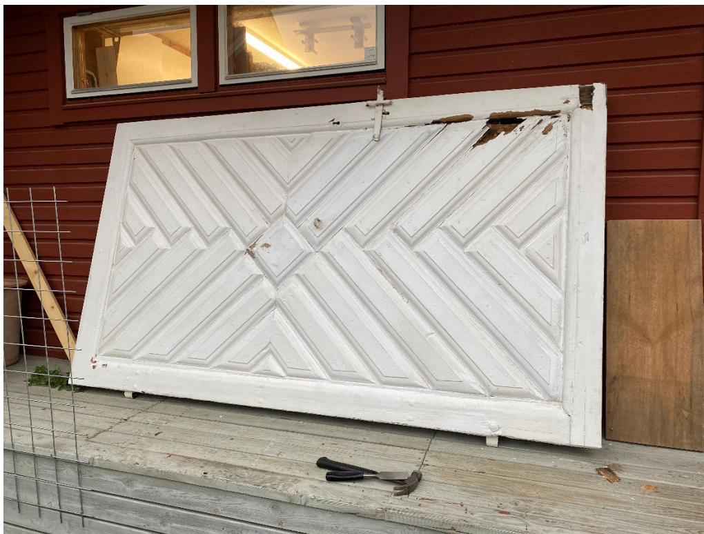
Figur 3. Dörren innan påbörjade arbeten. Den har fraktats till Gubbäcksbyggs verkstad i Hemlingby för att renoveras under vintern.

Den senaste renoveringen av kapellet ytterdörr skedde 1997. Ramen förefaller bestå av ursprungligt eller tidigt virke, medan mycket av virket i fyllningspanelen tillkom vid 1990-talets renovering. Flera delar var nu rötskadade. Skadorna var framför allt koncentrerade till dörrbladets nedre yttre hörn. En av orsakerna till rötskadorna är att ytterdörren målats med en felaktig färgtyp, en tät akrylatfärg. Utöver detta var glipor tätade med en latexfog.