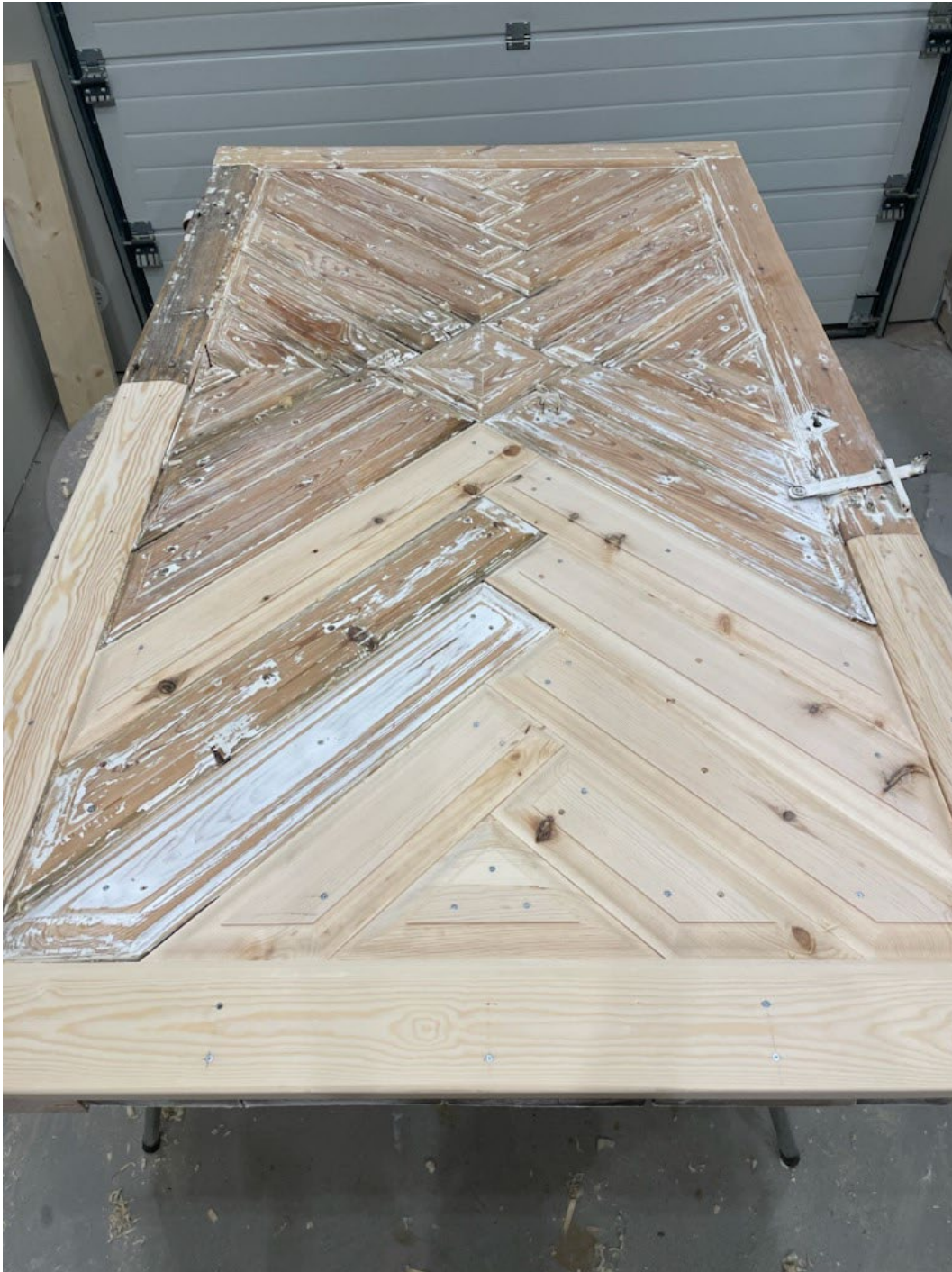
Figur 7. Under pågående arbeten. Här syns vilka delar som bytts ut till nytt virke.