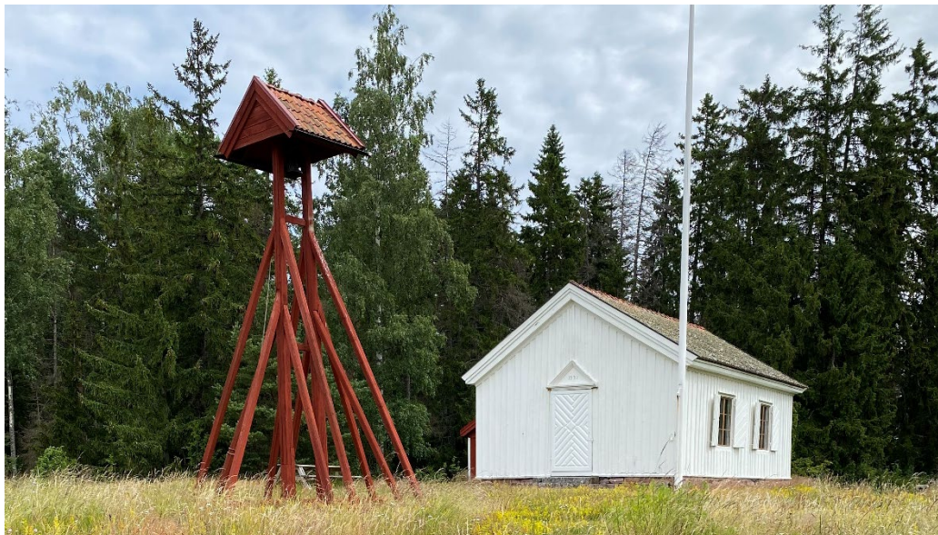
Figur 2. Lövgrunds kapell och klockstapel sedd från väster efter avslutade arbeten.

Invändigt är interiören mycket intakt med obehandlat brädgolv och vitmålade timmerväggar. Bänkinredningen är omålade. Koret är i blickfånget med sin altarpredikstol placerad mitt emellan östväggens två fönster. Predikstolen bärs upp av kolonner och det blåmålade mittfältet pryds av ett guldfärgat kors. Väggen bakom predikstolen är pappspänd och målad blå. Mellan fönstren hänger en oljemålning från 1859 som föreställer Christi uppståndelse ur grafven . Målningen fungerar som kapellet altartavla. Direkt framför predikstolen finns ett litet altare i trä. Kapellet interiör har sannolikt genomgått väldigt få förändringar sedan byggtiden.