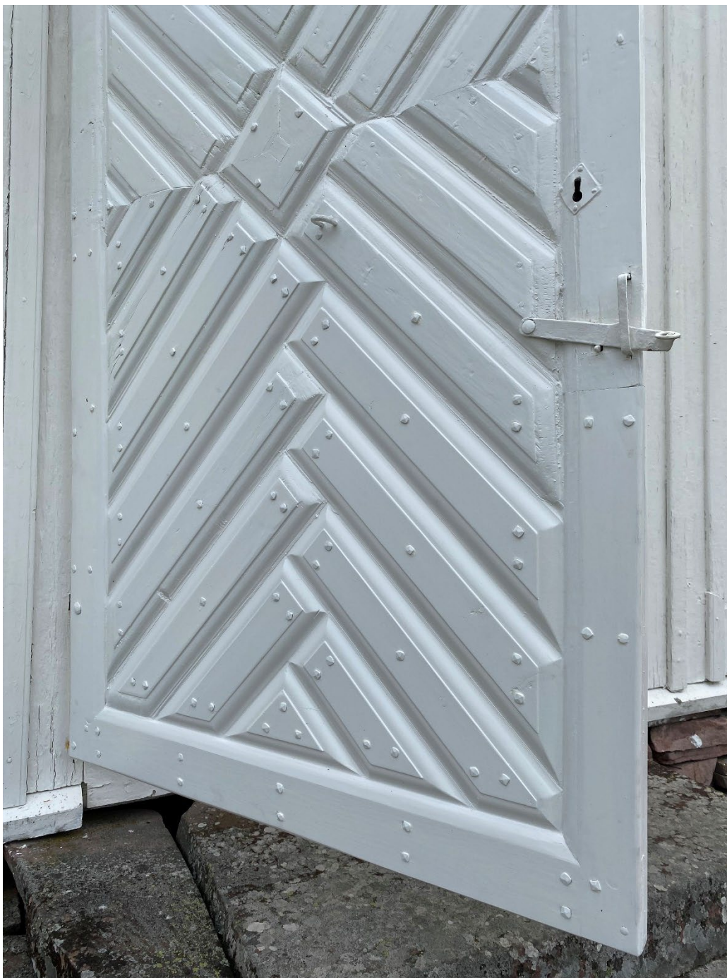
Figur 9. Dörren efter avslutade arbeten.