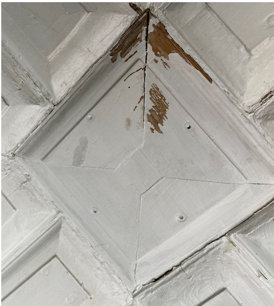
Figur 6. I mittplattan fanns missprydande synliga skruvar.