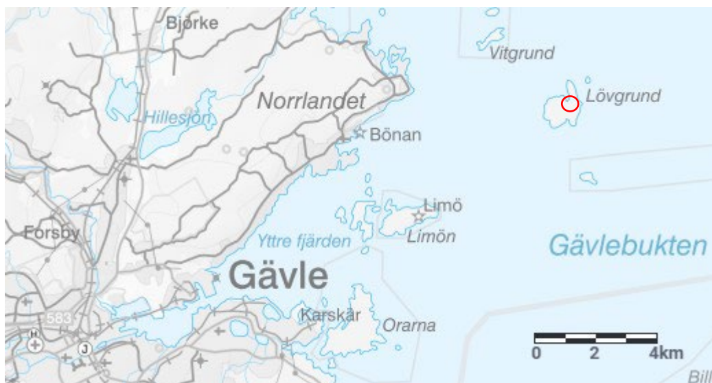
Figur 1. Utdrag ur Digitala Planarkivet. Platsen för Lövgrunds kapell är inringad.