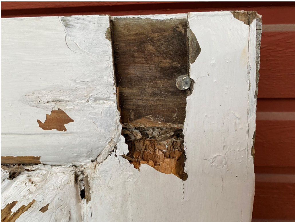
Figur 5. Rötskadorna var mest omfattande i dörrbladets yttre nedre del. På fotot ligger dörren ner.