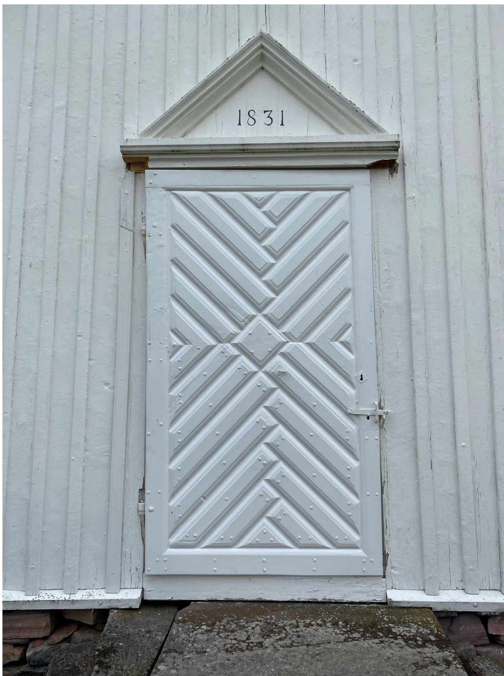
Figur 8. Dörren efter avslutade arbeten.