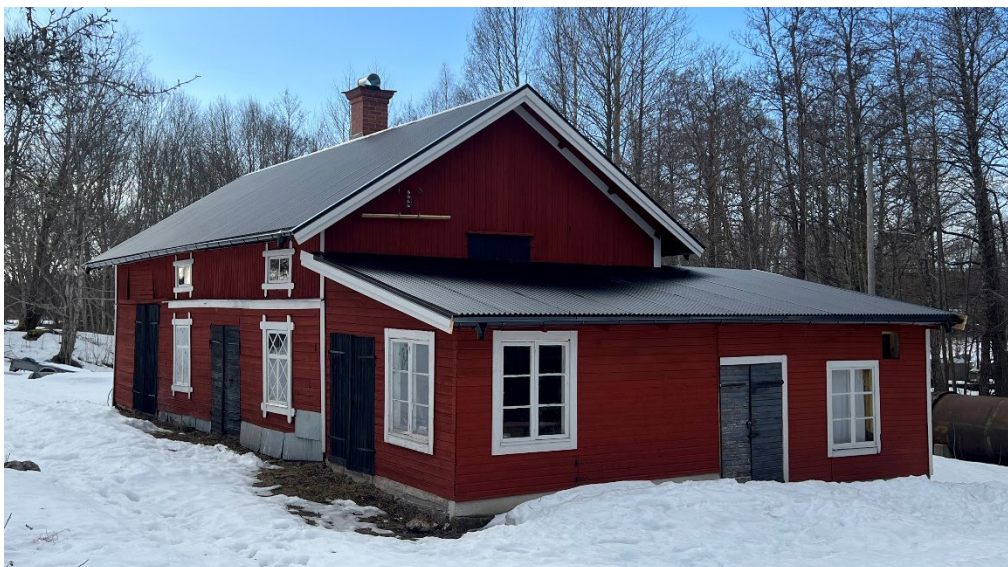
Figur 22. Vid slutbesiktningen var arbetena nästan färdigställda. Båda taken var täckta med svart sinuskorrugerad plåt. På tillbyggnaden kvarstod dock ännu montering av foder och stuprör. Foto: Stéphanie Forsmark, mars 2026.