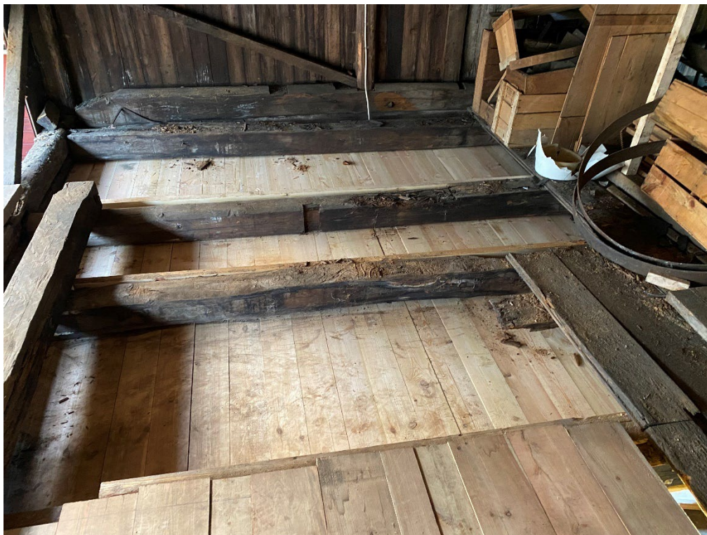
Figur 18. Under pågående arbeten med bjälklaget ovanför smedjan. Två bjälkar har förstärkts och den närmaste, som döljs under brädgolvet kant, har lagats i med nytt virke.

En golvbjälke har lagats i med nytt virke och ytterligare två golvbjälkar har förstärkts med nytt virke. Ett nytt brädgolv med breda plank har monterats på vinden, i delen närmast den östra väggen. Virket i golvet är kilsågad kärnfuru och kommer från Åttersta såg. Ny pärlspontpanel av hyvlat virke har monterats i smedjans tak närmast den östra väggen. Panelen ska målas med svart linoljefärg så snart säsongen tillåter.