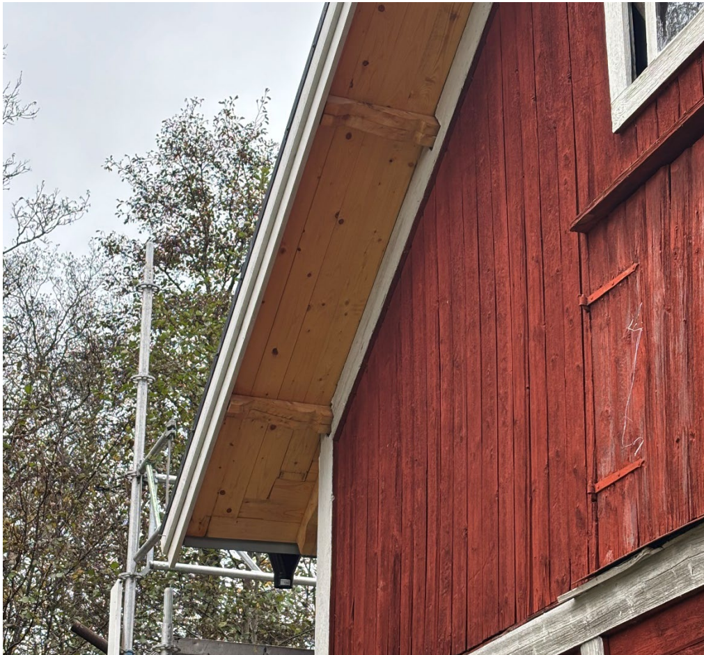
Figur 11. Några taktassar har nytillverkats med de gamla som förlaga. Vid slutbesiktningen 2025-10-28 kvarstod ännu inmålning av det nya virket.