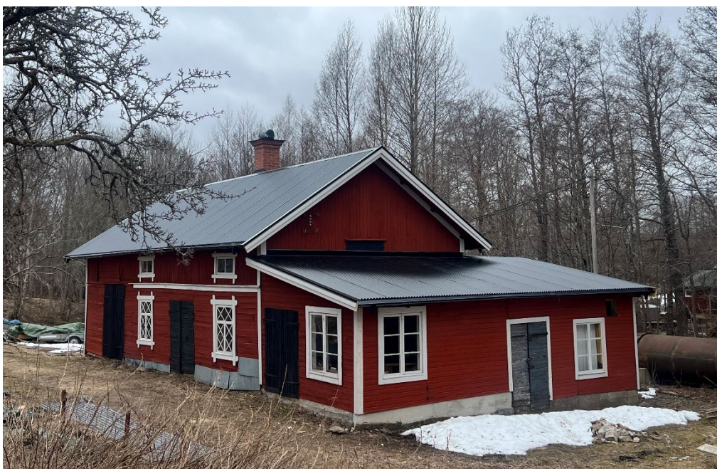
Figur 23. Under slutet av mars 2026 var nästa alla delar färdigställda exteriört. Foder har monterats men ännu återstår montering av stuprör.