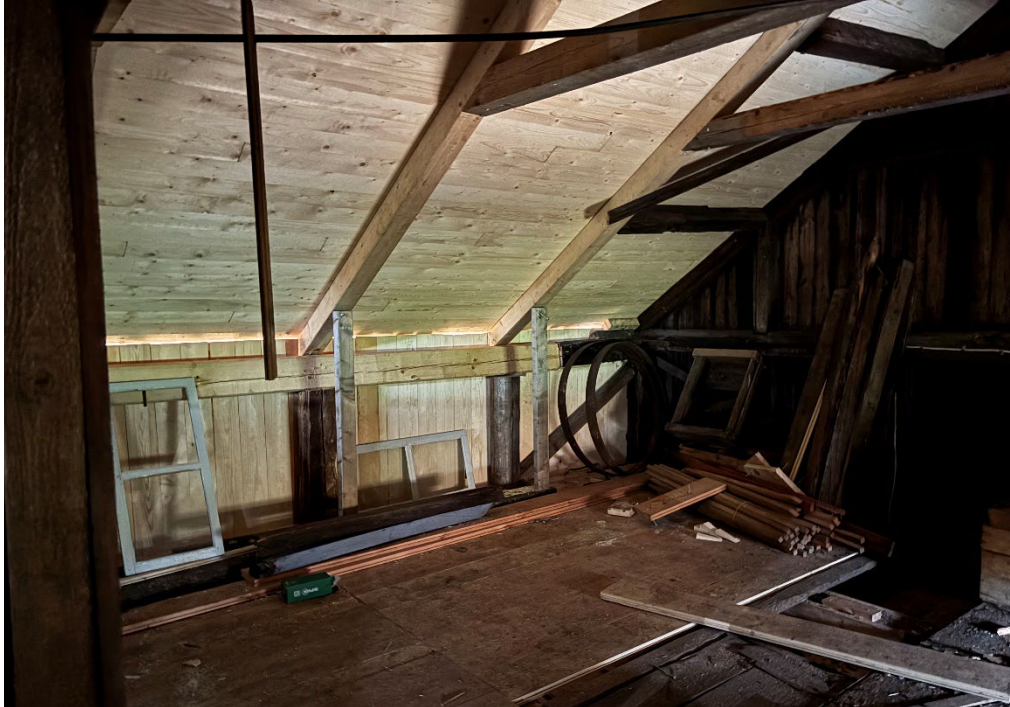
Figur 15. Foto mot den östra långsidan. Tre timmerstockar har lagats i högst upp i väggen. Ny fasadpanel är monterad. Notera även de nya takbjälkarna som syns på fotot. Dessa åtgärdades under 2024 av den första entreprenören.

På smedjans östra sida, närmast den södra gaveln, har tre timmerstockar lagats i med nytt virke. Stockarna är beställda genom Snickeri Byggtimmer och är i dimensioner 15x20 centimeter. Dessa delar är belägna högst upp på väggen. Cirka 5 meter av timmerstockarna har bytts ut till nytt friskt virke.