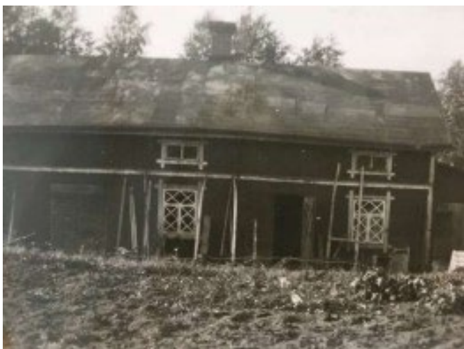
Figur 13. Tack vare ett äldre fotografi har rekonstruktion av smedjans skorsten varit möjlig.

Överbeslag i svart plåt har monterats på skorstenen. Överbeslaget har stående fals i fyra hörn och är fäst med trådklammar i fogen. En halvmåneformad huv, s.k. omegahuv, i svart plåt har monterats för att skydda skorstenen. Eftersom det ska eldas i skorstenen vid smide är denna form mest ändamålsenlig. Ett finmaskigt nät har monterats som skydd mot fåglar.