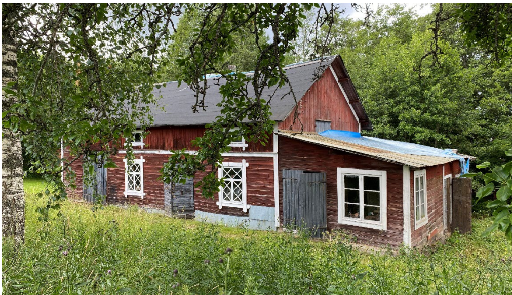
Figur 5. Innan påbörjade arbeten. Byggnaden sedd från nordöst. Taken skyddades delvis av plåt men till största del med papp och en presenning.