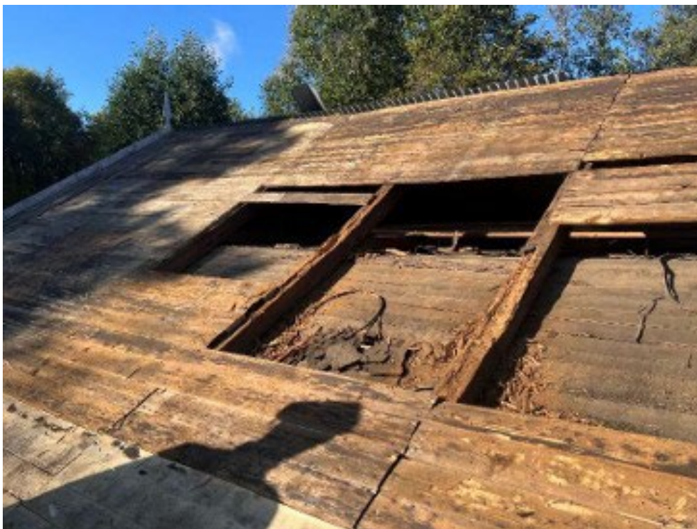
Figur 6. Under pågående återställningsarbeten hösten 2025. Då den felaktiga plåten och den felaktigt lagda pappen hade rivits bort blottades kraftiga rötskador i både råspont och takbjälkar.