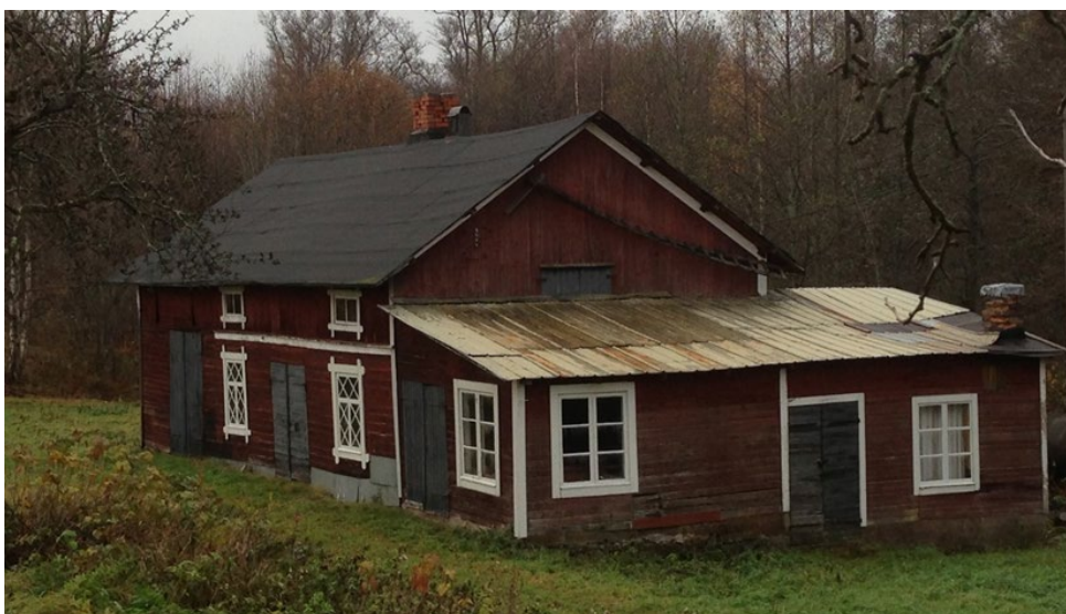
Figur 3. Smedjan sedd från norr omkring 2013. Notera att både smedjan och tillbyggnaden hade kvar skorstenarna vid tiden.

Taktäckningen på både smedjan och den lägre tillbyggnaden var i uttjänt skick. Några av takbjälkarna var rötskadade, liksom en del av takpanelen. Vindskivor var uttjänta eller saknades helt. Under projektets gång uppdagades rötskador i fler takbjälkar och även i vindsgolvet och två timmerstockar i smedjans vägg mot väster. I anslutning till det murkna timret var även fasadpanelen rötskadad. I tillbyggnaden som rymt tvättstuga och skostall var de flesta av takbjälkarna rötskadade liksom råsponen. I tillbyggnaden upptäcktes senare även två rötskadade väggreglar i anslutning till en raserad betongsula.