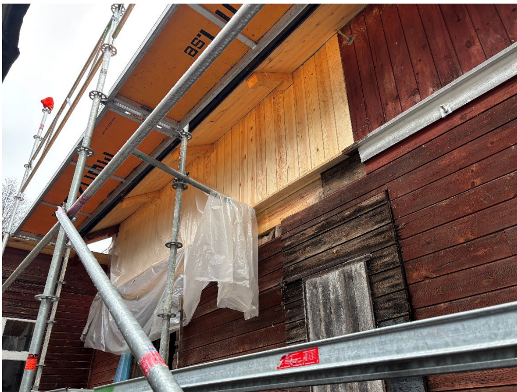
Figur 16. Vid slutbesiktningen 2025-10-28 var den nya panelen monterad på smedjans västra sida. Den underliggande listen var inte åtgärdad.