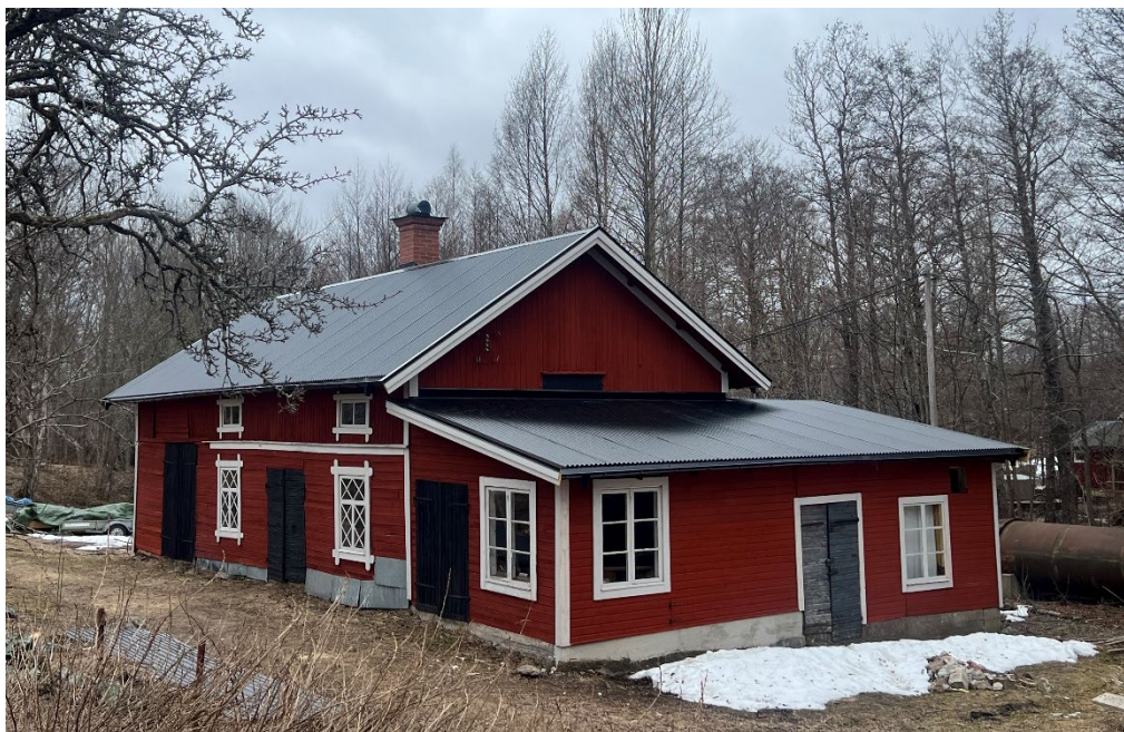
Figur 1. Smedjan och tillbyggnaden sedd från sydväst efter avslutade arbeten.

Länsstyrelsen Gävleborgs beslut är daterade 2024-04-02, 2024-08-28 och 2025-10-13, samtliga med dnr: 9092–2023.