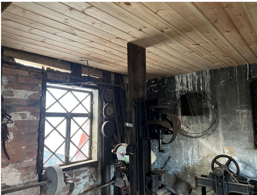
Figur 21. Det nya taket i smedjan ska målas med svart linoljefärg så snart säsongen tillåter.