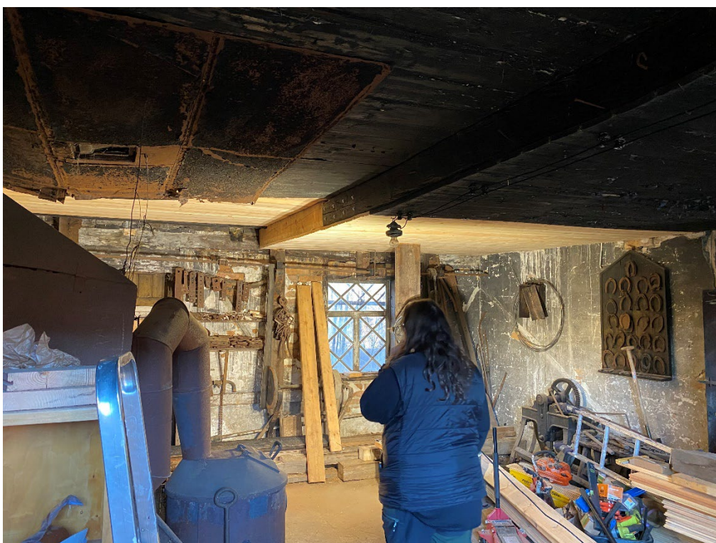
Figur 20. Under pågående arbeten. Från smedjan syns de ilagade bjälkarna och delar av den nya takpanelen.