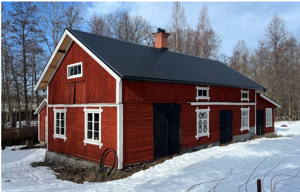
Figur 12. Efter avslutade arbeten. Smedjan sedd från sydöst. Ännu återstår montering av stuprören. mars 2026.