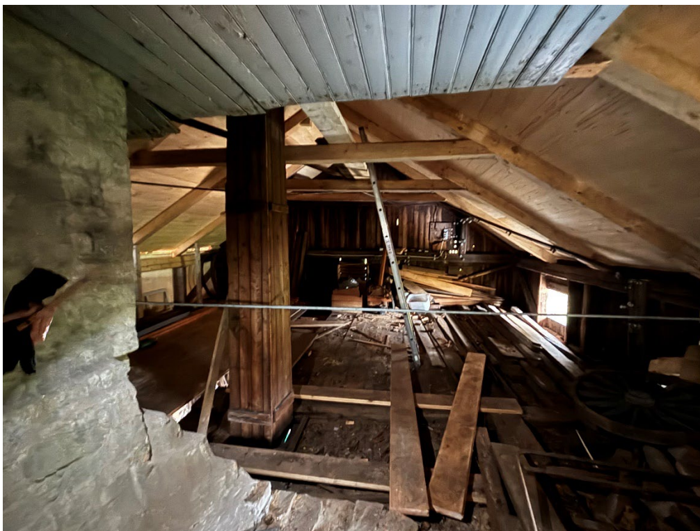
Figur 9. De flesta takbjälkar är bytta. Råsponten är bytt. Foto mot norr. Längst bort till vänster syns de lagade delarna i den västra väggen.