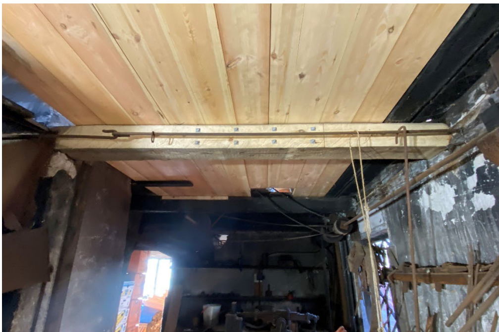
Figur 19. Under pågående arbeten. Från smedjan syns den bytta bjälken.