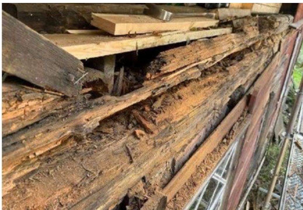
Figur 7. Kraftiga rötskador i den västra väggen på smedjan. Dessa skador uppdagades då den nya entreprenören hade anlitats hösten 2025.