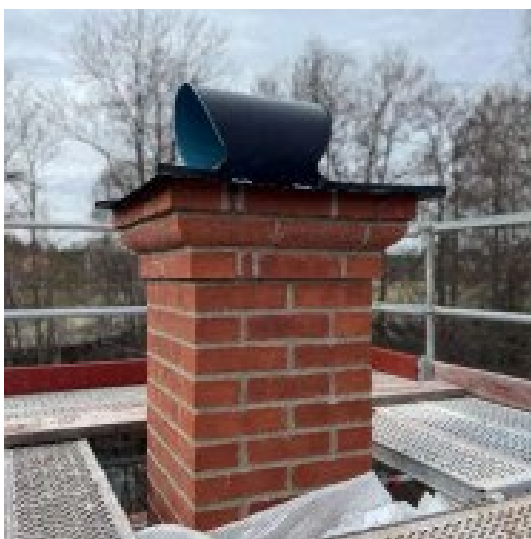
Figur 14. Skorstenen med beslag och huv är färdig.