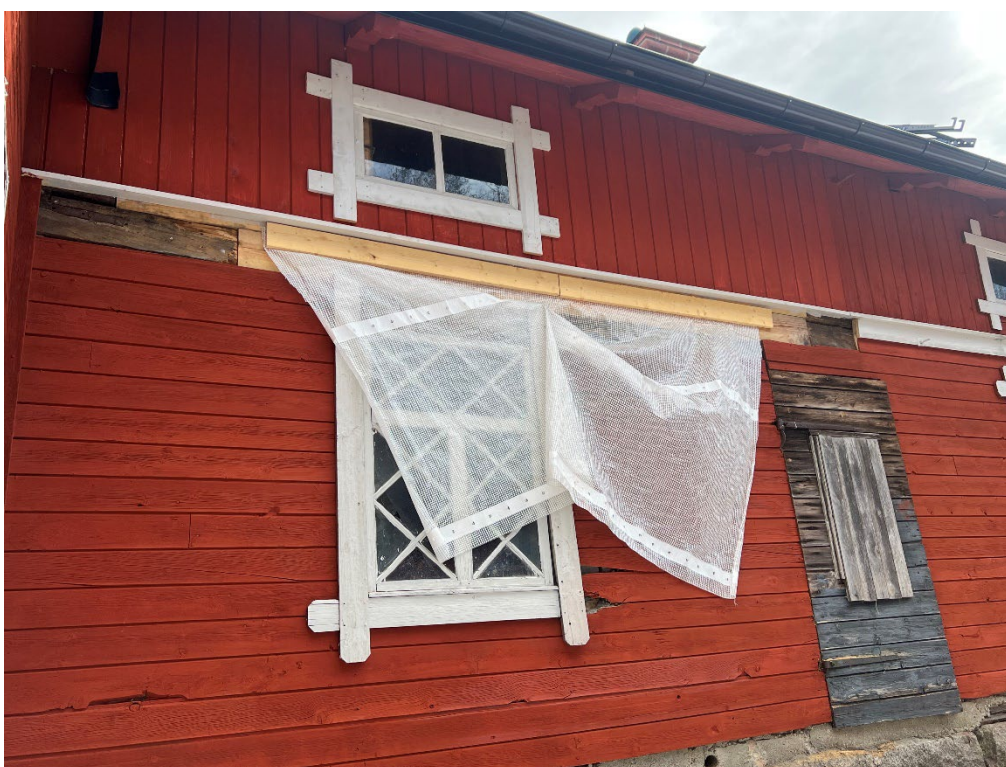
Figur 17. Foto från beställaren som visar den näst intill färdigställda nya panelytan på smedjans östra sida. Ännu återstår arbeten med den underliggande listen. Foto: Stéphanie Forsmark, mars 2026.