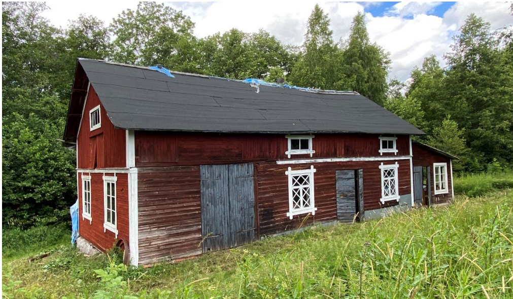
Figur 4. Innan påbörjade arbeten. Byggnaden sedd från sydöst. Taken skyddades av papp och en presenning. Notera svackor i takfallet. Den högre byggnadskroppen rymmer mekanisk verkstad och smedja och den lägre tillbyggnaden rymmer skostall och tvättstuga.