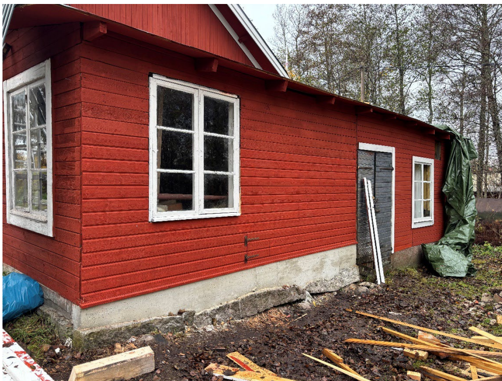
Figur 24. En ny betongsula har gjutits efter tillbyggnadens långsida, från det västra hörnet och fram till dörren. Notera att den lilla luckan snett nedanför fönstret, har återskapats i den nya panelen.

den nya väggen. Den nya panelen och befintlig panel har målats med äkta Falu rödfärg, den ljusa varianten och fodren har målats med Gysinges linoljefärg i kulör med 7% grön umbra.