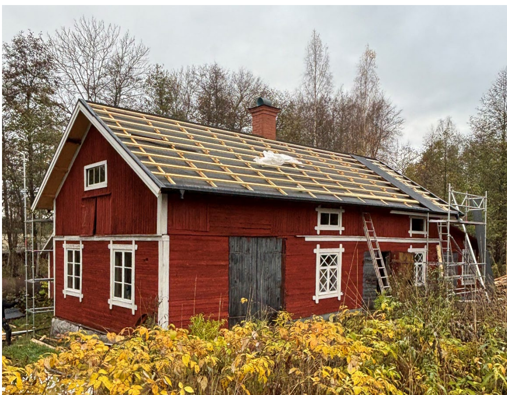
Figur 10. Vid slutbesiktningen 2025-10-28 pågick montering av sinusplåten och detta arbete färdigställdes några dagar senare. På fotografiet syns den nymurade skorstenen samt vindskivor och vindskivebeslag.