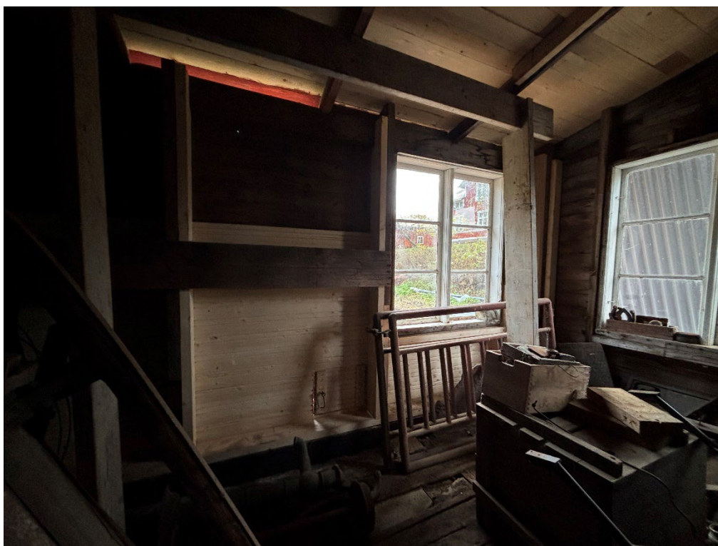
Figur 25. Inifrån skostallet syns de två nya reglarna och den nya panelen.