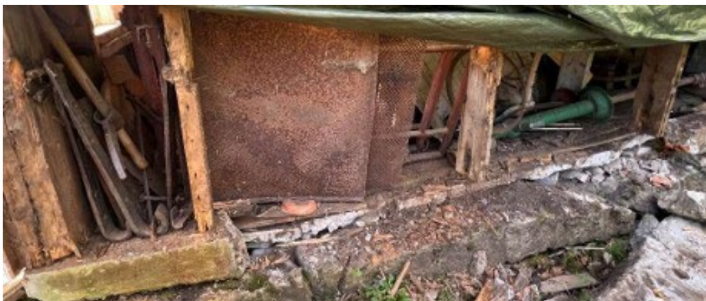
Figur 8. Raserad betongsula på tillbyggnaden samt rötskadade reglar ovanför denna. På fotot är panelen redan bortriven.