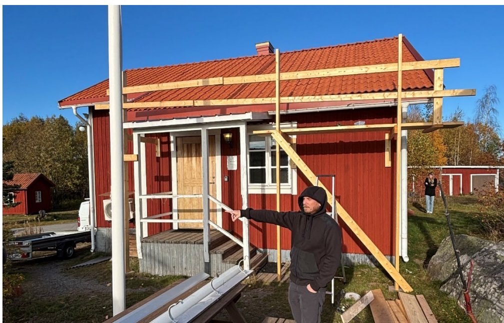
Figur 12. Skärså samlingslokal sedd från söder vid slutbesiktningen. Montering av plåtar kring entrépartiet pågick och skulle färdigställas senare samma dag.