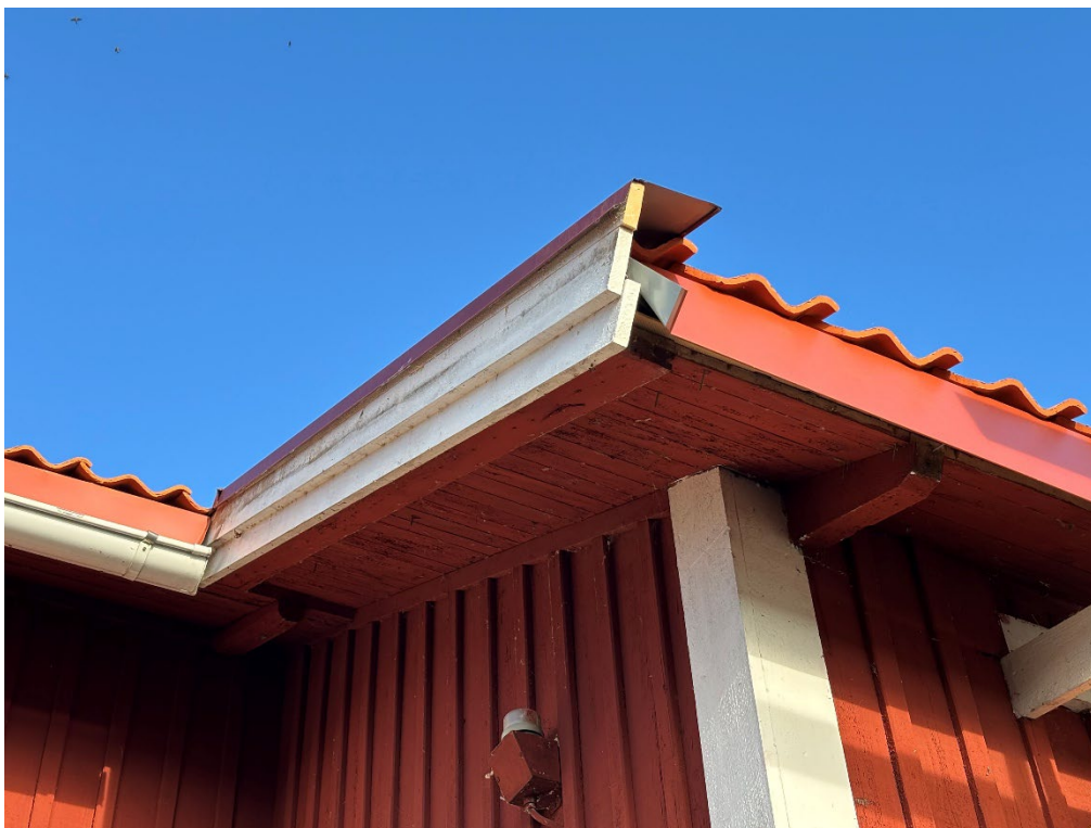
Figur 13. Skärså samlingslokal vid slutbesiktningen. På det södra takfallet har vindskivorna varit nödvändiga att höja lite eftersom en puckel på takfallet har rätats ut genom shimsning. De nya trädelarna ska målas vita så snart vädret tillåter. Notera den nytillkomna fotbrädan i plåt till höger.