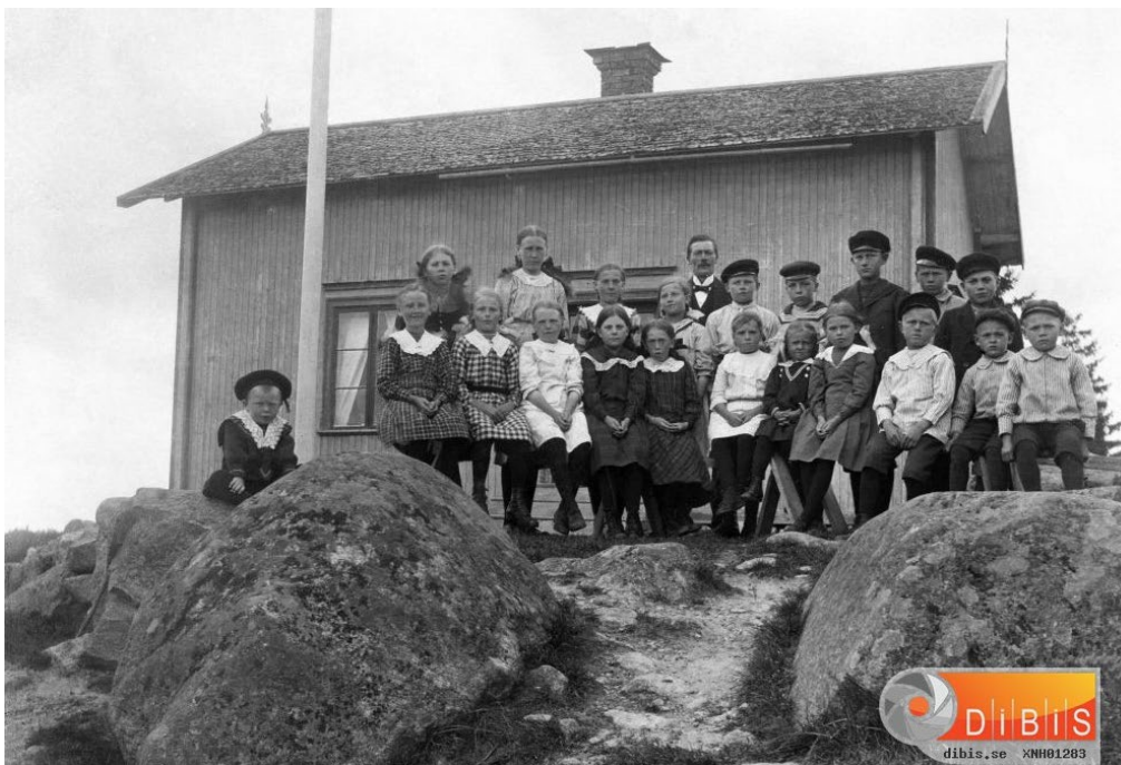
Figur 3. Skolbarn framför Skärså skola, okänt årtal och fotograf. Bildbeteckning: XNH01283.