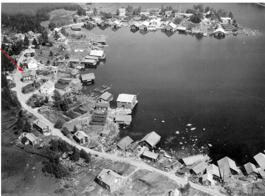
Figur 4. Flygfoto över Skärså från år 1953. Skärså samlingslokal är markerad med en pil. Foto från Digitalt Museum, bildbeteckning: XLM.FLYG1789.