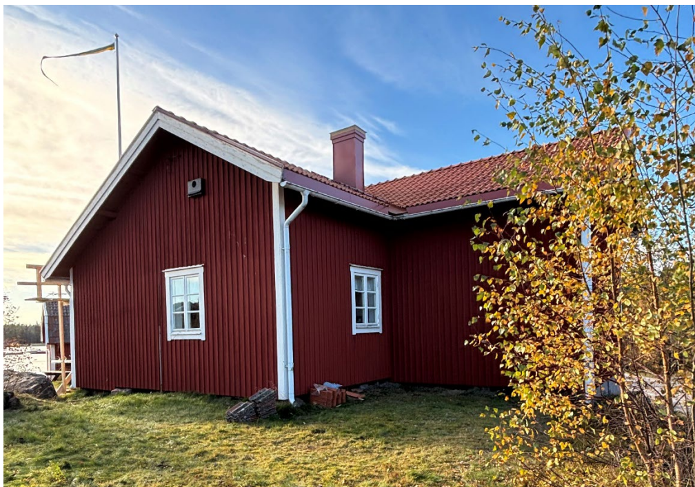
Figur 11. Skärså samlingslokal sedd från nordöst vid slutbesiktningen.