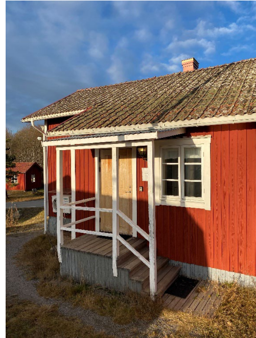
Figur 6 och figur 7. Samlingslokalen i Skärså innan påbörjade arbeten. Till vänster sedd från väster och till höger sedd från söder. Takets lertegel och underliggande läkt var uttjänt.