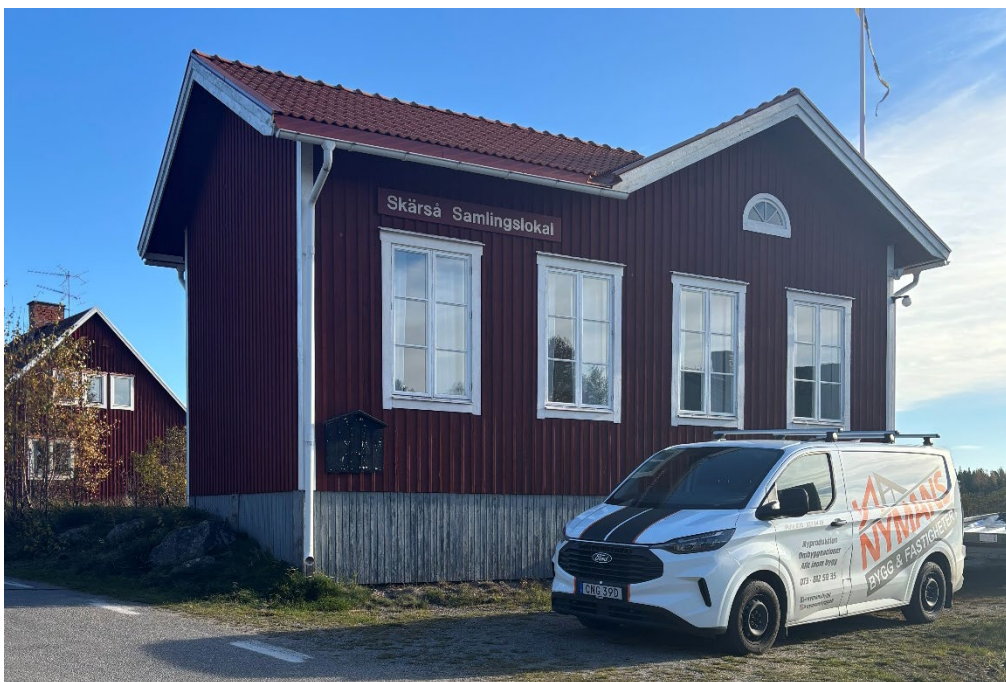
Figur 1. Skärså samlingslokal sedd från väster efter avslutade arbeten.