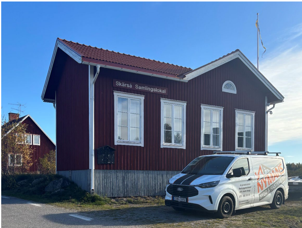
Figur 10. Skärså samlingslokal sedd från väster vid slutbesiktningen.