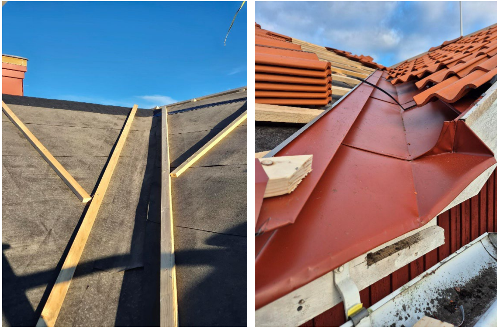
Figur 8 och figur 9. Under pågående arbeten. Ny papp har lagts på oljehärdad board. På denna ligger läkten på vilken det nya tvåkupiga lerteglet har monterats. Ränndalarna är nytillverkade i röd plåt.