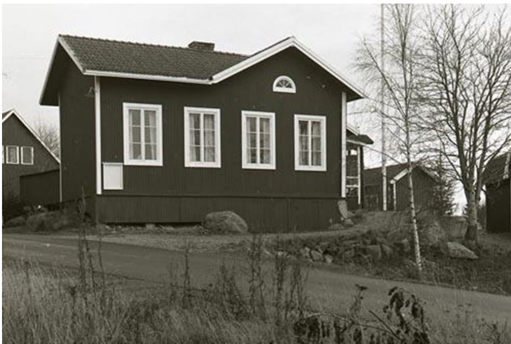
Figur 5. Skärså samlingslokal sedd från väster år 1982. Den paneltäckta grunden tycks vara rödmålad.