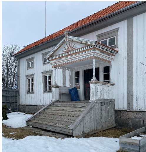
Figur 5 och figur 6. Innan påbörjade arbeten. Brokvistens trapplopp var nästintill rakt. På den östra sidan fanns en lucka som ledde in under brokvisten.