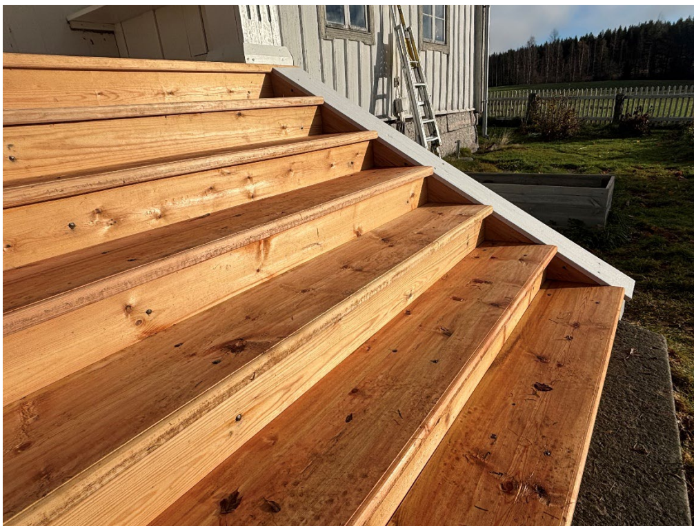
Figur 14. Stegens och broplanets ytskikt är hyvlade med oxhyvel som ger en levande yta.