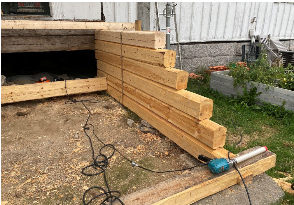
Figur 11. Här syns hur brokistans sidor är höjtimrade med en stock längst bak och en stock längst fram.