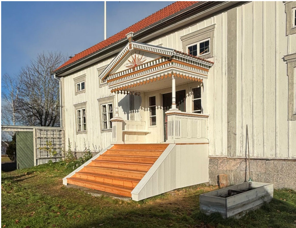
Figur 20. Den färdigrenoverade brokvisten på hälsinggården Skogens.