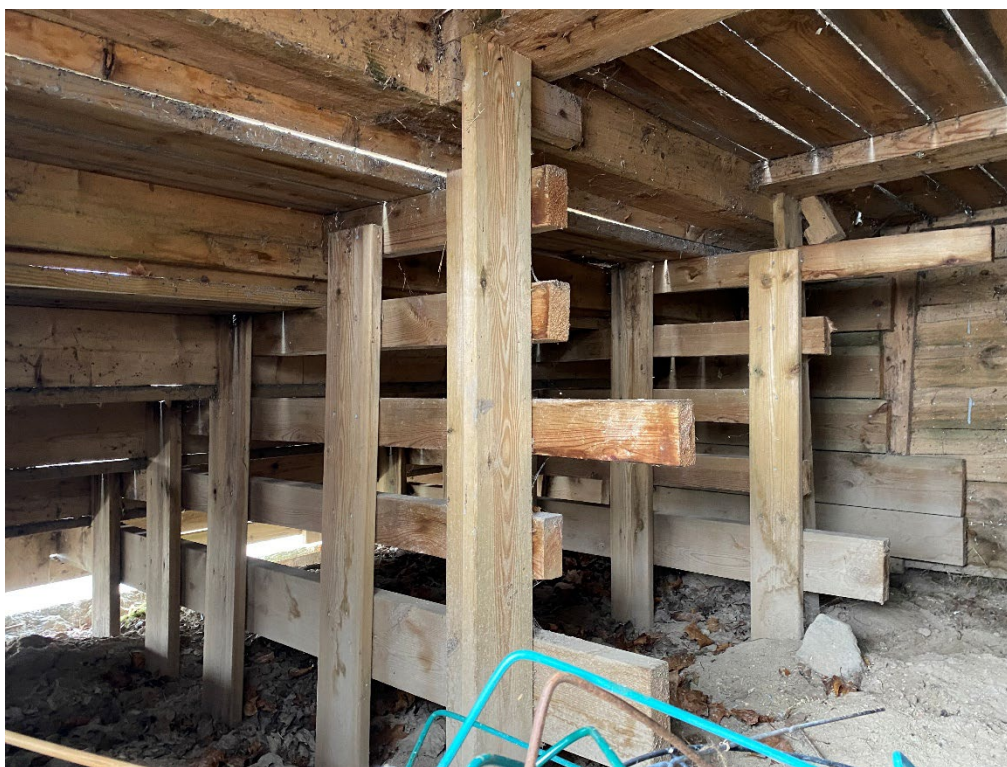
Figur 3. Innan påbörjade arbeten. Brokvistens trappa och broplan vad uppstogade med tryckimpregnerat virke.