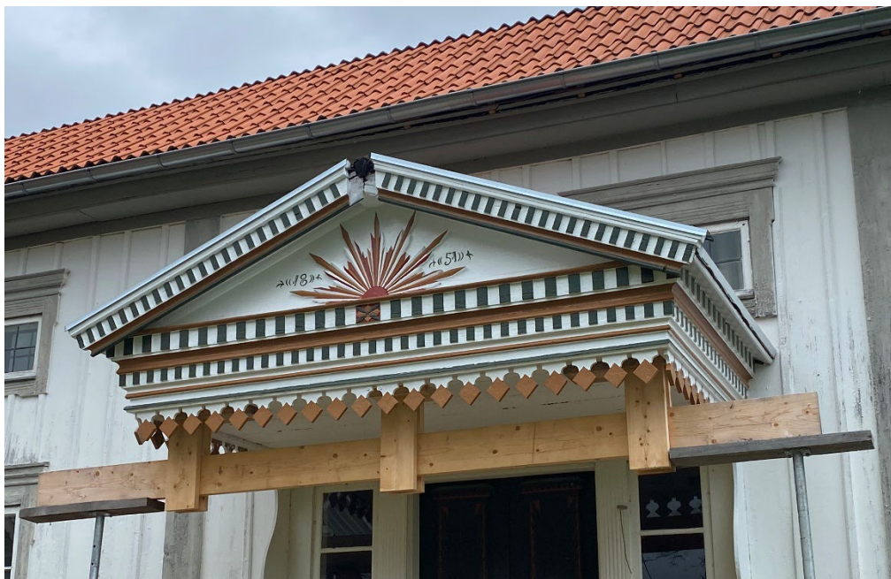
Figur 9. Gavelstycket pallades upp innan underliggande delar demonterades och till viss del sanerades. På fotot är målningsarbetet slutfört och det enda som återstår på gavelstycket är monteringen av kronan och återmonteringen av takeglet.

För att få bort en del tyngd i gavelstycket så plockades teglet av. Därefter pallades gavelstycket upp så att de svarvade stolparna, socklarna och sidostycken kunde demonteras. Delarna demonterades så hela det bara var möjligt. Tryckimpregnerat virke i både ytor och den underliggande stommen sanerades bort.