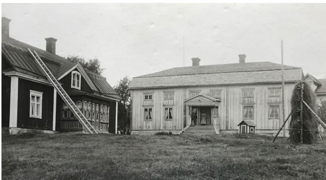
Figur 2. Hälsingegården Skogens sedd från söder på ett fotografi från omkring sekelskiftet 1800–1900. Till vänster syns bostadshuset som uppfördes 1793. Den ljus färgade byggnaden är den som är aktuell i detta projekt. Huset byggdes 1851 och bakom det skimtar den nybyggda ladugården, uppförd 1892.

År 1996 erhöll ägarna byggnadsvårdsbidrag från Länsstyrelsen Gävleborg för renoveringar och ommålning på gården. Inom detta projekt åtgärdades också brokvistens stomme och ytskikt. I handlingarna kring byggnadsvårdsärendet finns en kulördokumentation framtagen av konservator Per Mattsson. Brokvisten tycks ha målats i samma kulörer som den redan var målad i vid den tiden. Slutligen berättade Olle Henriksson, boende i det röda bostadshuset på gården, att brokvistens tak renoverades med ny läkt och nytt tegel.