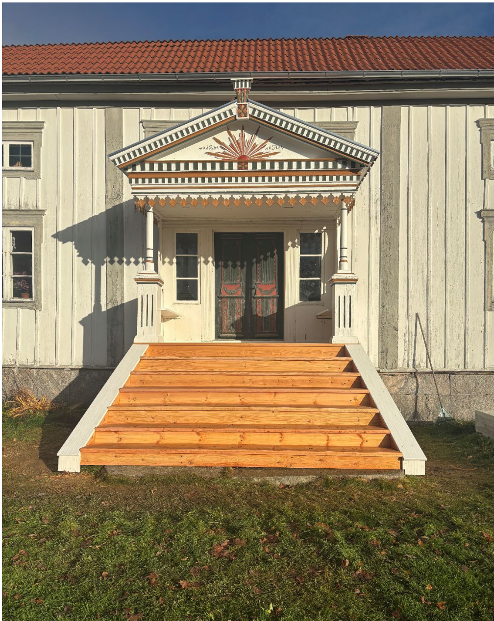
Figur 13. Den färdigrenoverade brokvisten på hälsingegården Skogens. Notera det lätt utställda trapploppet.