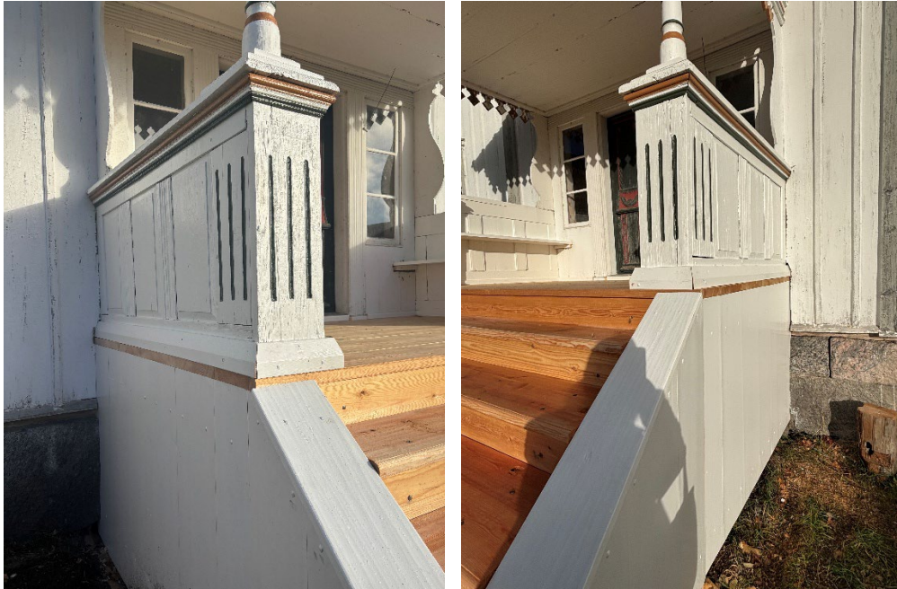
Figur 18 och figur 19. Panelen i sidorna, liksom trappans sidostycken är nytillverkade.

Panelen i sidorna består av nytt virke av kärnfura. Panelen är skrubbhyvlad. Panelen har målats på plats med linoljefärg från Engvall o. Claesson och i enlighet med deras anvisningar och i kulörer i enlighet med färgdokumentationen från 1996.