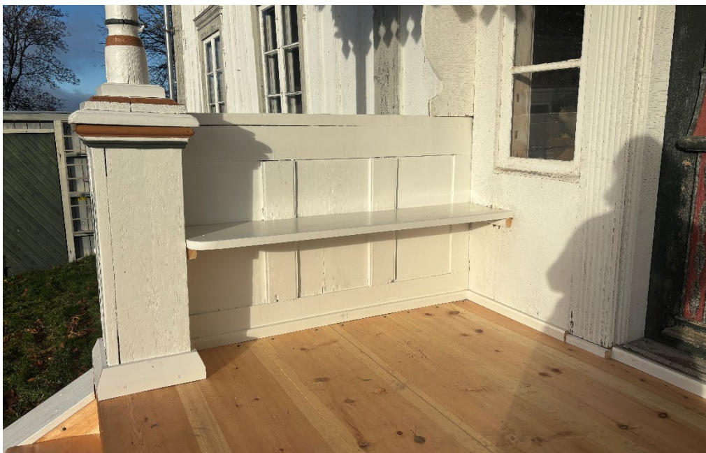
Figur 17. Nya lister har tillverkats kring socklarna liksom nya bänkskivor. Kompletteringsmålning kvarstod vid slutbesiktningen.