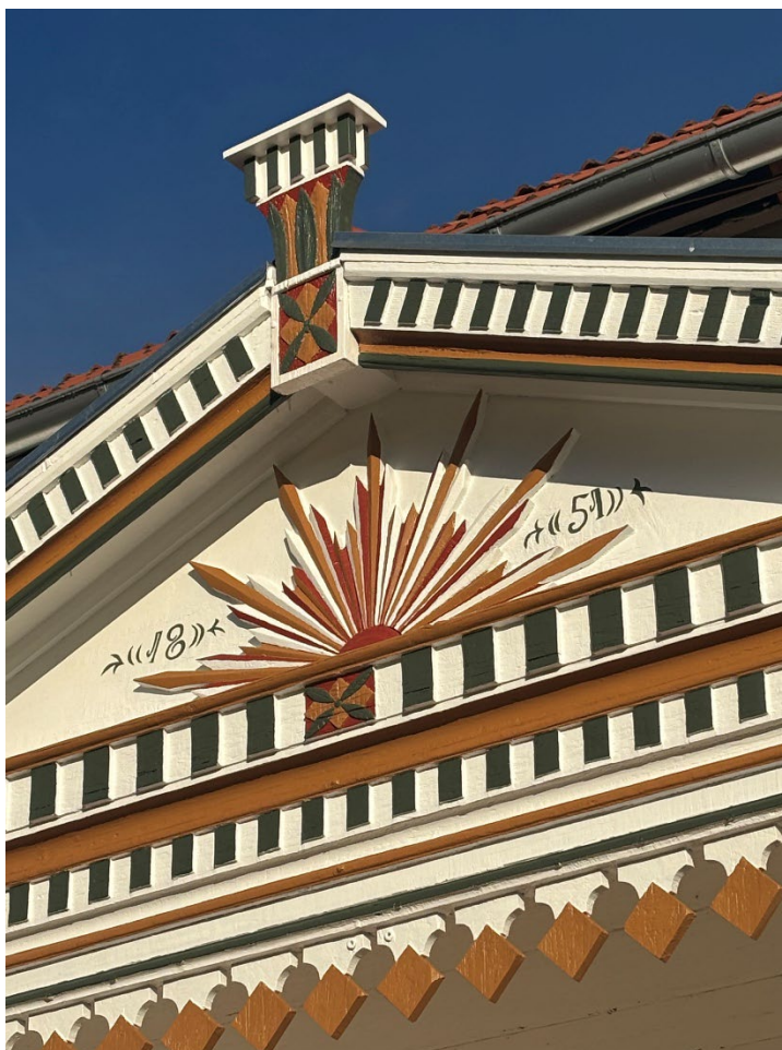
Figur 12. Närbild på det renoverade gavelstycket. Kronans översta topp är nytillverkad. Nytt virke sitter även i bakre halvan av kronans tjocklek.

Texten med årtalet mallades av innan skrapning påbörjades. Läget för en tidigare text hittades under färgskikten. Det kunde konstateras att de kulörer som gavelstycket var målat i närmast innan detta projekt inte till fullo överensstämde med de kulörer som ingår i kulördokumentationen från 1996. Bland annat saknas den röda kulören helt i kulördokumentationen. Gavelstycket har målats i likhet med hur det var målat närmast innan projektets start. Dessa kulörer är till största del samstämmiga med kulördokumentationens kulörer. Målningen har utförts med linoljefärg från Engvall o. Claesson och i enlighet med deras anvisningar. Målningen är utförd under första halvan av sommaren 2025. Takfallens tegel har återmonterats.