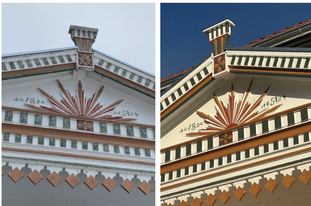
Figur 21 och figur 22. Gavelfältet före och efter reovering. Den röda kulören som finns i blommor och solstrålar finns inte upptagen i färgdokumentationen. Enligt färgdokumentationen var lapparna (rutorna längst ner) målade vita innan ommålningen 1996.

Virket i trappa och broplan är obehandlat. Martin Karlsson föreslår att ytorna kan strykas med uppvärmd linolja.