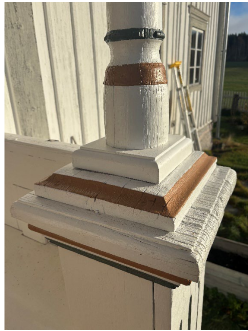
Figur 15 och figur 16. De översta brickorna under stolparna är nytillverkade.